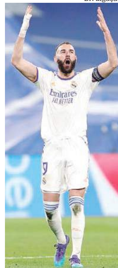
Benzema fez os três gols da vitória do Real Madrid contra o PSG

Com o resultado, o PSG ficou sem reação. Real administrou bem o resultado e por pouco não ampliou.