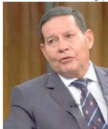
Mourão argumentou que Forças Armadas nunca se meteram em eleições