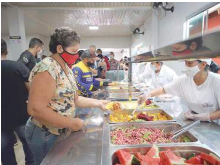
Wilson Lima já inaugurou restaurantes populares no interior

O novo restaurante popular Prato Cheio a ser inaugurado em Tefé faz parte programa social que garante refeição ao preço simbólico de R$ 1 para pessoas em situação de vulnerabilidade social. Além do município, já foram inaugurados restaurantes Prato Cheio em Manacapuru, Autazes e Itacoatiara.