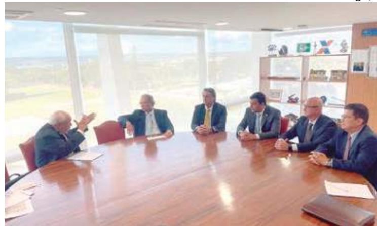
Governador participou de reunião com Bolsonaro no Palácio do Planalto

a redução (do IPI). Entendemos a boa intenção do Governo Federal nesse processo de reindustrialização e aumento da competitividade; nossa maior preocupação é com a Zona Franca de Manaus”, reforçou Wilson Lima.