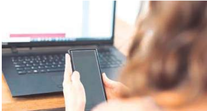
No último ano, foram registrados 119 ataques contra mulheres jornalistas

gado na terça-feira (8), traz registros de ataques públicos contra “mulheres, cis e transgênero, meios de comunicação voltados para pautas feministas e agressões com características sexistas, homofóbicas, transfóbicas ou misóginas, classificadas como “ataques de gênero” e que podem vitimar homens e mulheres (cis ou trans) e pessoas não-binárias”.