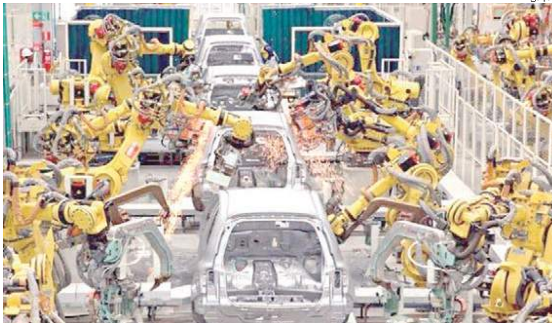
Edital irá selecionar 15 empresas do Polo Industrial de Manaus com a finalidade de adequá-las à Indústria 4.0

Tecnológica - Realização de um Estudo para avaliar o Nível de Prontidão Tecnológica da empresa. A análise será realizada por meio da metodologia PIMM 4.0;