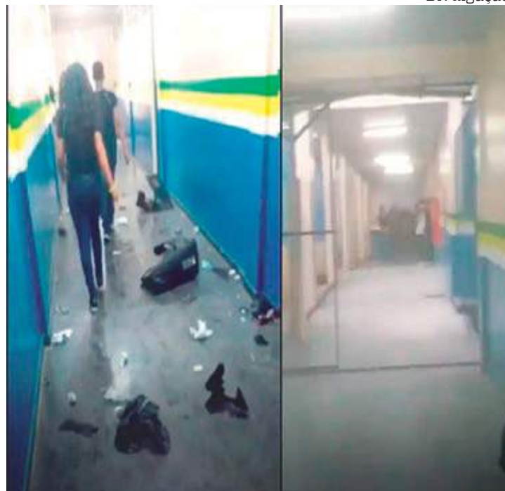
Video mostra momento em que alunos depredam escola estadual