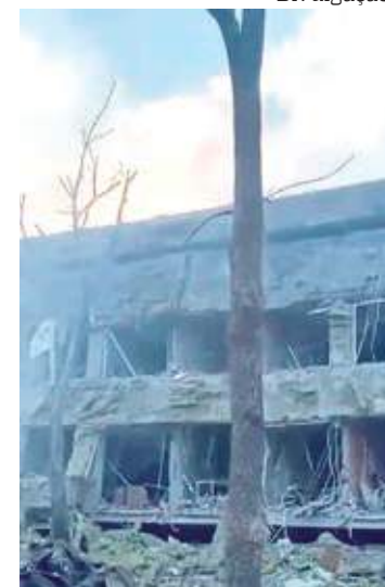
Autoridades afirmam que a Rússia lançou várias bombas

Na reunião de alto nível em Moscou, os parceiros concordaram em fortalecer sua cooperação para continuar a facilitar “assistência humanitária oportuna”. Mais de 2,2 milhões de pessoas cruzaram fronteiras internacionais fugindo da Ucrânia, disse Dujarric.