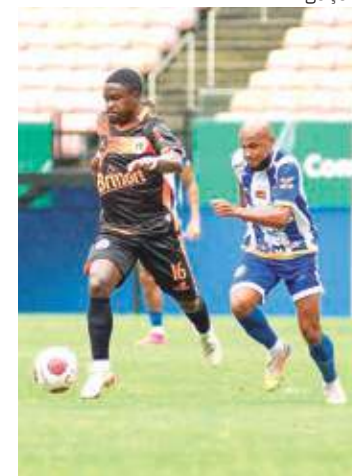
Manauara goleou o São Raimundo por 4 a 1 na Arena da Amazônia

O São Raimundo bem que tentou, mas o quarto gol do Manauara veio aos 40 minutos. Michel Potiguar recebe passe no meio, arranca livre e cruza chutado para fazer o quarto gol do time no jogo.