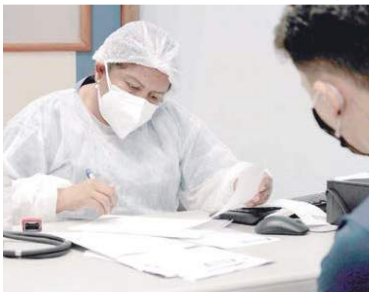
Prefeitura intensifica ações de educação em saúde dos rins

Com o tema “Saúde dos rins para todos: educando sobre a doença renal e preenchendo a lacuna de conhecimento para o melhor cuidado renal”, o trabalho de sensibilização realizado pela Secretaria Municipal de Saúde (Sems) está enfocando a importância do controle da hipertensão e do diabetes, que quando não tratados, podem comprometer a função renal, prejudicando a qualidade de vida dos usuários.