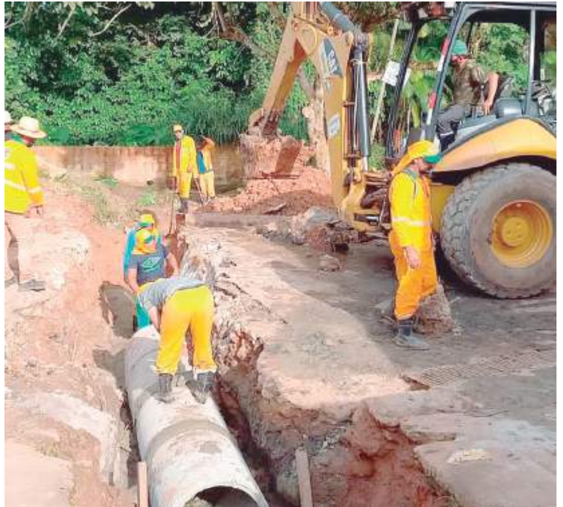
O abastecimento de água de Itacoatiara é de responsabilidade do Serviço Autônomo de água e Esgoto

Felizmente, em dezembro do ano passado, uma