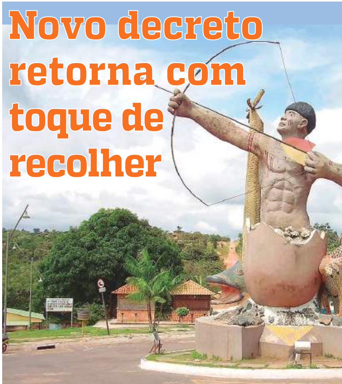
Presidente Figueiredo decreta toque de recolher e altera horário do comércio

do vedado o consumo no estabelecimento fora do horário de funcionamento, ficando permitida a abertura de áreas de parques de diversão, brinquedotecas e similares, respeitadas as normas definidas em protocolo específico.