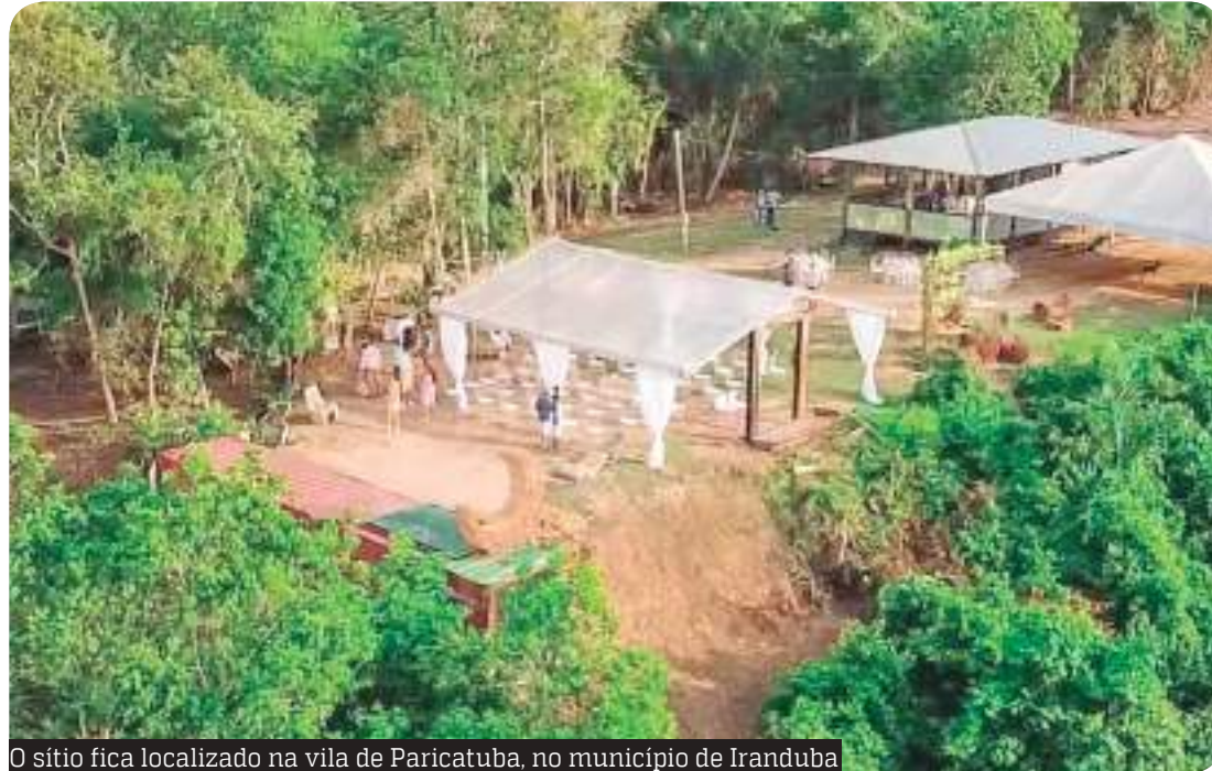
O sítio fica localizado na vila de Paricatuba, no município de Iranduba

“Tudo começou com a pandemia, no início de