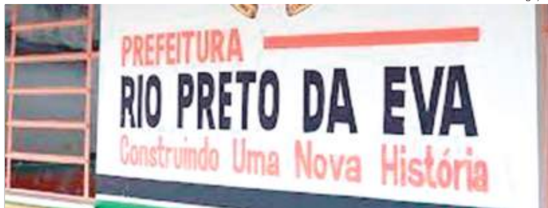
Ministério Público arquivou o processo que investigava a prefeitura por não encontrar irregularidades