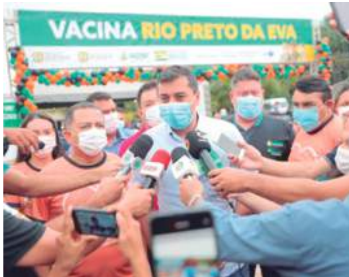
Wilson Lima destacou que investimentos melhoraram redes municipais

“Fizemos investimentos jamais vistos no interior do estado, apoiando as prefeituras na melhoria das suas redes municipais de saúde, ampliando a assistência à população. A implantação das primeiras UTIs no interior do estado, na cidade de Parintins, é um exemplo desse suporte que o Estado tem dado aos municípios, entendendo que juntos podemos avançar cada vez mais”, ressaltou o governador Wilson Lima.