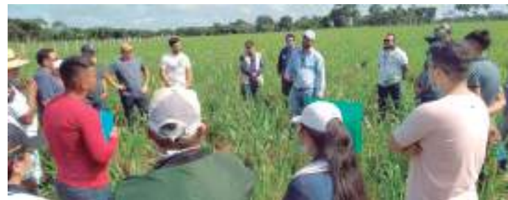
A atividade teve o objetivo de levar conhecimento prático e teórico

Segundo Omena, o evento tem como objetivo fazer com que os produtores vejam a realidade das áreas que já foram consolidadas com sucesso, servindo como exemplo e incentivo para que o planejamento continue naquela área com acompanhamento