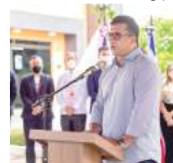
Prefeito de Manacapuru esteve na abertura do evento