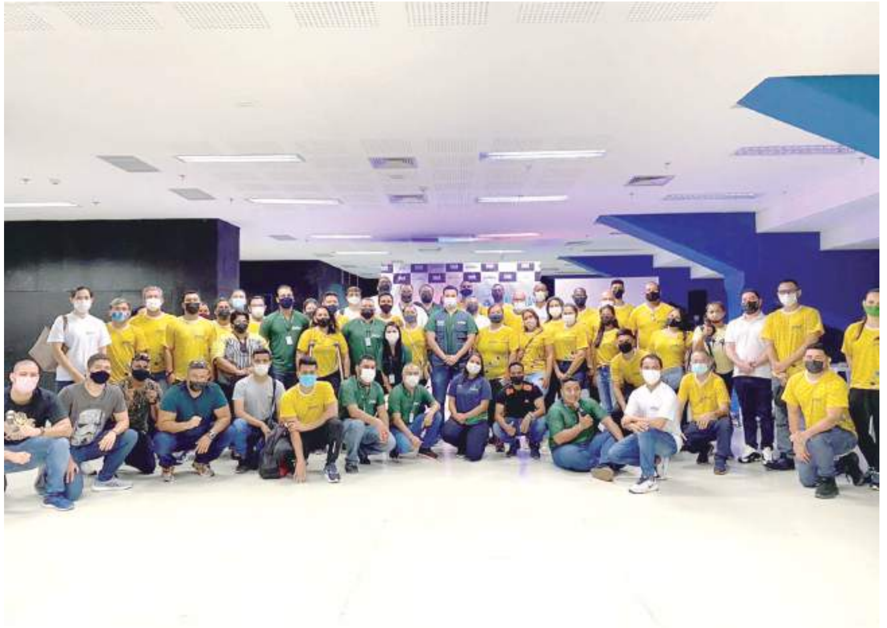
As atividades esportivas do Pelci são realizadas por meio das escolinhas

As atividades esportivas do Pelci são realizadas por meio das escolinhas esportivas oferecidas de forma gratuita pelos projetos Escolinhas nos Bairros, Mais Futebol nos Bairros e Campeões da Vila, nas seguintes modalidades: