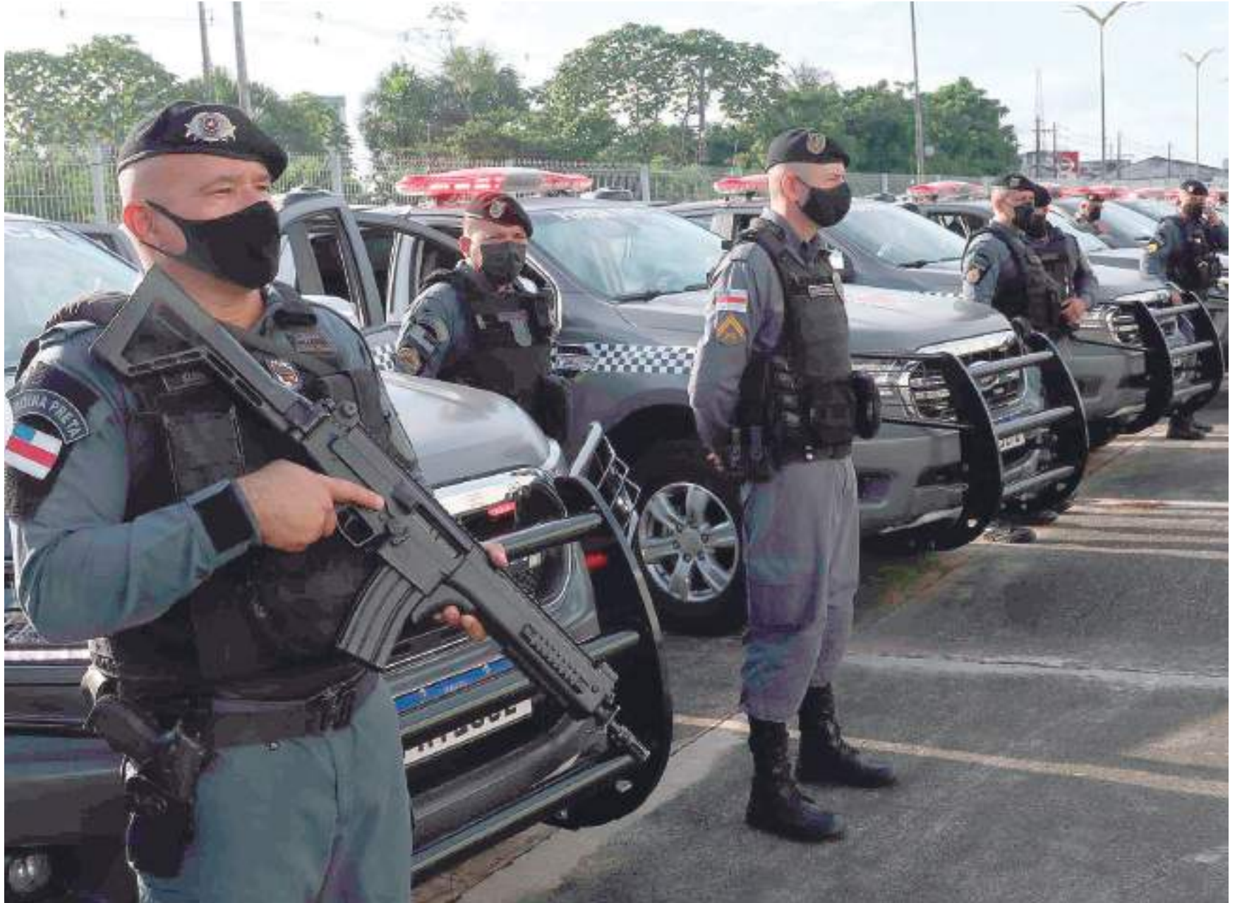
O programa elencou seis eixos no combate à criminalidade: operações, inteligência da Segurança Pública, capacitações, aquisições, infraestrutura e programas sociais

"Isso mostra o trabalho integrado que a Secretaria de Segurança Pública vem realizando no combate à criminalidade e, em consequ-