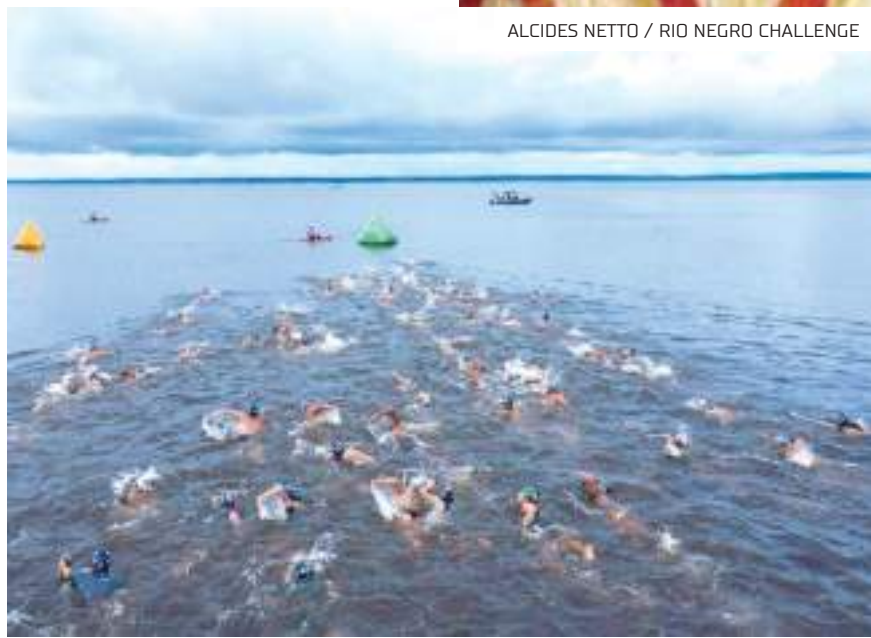
O Rio Negro Challenge é considerado o maior desafio em águas abertas

o Rio Negro Challenge Experience, uma maneira de você unir tradição, natureza, esporte e turismo. A prova vai ser na comunidade indígena dos tatuyos. Então, além de todo o contato com a natureza, os atletas terão a oportunidade de conhecer a cultura indígena, a tradição desse povo que é tão rica", observou o organizador.