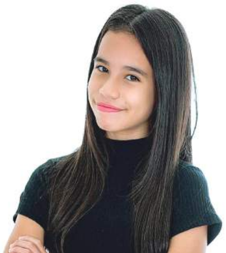
A pequena é autora de "Finanças para crianças- Além da Mesada"