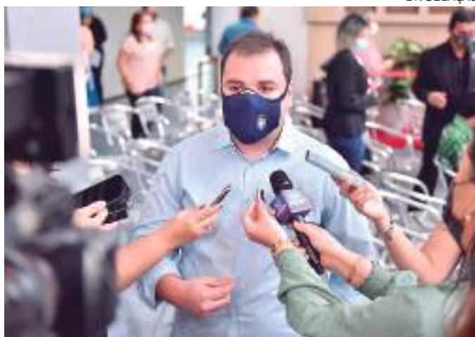
Tropas específicas atuarão nas estradas e ramais

A Lei nº 5.735/2021 autoriza o governo estadual a criar políticas públicas e estabe-