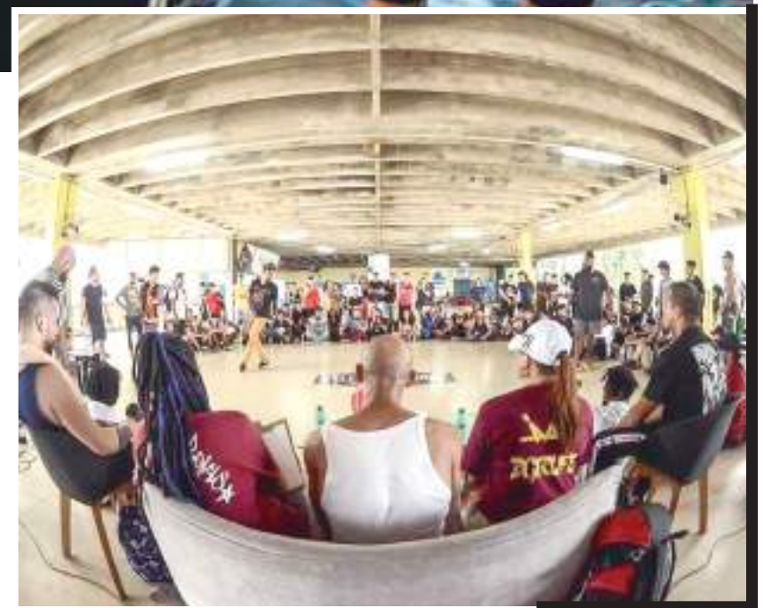
O grupo fará ações socioeducativas em escolas locais

Os organizadores do evento revelaram o motivo da escolha da capital amazonense e destacaram a falta de atenção que o Norte e Nordeste do Brasil recebe na modalidade.