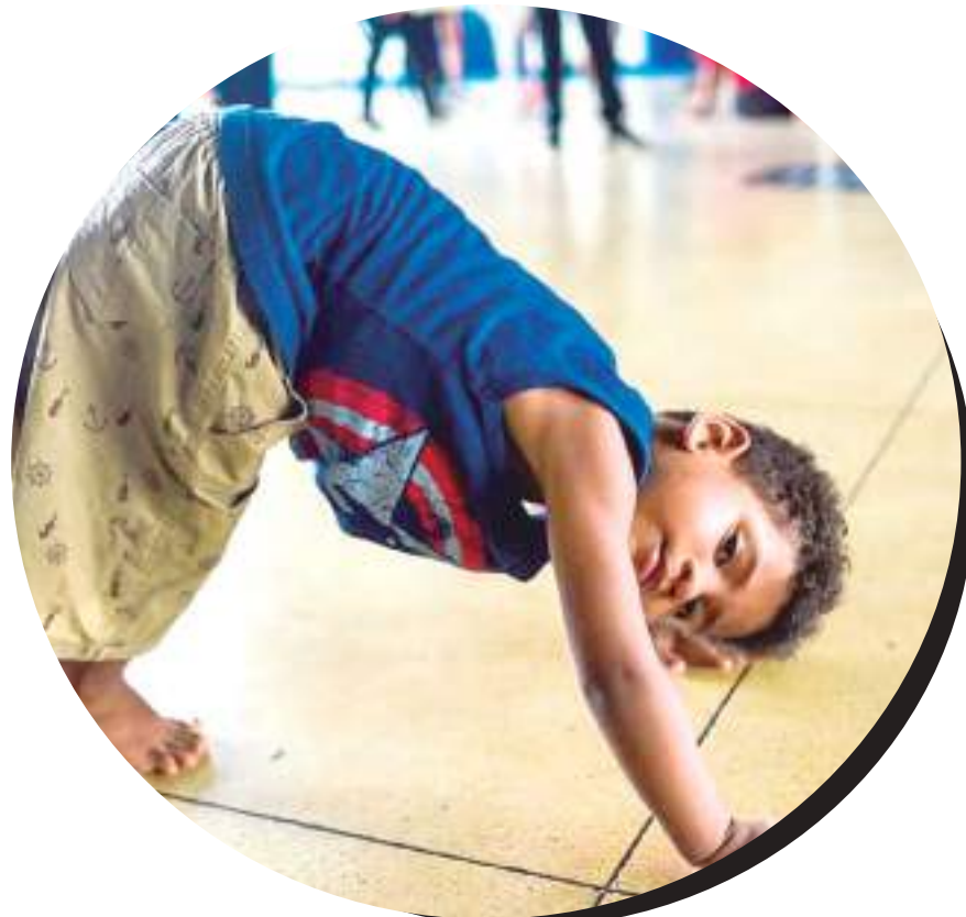
O evento acontecerá no Centro de Convivência da Família Pedro Padre Vignola

O Amazonas receberá o Tropical Battle nos dias 15 a 20 de março. A edição inédita em território Amazonense terá foco na difusão e promoção das manifestações culturais, por meio do hip hop.