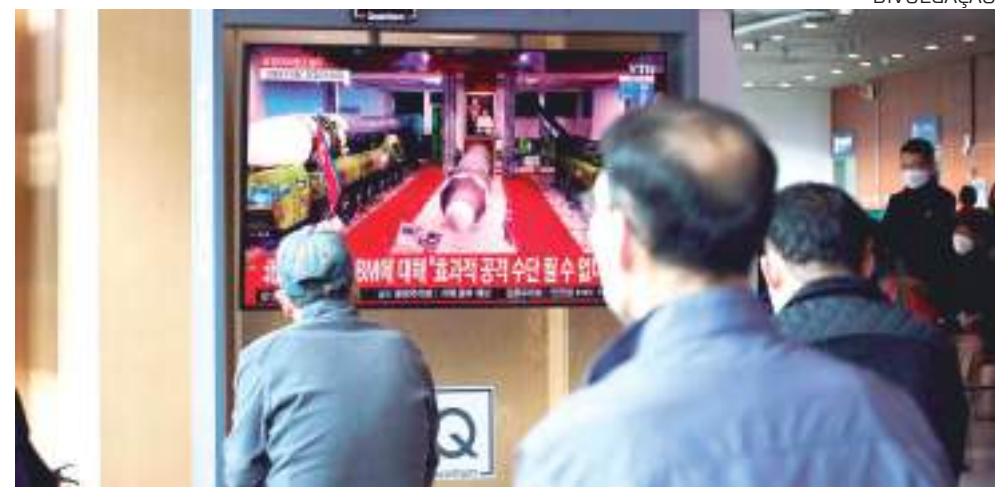
Pessoas assistem a um noticiário sobre o novo teste de armas

A Coreia do Norte realizou o que, de acordo com as autoridades sul-coreanas, foi o nono teste envolvendo projéteis apenas em 2022, no momento em que as negociações entre os dois lados do Paralelo 38 estão estagnadas, e a poucos dias da Coreia do Sul escolher seu novo presidente.