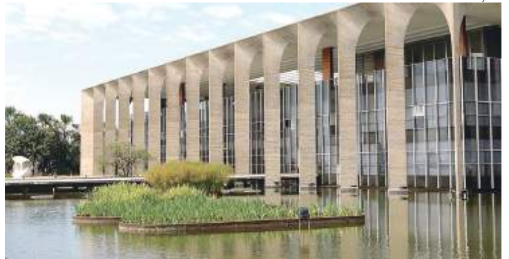
Brasil manterá posto consular avançado em Lviv, oeste da Ucrânia

O Palácio do Itamaraty anunciou na última sexta-feira (4), em Brasília, por meio de nota, que a embaixada do Brasil em Kiev, capital da Ucrânia, será comandada a partir de Chisinau, capital da Moldávia, país vizinho ao sul. A mudança ocorre, segundo o Ministério das Relações Exteriores (MRE), após a deterioração das condições de segurança em solo ucraniano, conforme avançam as tropas da Rússia pelo país.