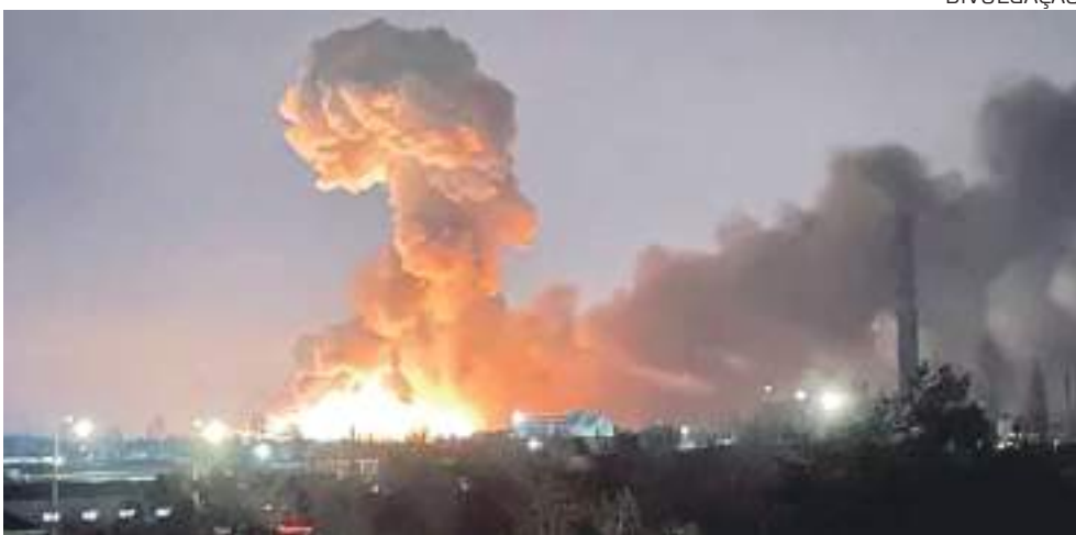
Grupo também condenou ataque russo a civis ucranianos

Os ministros das Relações Exteriores do G7 (grupo composto por Alemanha, Canadá, Estados Unidos, França, Itália, Japão e Reino Unido) disseram na última sexta-feira (4) que estão "profundamente preocupados" com o impacto humanitário dos "ataques contínuos da Rússia" contra a população civil da Ucrânia e acrescentaram que vão responsabilizar os culpados por crimes de guerra.