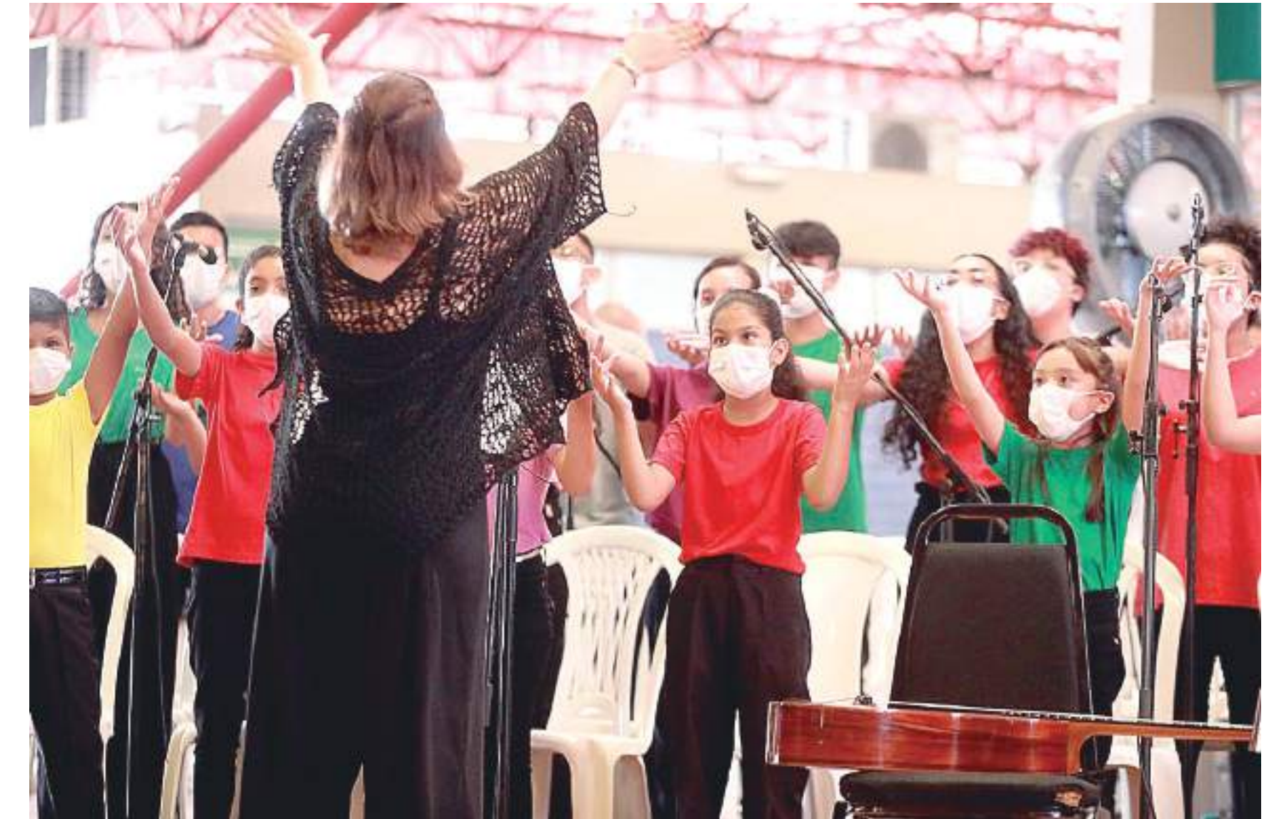
As 6,5 mil novas vagas estão distribuídas, em Manaus, Parintins e Envira

criação de mais 20 salas de cultura, a serem instaladas em municípios estratégicos, levando em consideração a potencialidade de cada local.