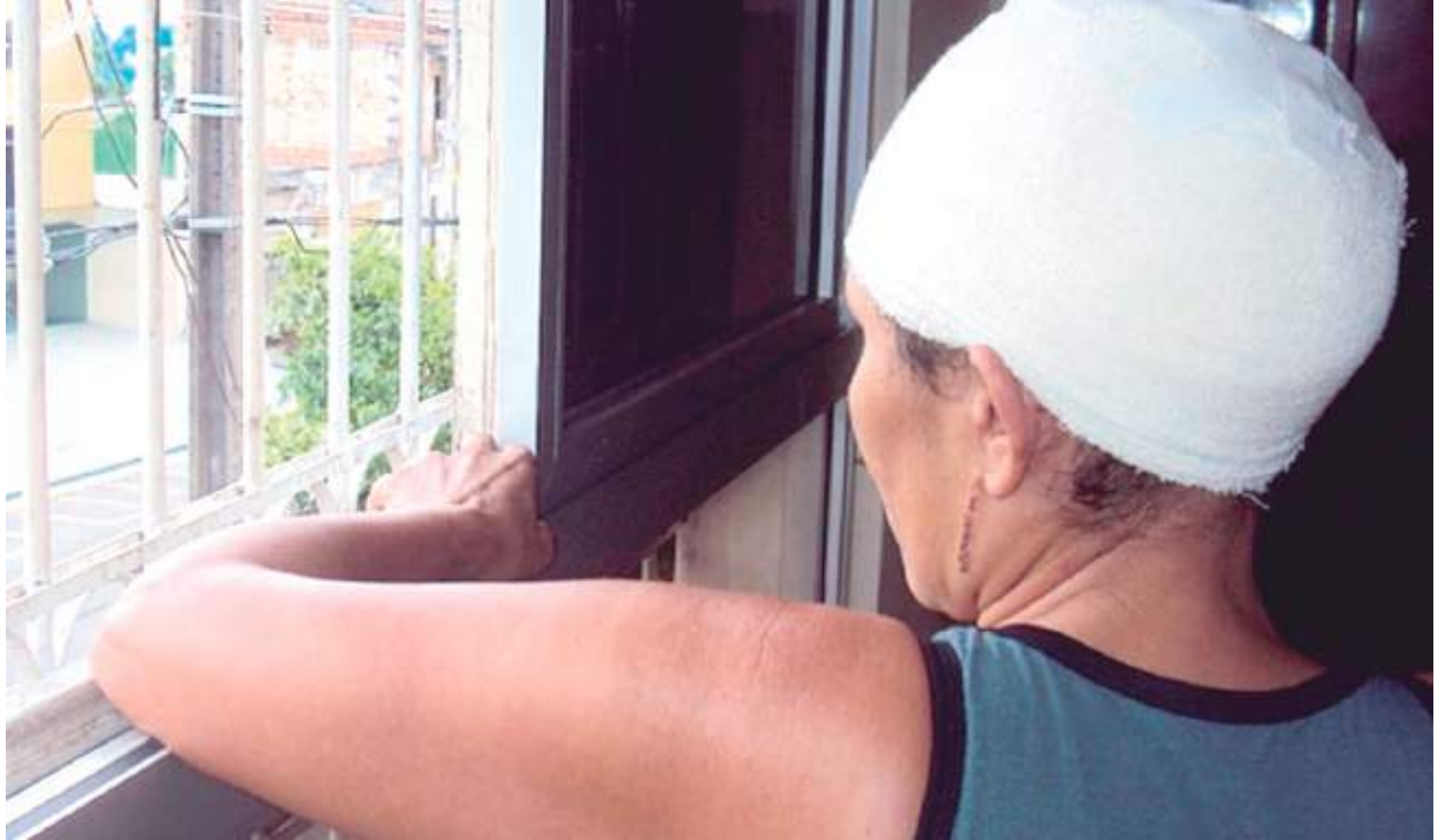
As consequências que as vítimas de escalpelamento sofrem são inúmeras, desde dores físicas e crônicas na cabeça ou nas cervicais, como também dificuldades na fala

Já na Região Norte, os estados que mais possuem ocorrências de casos de escalpelamento são o Amapá e o Pará. De 2007 a 2017, a Associação