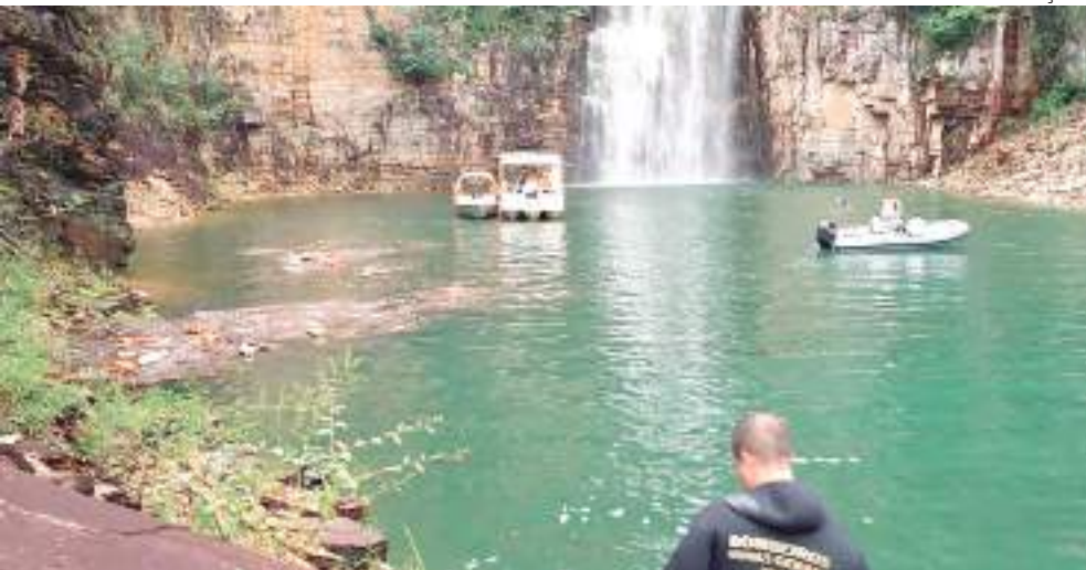
Dez pessoas morreram na tragédia em janeiro

A Polícia Civil de Minas Gerais concluiu o inquérito sobre a tragédia em Capitólio (MG) e anunciou na última sexta-feira (4) que não haverá indiciamentos. Estudos técnicos apontaram que a queda do bloco de rocha no lago de Furnas se deu como desdobramento de eventos naturais, sem influência da ação humana.