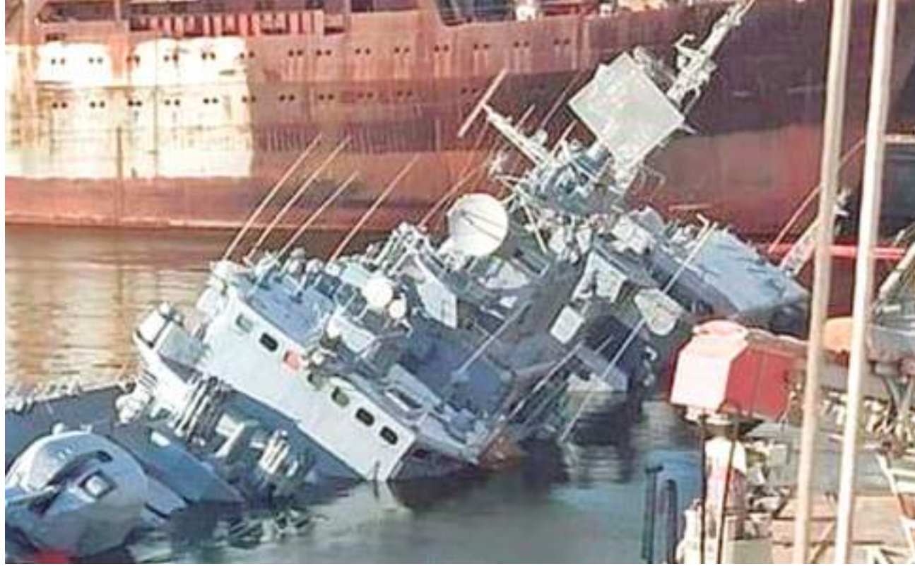
O principal navio de guerra da Ucrânia foi afundado no Mar Negro