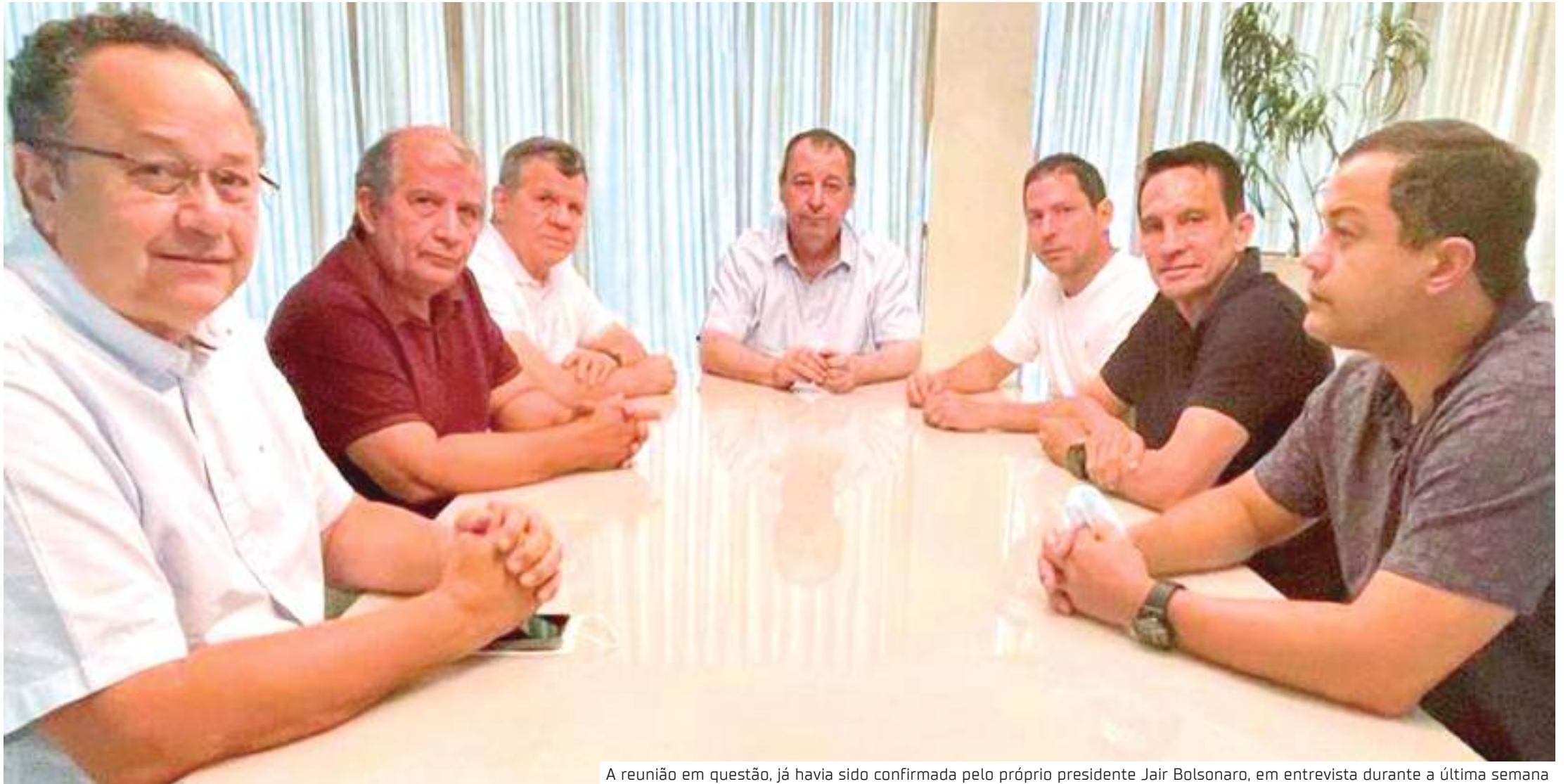
A reunião em questão, já havia sido confirmada pelo próprio presidente Jair Bolsonaro, em entrevista durante a última semana