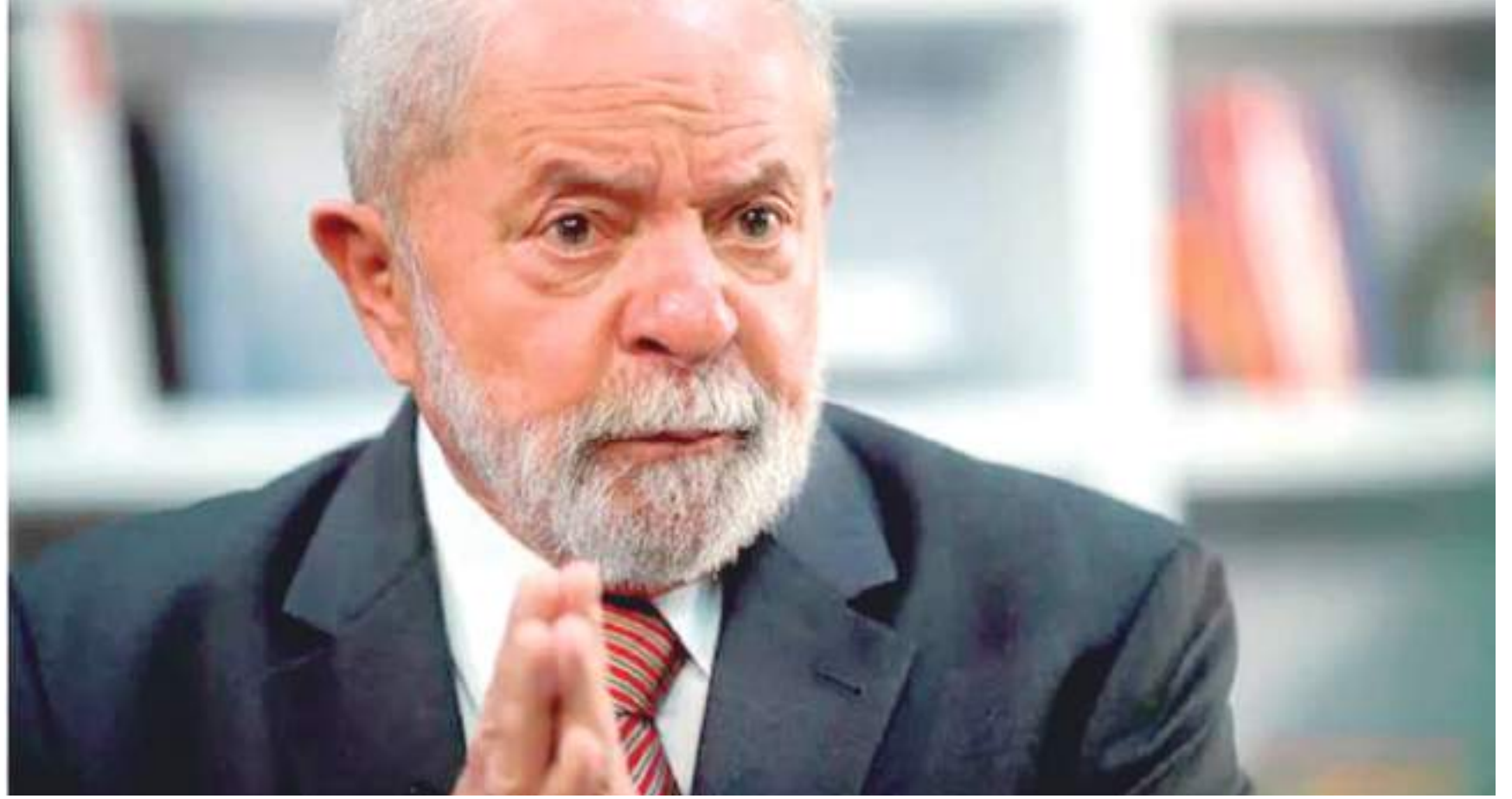
O tema dos fertilizantes no Brasil voltou a dividir opiniões entre grupos políticos pela iminente crise no setor envolvendo a guerra entre Rússia e Ucrânia

Agora, diante do conflito no Leste Europeu, as importações ficaram comprometidas, num ambiente em que o Brasil não é autossuficiente e que impacta diretamente no preço dos alimentos.