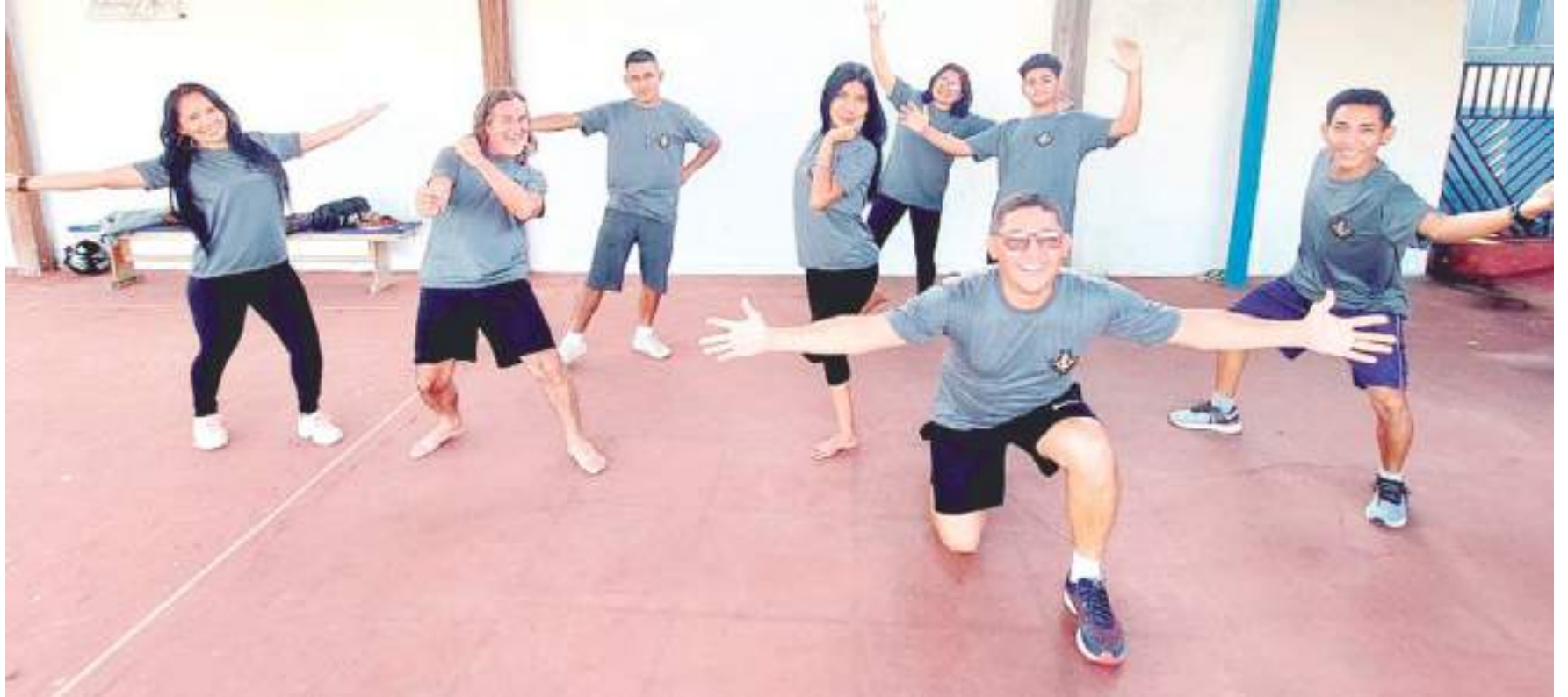
A montagem de Baraúna e Ismael estimula a integração entre plateia e atores em um jogo cômico

"Queremos incentivar a criação de outros grupos e, futuramente,