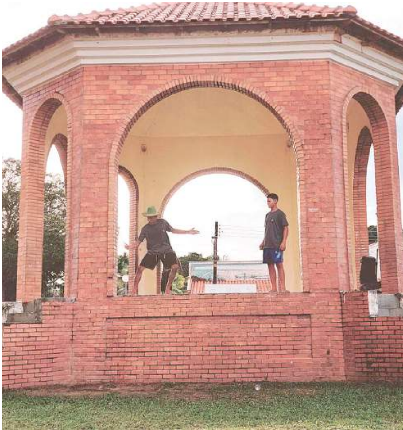
O espetáculo inicia com um cortejo chamando o público para brincar