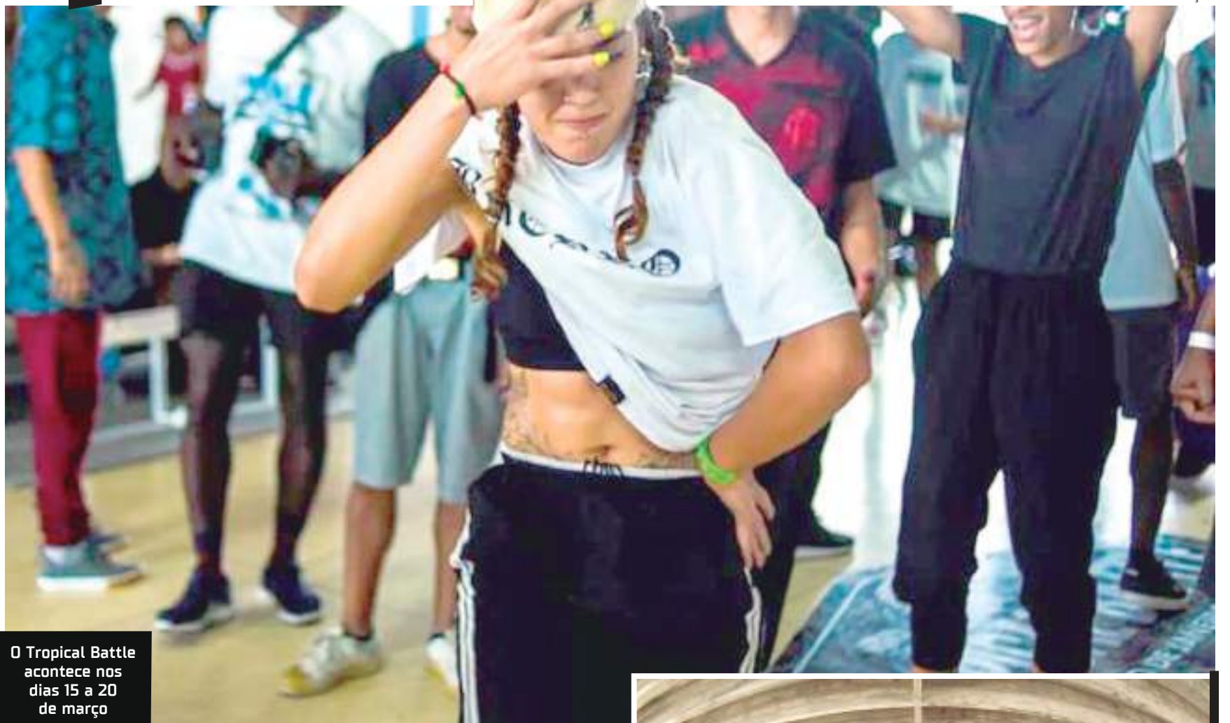
O Tropical Battle acontece nos dias 15 a 20 de março

A comunidade Cantagalo, do Rio De Janeiro, foi um dos primeiros lugares que receberam o projeto. A