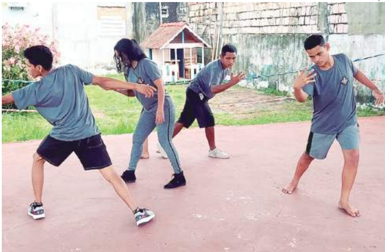
O espetáculo O Mala da Arte é de classificação livre

a criação de um Festival de Teatro Parintinense. A semente foi plantada", revelam.