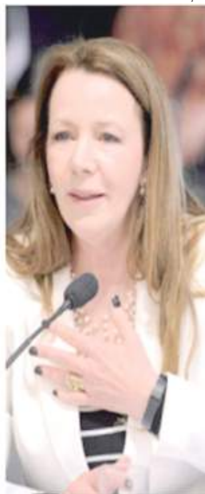
Deputadas, vereadoras e políticas atualmente sem cargo comentaram suas aspirações para as eleições de 2022