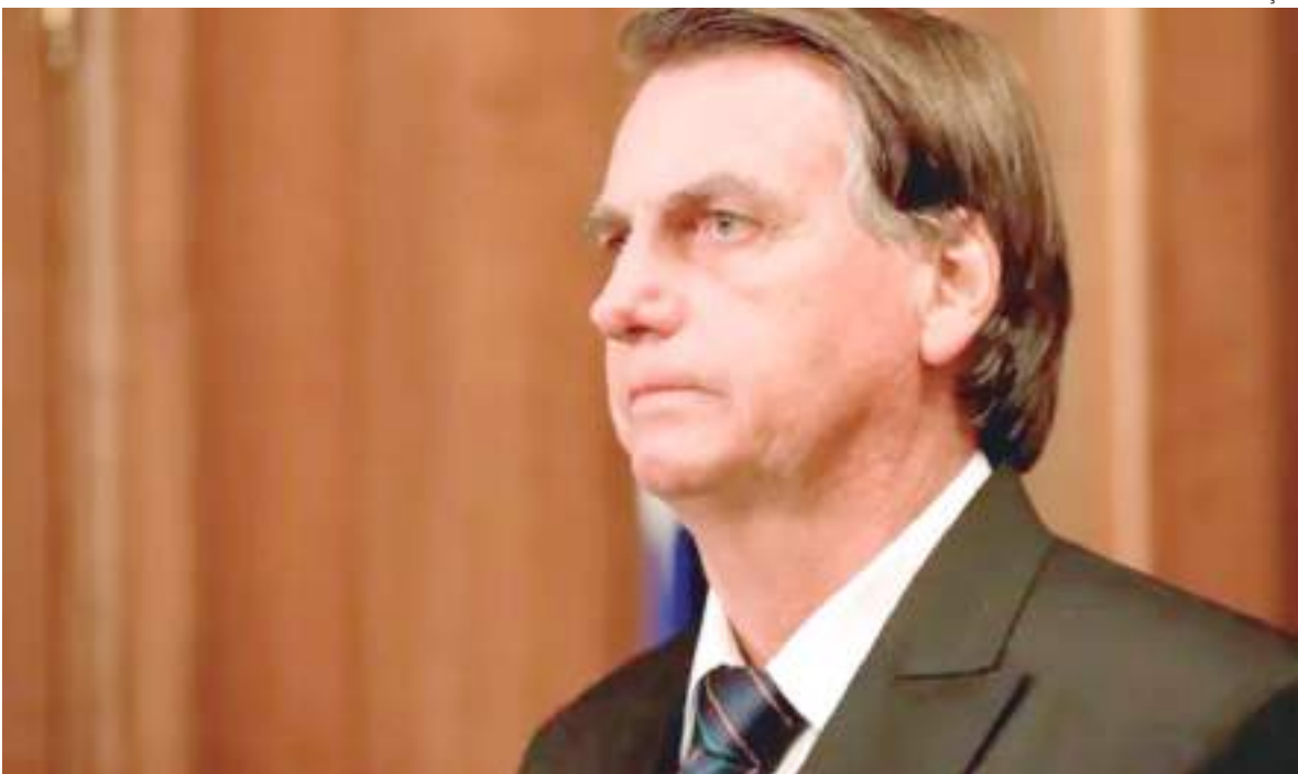
Bolsonaro disse em entrevista que "O Brasil não mergulhará em aventuras"

O presidente Jair Bolsonaro (PL) disse, sem mencionar nomes de países, que o Brasil não "mergulhará em uma aventura", em relação ao conflito diplomático envolvendo Rússia e Ucrânia. A declaração veio durante cerimônia alusiva ao início do novo contrato das rodovias Presidente Dutra e Rio-Santos, em São José dos Campos (SP).