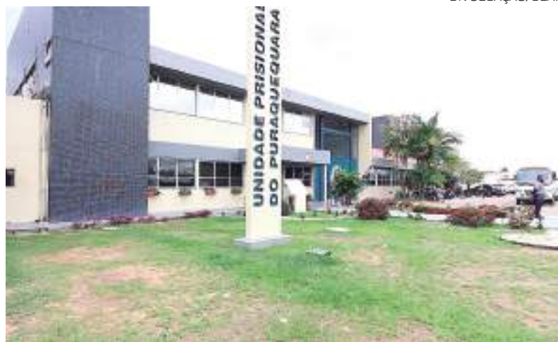
Com a tentativa de rebelião em 2020, a unidade ficou quase depredada

Entre os espaços entregues, está a nova Unidade Básica de Saúde (UBS) da UPP, que conta com mais salas para consultas médicas, atendimentos de enfermagem, vacinações, coletas de sangue e três leitos disponíveis, atendendo todos os critérios de saúde exigidos e, ainda, encontra-se em um local estratégico de segurança,