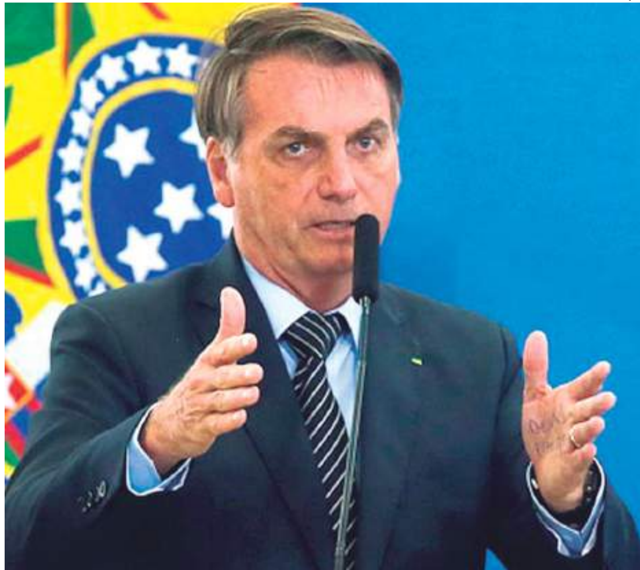
Bolsonaro cobra redução do preço do combustível após queda no preço do petróleo

Mais cedo, em entrevista à TV Ponta Negra, do Rio Grande do Norte,