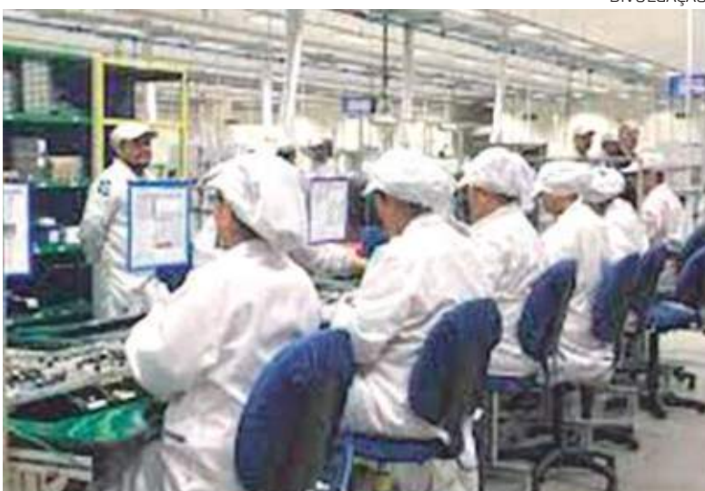
O Amazonas teve a maior queda entre os locais pesquisados

Amazonas teve a maior queda em janeiro (-13,0%), na comparação com dezembro, entre os lugares pesquisados. Na comparação com janeiro do ano passado, houve queda de 4,1% na produção industrial do Estado. Já no percentual acumulado dos últimos 12 meses, a indústria amazonense apresenta crescimento de 7,1%. As informações são do IBGE.