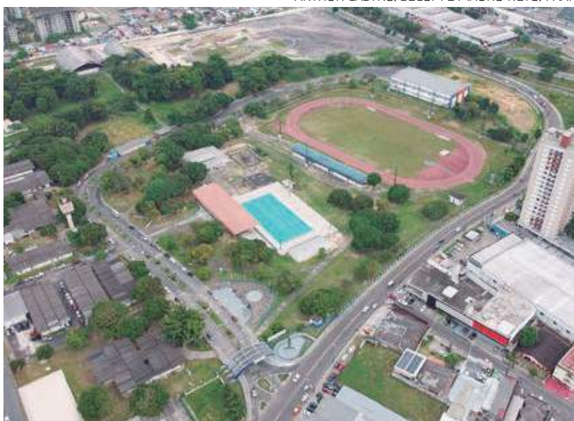
O pacote inclui a revitalização da iluminação dos estádios

O governador Wilson Lima anunciou, nesta segunda-feira (14), o lançamento para os exercícios de obras na capital e no interior, que somam mais de R$ 1,1 bilhão de investimentos.