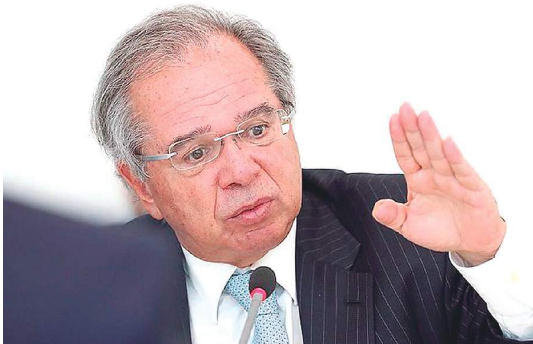
A equipe econômica avalia repassar o custo da alta do petróleo no mercado internacional para a estatal ou criar novo programa de subsídios.

O governo federal estuda uma forma de segurar os preços dos combustíveis. A equipe econômica avalia repassar o custo da alta do petróleo no mercado internacional para a estatal ou criar novo programa de subsídios.