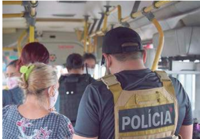
Em fevereiro de 2022, Ciesp registrou 92 casos de roubos a ônibus

O governador Wilson Lima determinou ações para reduzir a criminalidade no estado e, de acor-