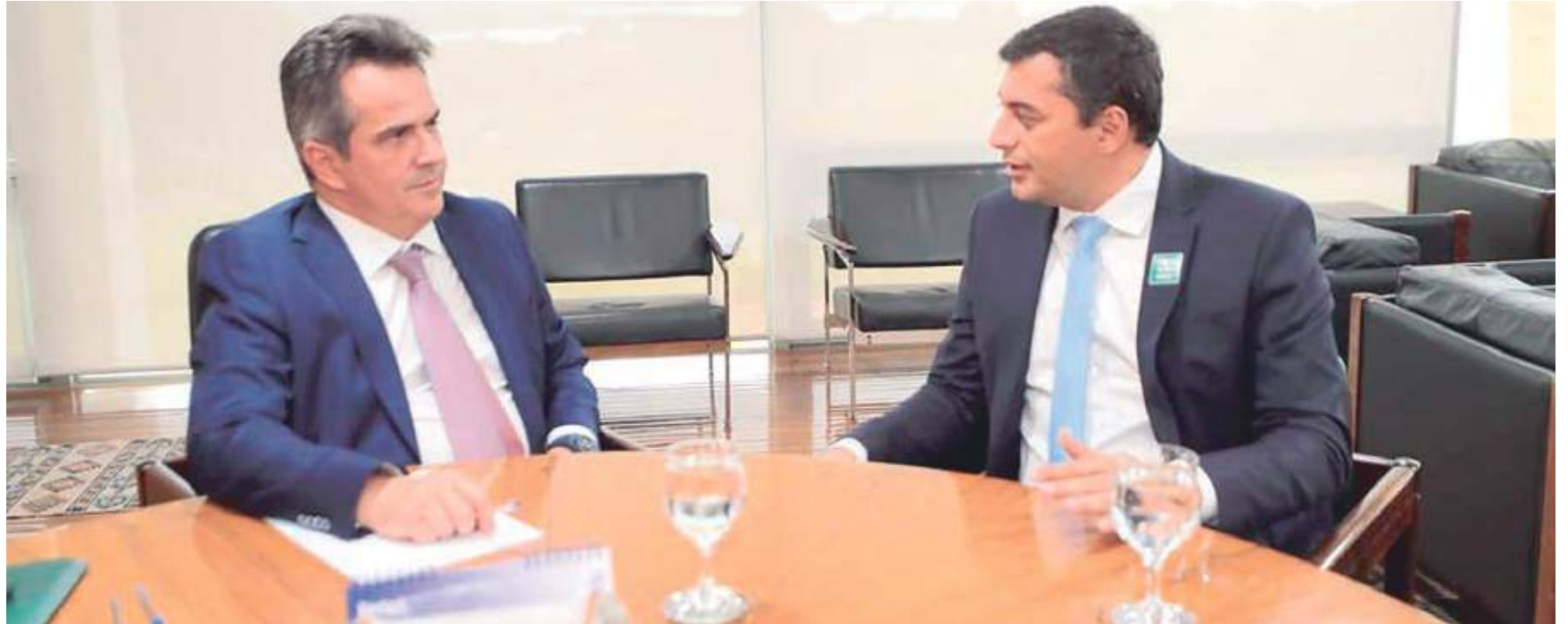
Governador Wilson Lima em encontro com o ministro chefe da Casa Civil Ciro Nogueira para tratar sobre ZFM

O governador Wilson Lima se reuniu ontem em Brasília, com o ministro chefe da Casa Civil, Ciro Nogueira, para tratar sobre mudanças no Decreto Federal 10.979/2022, que reduziu o Imposto sobre Produtos Industrializados (IPI) em 25% em todo o país. No último dia 9, o governador recebeu do presidente Jair Bolsonaro e do ministro da Economia, Paulo Guedes, a garantia de que o decreto será reeditado. A mudança no decreto visa manter a competitividade da Zona Franca de Manaus (ZFM), conforme proposta do Governo do Estado apresentada ao Ministério da Economia para revogar a redução do IPI para produtos com Processo Produtivo Básico (PPB) aprovados que não sejam fabricados no Polo Industrial de Manaus (PIM). Dessa forma, fica mantida a vantagem comparativa do incentivo do imposto já existente na ZFM. "Tive mais uma reunião com o ministro Ciro Nogueira em que coloquei a necessidade e a ur-