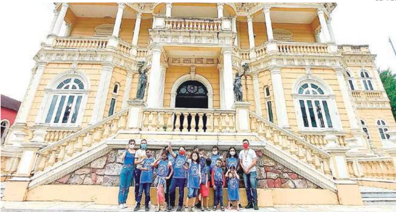
A ação tem a participação do Núcleo de Assistência à Criança e Família em Situação de Risco (Nacer), por meio do Projeto Girassol.

Trabalhando com crianças em situação de violação de direitos, a atividade "Menino não é de Rua" está sendo promovida pela Prefeitura de Manaus, por meio da Secretaria Municipal da