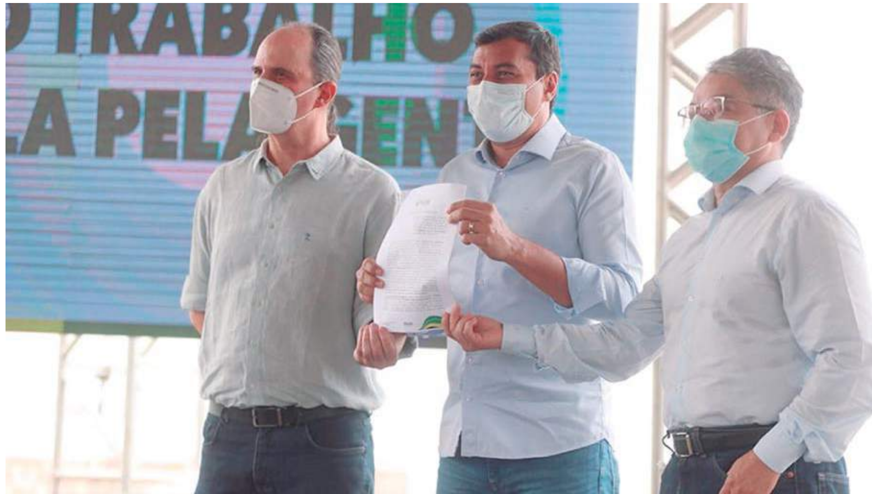
Por meio de Acordo de Cooperação Técnica (ACT) com o Ipaam, o barco será cedido à Universidade do Estado do Amazonas (UEA)