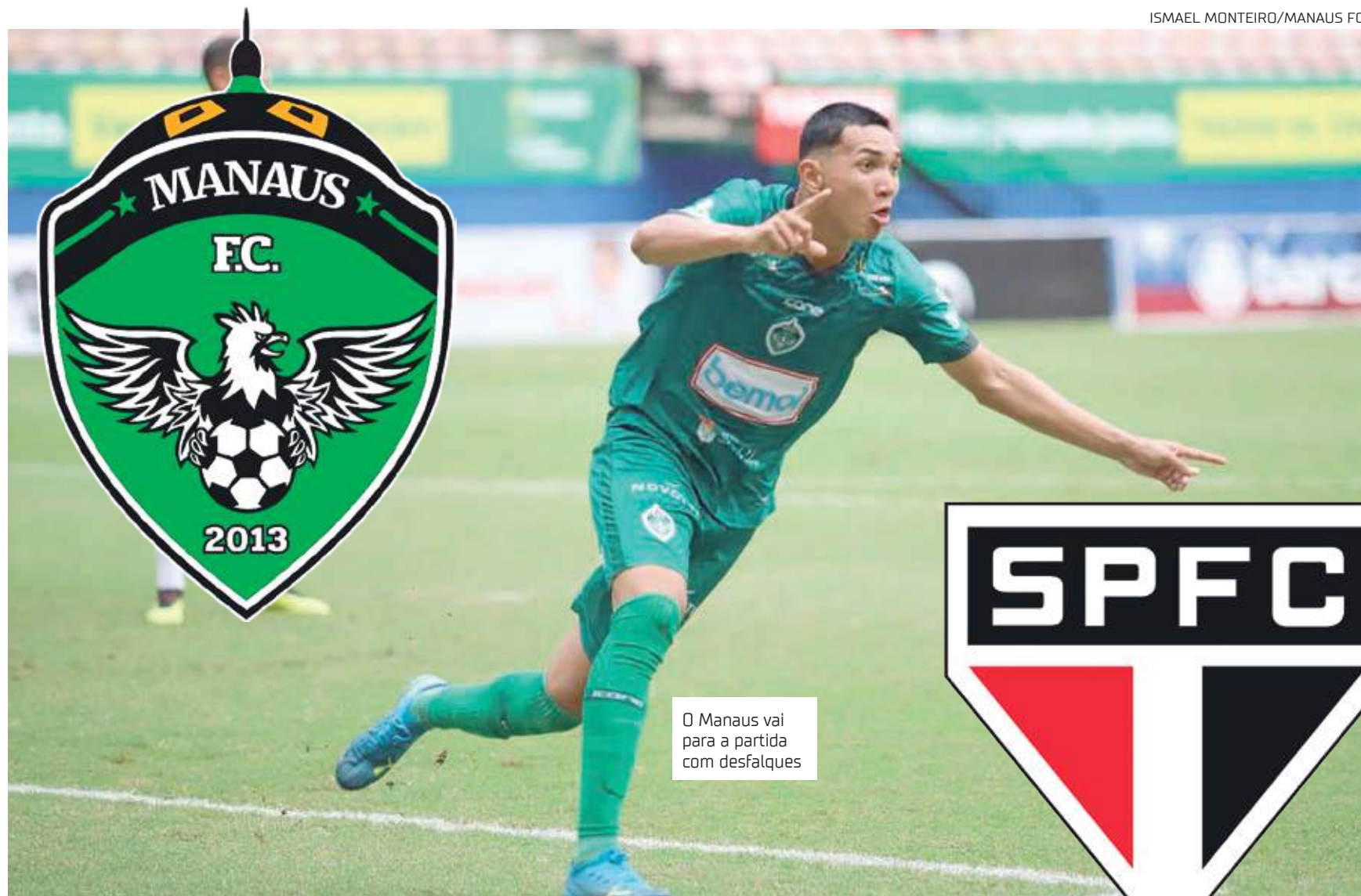
O Manaus vai para a partida com desfalques

Em caso de empate, a decisão será nos pênaltis