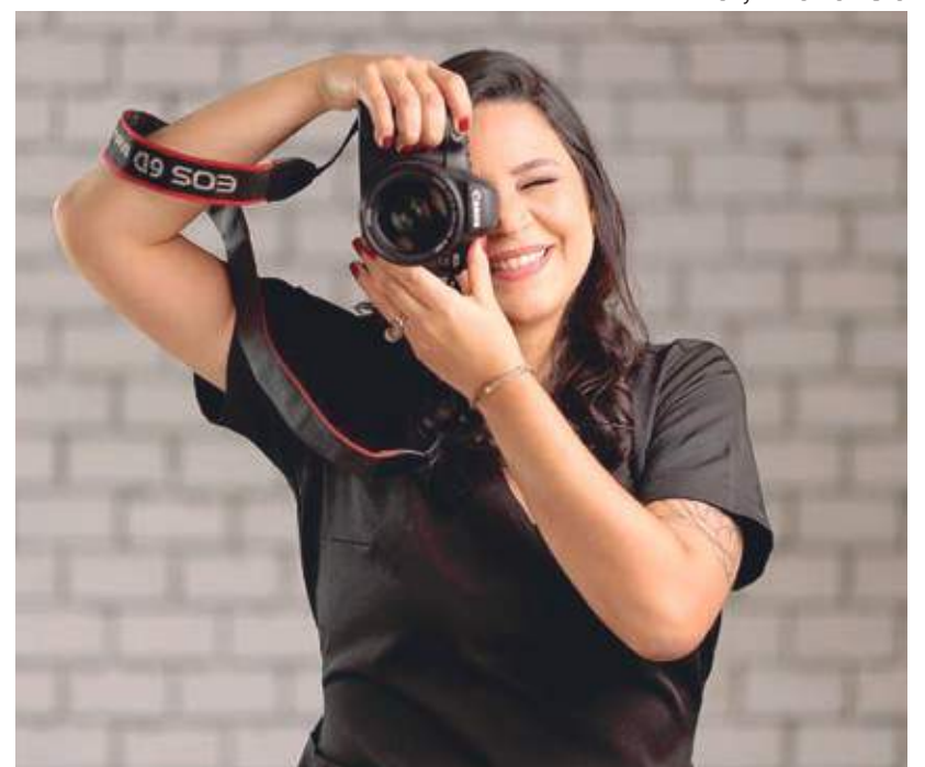
Anne Lucy foi a única fotógrafa do Norte do País a receber menções honrosas no evento