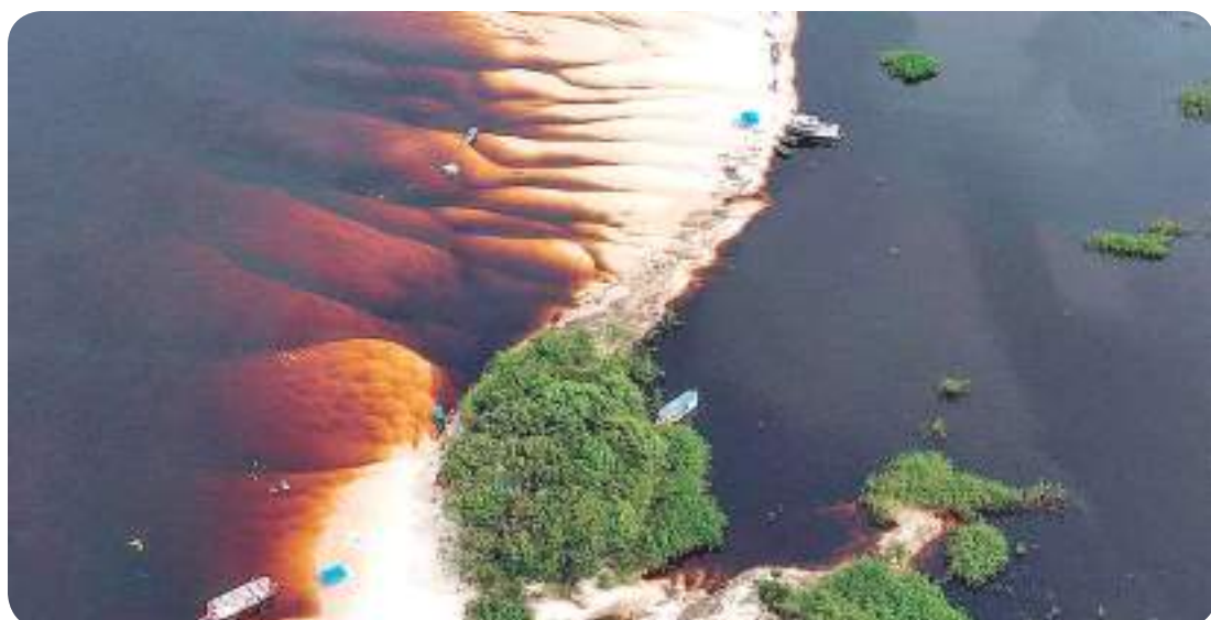
Praia Do Camaleão