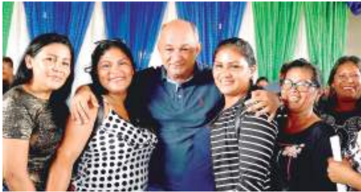
Prefeito Frederico Paes anunciou a concessão de reajuste salarial

No início desta semana, o prefeito Frederico Paes Júnior (PSC) anunciou a concessão de reajuste salarial, de 33,43%, aos professores da rede municipal. O reajuste teve como base o aumento do piso salarial, dos docentes, determinado pelo Ministério da Educação, por meio de portaria do presidente Jair Bolsonaro, em janeiro.