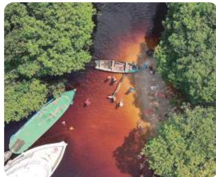
Praia do Sarará