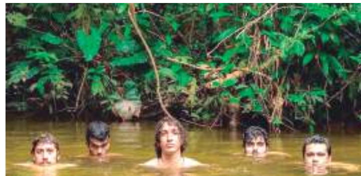
“No Paiz das Amazonas” vai ser lançado ainda em 2022

Para o single, a banda contou com a participação do