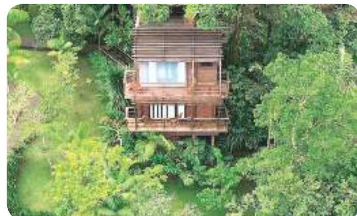
Mirante do Gavião