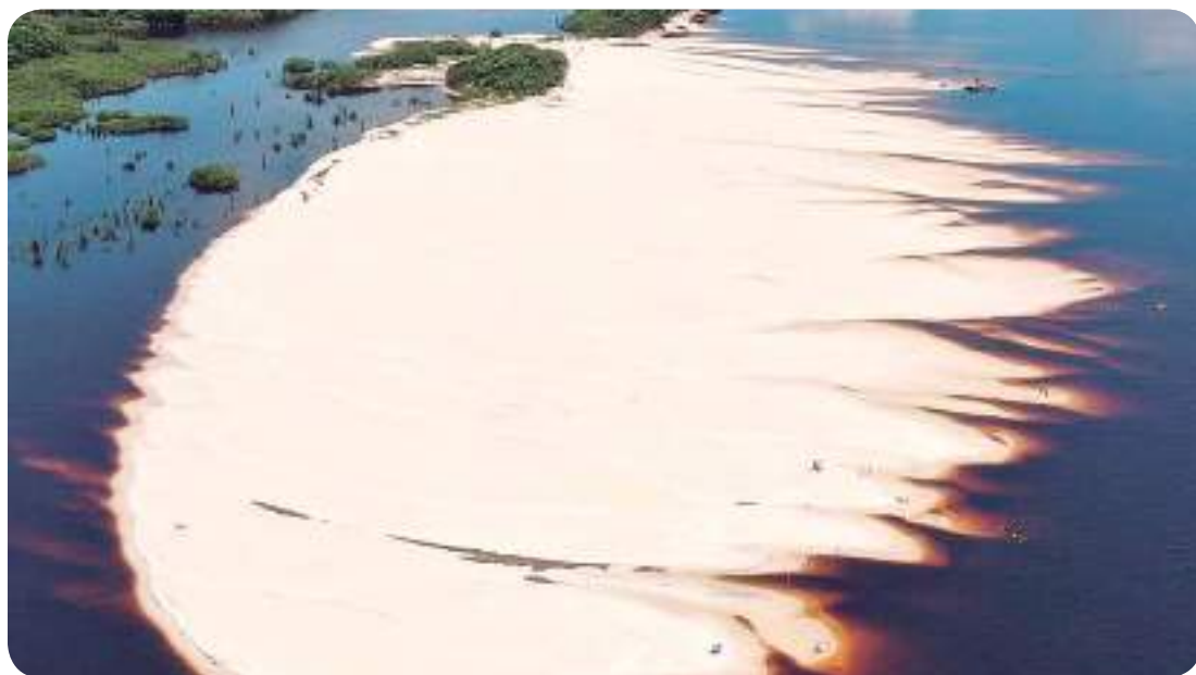
Praia Do Camaleão

Novo Airão é um paraíso ecológico no Amazonas. Uma cidade rica em ecoturismo, com lindas praias, além do maior arquipélago do mundo com as Ilhas de Anavilhanas e o belo Parque Nacional do Jaú. Confira as belezas do município nas lentes do fotógrafo Diego Peres (diego-peres0001).