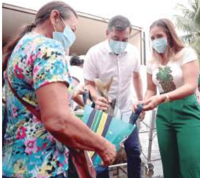
Município recebeu a primeira edição de 2022 do programa Peixe no Prato

O projeto visa fomentar o desenvolvimento de metodologias ativas de aprendizagem em ambientes multi-instrucionais em escolas