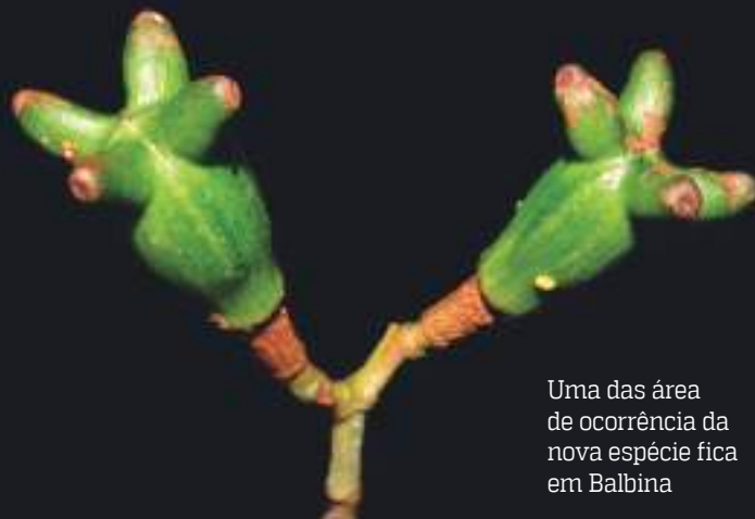
Uma das áreas de ocorrência da nova espécie fica em Balbina

A constatação de que existem 6.727 espécies de árvores nativas da Amazônia representa uma redução fenomenal frente às estimativas recentes baseadas em extrapolação estatística, segundo as quais se julgava que a Amazônia contaria com até 16.200 espécies de árvores.