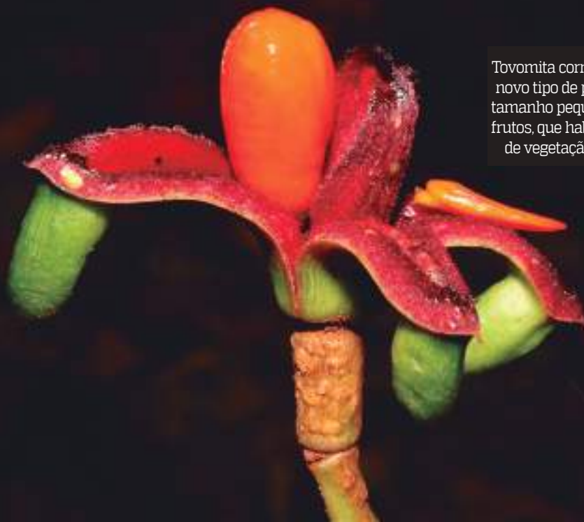
Tovomita cornuta é um novo tipo de planta, de tamanho pequeno, com frutos, que habita locais de vegetação densa

Um estudo liderado por brasileiros em 2017 demonstrou que a diversidade de plantas