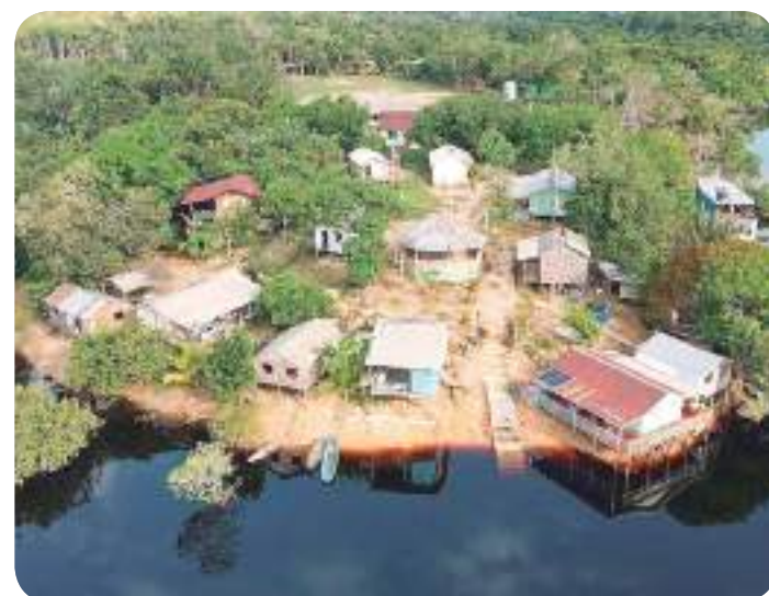
Comunidade Santo Antônio