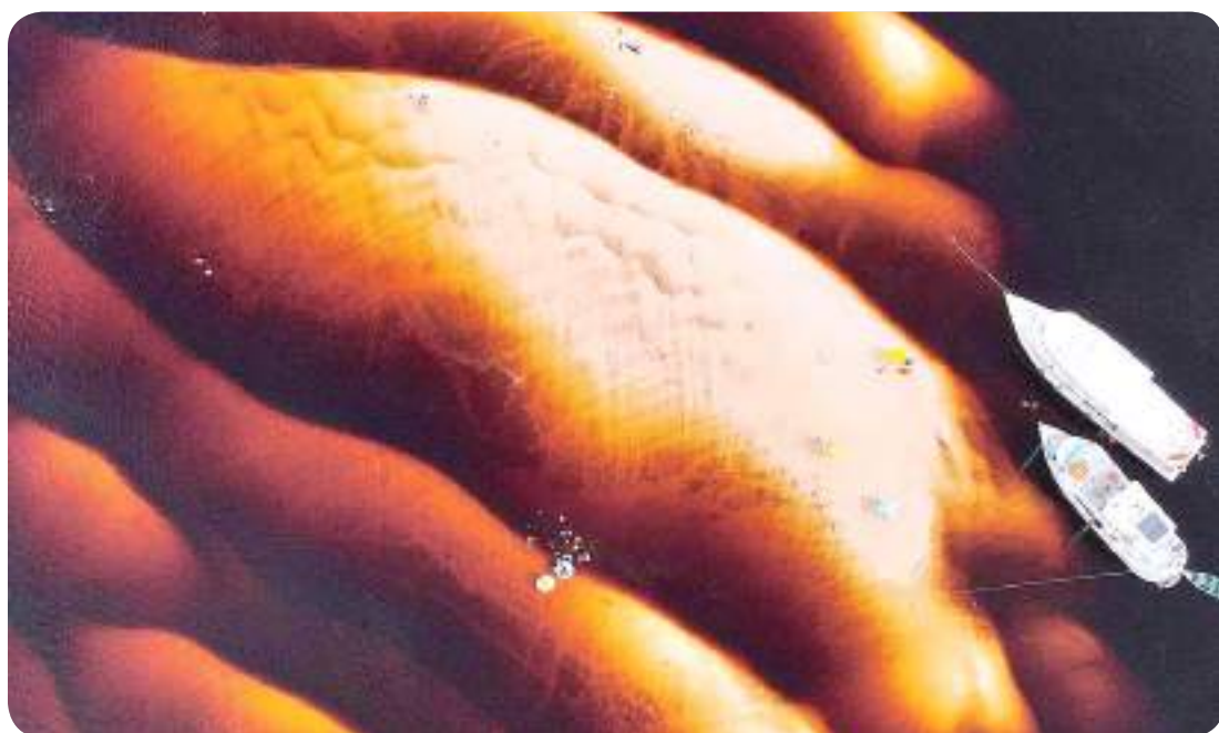
Praia Do Camaleão