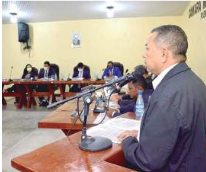
As atividades iniciaram com a leitura da Mensagem Governamental