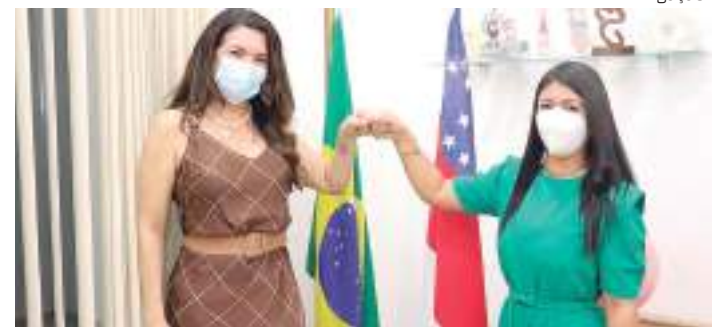
Secretárias do estado e município reafirmam parcerias

“Vim aqui firmar as parcerias para o ano de 2022 e, também, agradecer todas as ações que envolveram o Governo do Estado dentro