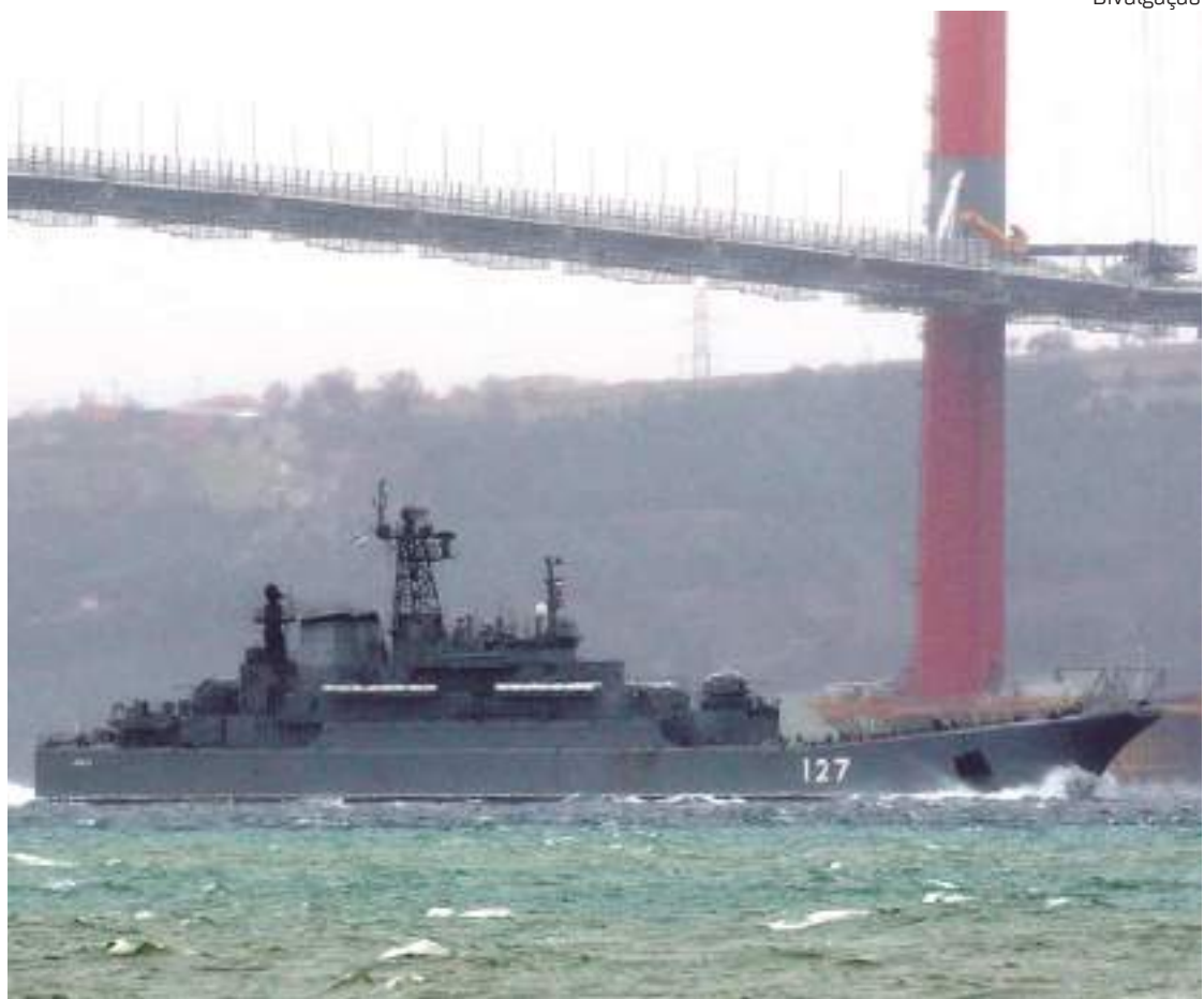
Navio de guerra Minsk, da Marinha da Rússia a caminho do Mar Negro

Já o ministro da Defesa ucraniano, Oleksii Reznikov, disse a uma televisão local que os soldados estão constantemente realizando exercícios militares, mas a partir de quinta-feira (10) começarão a usar drones Bayraktar e mísseis antitanque Javelin e NLAW fornecidos por aliados estrangeiros.