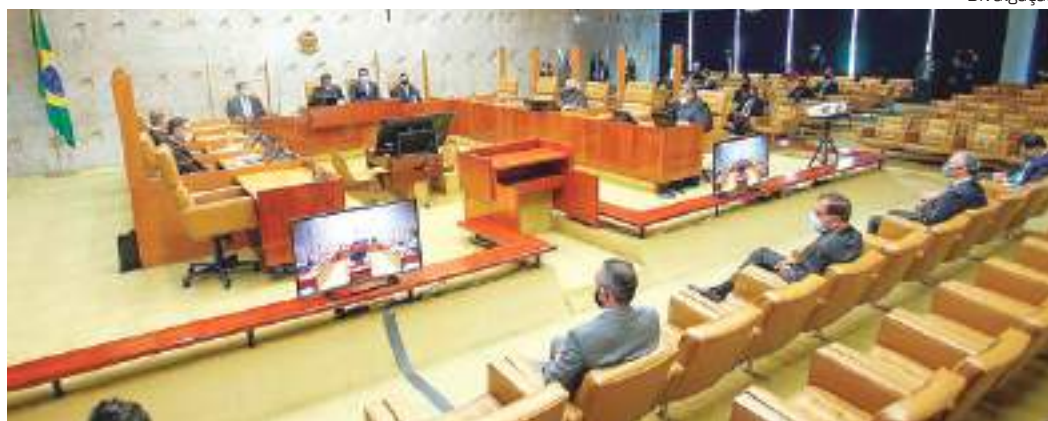
Plenário do STF tem fixado tese para impedir reeleições ilimitadas

Interlocutores da Corte não descartam que seja adotada uma solução intermediária: um maior prazo para o registro das federações, mas não os dois meses antes das eleições estabelecidos originalmente pela lei.