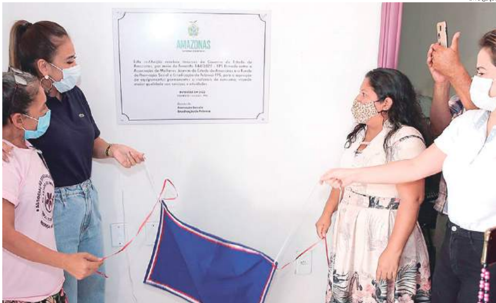
A Associação de Mulheres Jasmim do Estado do Amazonas atua nos serviços de proteção social básica

Incentivo entregue de materiais permanentes beneficiará mulheres da comunidade do Cacau Pirêra