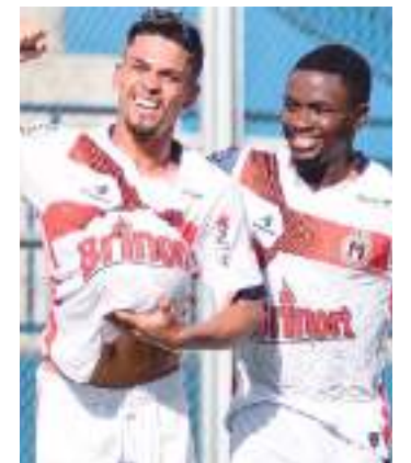
Robô enfrenta o Leão da Velha Serpa em Itacoatiara