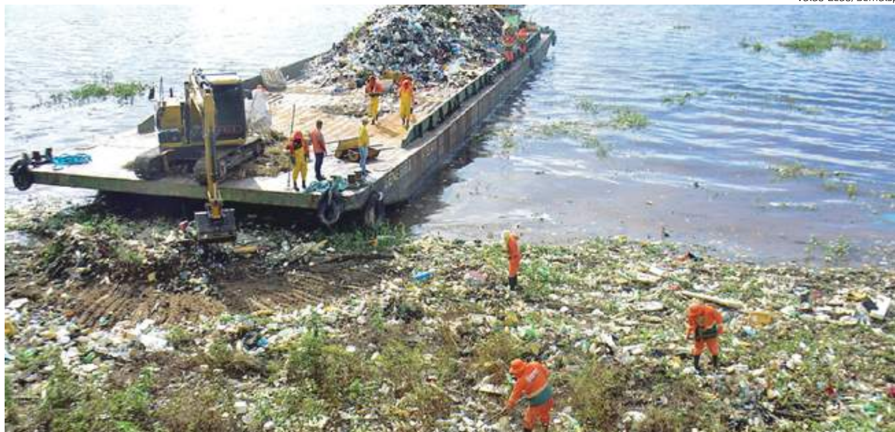
A Semulsp segue em ação nas orlas da Manaus Moderna e da Panair. Além disso, está presente no igarapé da rua Palmeira do Miriti e demais localidades

“Também estou com outra equipe de limpeza na orla da Manaus Moderna, onde estamos fazendo a coleta das balsas e limpeza nas rampas. E também a coleta próximo da Panair. Estas