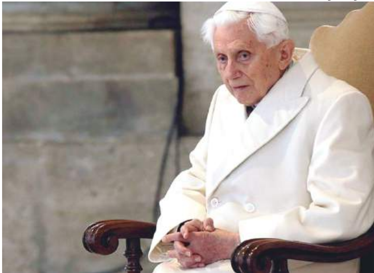
Vaticano divulgou a carta do Papa emérito junto com um adendo de três páginas escrito por especialistas jurídicos

Observando que pediu perdão para a Igreja Católica em suas reuniões com sobreviventes de abuso, Bento XVI, de 94 anos, escreveu: "Compreendi que nós próprios somos arrastados para esta falta grave sempre que a negligenciamos ou deixamos de enfrentá-la com a necessária determinação e responsabilidade, como muitas vezes aconteceu e continua a acontecer (...). Mais uma vez, só posso expressar a todas as vítimas de abuso sexual minha profunda vergonha, minha profunda tristeza e meu sincero pedido de perdão".