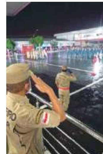
Mais de 46 mil pessoas se inscreveram no certame