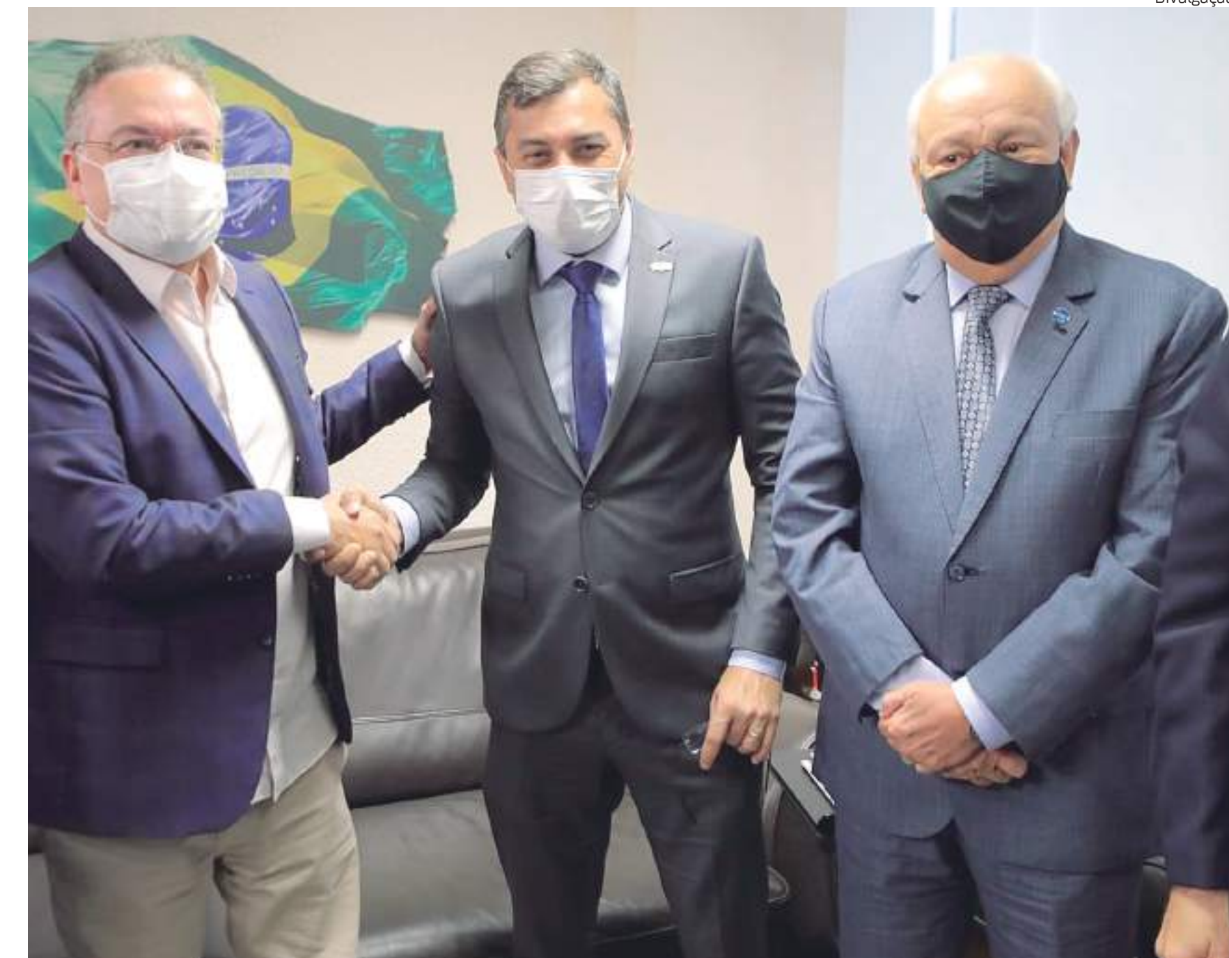
Comitiva foi até o gabinete do senador tratar do assunto