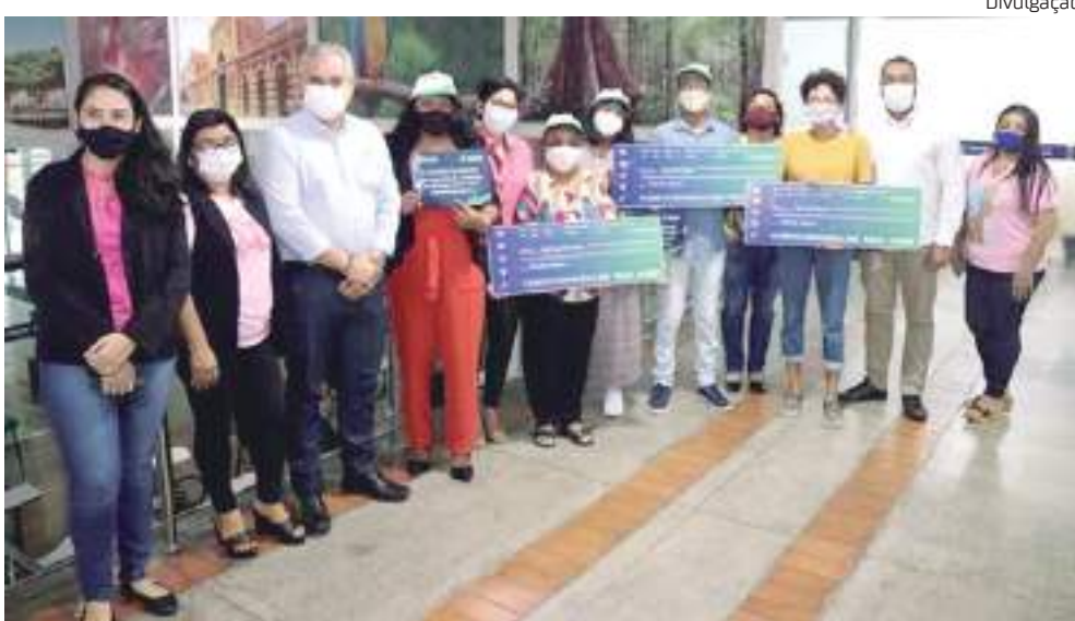
Programa oferece a oportunidade de acesso ao crédito

A Secretaria Executiva do Trabalho e Empreendedorismo (Setemp), órgão da Secretaria de Estado de Desenvolvimento Econômico, Ciência, Tecnologia e Inovação (Sedecti), que é parceira da Afeam através de termo de cooperação técnico, inicia nesta quarta-feira (09/02), os atendimentos para os seguintes públicos: desempregados que buscam empreender para geração de renda; artesãos; participantes de empreendimento de economia solidária; autônomos e Microempreendedores