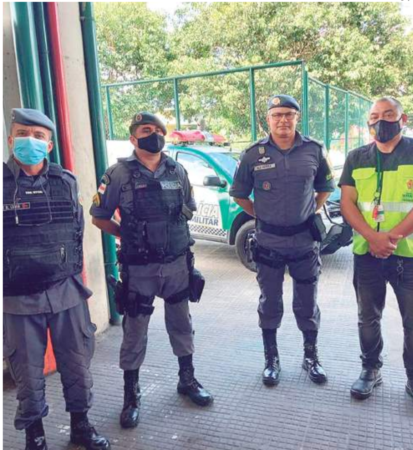
A reunião aconteceu na sede do CPM, na Praça 14

Segundo o comandante-geral da PMAM, coronel Vinícius Almeida, o ponto de abordagem ficará fixado naquela área para que todo motorista de ônibus, de aplicativo e até veículos de passeio, ao perceber qualquer situação de insegurança, busque os policiais que ali estiverem.