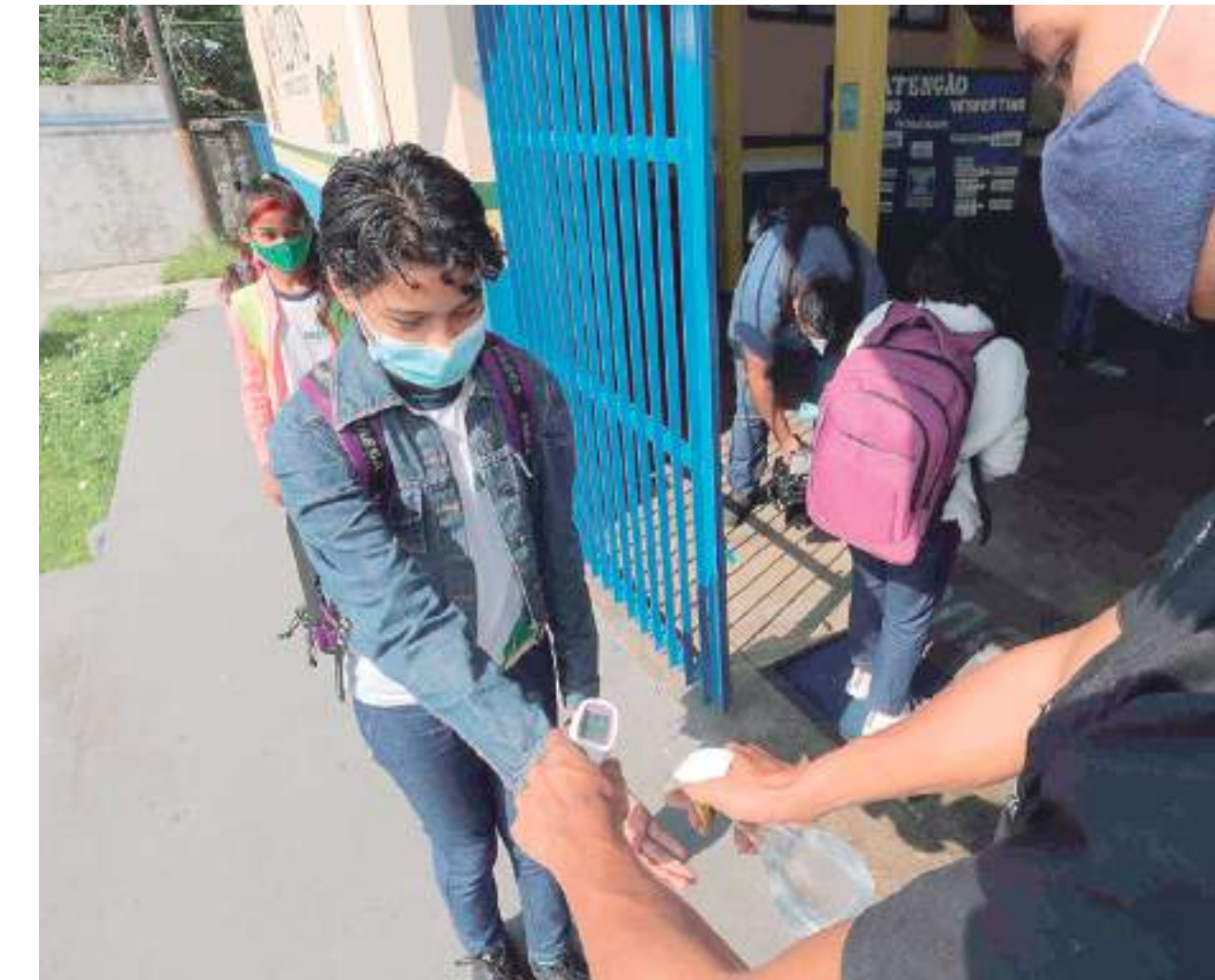
As aulas presenciais da rede estadual, em Manaus, retornam na segunda-feira (14/02), seguindo todos os protocolos de segurança em saúde

“Elas [as crianças] se contaminam e transmitem a doença, só agravam menos, hospitalizam menos. Mas, é como eu costumo dizer, por mais que nós tenhamos aí um número pequeno de óbitos e hospitalizações nessa faixa de etária