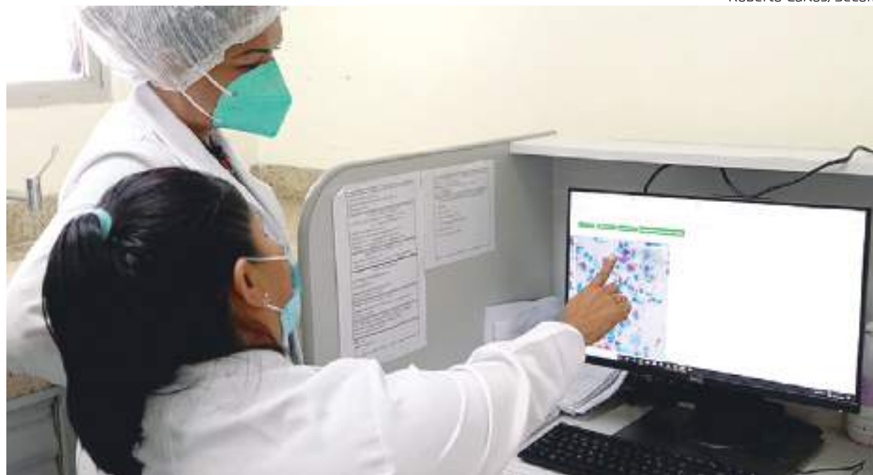
A capacitação do corpo técnico é realizada em parceria com a Fundação Hospitalar Alfredo da Matta (Fuham)

Sete técnicos, que atuam no setor de combate à hanseníase, vão receber capacitação para fortalecer a vigilância para casos da doença. O objetivo é combinar o fluxo de monitoramento de qualidade utilizado na vigilância de outras do-