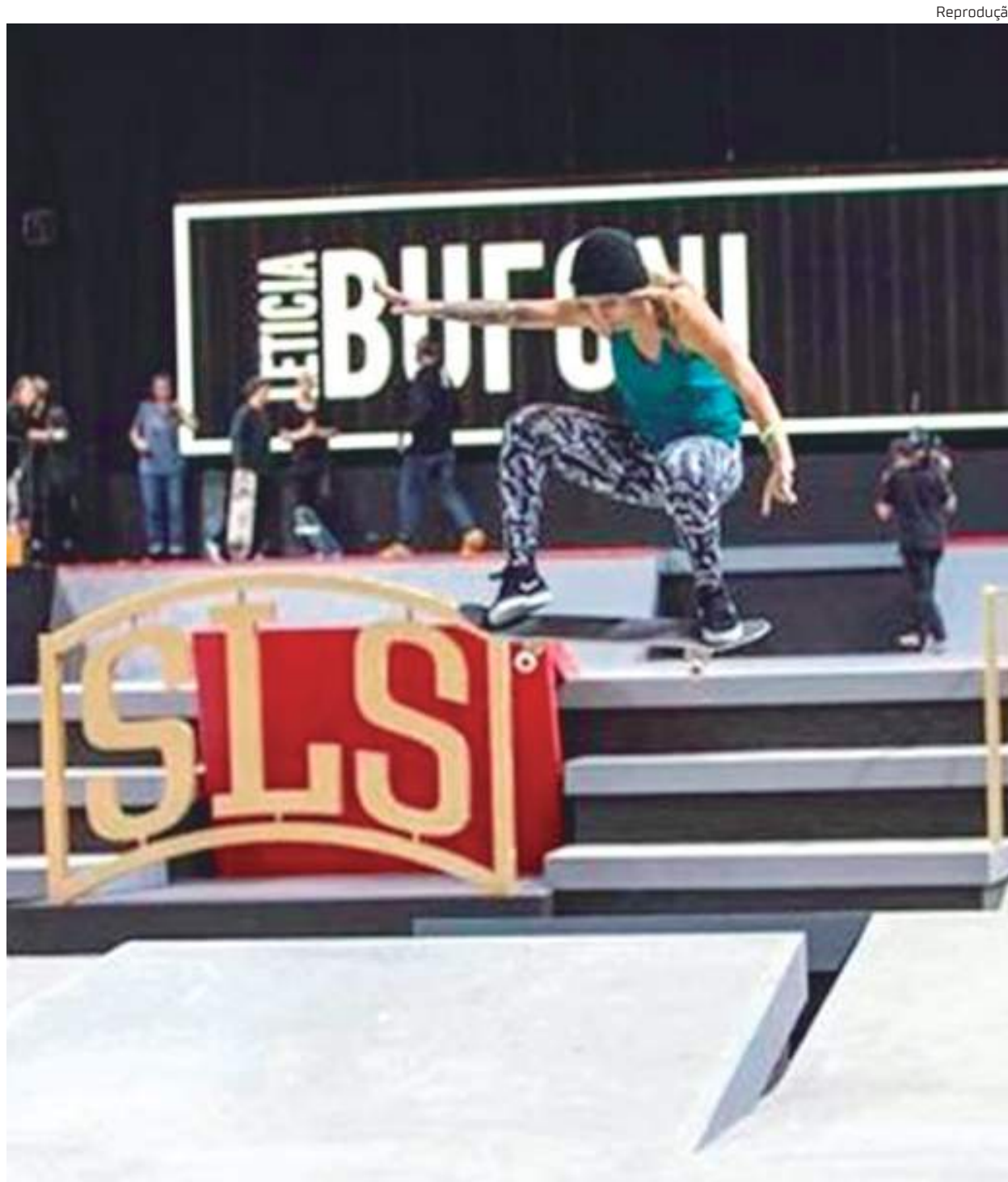
Em 2021, os brasileiros brilharam no SLS Super Crown, última etapa do Circuito Mundial de Street da SLS

Nos Jogos Olímpicos de Tóquio, o Brasil conquistou três medalhas de prata no skate,