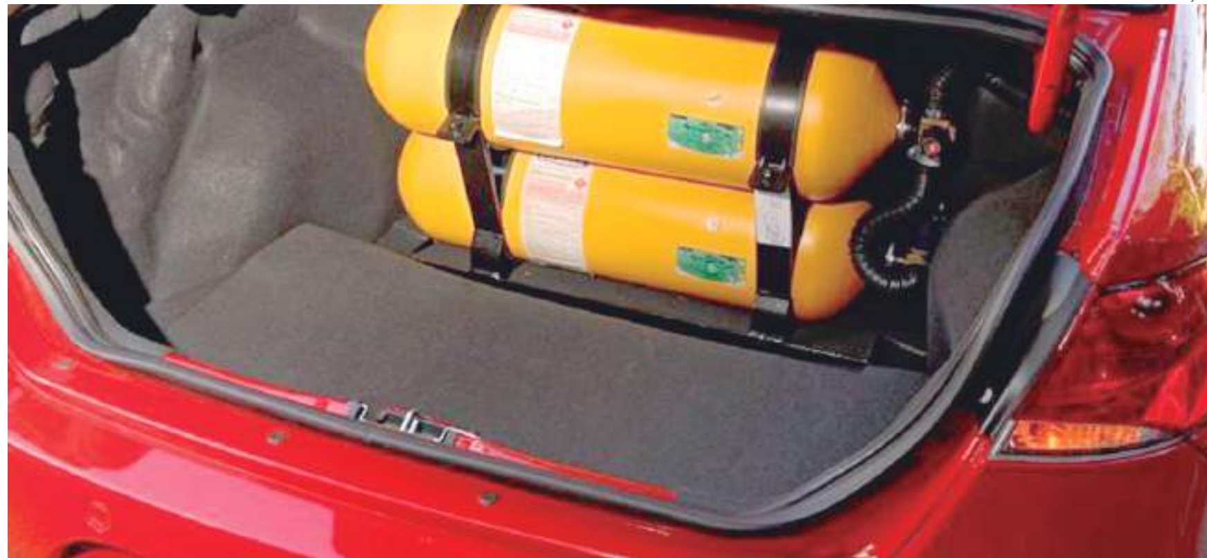
Um engenheiro especialista afirmou que as explosões ocorrem quando o motorista opta por instalar o kit GNV em oficinas não certificadas pelos órgãos fiscalizadores

Uma das principais vantagens do combustível a gás é rodar 57% a mais que os veículos abastecidos por gasolina, de acordo com os dados da Associação Brasileira das Empresas Distribuidoras de Gás Canalizado (Abegás).