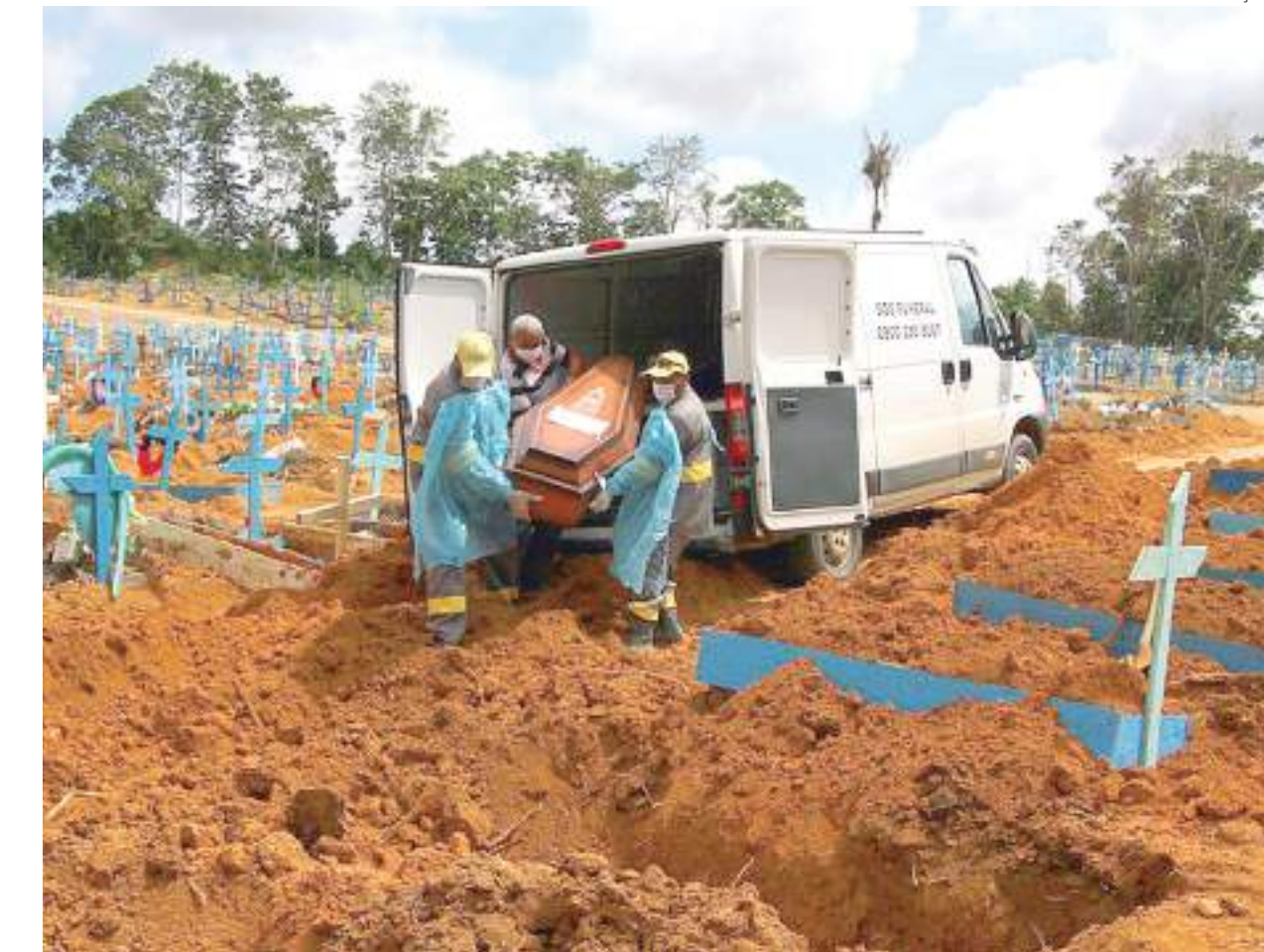
Os números estão no Boletim do Observatório Covid-19 Fiocruz

Além de impactar a saúde da população e sobrecarregar os serviços