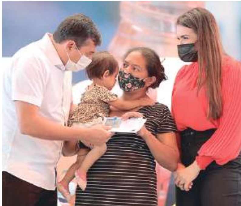
Benefício é pago todo dia 15 e favorece geração de emprego e renda

O pagamento aos beneficiários do Auxílio Estadual Permanente, do Governo do Amazonas, acontece todo dia 15 de cada mês. O desembolso do programa destinado a pessoas em situação de pobreza e extrema pobreza significa a injeção mensal de R$ 45 milhões na economia do estado, favorecendo a geração de emprego e renda no comércio dos 62 municípios.