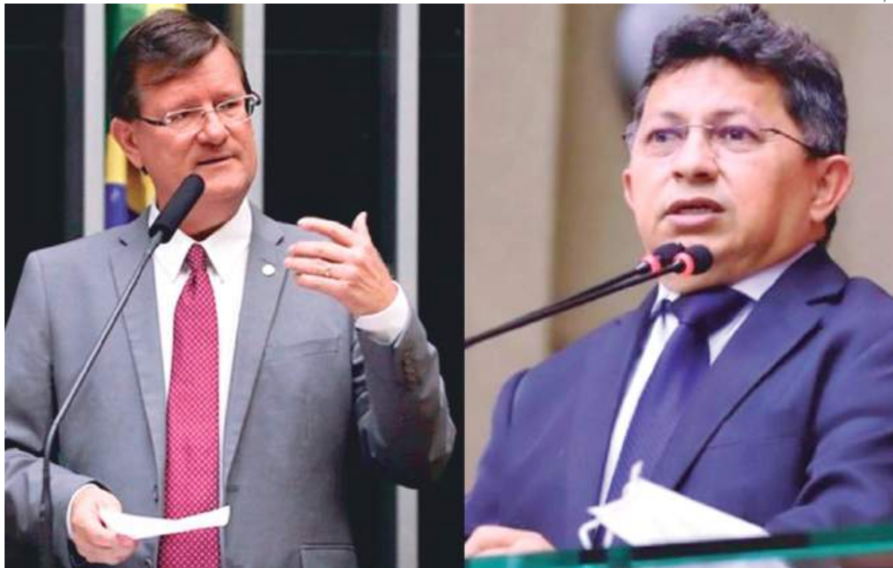
Sinésio afirma que todas as decisões serão divulgadas após o alinhamento com a organização nacional do partido

Deputado fez a afirmação após publicação de Zé Ricardo defendendo que o PT Amazonas tenha candidato próprio para as eleições