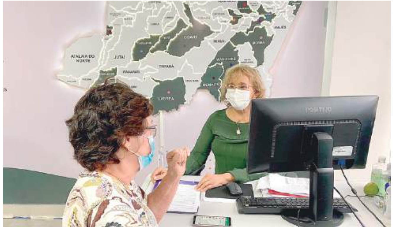
Junta do Amazonas aparecia com o percentual de 5,47% no volume de empresas

"Acreditamos que a transformação digital da Jucea é um dos