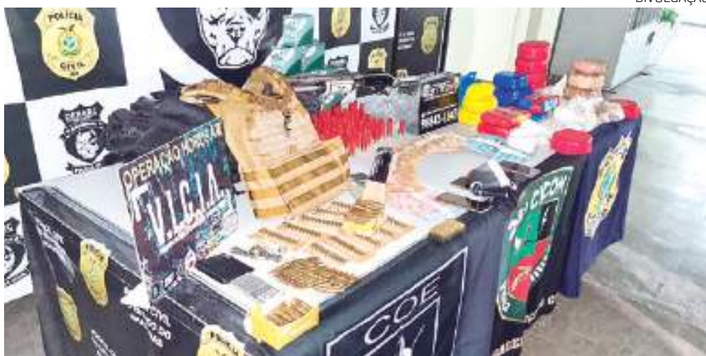
O grupo é acusado de tráfico internacional de drogas

Conforme a polícia, um casal, entre os suspeitos, foi abordado pela equipe da PRF