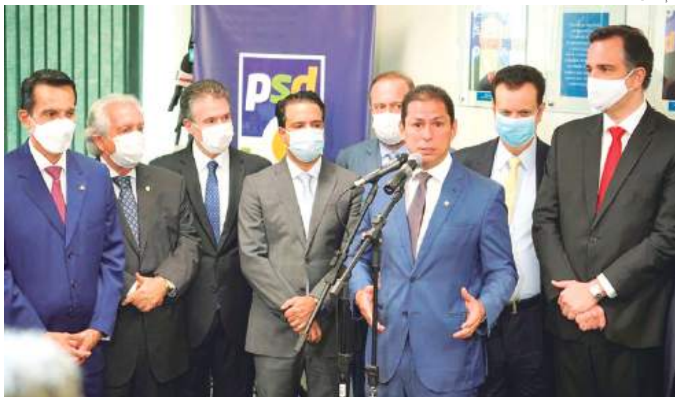
Além de nomes de peso da sua nova sigla, cerimônia foi marcada por lideranças do do PSL, PSDB, PP e até do PL

O vice-presidente da Câmara, deputado federal Marcelo Ramos (PSD-AM), oficializou, nesta quarta-feira (9), sua filiação ao Partido Social Democrático (PSD) em meio à presença do presidente nacional do partido, Gilberto Kassab, presidente do Senado, Rodrigo Pacheco (PSD-MG) e do presidente da sigla no Amazonas, senador Omar Aziz (PSD-AM), além do líder do PSD na Câmara, deputado Antônio Brito (PSD-BA), deputado Sidney Leite (PSD-AM), entre outras lideranças políticas de diversos partidos.