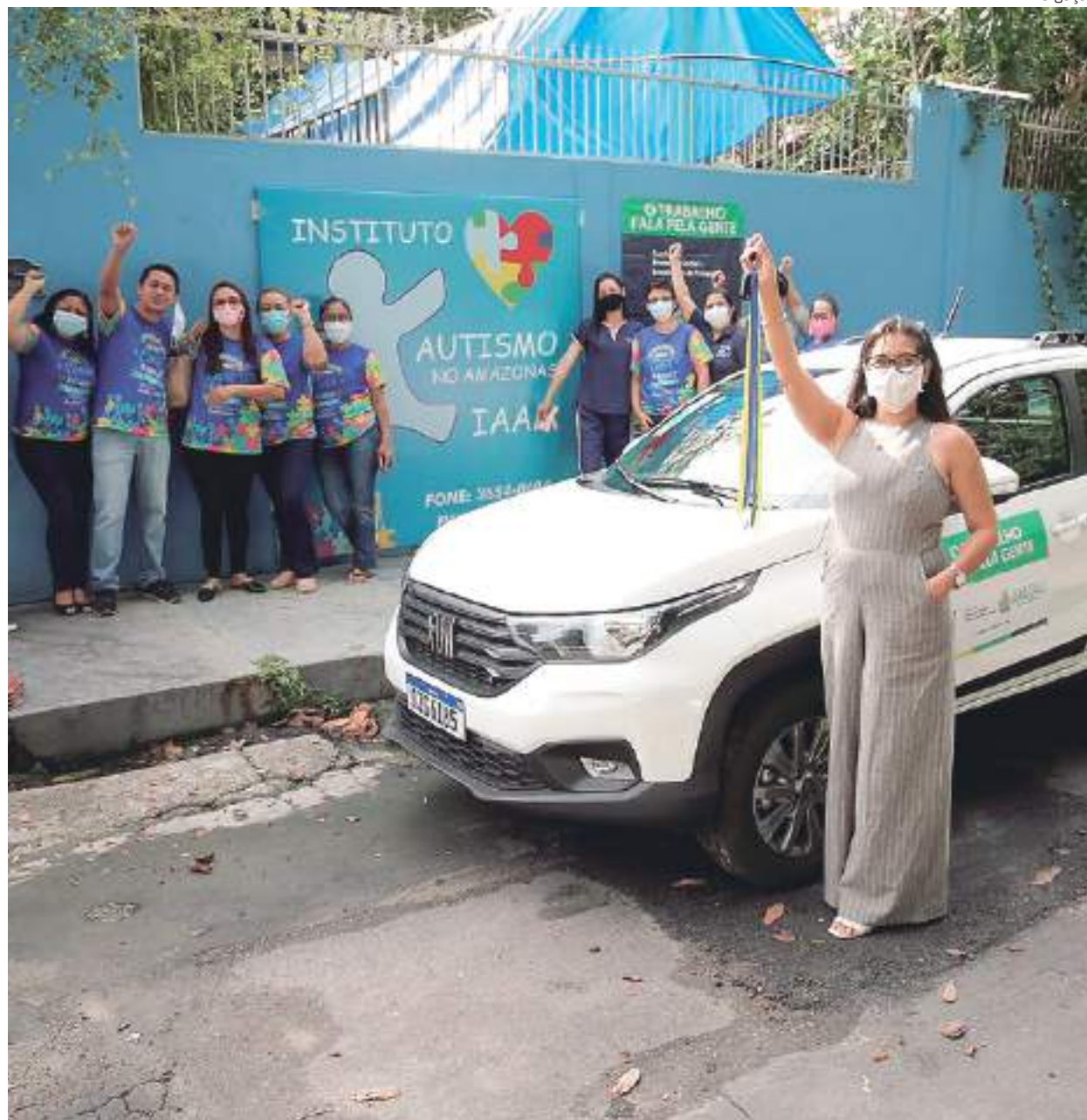
O veículo possibilita transporte dos profissionais para a realização de visitas domiciliares

Com a aquisição do veículo, o Instituto irá oferecer transporte