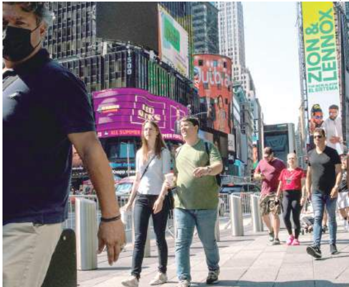
Medida será anunciada pela governadora Kathy Hochul

O governo de São Paulo recuou e desistiu de liberar o uso de máscara em ambientes ao ar livre, medida que estava prevista para entrar em vigor no dia 11 de dezembro do ano passado. O anúncio foi feito pelo governador João Dória, que está em Nova York, nos Estados Unidos, a trabalho.