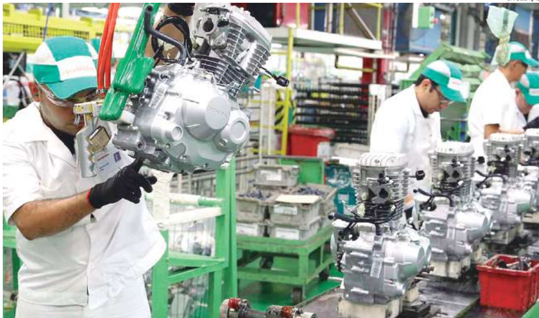
A média nacional também apresentou avanço (3,9%)

O Paraná teve a terceira maior expansão no absoluto e foi também a terceira maior influência no resultado anual nacional.