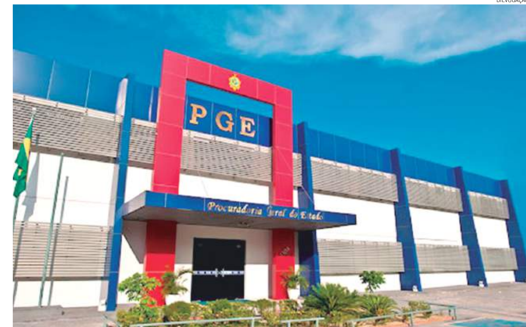
Inscrições devem começar no próximo dia 15 de fevereiro

"A PGE é uma instituição fundamental na defesa dos interesses do Amazonas e, por isso, é tão importante realizarmos este concurso para termos mais servidores engajados nesta missão. É o primeiro concurso para pro-