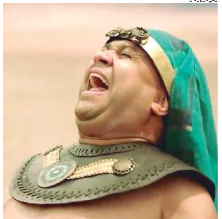
A peça já foi vista por milhões de pessoas

Hermanoteu na Terra de Godah tem direção de Homero Olivetto, produção de Augusto Casé, da Casé Filmes, e roteiro de Pedro Neschling, Jovane Nunes e Victor Leal.