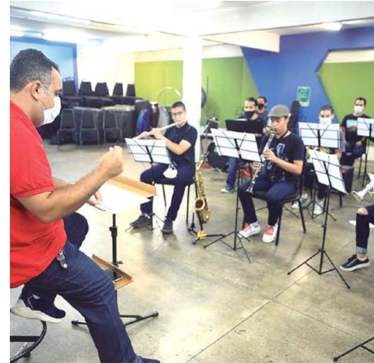
Alunos já matriculados devem ficar atentos aos prazos

deverá apresentar os seguintes documentos no ato da renovação presencial: RG do aluno e RG dos pais ou responsáveis legais, para estudantes menores de 18 anos de idade. Crianças e adolescentes deverão estar acompanhados pelos pais ou responsáveis.