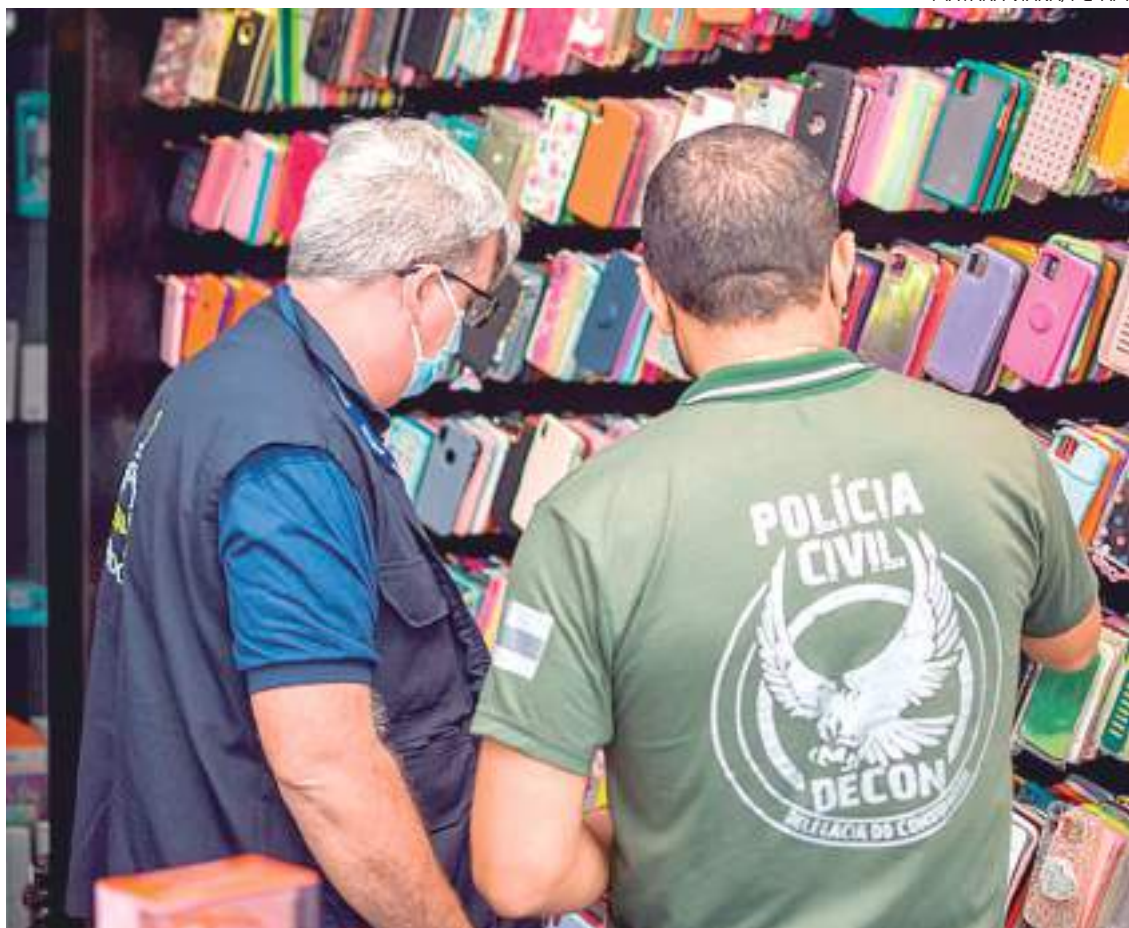
A ação policial causou prejuízo estimado em R$ 70 mil ao comércio de produtos piratas

O Boletim de Ocorrência (BO) pode ser registrado na Especializada, que está localizada na rua Desembargador Felismino Soares, 155, bairro Colônia Oliveira Machado, Zona Sul.