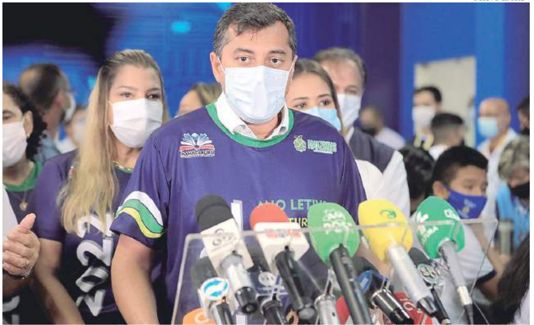
Governador anunciou investimentos de R$ 53 milhões para infraestrutura de Manacapuru

Com mais de 8 quilômetros de extensão, o Ramal do Acajatuba também será pavimentado. Os 8 quilômetros do Ramal do Açutuba receberão pavimentação, assim como os 6,5 quilômetros do Ramal Nova Esperança. Os ramais Terra Preta, do Paru e do Anjo Gabriel