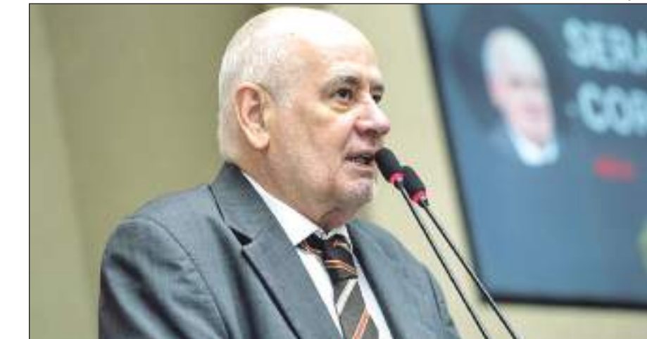
Segundo o líder do PSB na Aleam, a sustentabilidade deve ser o foco dos parlamentares

"O STF validou os incentivos da Lei de Informática. Essa era uma briga antiga da Zona Franca de Manaus, por entender que eles só eram cabíveis, apenas, na Zona Franca de Manaus. O Su-