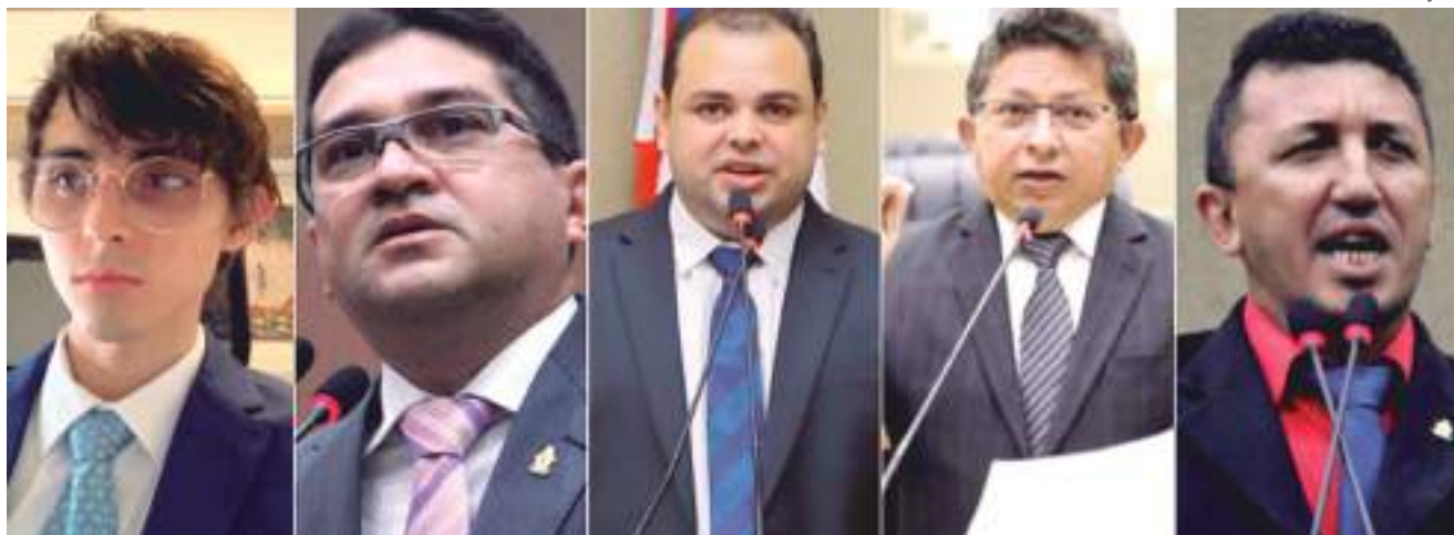
Deputados estaduais e vereadores criticam a Amazonas Energia pelas irregularidades

"O consumidor tem o direito de fiscalizar seu consumo e não terá como fazer isso com o medidor instalado num poste de quatro metros de altura. Com meu projeto aprovado, a empresa anexa foto do contador para comprovar o consumo, vai enterrar de vez a intenção