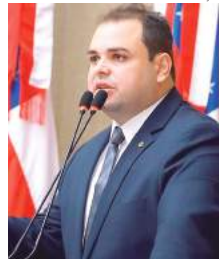
O Governo Estadual prestará auxílio nos cursos

Fundamentais para gerar oportunidades aos moradores de comunidades carentes, que, infelizmente, muitas vezes não conseguem acessar essas oportunidades por vias públicas ou privadas. Nada mais justo que o Estado auxilie essas ações que ajudam a população e cumprem um papel importante na melhoria da sociedade. Não custa nada, por exemplo, ceder uma sala de uma escola ou um laboratório de informática", avaliou.