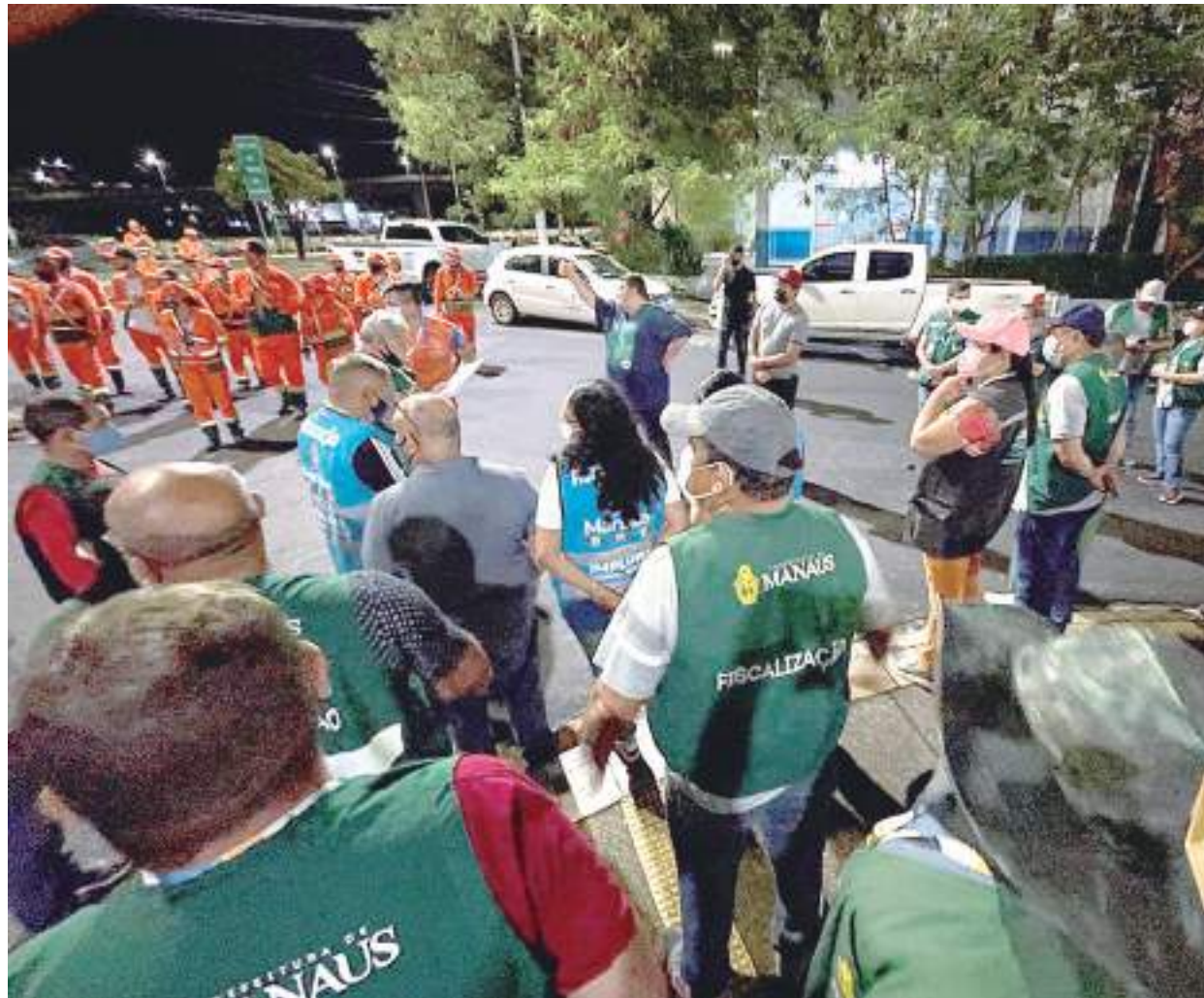
Ação iniciou na madrugada desta terça-feira (15) e foi até a manhã do dia. Prefeitura quer zelar pela área, evitando irregularidades

Neste mês, os técnicos da Gerência de Patrimônio Histórico (GPH) estão verificando divergências na base cadastral, como numeração encontrada no Boletim de Cadastro Imobiliário (BCI), tipos de vias e nomes de rua. Também estão realizando visitas in loco nas edificações e produzindo levantamento fotográfico dos lotes.