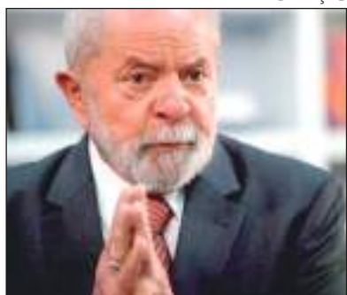
Lula disse que pretende conversar com quem votou sim ao impeachment de Dilma

"Se você só for conversar com quem não votou [no impeachment], você não tem com quem conversar, porque 90% da classe política votou no impeachment dela", argumentou.