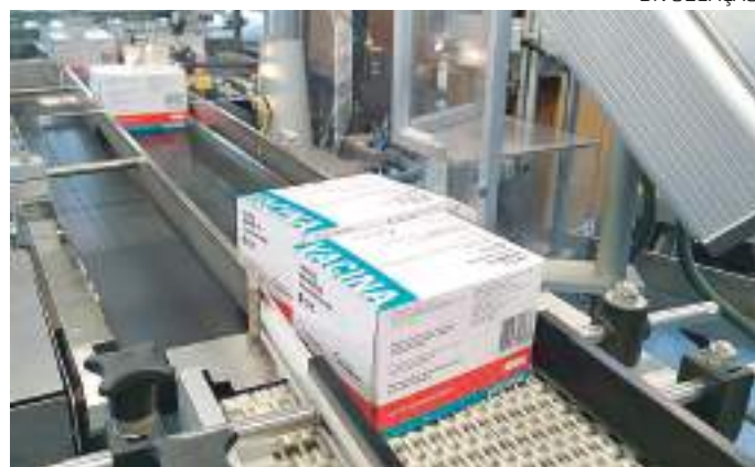
Imunizantes serão entregues ao Ministério da Saúde

O imunizante é resultado de contrato de transfe-