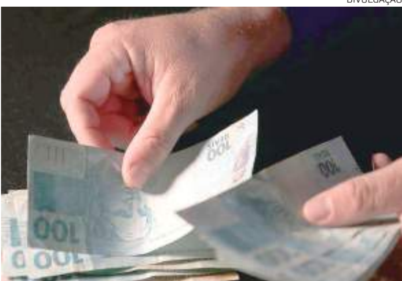
Cerca de 11,2 milhões de pessoas e empresas têm saldos a resgatar

Quase 60 milhões de pessoas físicas e empresas já fizeram consultas ao sistema que busca valores esquecidos em instituições financeiras, informou o Banco Central (BC). Desde a abertura do site, na noite de domingo (13), até as 12h de ontem (15), 59.964.368 consultas foram registradas no site.