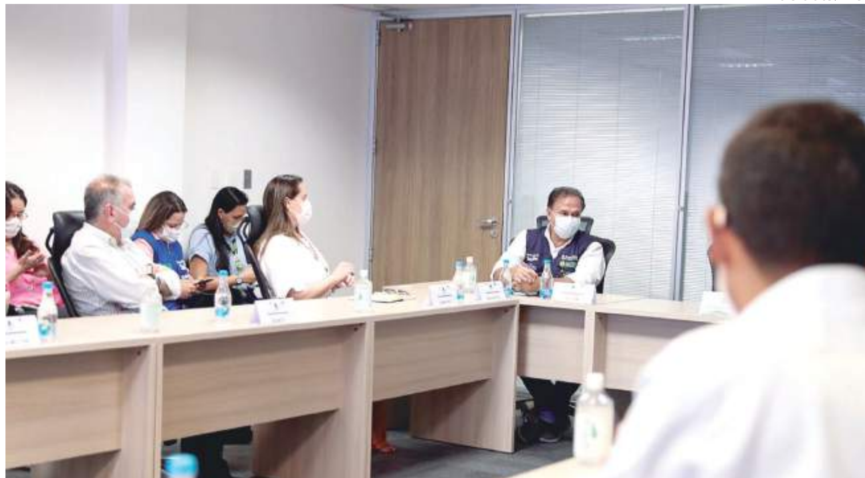
Mudanças definidas em reunião do comitê passarão a valer após novo decreto ser publicado no DOE

"Muitas pessoas que atuam nesse mercado do entretenimento, casas noturnas, casas de