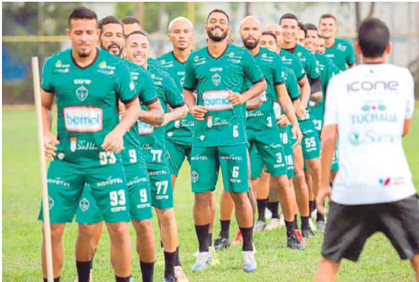
Será o primeiro confronto do Gavião fora de Manaus na competição

O Manaus enfrenta o Penarol às 15h, no estádio Floro de Mendonça, em Itacoatiara