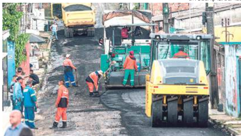
Uma equipe com 30 homens realiza os trabalhos