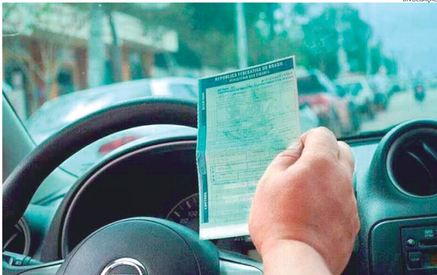
A medida vai beneficiar 490 mil proprietários de veículos do Amazonas

“Esta é uma forma da prefeitura reconhecer e premiar o contribuinte que honra com o seu dever de cidadão e paga seu tributo em dia e assim contribui com as ações de educação, saúde, mobilidade e infraestrutura da cidade”, destacou Pontes.