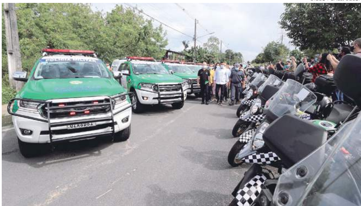
No final de janeiro deste ano, o governador Wilson Lima entregou 65 viaturas, 30 motos e armamentos para a segurança pública

"Infelizmente, não tem baixado esse número de homicídios, mesmo tendo resultados positivos como apreensão de drogas, combate ao furto e à violência contra as mulheres. Porém, em termos de homicídios ainda estamos 'patinando'... Enquanto não diminuirmos o desemprego, a miséria, a baixa escolaridade, a gente vai ter esse reflexo na violência. Não é um problema isolado. Não é apenas essa violência. Precisamos adequar uma política transdisciplinar do poder público para o êxito nesse combate", explica.