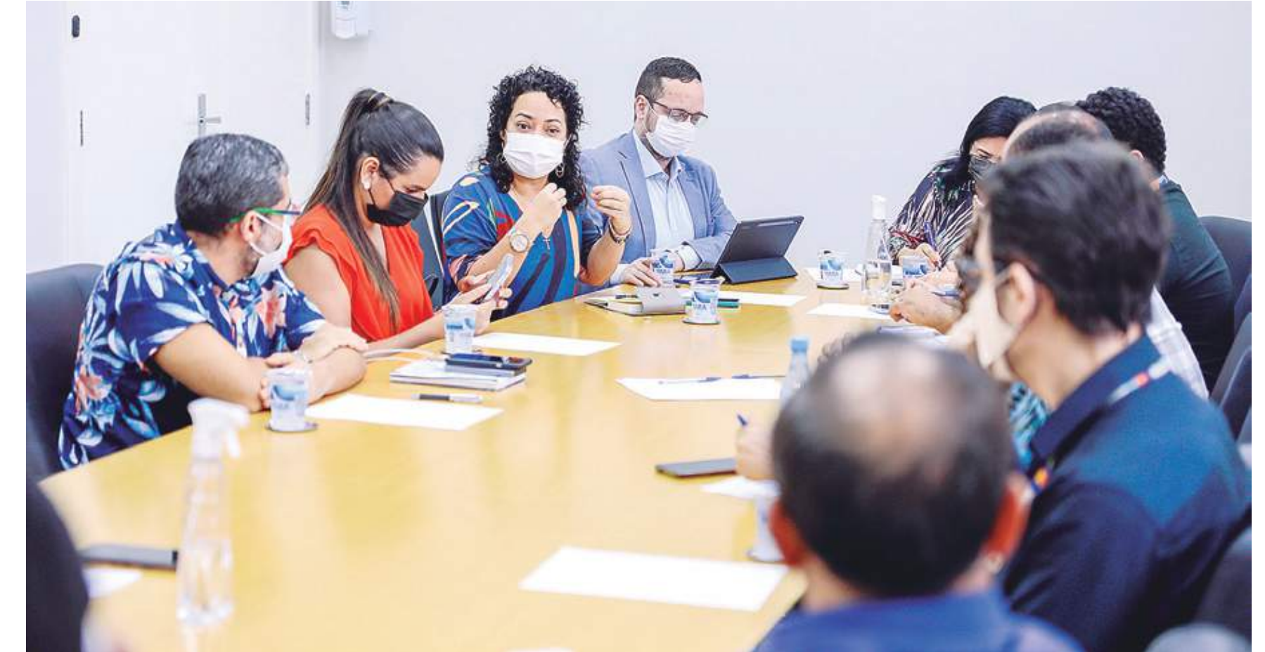
Decisão aconteceu em reunião entre Prefeitura de Manaus e Governo do Estado, na sede do Executivo municipal, no bairro Compensa, Zona Oeste da capital amazonense