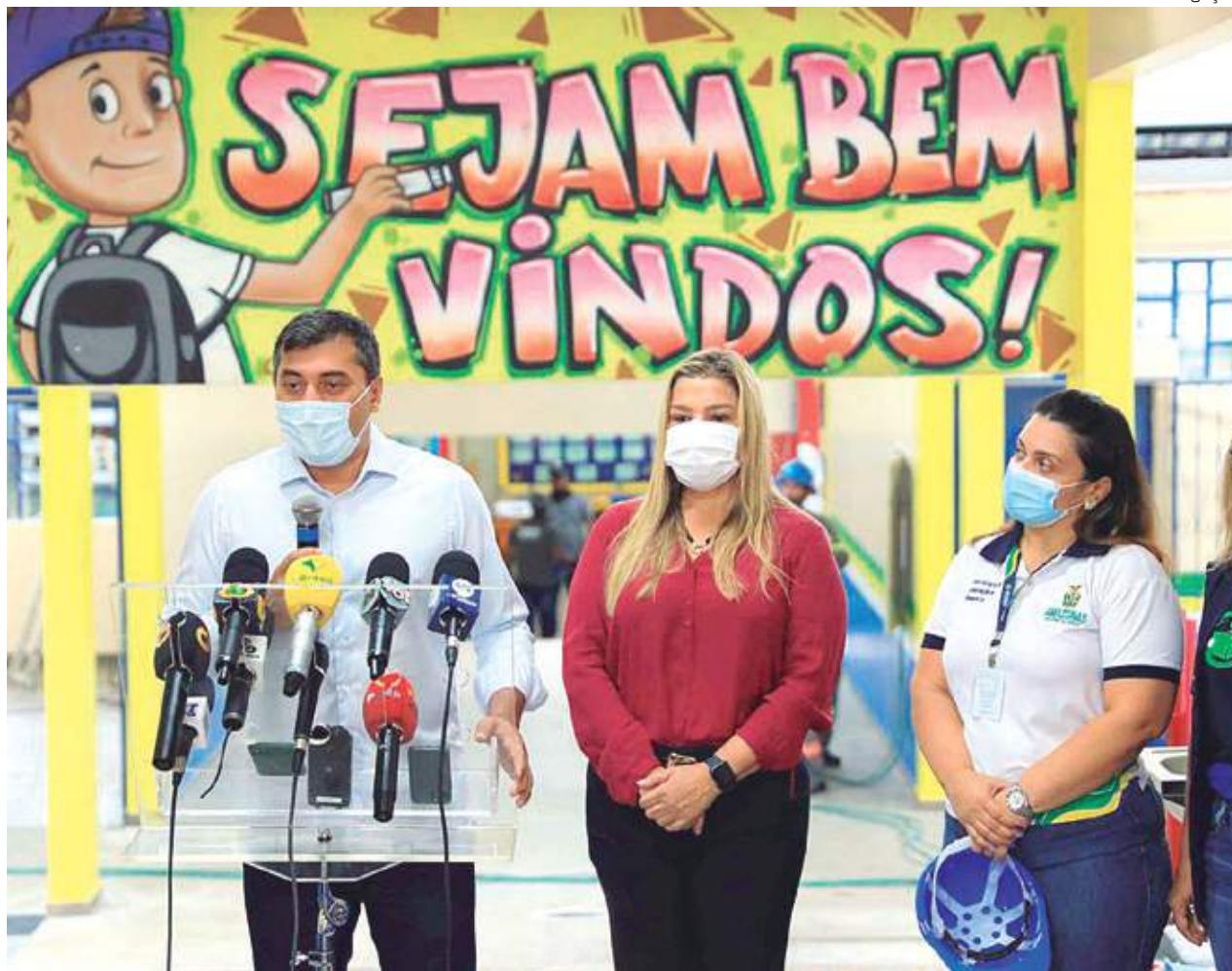
Os profissionais reforçarão o corpo docente para o ano letivo que inicia nesta segunda-feira (14)

Todas as informações sobre a apresentação dos profissionais, que inicia na segunda-feira (14), na sede da Secretaria de Educação (rua Waldomiro Lustoza, bairro Japiim), estarão disponíveis no site oficial da pasta, no link: www.educacao.am.gov.br .