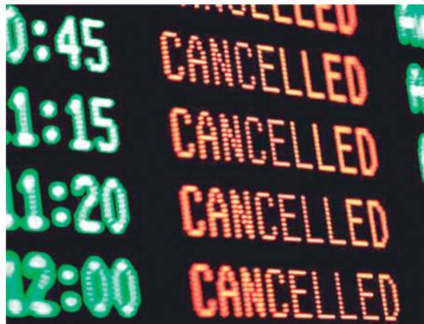
Reclamações sobre cancelamentos de voos cresceu quase 40%