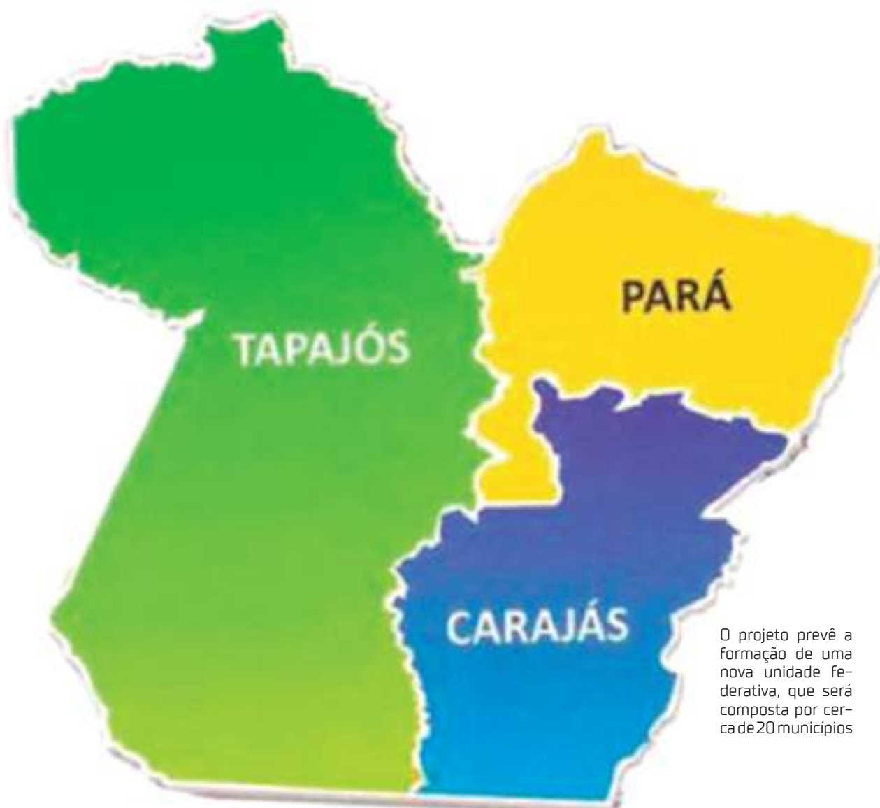
O projeto prevê a formação de uma nova unidade federativa, que será composta por cerca de 20 municípios

E a ONU defende o princípio da autodeterminação dos povos, o que legitima nosso movimento", disse.