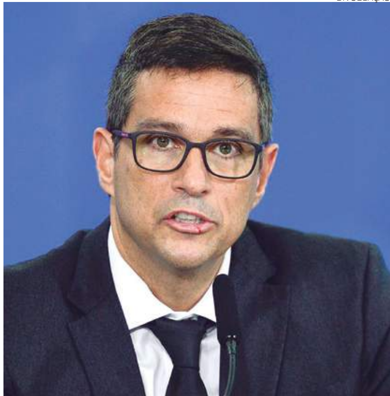
Roberto Campos Neto, presidente do Banco Central