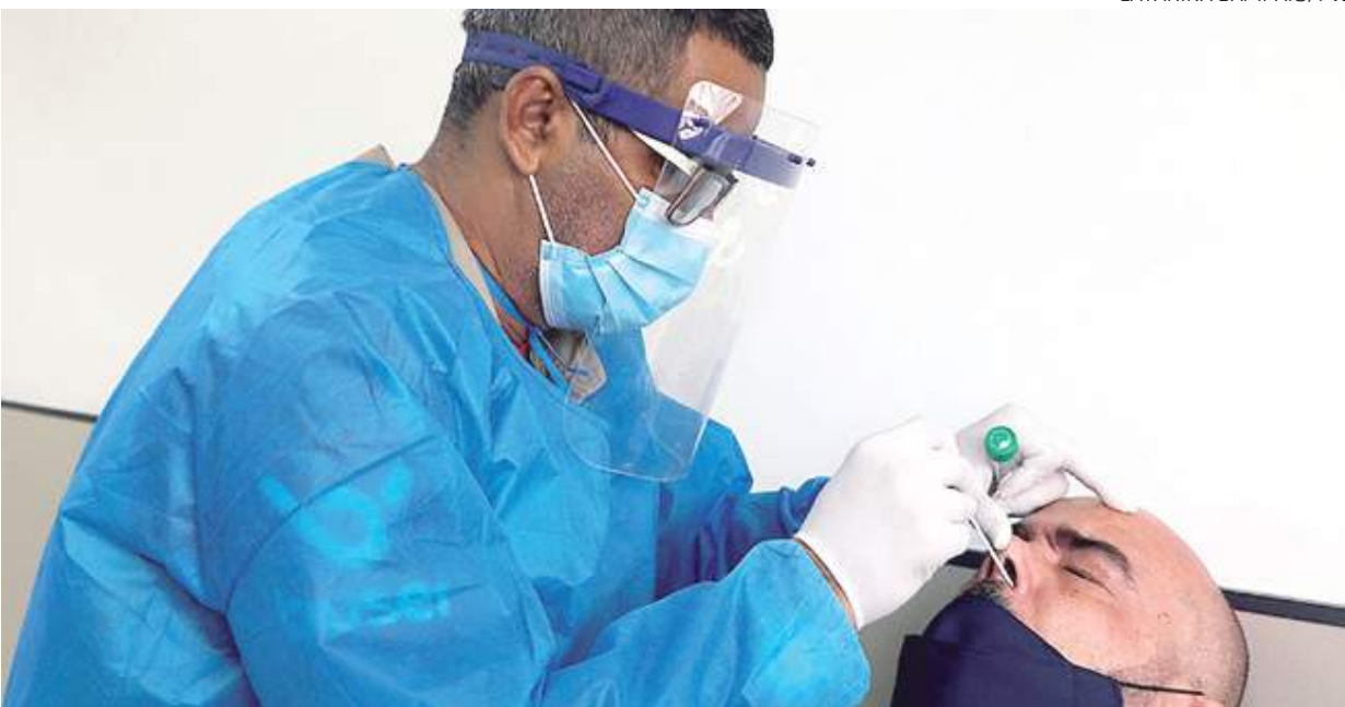
Ações de vacinação têm sido incentivadas na capital amazonense para que os números de imunizados avancem