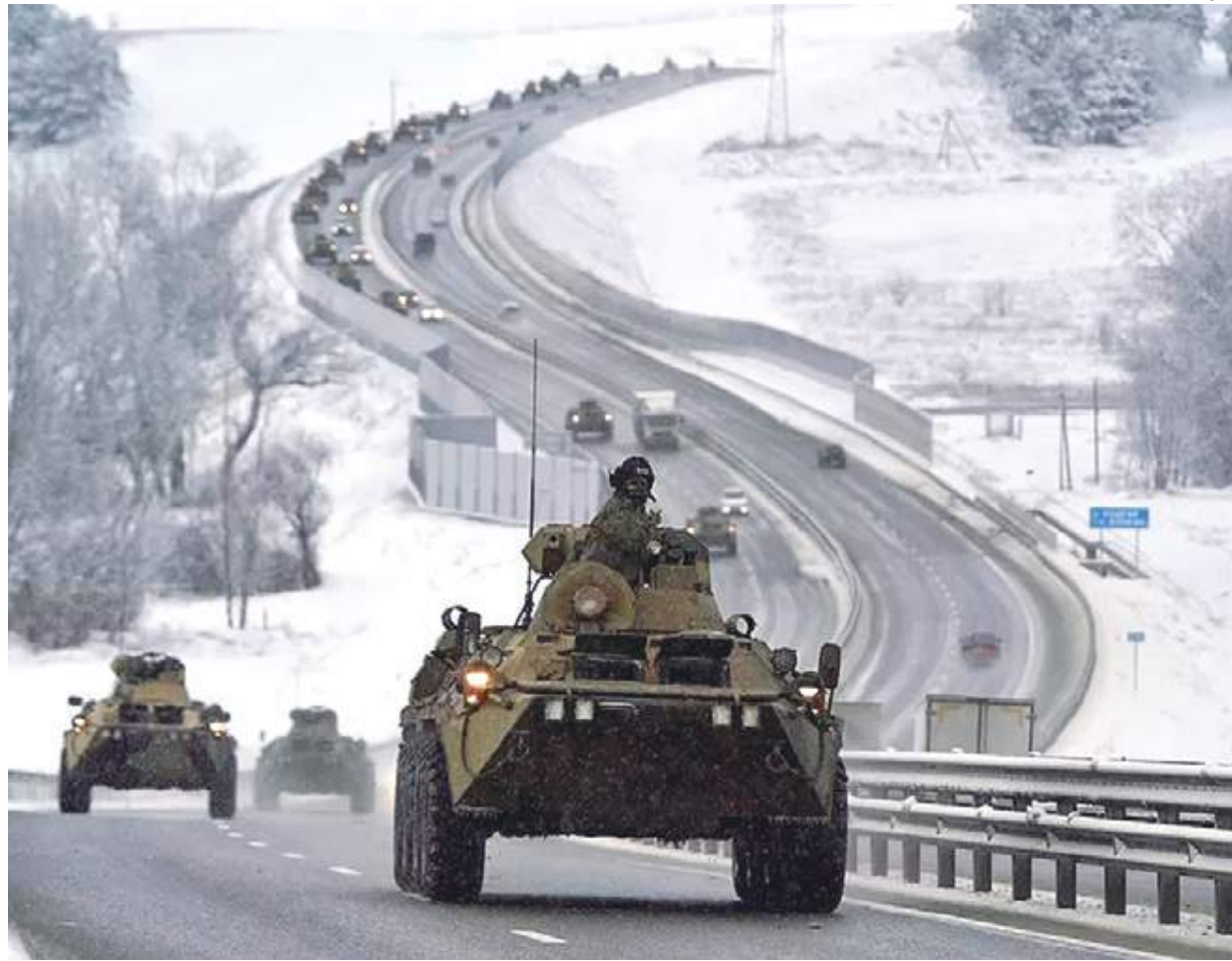
Presidente russo está enviando mais tropas à região

Na quinta-feira, o presidente dos Estados Unidos, Joe Biden, já havia pedido para os norte-americanos deixarem a Ucrânia. "Simplificando, continuamos a ver sinais muito preocupantes da escalada russa, incluindo novas forças chegando à fronteira [com a Ucrânia]. (...) Continuaremos esse processo [de pedir a saída de membros da embaixada norte-americana