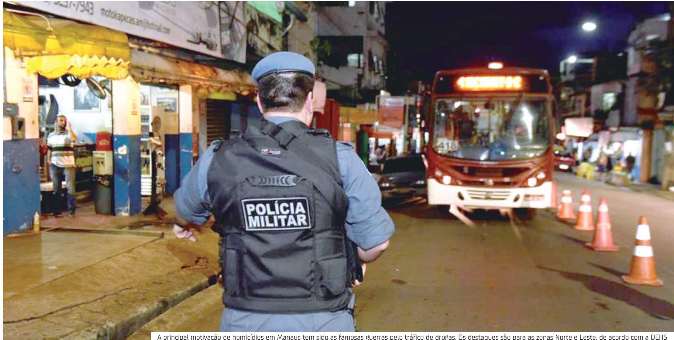
A principal motivação de homicídios em Manaus tem sido as famosas guerras pelo tráfico de drogas. Os destaques são para as zonas Norte e Leste, de acordo com a DEHS

Números levantados neste especial de Em Tempo evidenciam um aumento da criminalidade. Governo tem reagido com investimentos na segurança