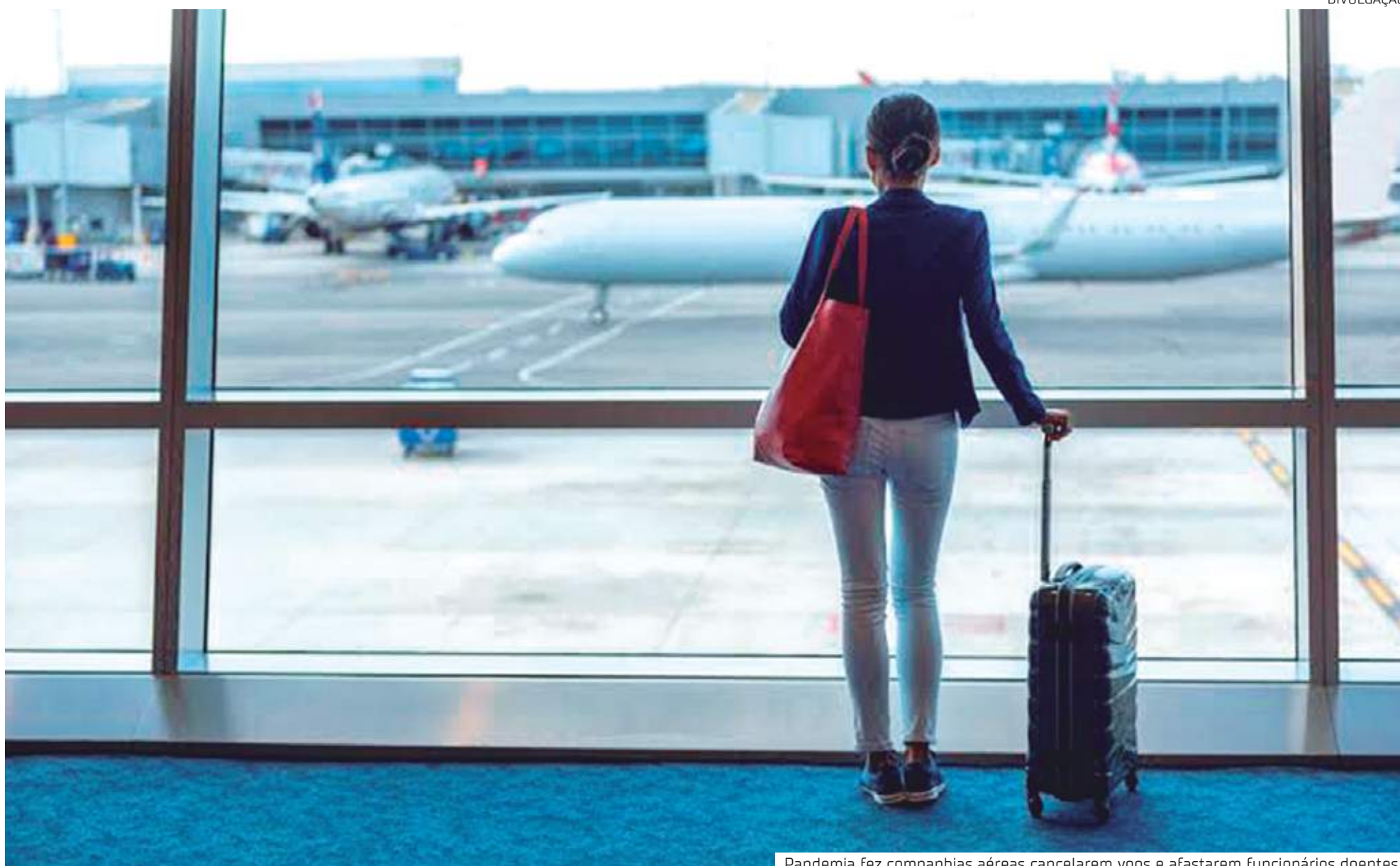
Pandemia fez companhias aéreas cancelarem voos e afastarem funcionários doentes