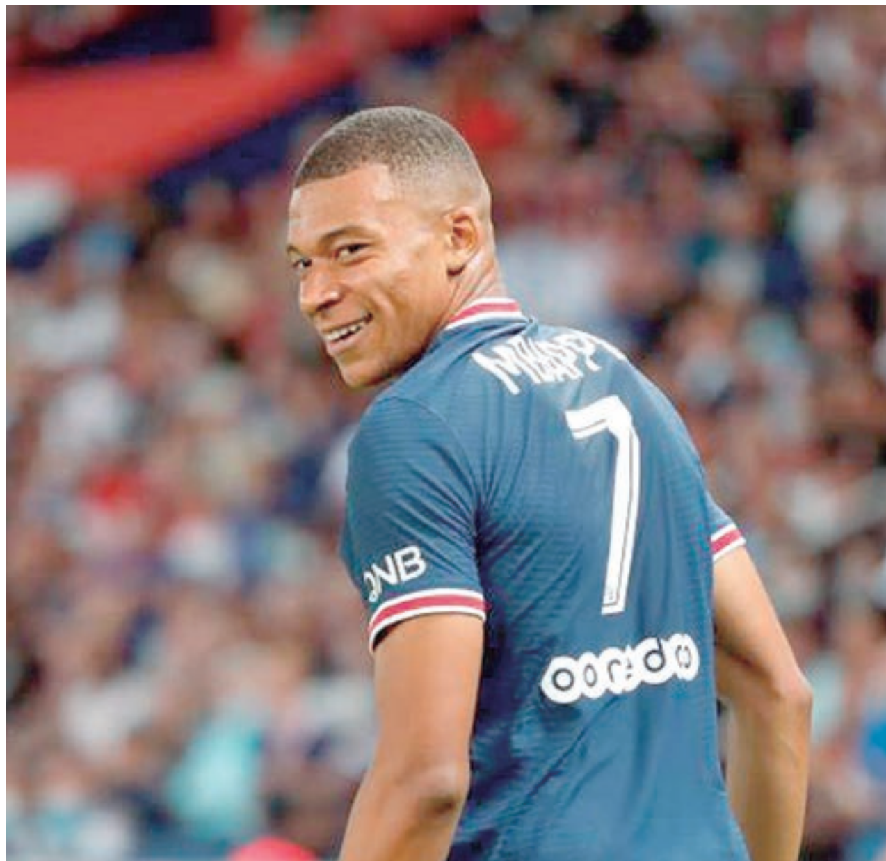
Craque francês, Mbappé é alvo frequente do Real Madrid nas janelas de transferência. Hoje, eles estarão em lados opostos no campo

Após o fim do mercado de verão da Europa, o Real Madrid optou por trabalhar apenas nos bastidores. Sem alardes, mas com a convicção de que Mbappé não iria renovar seu vínculo com o PSG, o que não aconteceu até hoje, os merengues aguardam o mês de