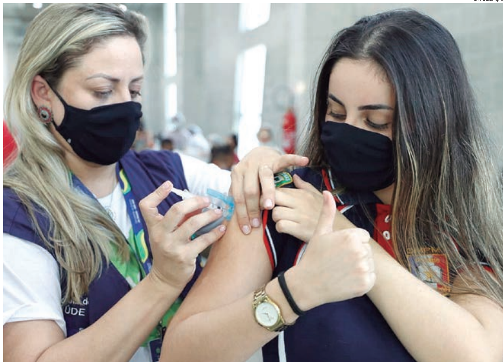
Mudança de fase consta no Boletim da Covid-19 nº 35