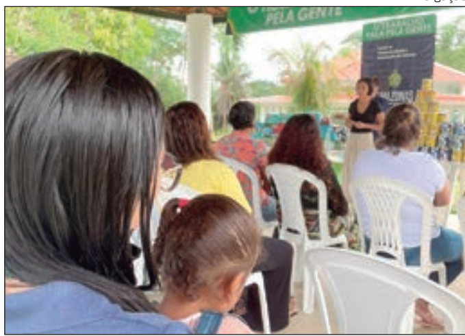
Instituição será beneficiada com kit gerador de energia solar

As entregas ocorreram na sede da Fazenda, localizada no quilômetro 14 da BR-174, ramal Cláudio Mesquita, quilômetro 2, s/n, zona rural de Manaus, com a presença da secretária-adjunta do