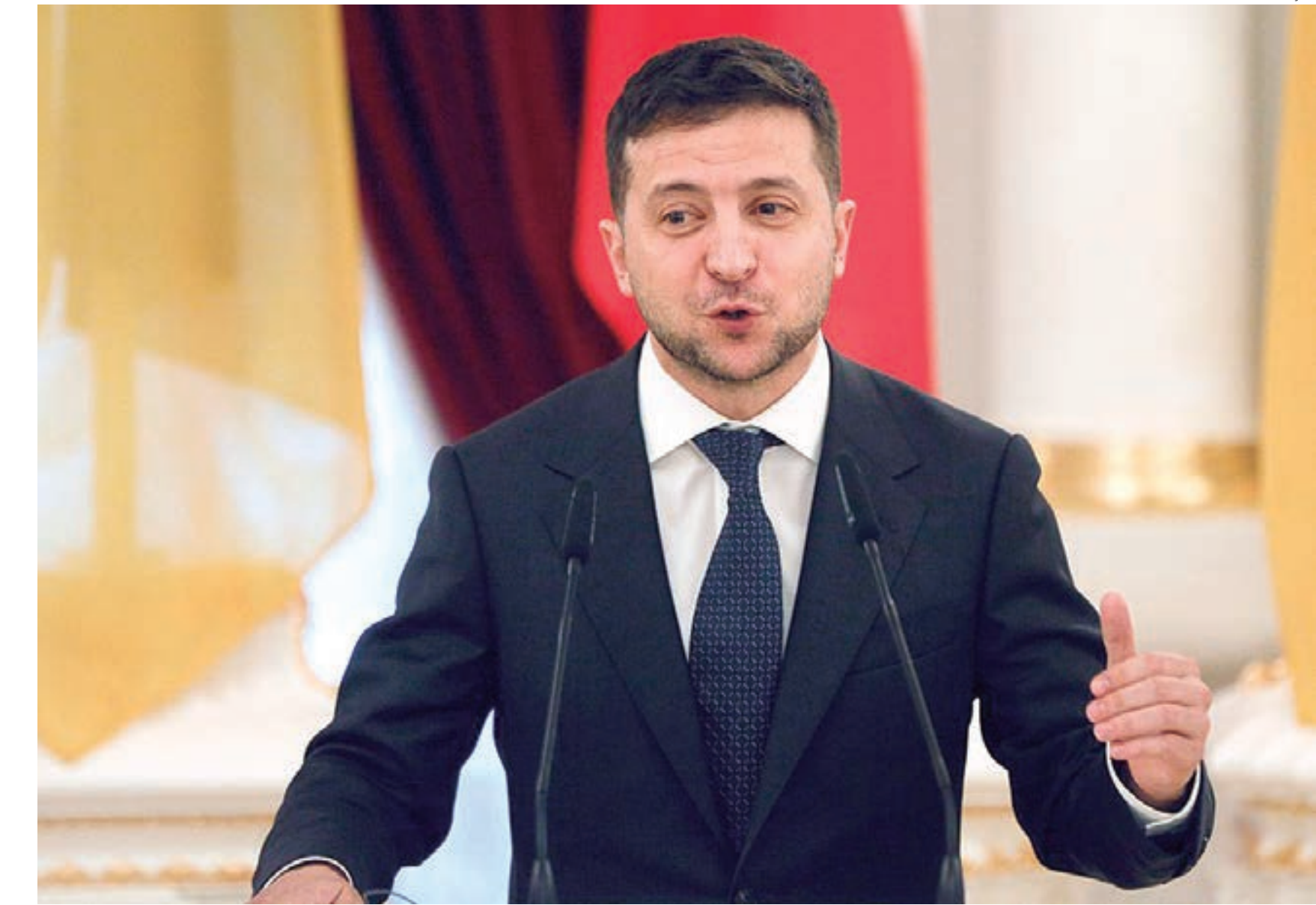
Presidente da Ucrânia, Volodymyr Zelensky, concede entrevista coletiva em Kiev nesta terça-feira (15)

"No setor de energia, eles limitam o fornecimento de gás, eletricidade e carvão. Na frente da informação, eles procuram semear o pânico entre cidadãos