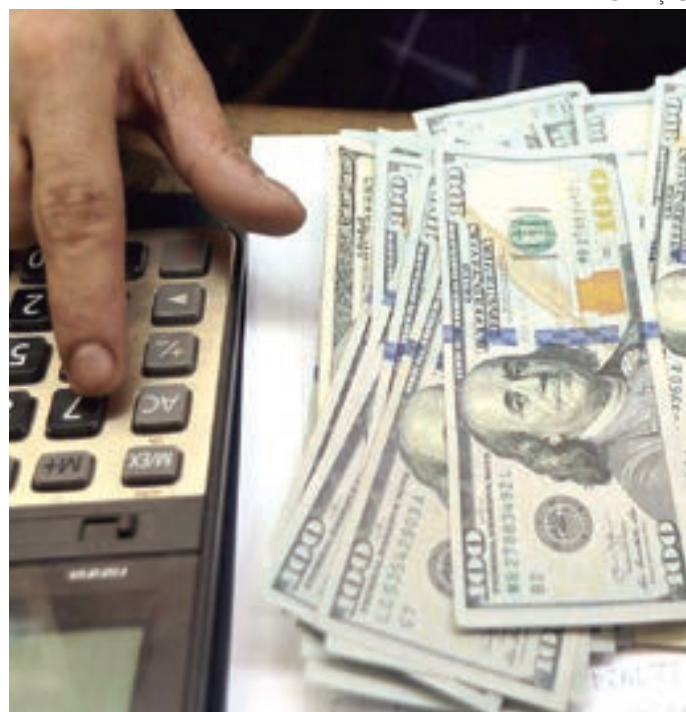
Bolsa resistiu a pressões externas e subiu 0,29%

A moeda norte-americana está no nível mais baixo desde 6 de setembro, quando estava a R$ 5,177. A divisa acumula queda de 1,65% em feve-