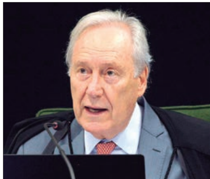
Ministro do STF criticou notas técnicas emitidas pelos ministérios

Em janeiro, as pastas publicaram documentos oficiais para desestimular a vacinação infantil. As notas ressaltam a não