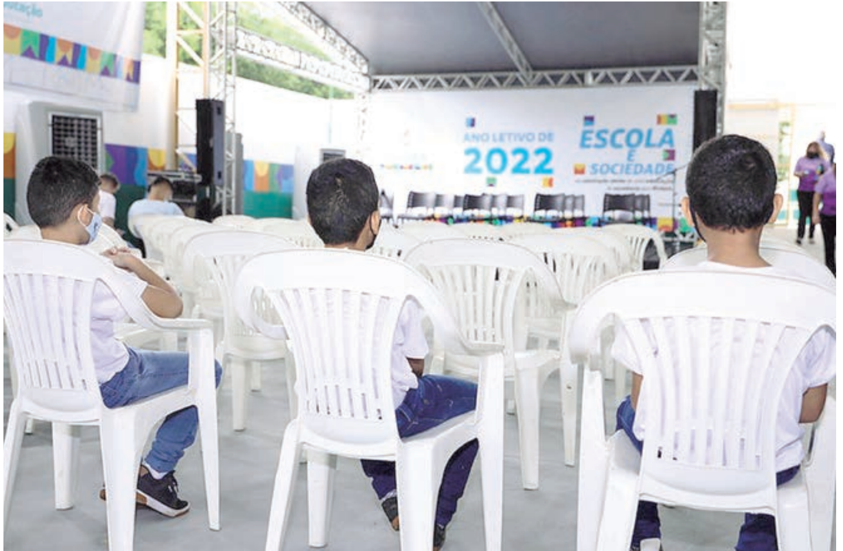
Para deixar os estudantes seguros, as escolas foram equipadas com dispenser de álcool em gel, sinalização de distanciamento e obrigatoriedade de uso de máscara

Seguindo todas as recomendações dos órgãos de saúde, as 480 das 510 escolas, que iniciaram as atividades presenciais para 220.404 alunos, estão equipadas com dispensers de álcool em gel, sinalização de distanciamento, higienização das mãos, e a obrigatoriedade do uso da máscara. Com o avanço da campanha de vacinação que alcança crianças da faixa etária de cinco anos em diante, e os professores vacinados, a prefeitura promove um retorno seguro à sala