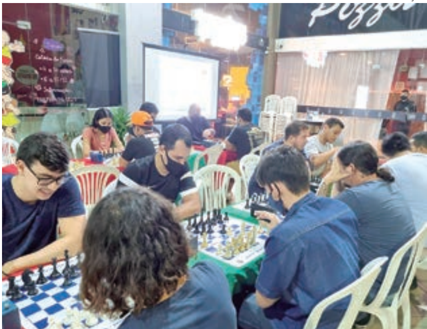
Competição é aberta para homens e mulheres e possui baixa taxa de inscrição

No dia 24 deste mês, no bar Xeque-Mate Snack Beer, bairro Parque 10 de Novembro, Zona Centro-Sul de Manaus, acontece o Circuito Blitz, campeonato de xadrez organizado pelo Amazon Battle Chess (ABC). O valor das inscrições é de R$ 15 e R$25, dependendo da categoria e do naipe do(a) competidor(a). Os três melhores colocados serão premiados em dinheiro. Para maiores informações, entrar em contato com o (92) 98200-1384.