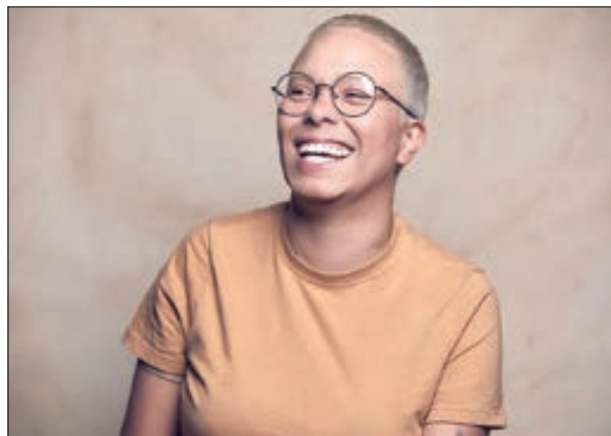
A cantora relembrou que gostaria de ser historiadora

Ela vai a campo para observar o que acontece nos biomas e tem levado