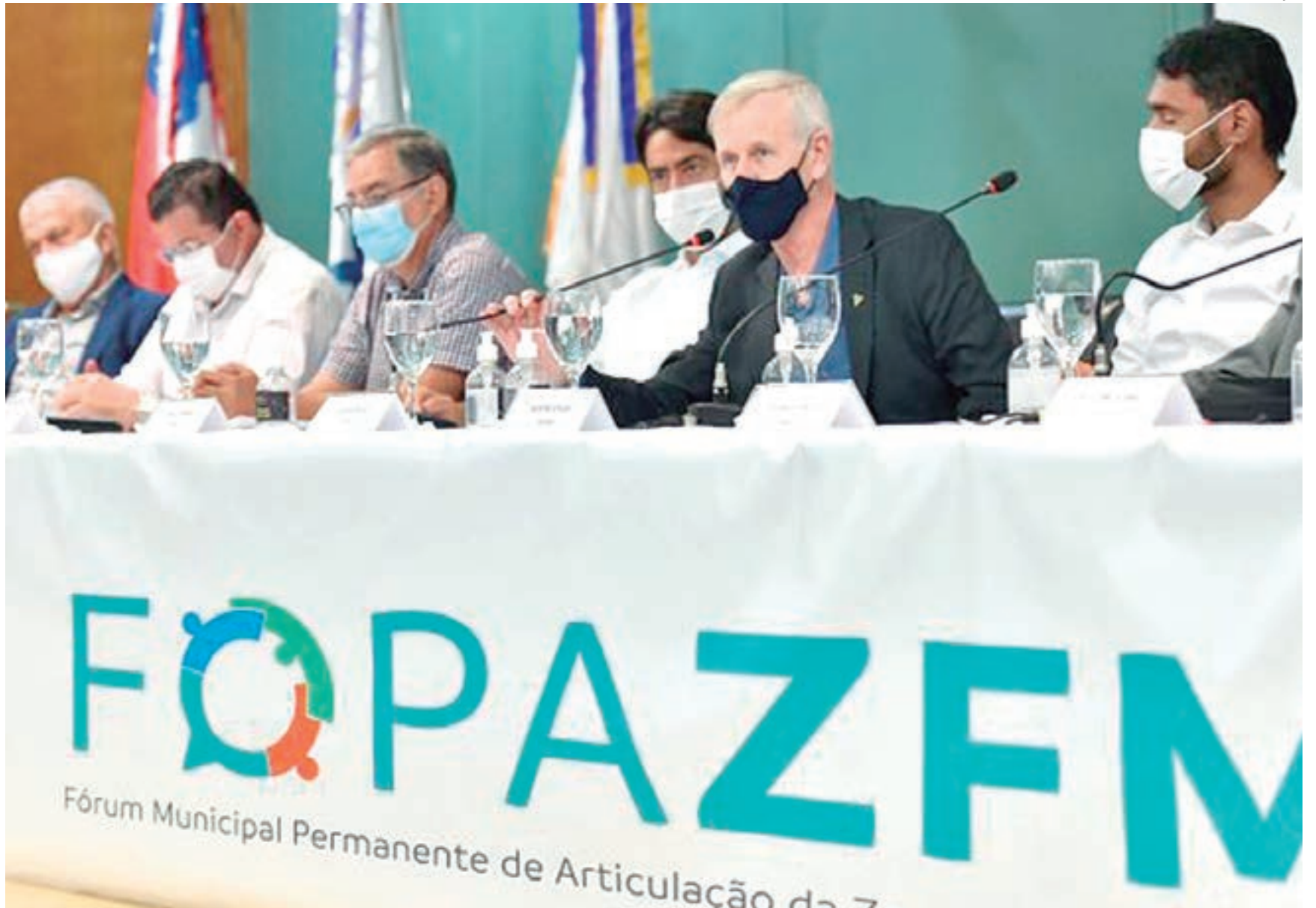
Reunião dará continuidade às estratégias de encaminhamento das demandas e ações

“O fórum de articulação foi criado pelo prefeito David Almeida para diminuir o distanciamento histórico entre a prefeitura e o modelo zona franca. Sabemos da importância que o fórum tem, principalmente, em relação a uma coletânea de ações com as três federações patronais e as três federações de trabalhadores. Vamos formatar essas demandas para debatermos e executarmos, igualmente como no ano passado que foi um sucesso e tem sido muito elogiado por todos”,