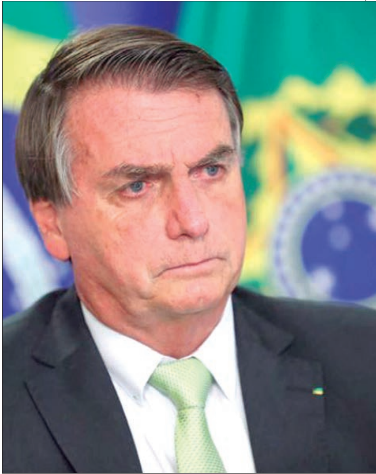
A PGR tem prazo de 15 dias para se manifestar a respeito do relatório apresentado pela PF