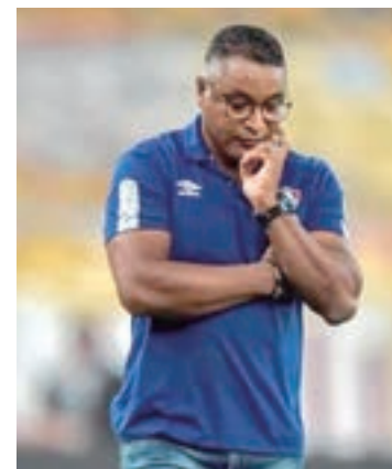
Último clube do treinador foi o Fluminense, na temporada de 2021