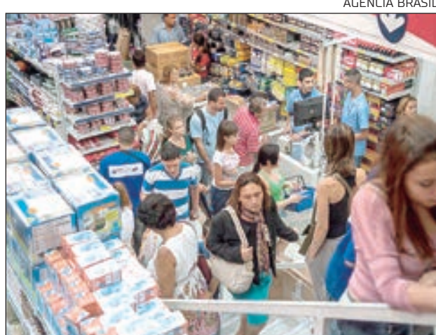
Famílias têm inovado para fugir dos altos preços das listas escolares

Além disso, de acordo com o levantamento realizado entre os dias 17 e 18 de