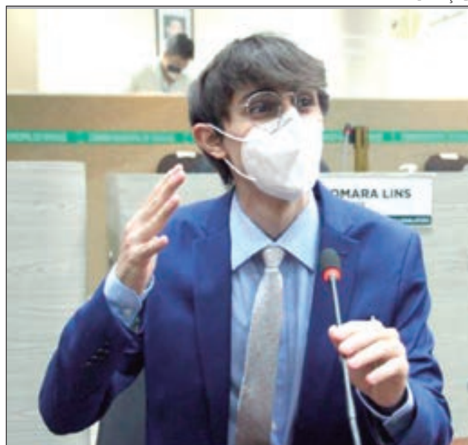
Mandel é cotado como grande pré-candidato a deputado federal

“Fui anunciado como filiado de interesse pelo vice-presidente nacional do União Brasil. Com a perspectiva de desenvolver o projeto de juventude que anunciei desde o iní-