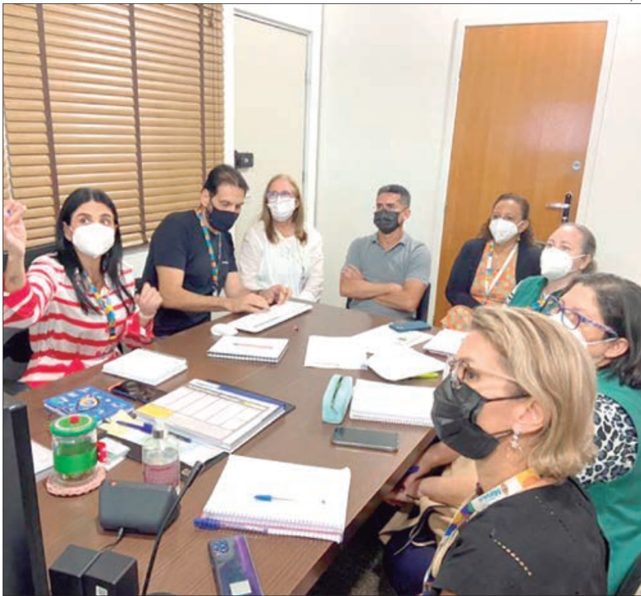
O prefeito salientou que é preciso combater fake news contra vacinas

“Esse é mais um avanço para melhorarmos a saúde da nossa população, aumentando a cobertura vacinal, que foi prejudicada