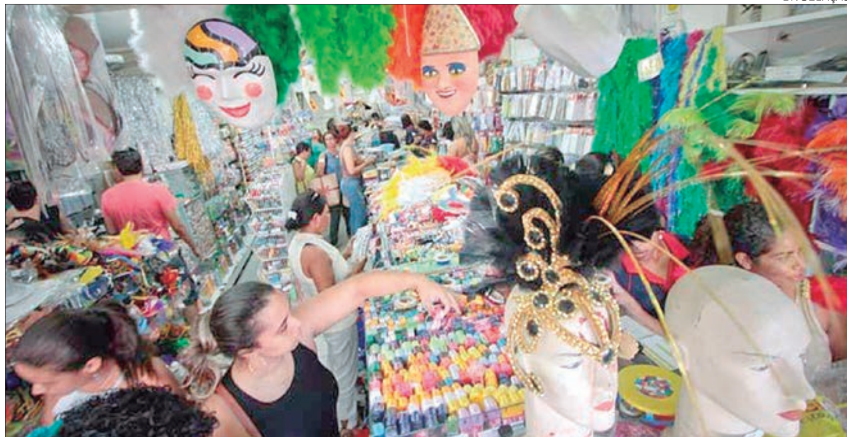
Tendência é que os preços tenham uma variação inferior à prévia da inflação oficial

E as projeções reforçam essa relevância. De acordo com a Confederação, a expectativa para o período é que, mesmo sujeito a restrições, o segmento de alimentação fora do domicílio, representado por bares e restaurantes, movimente R$ 2,78 bilhões, seguido pelas empresas de transporte de passageiros rodoviário (R$ 1,55 bilhões) e pelos