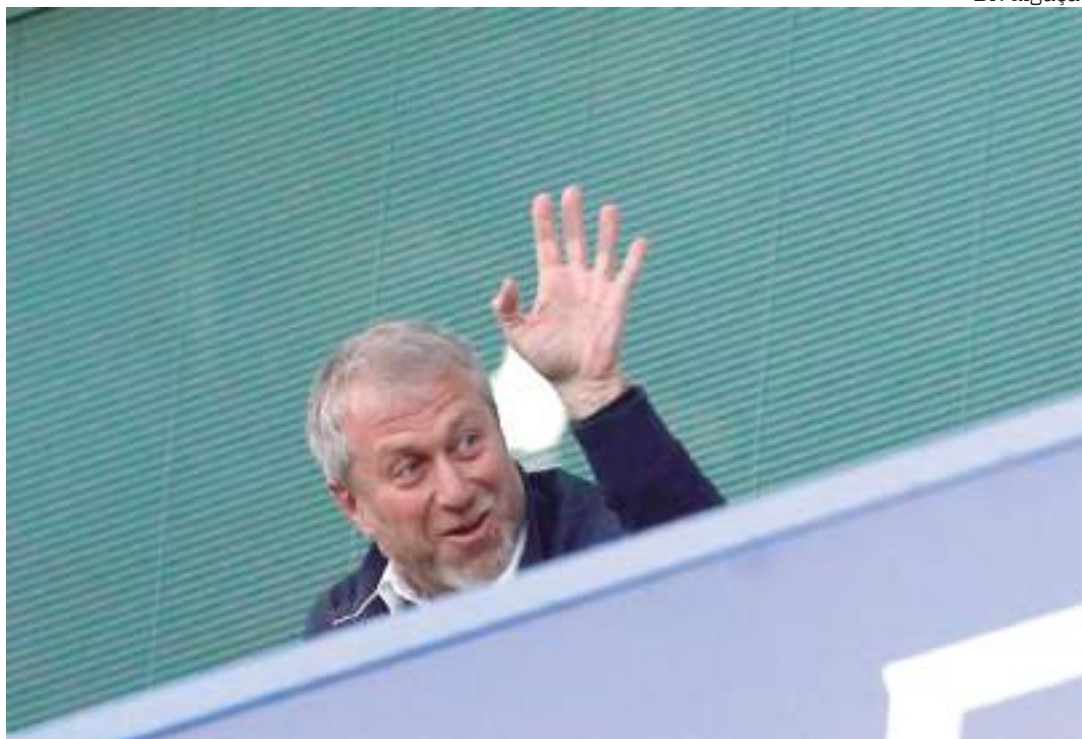
Roman Abramovich confirma que Chelsea está à venda e aceita a melhor proposta

O russo Roman Abramovich, de 55 anos, comprou o Chelsea em 2003. De lá para cá, os Blues viraram uma po-