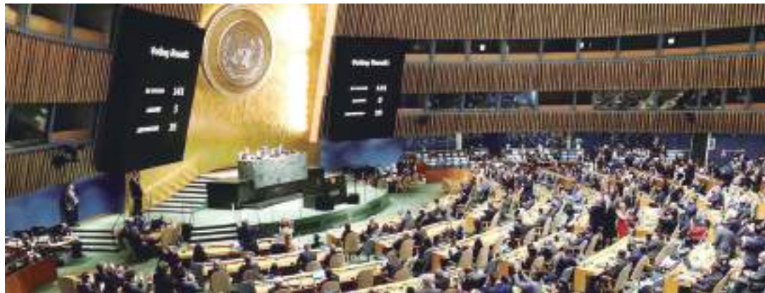
Decisão tem um poder político grande e evidencia o isolamento russo

Em sessão extraordinária da Assembleia Geral das Nações Unidas sobre a Ucrânia, na quarta-feira (2), 141 países votaram a favor da resolução que condena a invasão russa, cinco nações votaram contra e 35 se abstiveram. A resolução, que não tem poder legal, pede que a Rússia retire suas tropas. Apesar de não ser uma medida concreta, a decisão tem um poder político muito grande e evidencia o isolamento russo. O Brasil votou a favor. A China se absteve.