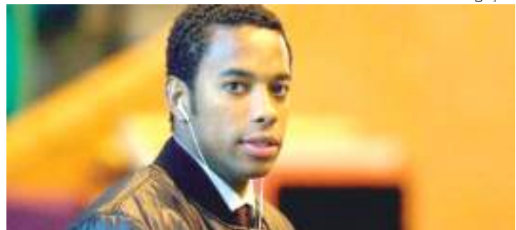
Robinho entra com liminar na Justiça para poder andar de patinete elétrico

De acordo com o 'UOL', Robinho quer que a Justiça lhe conceda "o direito à liberação e uso do patinete elétrico". O ex-jogador foi condenado na Itália por conta de violência sexual contra uma jovem albanesa, em 2013, quando atuava pelo Milan. Robinho e um grupo de homens teriam estuproado a mulher.