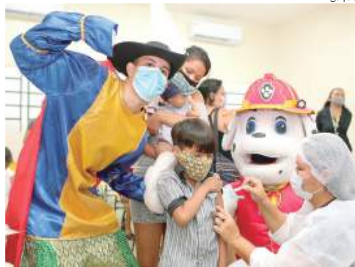
Prefeitura terá 47 pontos de vacinação contra Covid na capital amazonense

A Semsa, coordenadora da campanha de vacinação contra a Covid-19 em Manaus, disponibiliza a consulta às informações sobre documentos, critérios para receber a imunização (em todas as doses) e endereços dos locais de vacinação para todos os públicos no site da secretaria, pelo link https://semsa.manaus.am.gov.br e em cards, nos perfis oficiais nas redes sociais: @semsamanaua, no Instagram, e Semsa Manaus, no Facebook.