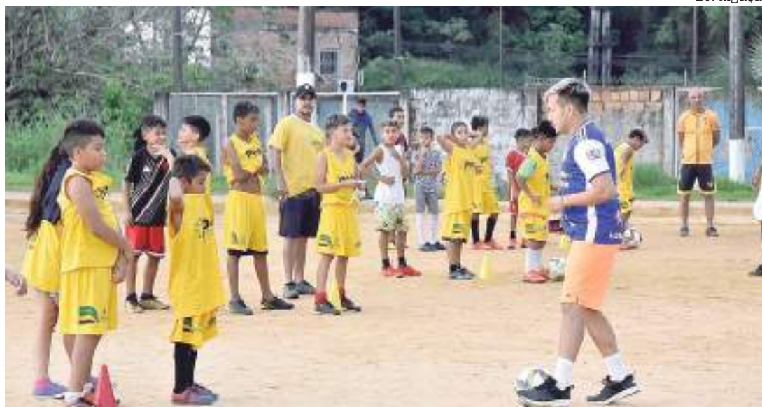
Governo do Amazonas, por meio da Faar, oferta 641 vagas gratuitas para aulas de esporte na capital amazonense

“O Pelci veio para fazer história e trazer grandes resultados tanto na capi-