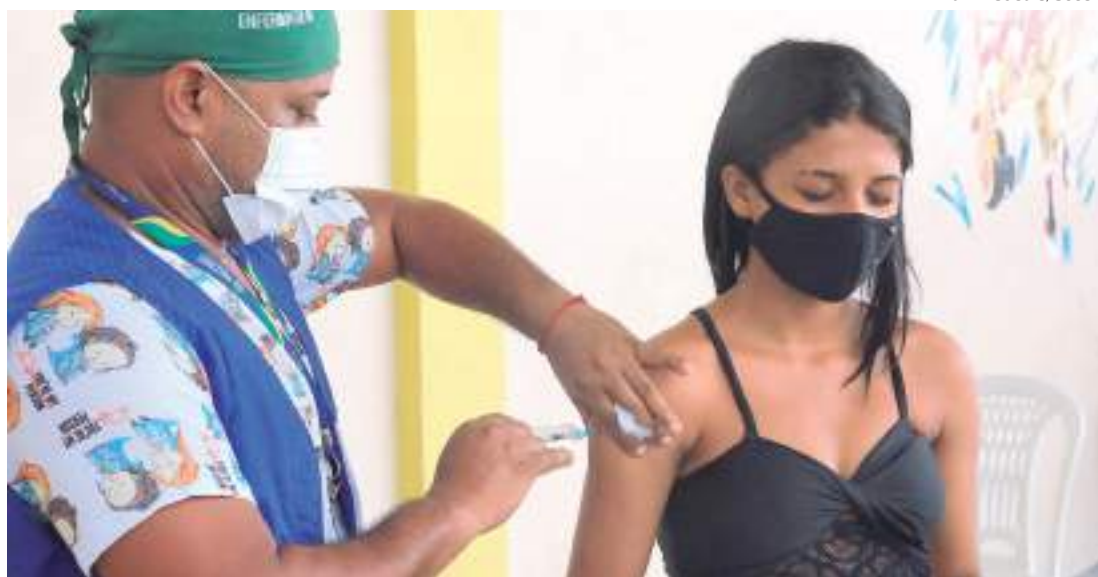
Pelo segundo dia consecutivo, Amazonas não registra óbito pela Covid-19 nas últimas 24 horas

Na capital, de acordo com dados da Prefeitura de Manaus, na terça-feira (1º), não ocorreu registro de sepultamento pela Covid-19. O bo-