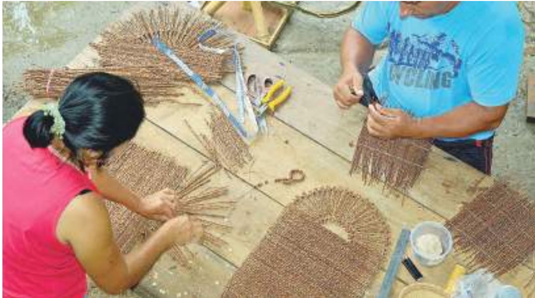
Com o apoio da Secretaria do Meio Ambiente, Fundação investe na economia verde no Amazonas

Garantir formação empreendedora, capacitações, parcerias e apoio financeiro para desenvolver negócios sustentáveis na Amazônia. Essas são as estratégias de empreendedorismo executadas pela Fundação Amazônia Sustentável (FAS) em Manaus e em Unidades de Conservação (UCs) no interior do Amazonas.