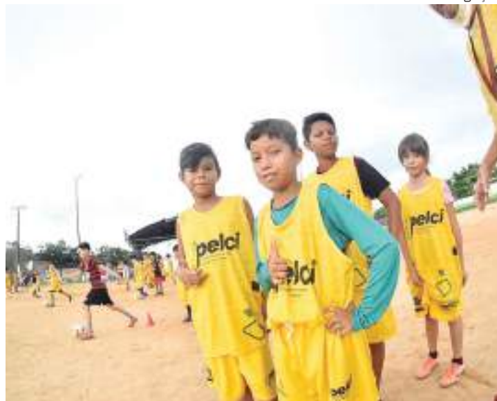
Para concorrer a uma das vagas a crianças tem de estar estudando