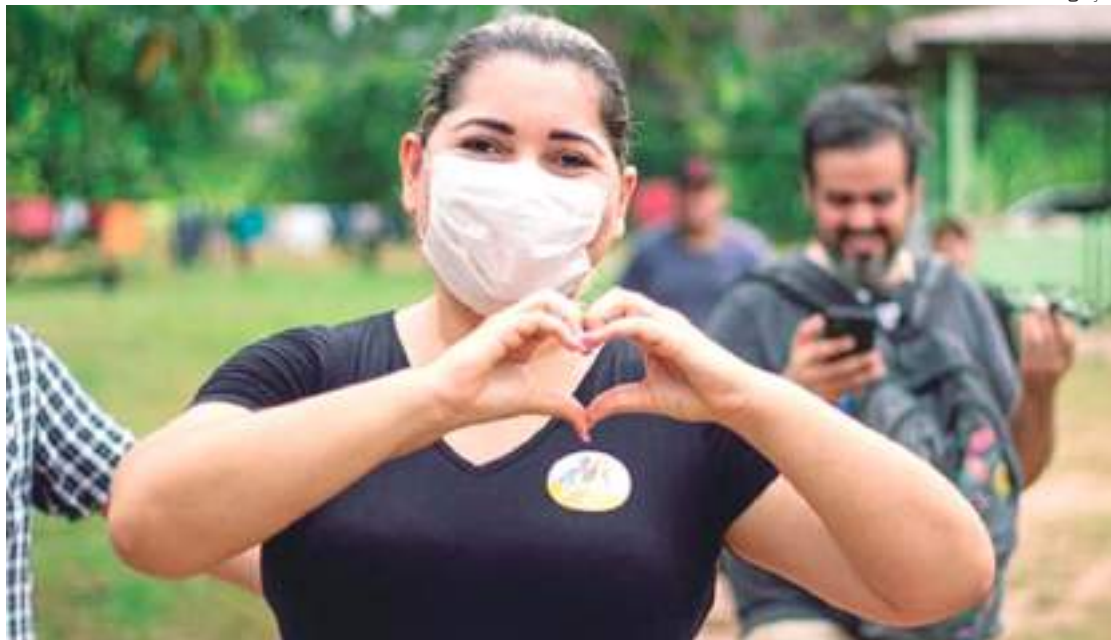
Órgão aceitou denúncia contra a prefeita por supostamente favorecer empresários em licitação

“Assim, ao fim, considerando os indícios de irregularidade na condução do certame, em razão do eleva-