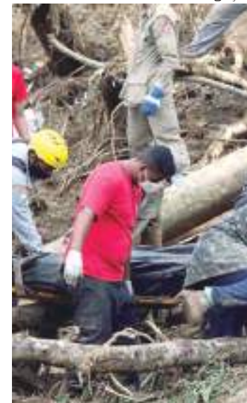
Mais de 200 pessoas foram enterradas no cemitério da cidade

Segundo o estudo, 65,8% dos comerciantes tiveram perda ou queda de faturamento e 32,4% tiveram seus estabelecimentos ou depósitos alagados. O levantamento ouviu 245 comerciantes entre os dias 16 e 17 de fevereiro.