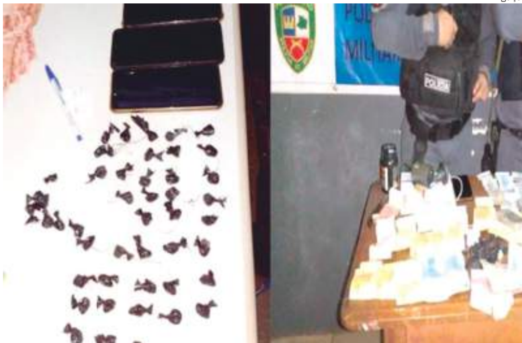
Criança de 10 anos estava com drogas e R$ 1.130 em espécie dentro de uma casa na cidade de Urucurituba

O flagra aconteceu no bairro Liberdade, daquele município, depois que vizi-