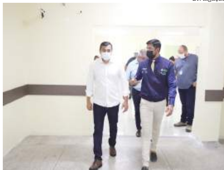
Governador lançou a campanha "Show de Vacinação" em Manaus

"Essa é mais uma parceria que nós estamos fazendo com produtores de eventos. Quem se vacinar lá recebe um ingresso para ir depois, em outro momento, lá nessa casa noturna. A gente tem feito aqui no estado um trabalho de conscientização para que as pessoas possam se imu-