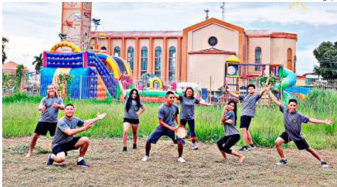
Projeto que nasceu em Manaus foi parar em Parintins