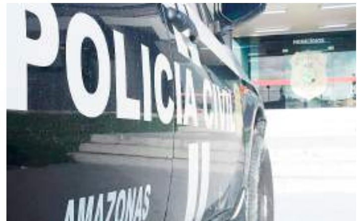
DEHS conseguiu aumentar em 169,2% a elucidações de homicídios

A operação Anomia, deflagrada no início deste mês de