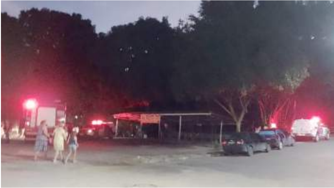
Corpo de homem encontrado em igarapé foi achado por moradores do conjunto Tocantins