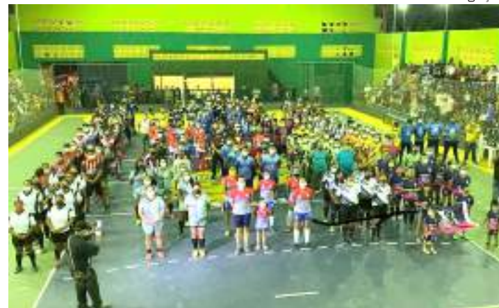
Faar anunciou nome dos municípios aptos para receber ajuda do governo

A Fundação publicará no dia 22 de março o resultado dos municípios que receberão, o incentivo do edital.