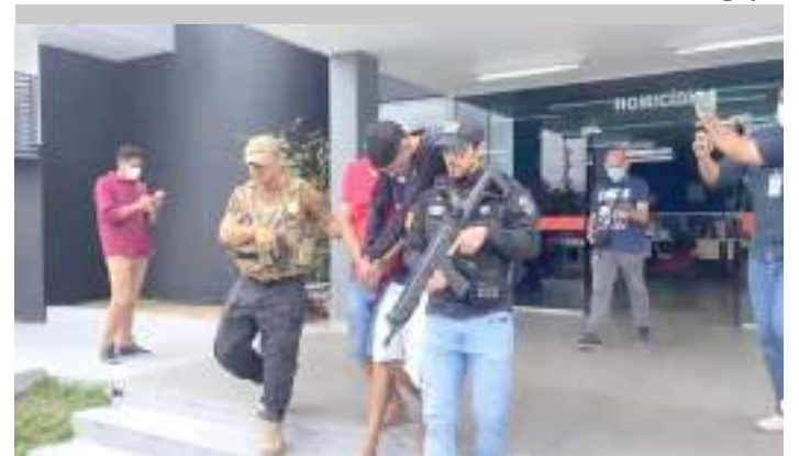
Dupla de supostos sequestradores foi presa pela Polícia Civil

Durante a ação policial, as informações levaram as equipes até uma área de mata, no bairro Mauazinho, onde a vítima estava sob o poder de criminosos que, ao perceberem a chegada da