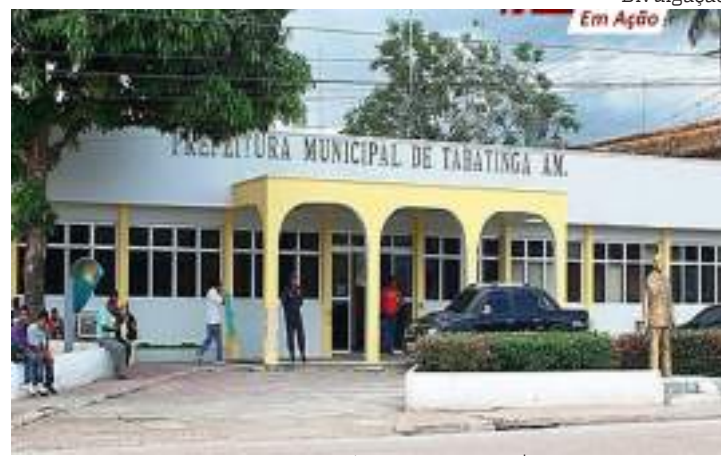
MPAM investiga compra de combustíveis no valor de R$ 6 mi para Tabatinga

A Prefeitura Municipal tem o prazo de três dias para apresentar cópia integral do procedimento licitatório, bem como do estudo prévio realizado pelas Secretarias Municipais que vincularam a licitação do combustível.