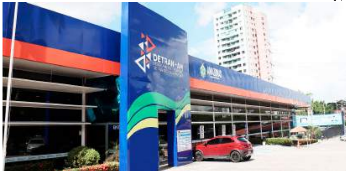
Concurso público do Detran Amazonas oferta 183 vagas para os níveis superior e médio

No nível superior, as vagas disponíveis são para