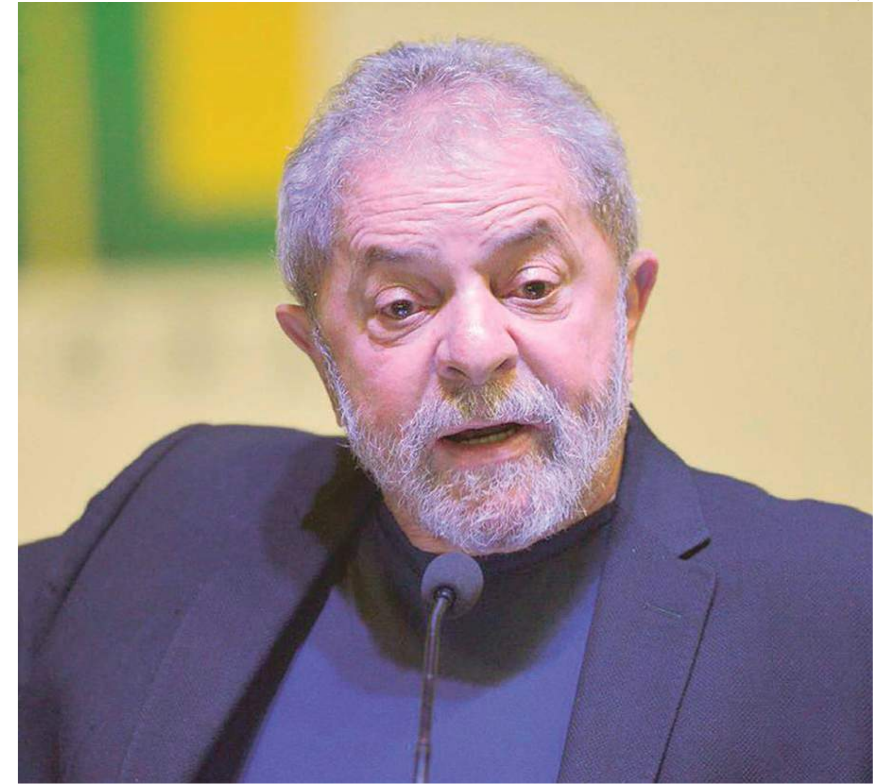
O petista também disse que é preciso colocar em segundo plano o "compromisso fiscalista" do governo de Jair Bolsonaro (PL)

Essa não é a primeira vez que Lula critica o mecanismo. Em entrevista a blogueiros no começo do ano, afirmou que a desigualdade social deve ser colocada como prioridade do governo federal, e