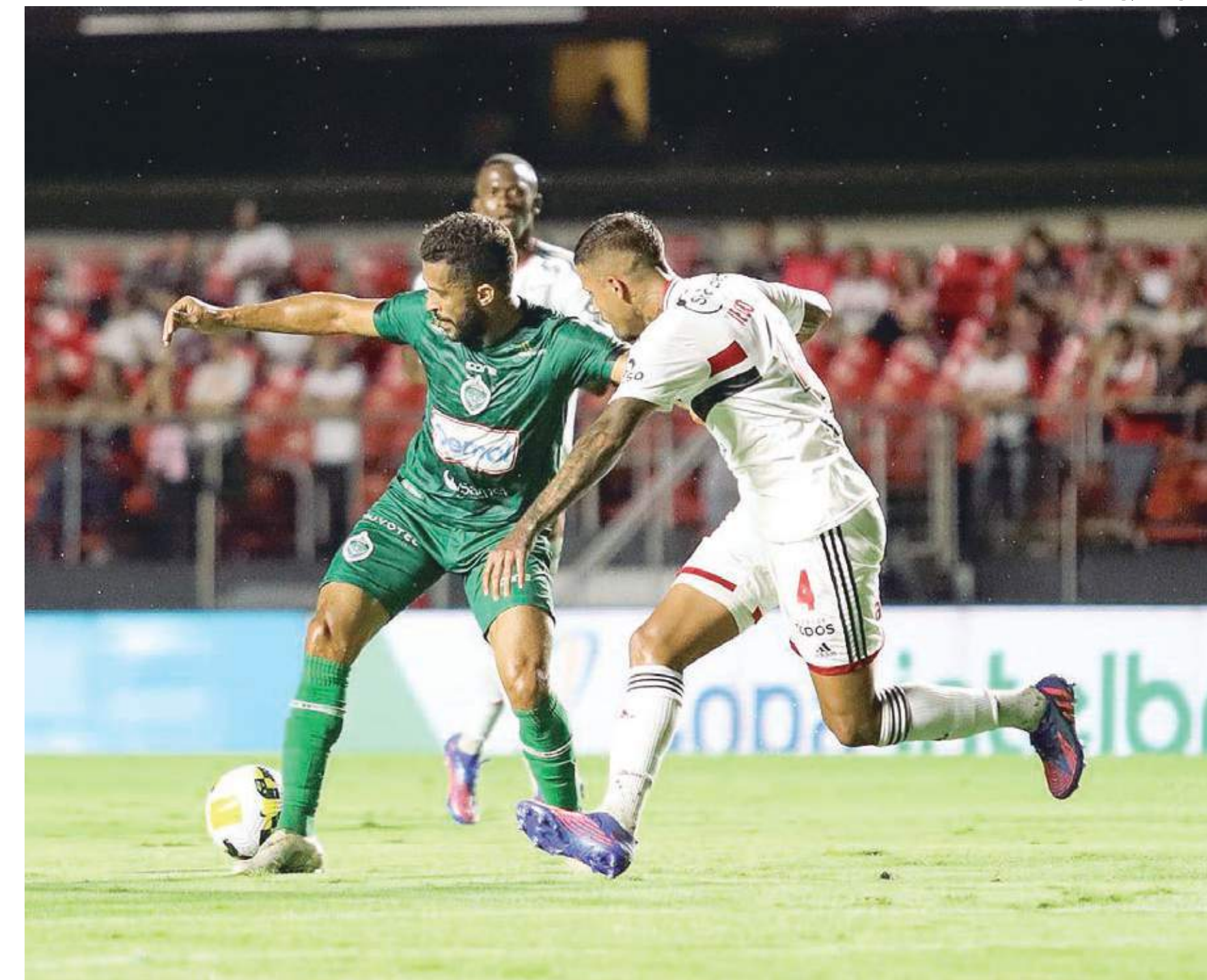
Ao todo, 17.644 pessoas estiveram no Morumbi para acompanhar o jogo

Um caso inusitado aconteceu durante o jogo, aos 45 minutos da primeira fase, o Morumbi sofre