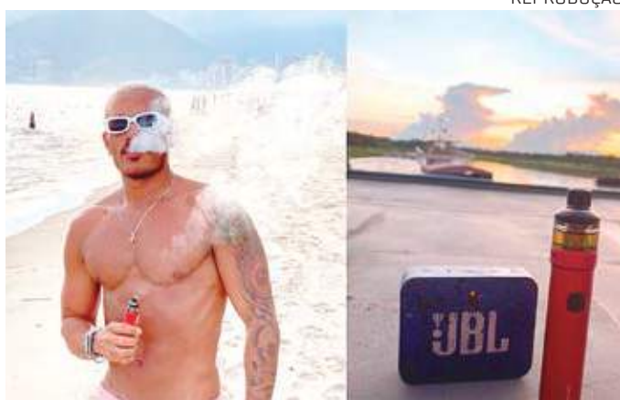
Jovem teve pneumonia química causada por cigarro eletrônico

"O cigarro eletrônico é prejudicial à saúde pulmonar por expor os pulmões à fumaça, ao material particulado. Alguns possuem propilenoglicole na fumaça, que ao ser exalada pode levar a reações de hipersensibilidade, pneumonites e broncoespasmos. Embora pareçam