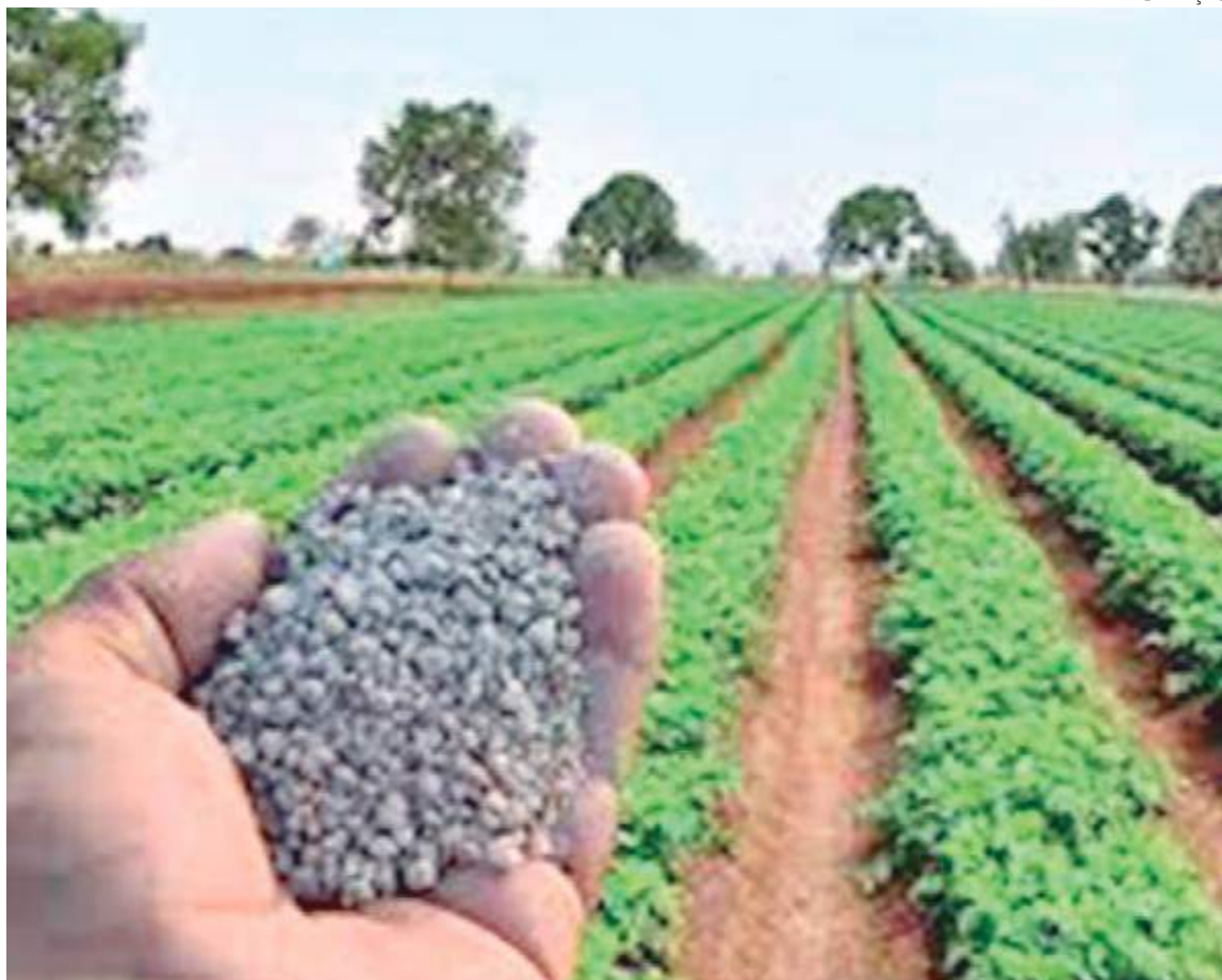
25% das importações brasileiras de fertilizantes são provenientes da Rússia

O país da América do Norte é hoje o maior produtor mundial de potássio. Segundo fontes do governo brasileiro, no entanto, não houve um aceno concreto de aumento na exportação ao Brasil.