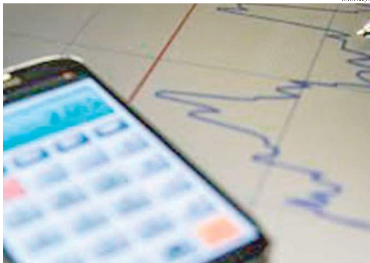
Juros mais altos enfraquecem consumo

sado, o Copom tinha elevado a taxa em 0,75 ponto percentual em cada encontro. No início de agosto, o BC passou a aumentar a Selic em 1 ponto a cada reunião.