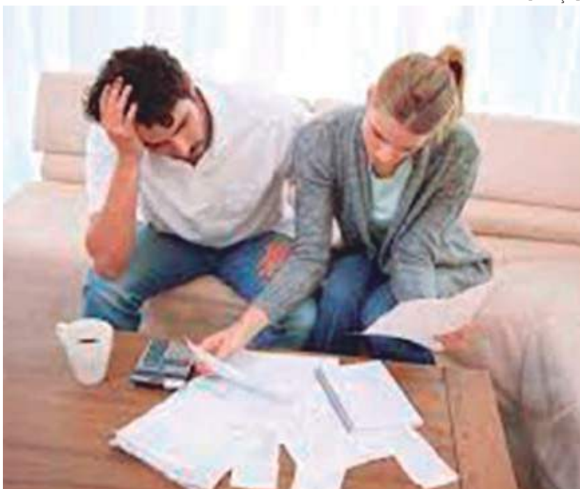
Mais de 190 mil famílias estão endividadas em Manaus

De acordo com dados da Pesquisa de Endividamento e Inadimplência (Peic), produzida pela Confederação Nacional do Comércio de Bens, Serviços (CNC), mais de 190 mil famílias em Manaus possuem contas em atraso referente ao mês de fevereiro de 2022. O levantamento aponta, ainda, que 16,2% não terão condições de pagá-las.