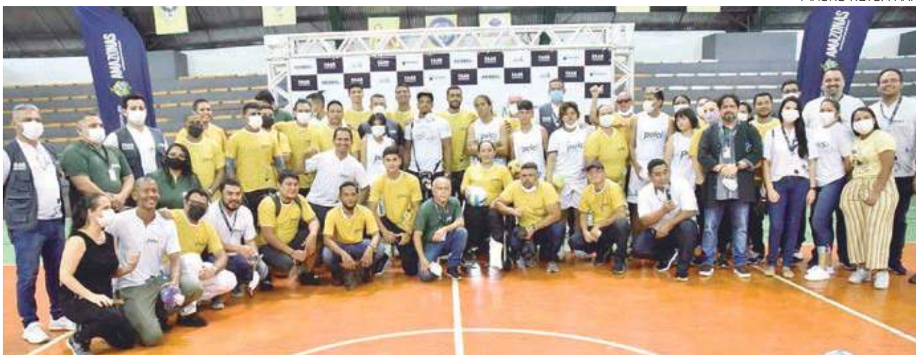
Além do Ginásio Renné Monteiro, o Pelci conta com mais quatro núcleos ativos

O Ginásio Poliesportivo Renné Monteiro e a quadra da Escola Estadual Solon de Lucena serão núcleos de atividades esportivas do Projeto Esporte e Lazer na Capital e Interior (Pelci).