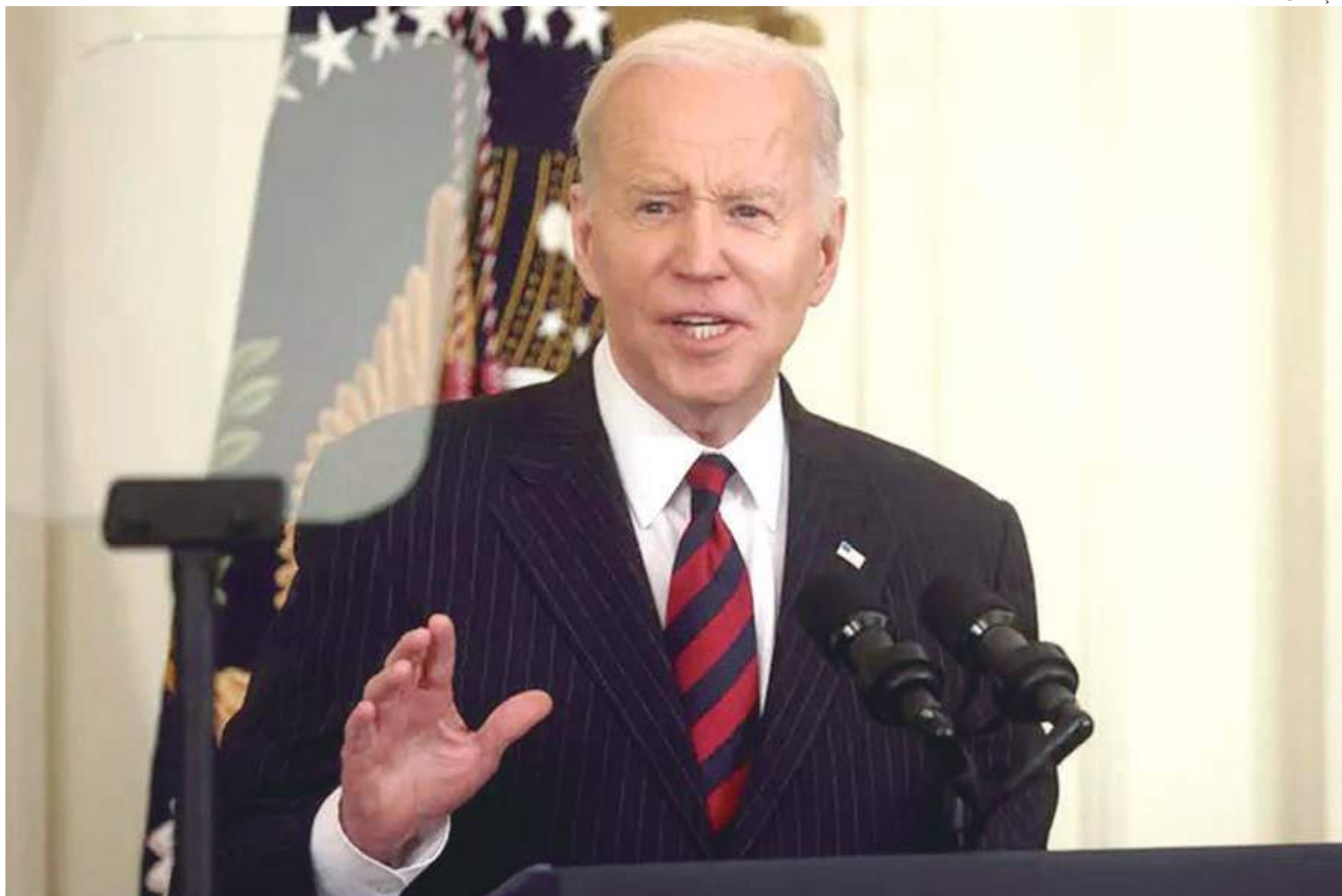
Biden disse a repórteres que Putin é um criminoso de guerra e a fala ofendeu o Kremlin