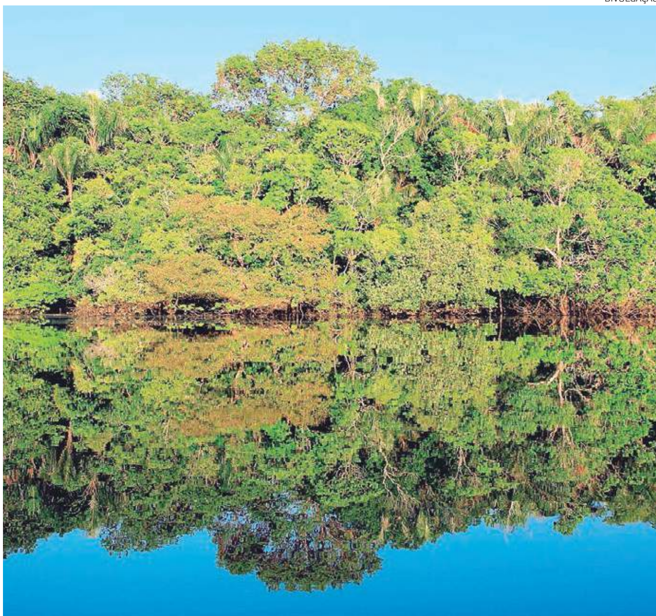
A conservação da Floresta Amazônica precisa ser objetivo da comunidade global, diz pesquisadora

O estudo revelou que mais de 75% da floresta amazônica vem perdendo resiliência desde o início dos anos 2000,