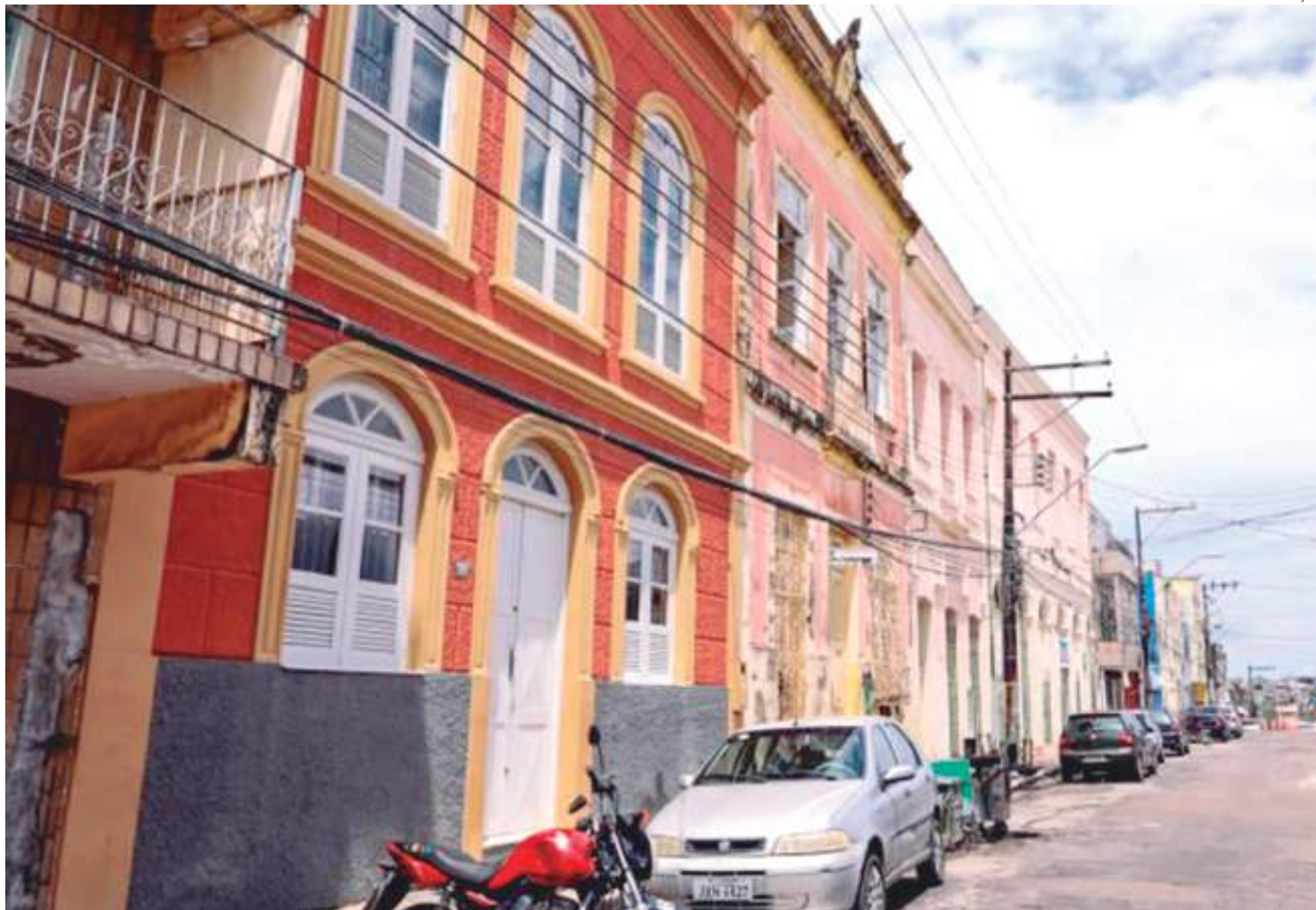
Rua Frei José dos Inocentes no Centro Histórico de Manaus vai passar por revitalização

Como se trata de área histórica, a intervenção tem cuidado da conservação do ambiente e das fachadas centenárias