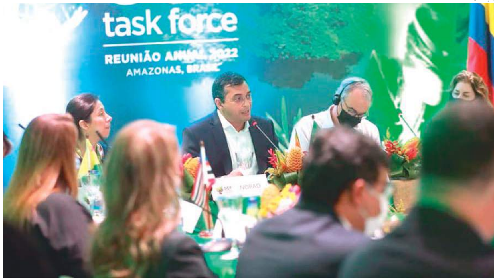
Em reunião prévia, realizada nesta quarta-feira (16), o governador destacou os avanços ambientais do Amazonas

Na ocasião, Wilson Lima lança o programa Guardiões da Floresta, uma reestruturação do antigo Bolsa Floresta, que agora passa a ser administrado pelo Estado. Novos modelos de desenvolvimento para o futuro do planeta, priorizando a conservação ambiental e respeitando as populações tradicionais, são os focos dos debates internacionais que acontecerão na Reunião Anual do GCF, força-tarefa presidida pelo governador do Amazonas