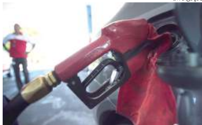
Entenda as propostas que devem ser votadas em 8 de março

"O encaminhamento que a Presidência faz é que tenhamos a clareza que o projeto foi suficientemente discutido na tarde de hoje. Se há necessidade de tempo para reflexão, daremos esse tempo para reflexão, como o compromisso de na próxima sessão do Senado, após o carnaval,