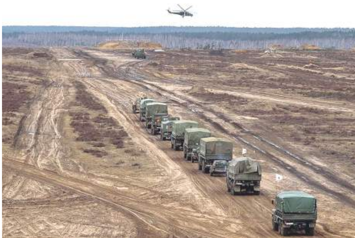
Deslizamentos provocaram mortes e destruição no Alto da Serra, em Petrópolis

As forças russas são em grande parte tropas baseadas em terra, incluindo mais de 120 batalhões de grupos táticos. Mas Putin também deslocou mais de duas dúzias de navios de guerra no Mar Negro, incluindo navios de desembarque com fuzileiros navais a bordo, e conta com forças significativas de artilharia e mísseis, segundo a autoridade.