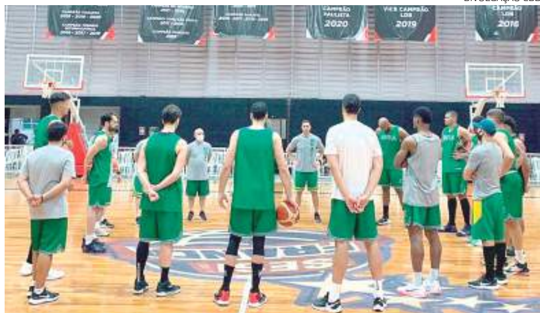
Os jogos no Pedrocão acontecem na sexta-feira (25), 19h10

Os jogos no Pedrocão acontecem na sexta-feira (25), 19h10, contra o Uruguai; e na segunda, 28, às 20h, diante da Colômbia.