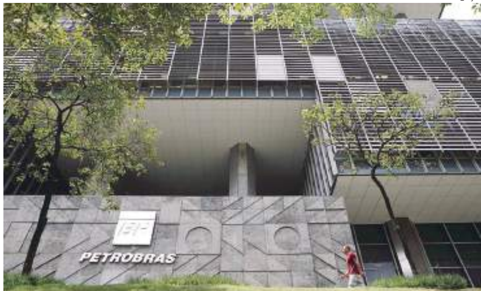
Sede da Petrobras no Rio de Janeiro

Em 2021, o preço médio do petróleo Brent ficou em US$ 70,73, uma alta de 69% em relação ao valor médio registrado no mês