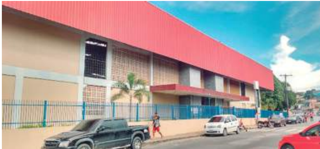
Escola está localizada no bairro São José, Zona Leste de Manaus

As vítimas foram levadas ao Hospital e Pronto-Socorro João Lúcio, localizado no bairro São