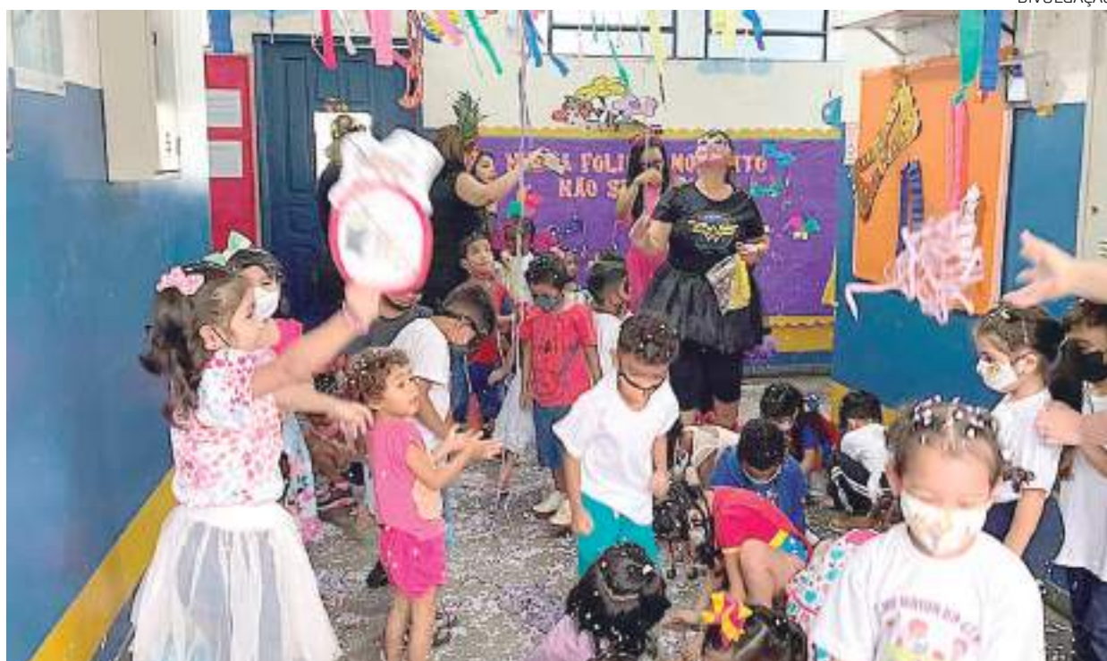
A unidade de ensino atende 235 crianças de 3 a 5 anos de idade

"Não podemos deixar água em balde sem tampa, pois o mosquito pode crescer e vamos ficar com dor de cabeça, febre e pode ser dengue", explicou a foliã mirim.