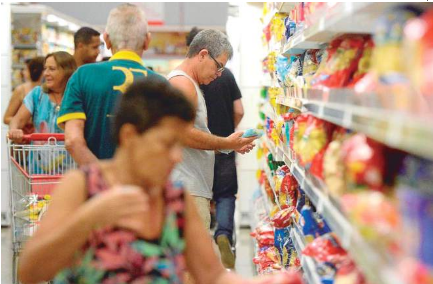
Índice apontou resultado mais otimista do que o de fevereiro do ano passado