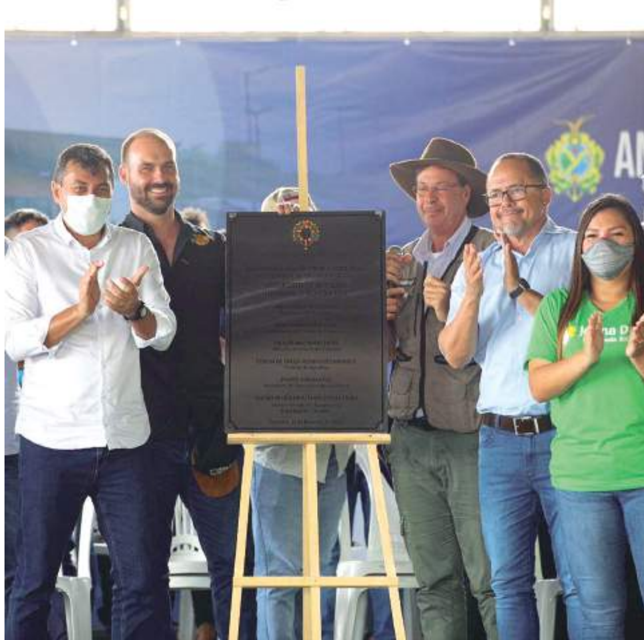
O novo terminal é adaptado para Pessoas com Deficiência (PcD) e conta com segurança e reforço no combate a incêndio