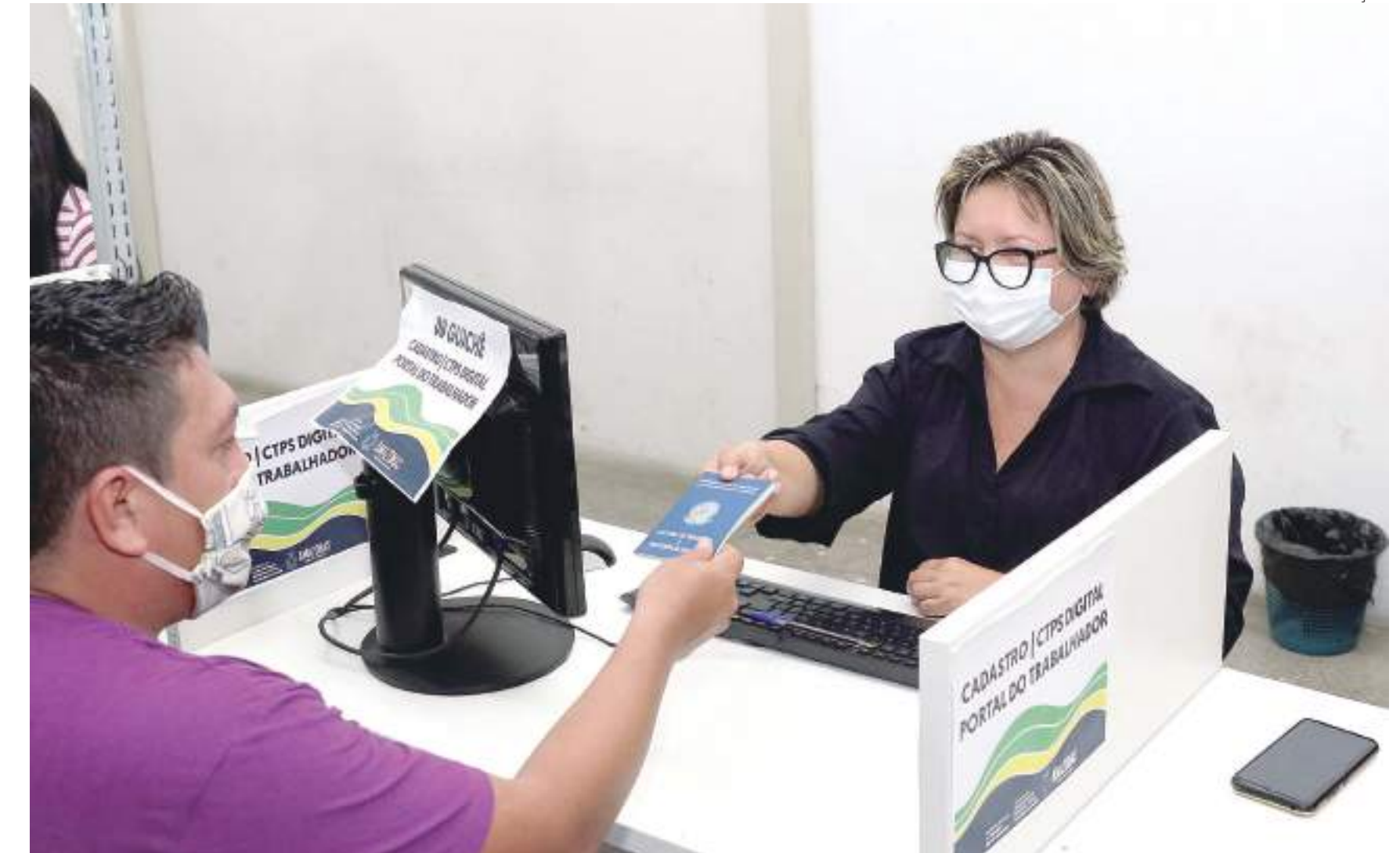
Estado fechou o ano passado com 35.141 novas pessoas inseridas no mercado de trabalho

Os setores que mais contribuíram para este saldo positivo de admissões foram: Serviços, com 13.343 ad-