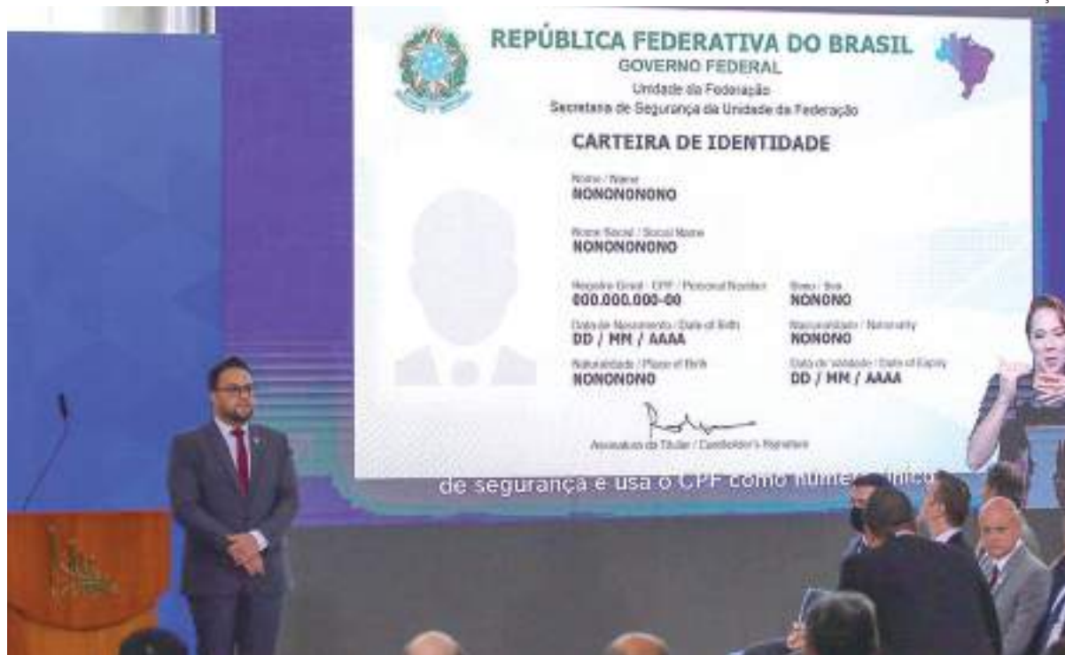
Documento terá CPF como número e contará com versão digital

O ministro da Justiça e Segurança Pública, Anderson Torres, lembrou que, da forma como está hoje, os cidadãos poderiam ter até 27 documentos de identidade com números diferentes emitidos pelas unidades da federação, o que facilitava a prática de diversas fraudes e crimes. "A gente