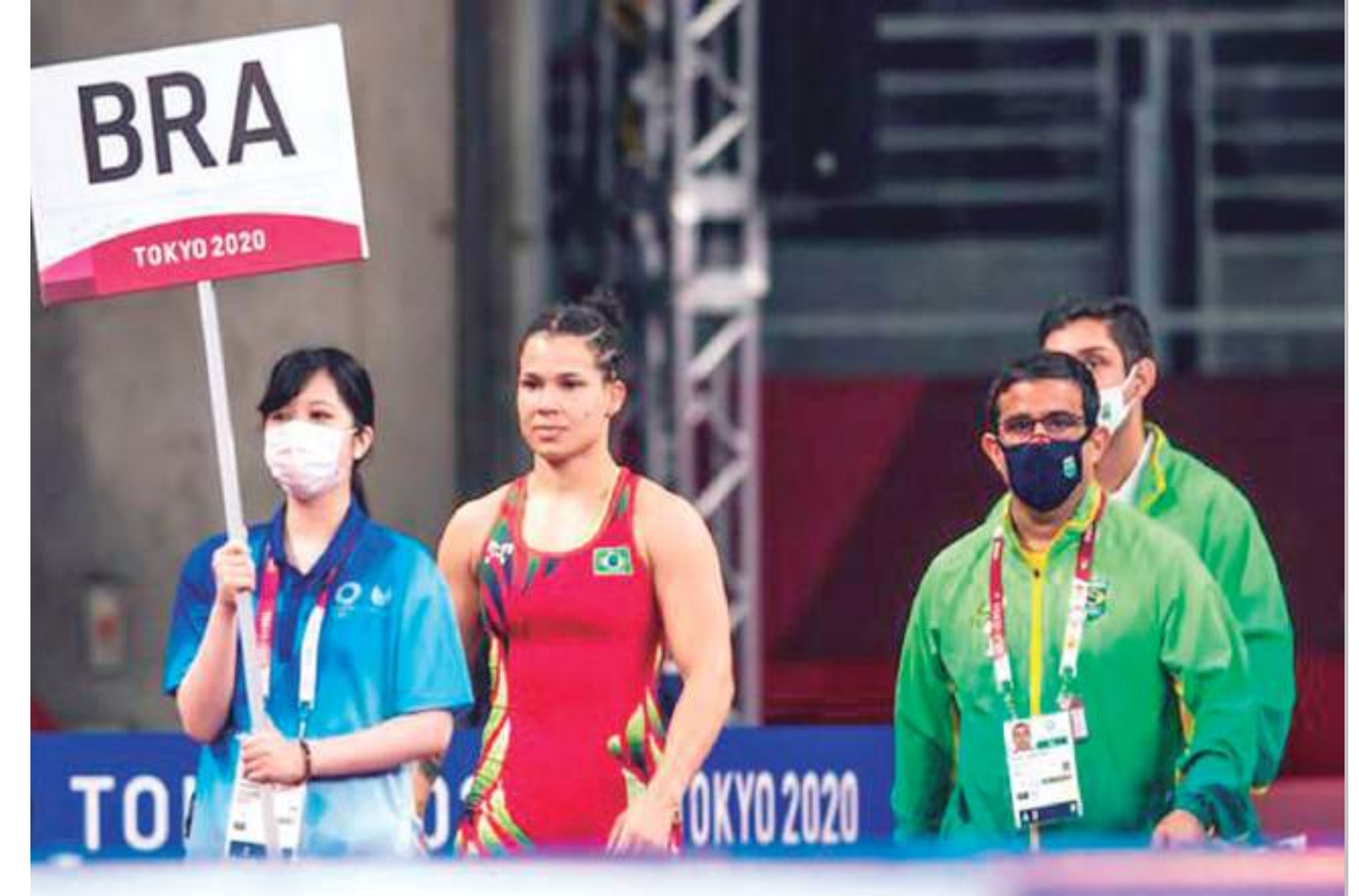
Além do primeiro na Turquia, serão disputados em junho, os Rankings Series do Cazaquistão e da Itália