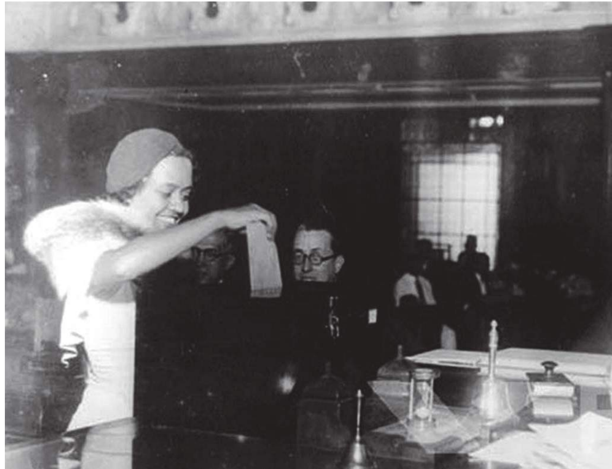
Celina Guimarães Viana foi uma professora brasileira e primeira eleitora de que se tem registro oficial no Brasil

Tais restrições acabaram segmentando ainda mais a participação feminina nas decisões eleitorais, especialmente mulheres negras e indígenas (as quais, em sua maioria, se enquadravam na parcela de baixa renda e analfabeta do país).