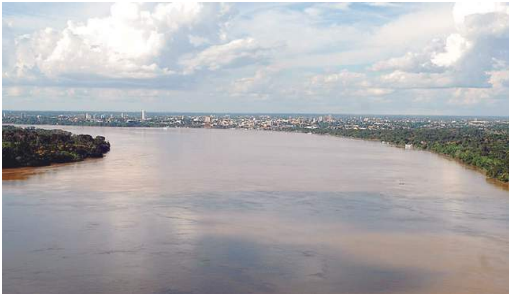
Rio Madeira é, principalmente, usado pelo homem para transporte hidroviário, irrigação agrícola e pesca

A privatização é um projeto de Jair Bolsonaro para custear a limpeza do rio. Caso a proposta seja aceita, 200 mil pessoas podem ser afetadas