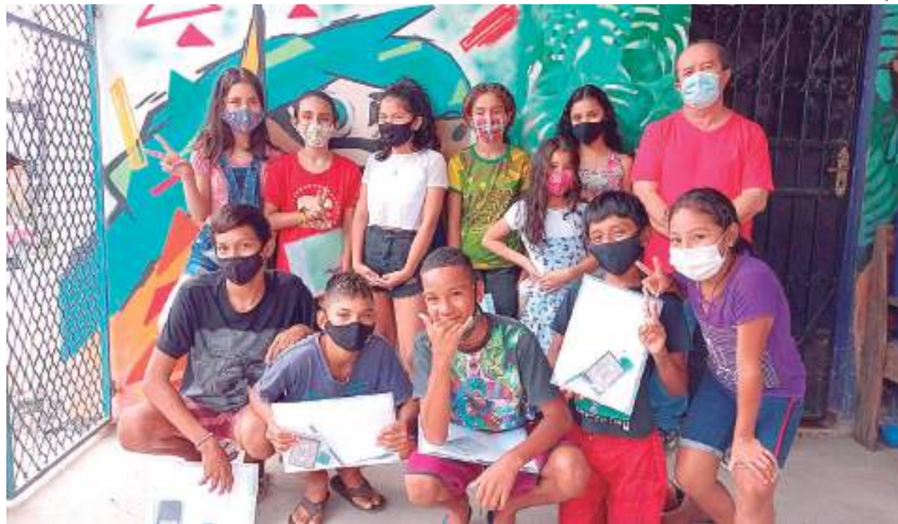
O projeto segue para a segunda etapa de atividades, que concentra na entrevista dos moradores mais antigos

"As oficinas têm sido uma ótima oportunidade para visualizarmos habilidades e competências dessas crianças e assim pensarmos de que modo podemos aproveitar a potencialidade dessas crianças em