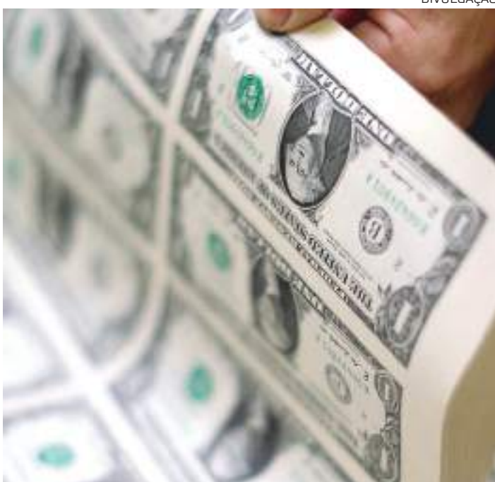
Bolsa não resistiu a pressões externas e caiu 1,01%

Beneficiado pelos altos juros no Brasil e pela valorização mundial das commodities (bens primários com cotação internacional), o dólar caiu para R$ 5 pela primeira vez desde junho do ano passado. O otimismo no mercado de câmbio não se estendeu à bolsa, que caiu cerca de 1% com o agravamento das tensões entre Rússia e Ucrânia.