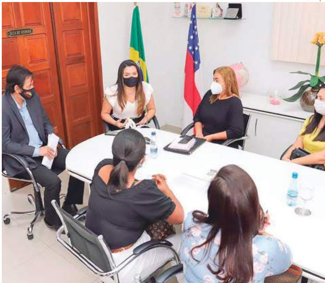
Alessandra Campêlo, secretária de Assistência Social do Amazonas, ressalta o esforço em conjunto do setor

“Vale ressaltar que, durante a pandemia e nesse momento de certo controle, temos uma pandemia social. O desemprego aumentou, as famílias diminuíram as condições de trabalho e renda, por isso, é importante esse esforço conjunto para minimizarmos o impacto dessa pandemia”, enfatizou a secretária da Seas.