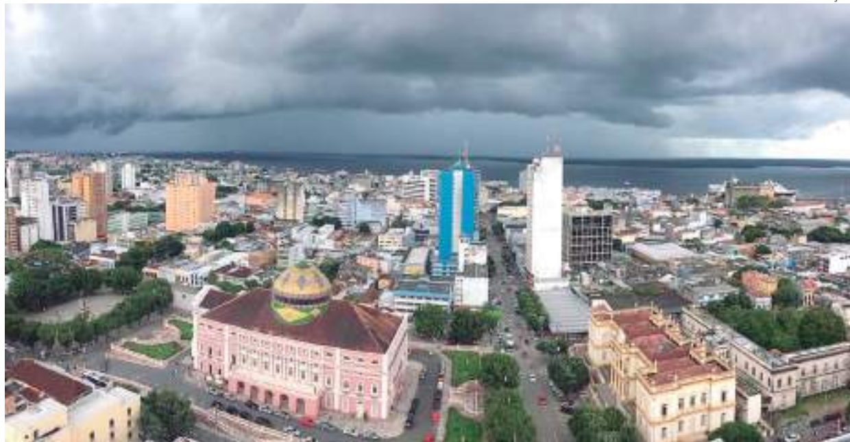
Margens dos Igarapés do Mindú, Goiabinha, Passarinho, Bolívia, Barrí Branco e Franco eram alguns dos locais de risco