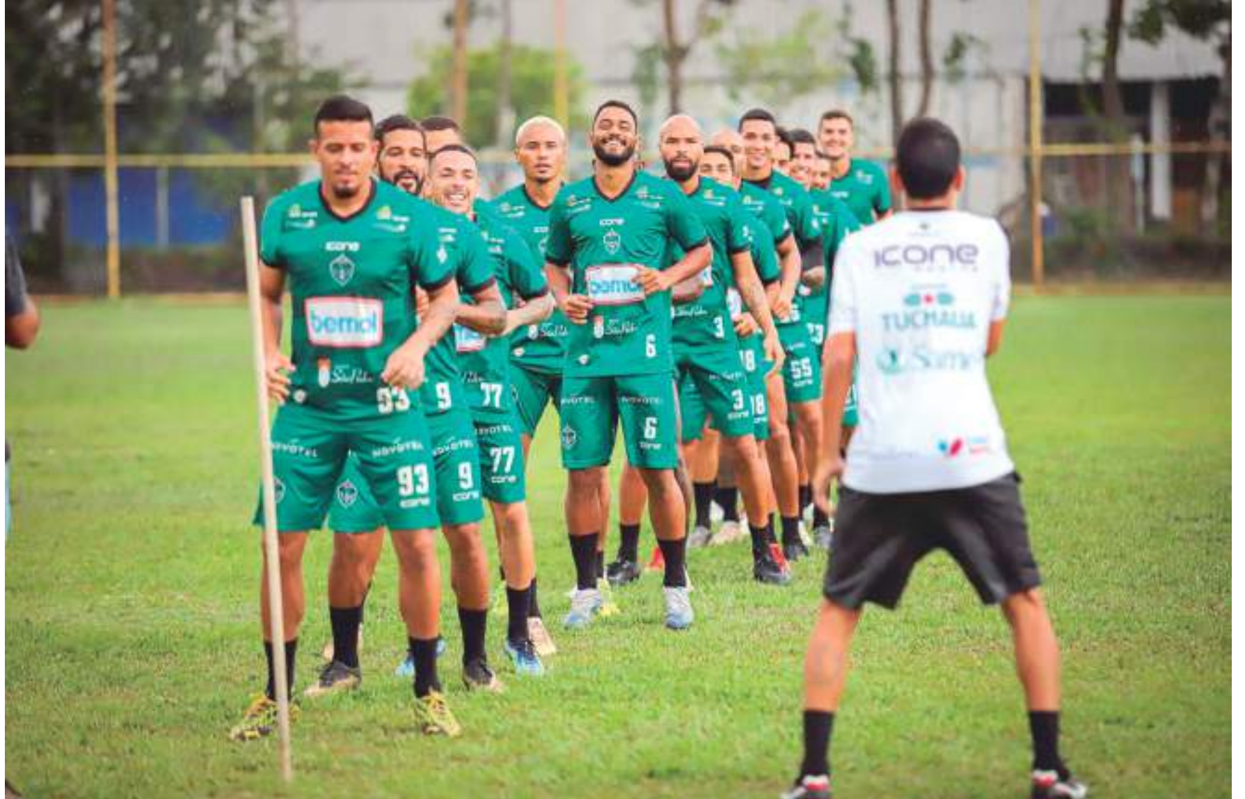
A data do jogo ainda não está definida pela Confederação Brasileira de Futebol (CBF)

Antes de enfrentar o São Paulo, o Gavião do Norte volta a atenção para a partida contra o Iranduba, no Estádio Álvaro Maranhão, neste domingo (27), pela 9ª rodada do Campeonato Amazonense. O clube está na liderança do Estadual e precisa se manter na ponta da tabela.