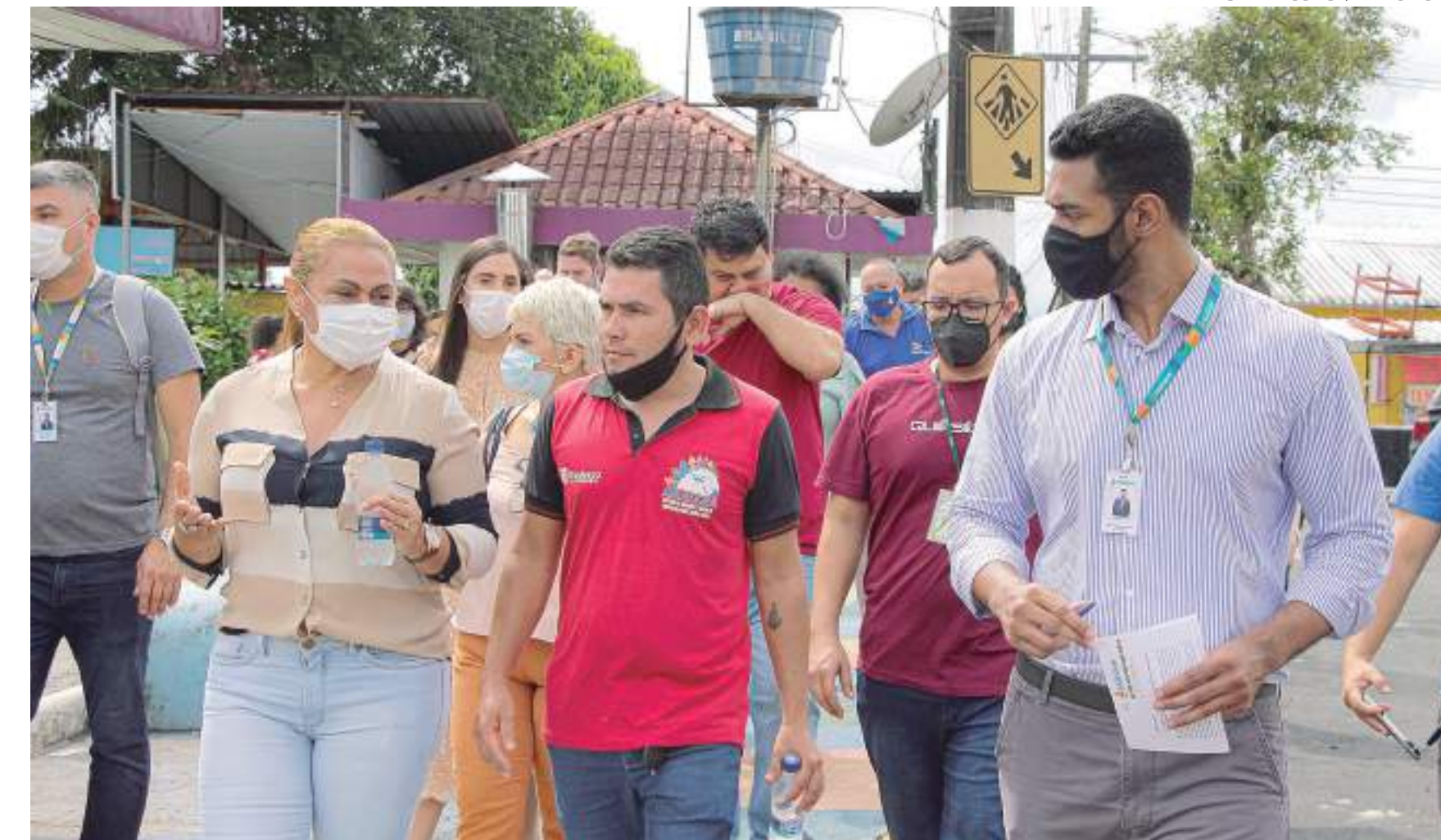
A construção do Memorial Encontro das Águas – Parque Rosa Almeida, na Zona Leste, ainda está em projeto, na fase de prospecções e etapa de estudos

“Estamos seguindo a determinação do prefeito David Almeida, que temo compromisso de transformar a área em uma atração turística. Estamos dando continuidade às nossas ações de planejamento e integração da comunidade com o memorial. E, agora, estamos fazen-