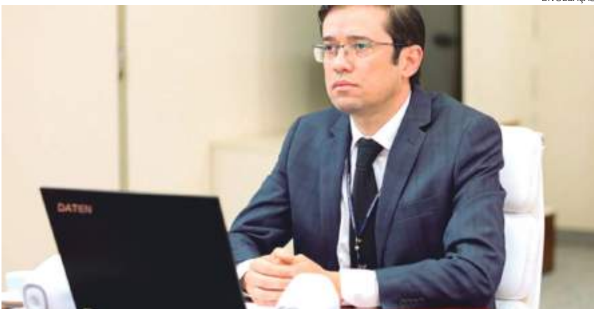
O novo diretor-geral da PF é delegado da instituição desde 2003