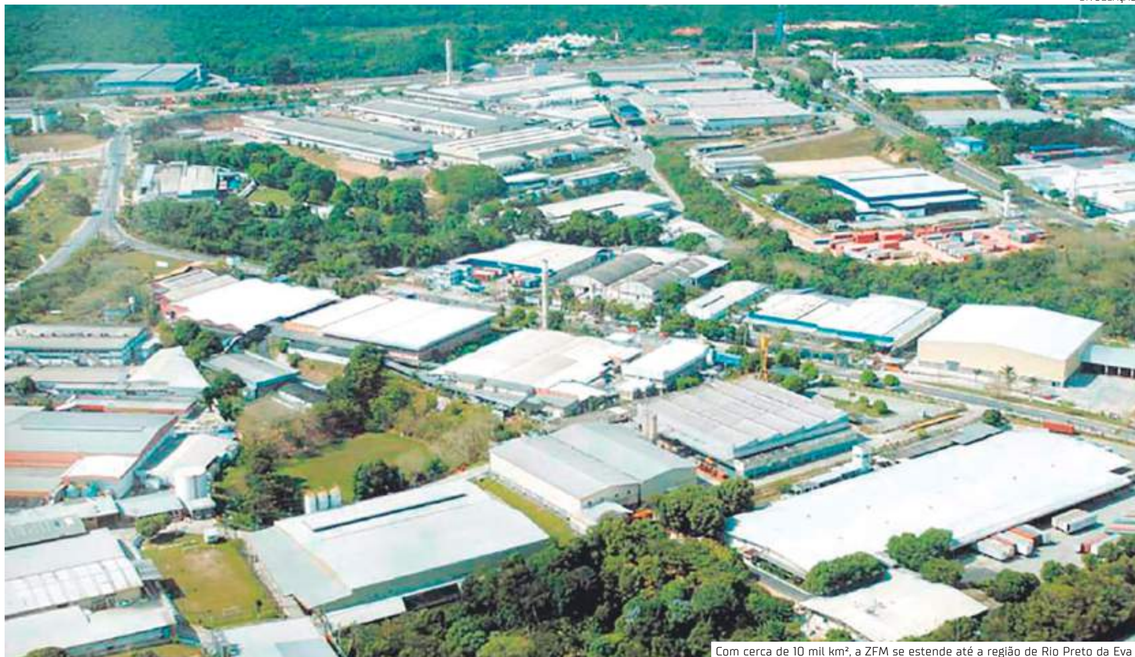
Com cerca de 10 mil km², a ZFM se estende até a região de Rio Preto da Eva

Modelo econômico também trouxe vantagens de preservação para floresta amazônica