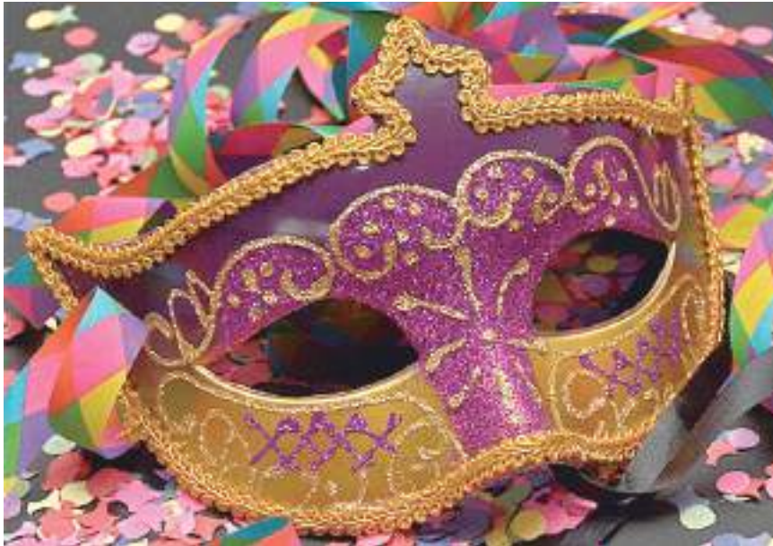
Por enquanto, os grandes eventos ainda estão suspensos em Manaus

"Andei, andei até me cansar, porque não vi quase nada sendo oferecido nas lojas. Eu estava tão empolgada e acabei ficando 'borcoxô' para fazer a confraternização. Vou continuar andando para ver se, ao menos, acho uns confetes", relata.