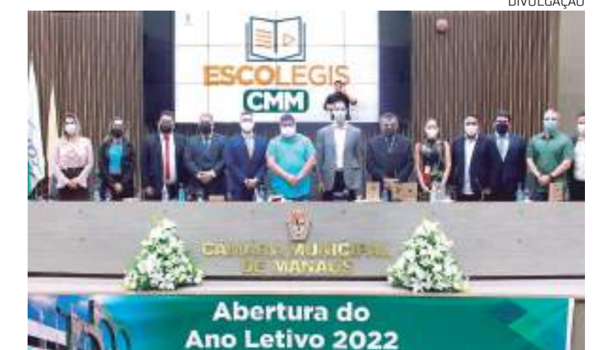
Este ano, a Escola do Legislativo completa 15 anos de funcionamento

“Os cursos online, prioridade no programa EscolegisCMM, vão ao encontro da realidade pós pandemia, e se tornaram imprescindíveis nesse cenário atual, para dar condições aos cidadãos de brigar de