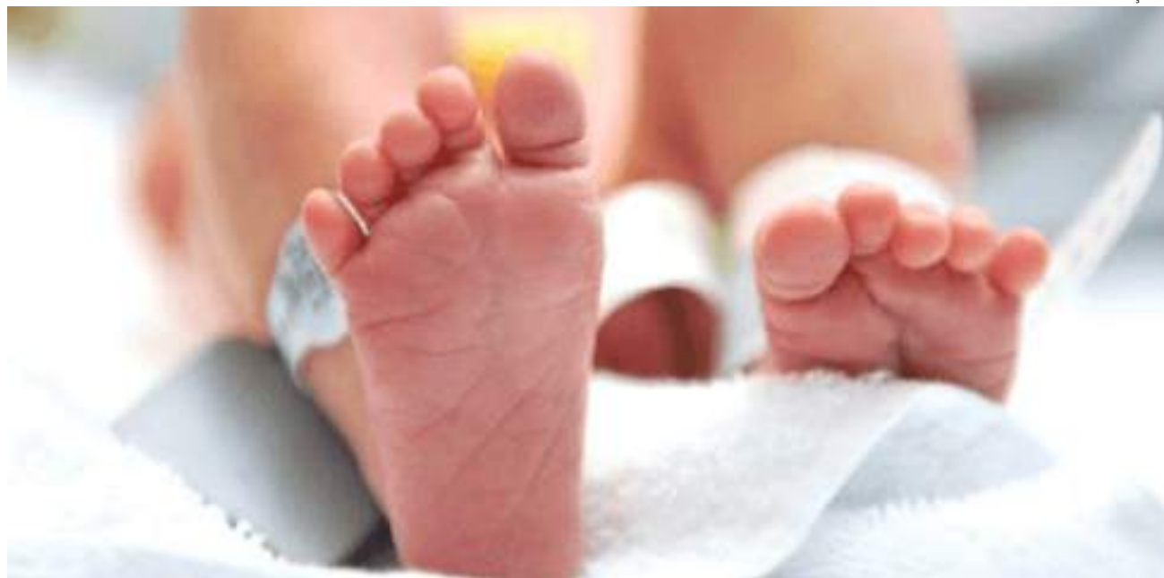
Por conta do nome e do sexo incorreto, família não consegue comprar medicamentos necessários para o tratamento da filha, que possui HAC

O registro do bebê como sendo do sexo masculino aconteceu após médicos informarem aos pais que a criança era menino. Porém, dias depois, o exame cariótipo mudou os rumos da família por diagnosticar que o bebê possuía