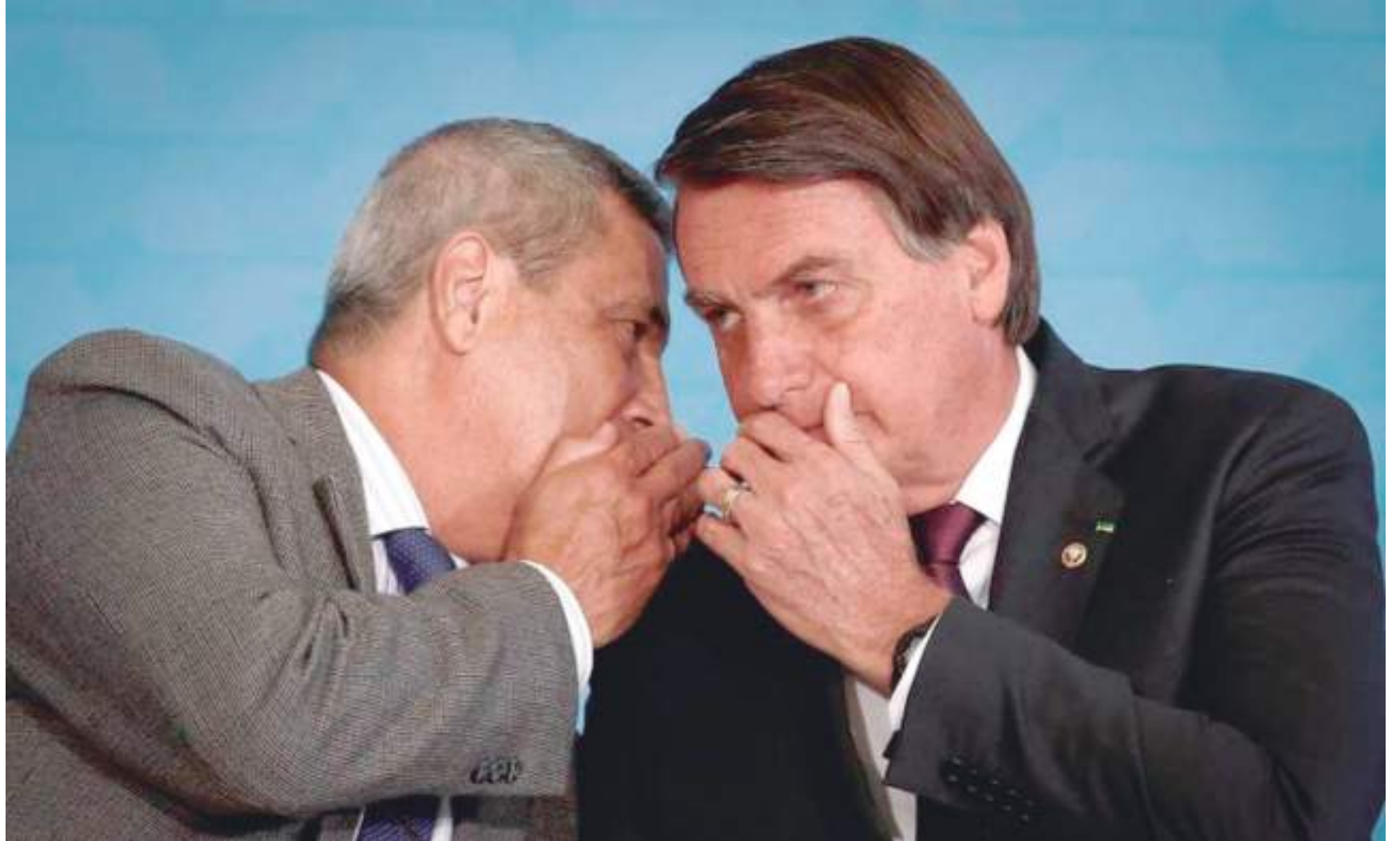
Antes de delegar Braga Netto para tomar as decisões sobre guerra, Bolsonaro desautorizou o vice-presidente após fala que condenava invasão russa

A delegação de Braga Netto para tratar do assunto ocorre depois de Bolsonaro desautorizar Mourão sobre falas defendendo soberania ucraniana.