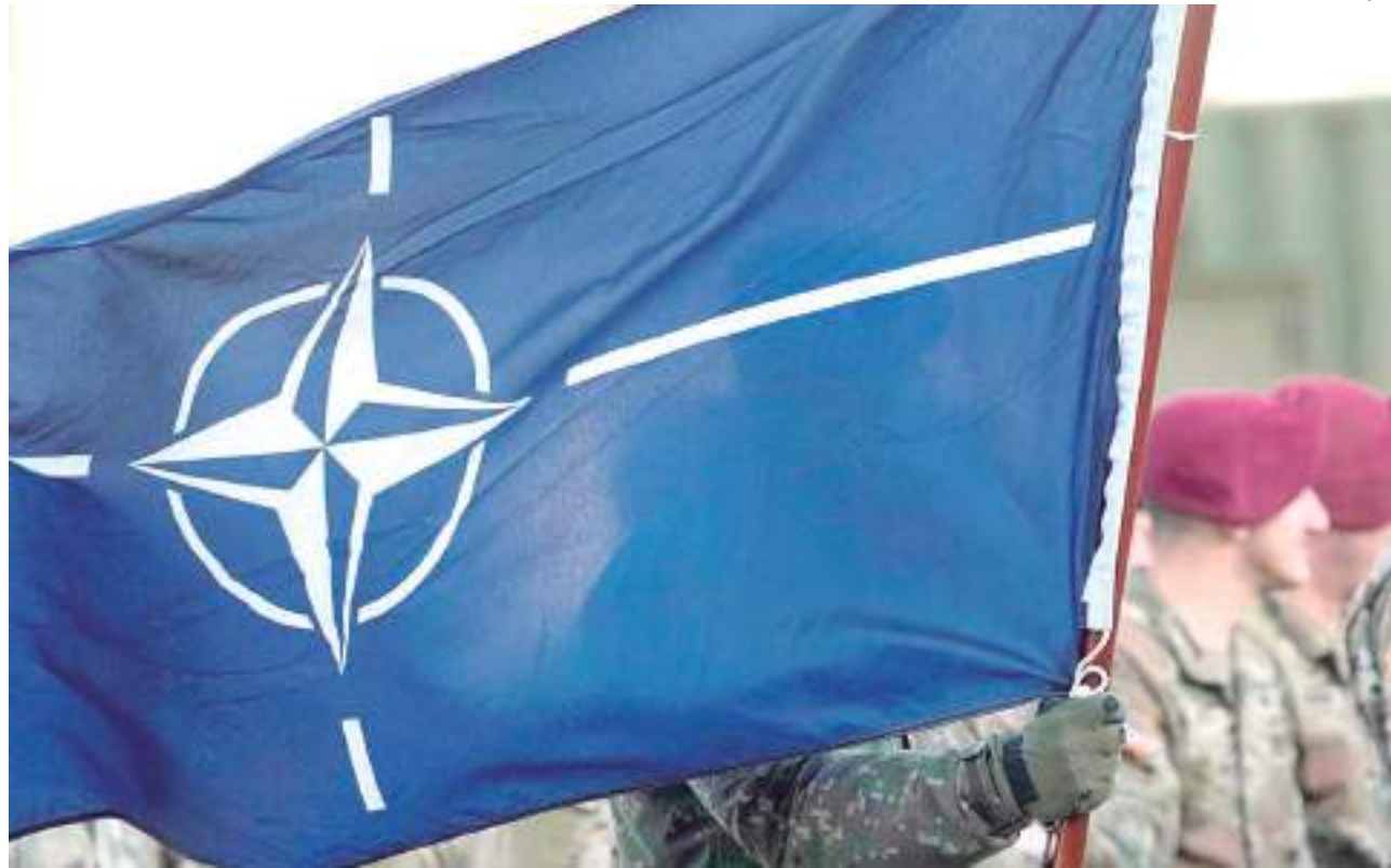
Bandeira da Otan tremula durante cerimônia de chegada de tropas dos EUA na base militar

No Twitter, o ministério ainda acrescentou: "Nós consideramos a posição do governo finlandês de manter uma política militar de não alinhamento como um fator