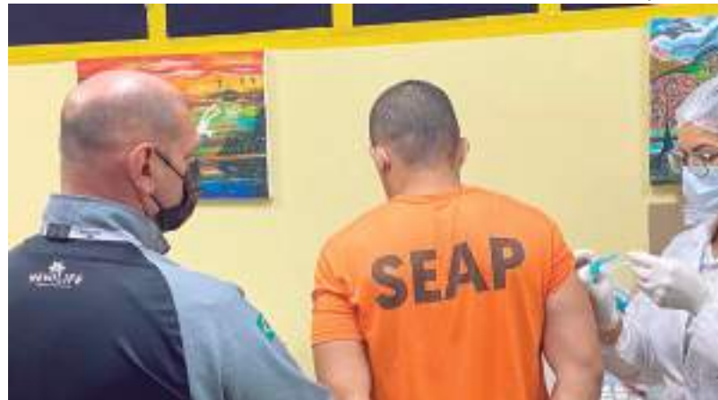
Desde o começo da pandemia, a Seap adota protocolos de prevenção