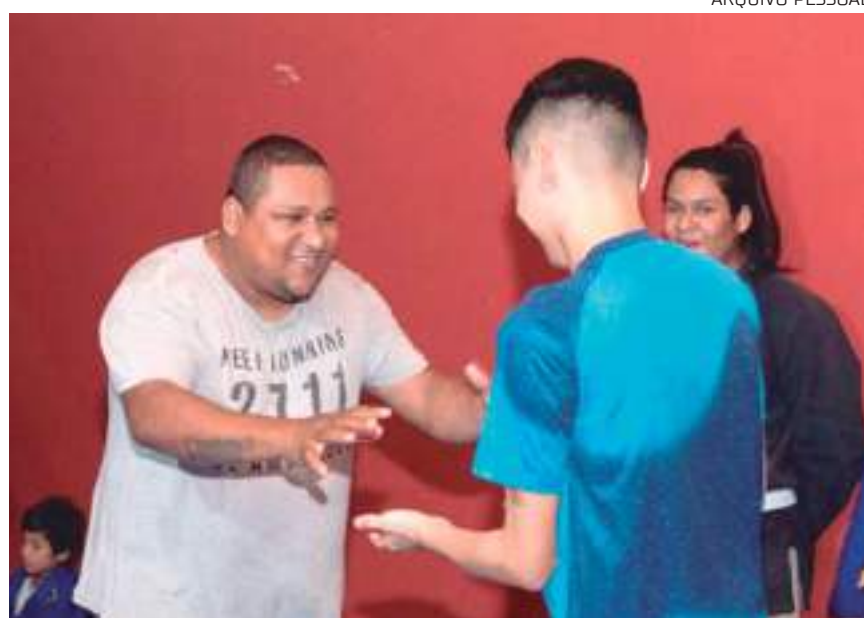
O professor pede ajuda para que o projeto continue existindo