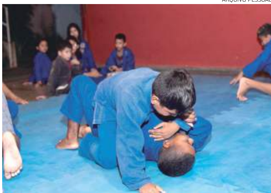
O Gerando futuro já mudou a vida de dezenas de crianças