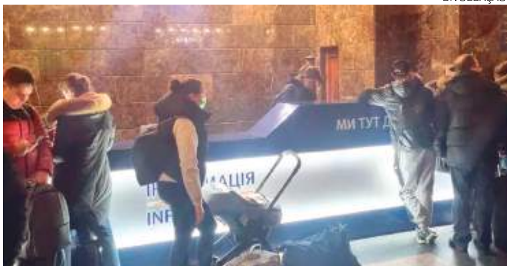
Ponto de encontro de brasileiros em estação de Kiev

Um trem com brasileiros residentes na Ucrânia partiu nesta sexta-feira (25), às 17h (pelo horário de Brasília; 22h no horário local) da capital Kiev com destino à cidade de Chernivtsi, no oeste do país.