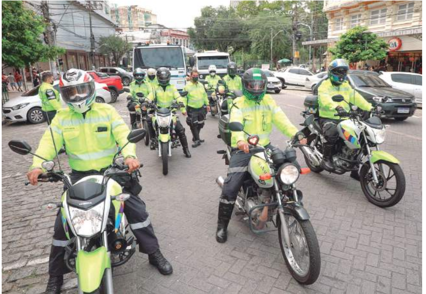
Cerca de dez fiscais de transportes se revezarão no Centro de Controle da Cidade (CCC) para monitorar as plataformas e as circulações dos coletivos

A diretoria de operações do IMMU, vai atuar com um efetivo de cem pessoas, via postos fixos, ronda com viaturas e motocicletas. Serão montados oito postos de monitoramento presencial com agentes de trânsito fiscalizando as seis zonas da cidade.