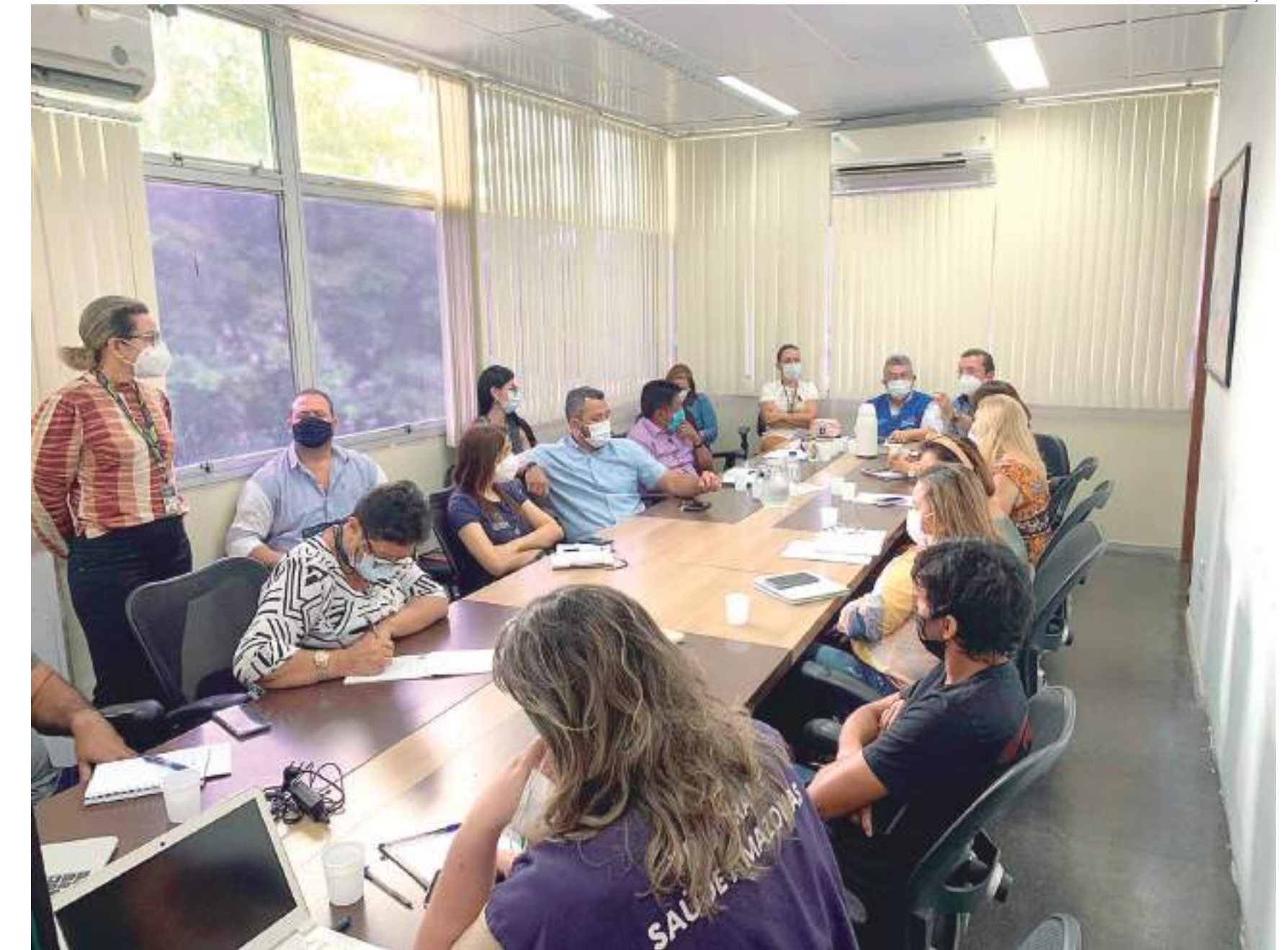
A CIR é um colegiado de decisão dentro do Sistema Único de Saúde (SUS)

“A retomada das reuniões da CIR possibilita que os princípios do SUS sejam atendidos na prática, com descentralização das