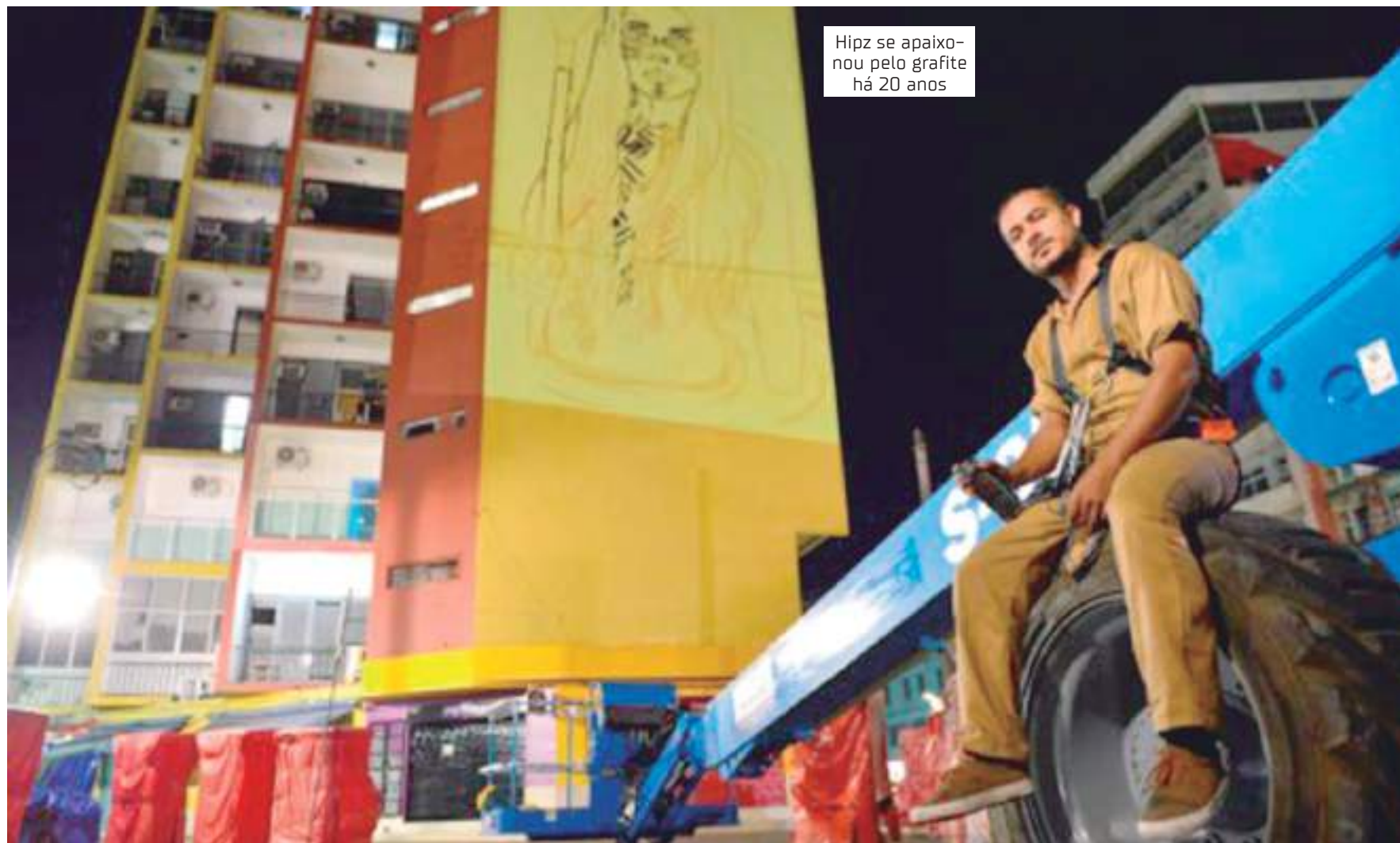
Hipz se apaixonou pelo grafite há 20 anos

"Vivemos em um dos lugares mais lindos inspiradores do mundo, mas que sofre de forma brutal