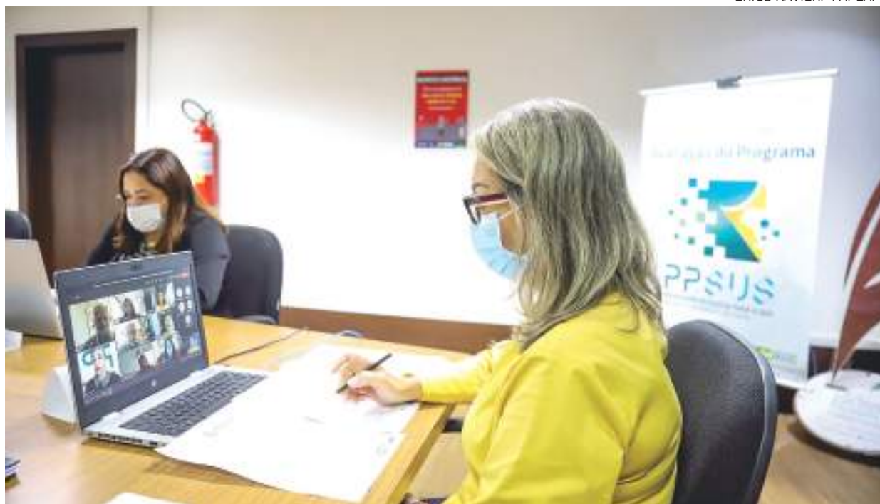
Descoberta foi apresentada durante o seminário de avaliação final do Programa Pesquisa Para o SUS (PPSUS)

Pacientes com HIV do Amazonas receberam uma boa notícia. Um projeto desenvolvido por um grupo de pesquisadores do Instituto Nacional de Pesquisas da