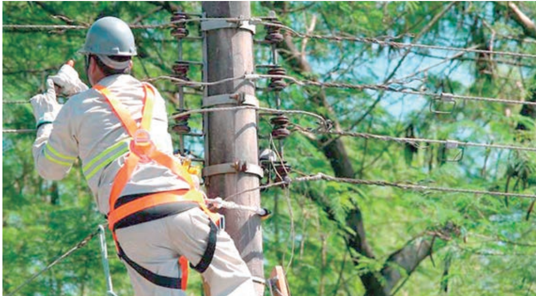
Família de eletricista morto pode ser indenizada em quase R$1 milhão, em Manaus

O trabalhador da Amazonas Energia era constantemente chamado para realizar as manutenções do sistema de energia em todo o interior, quando foi designado para executar a extensão de rede de mé-