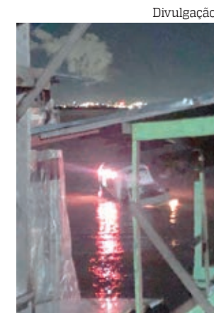
Ambulância que transportava recém-nascido afunda em rio

As causas do acidente devem ser identificadas após perícia no veículo.