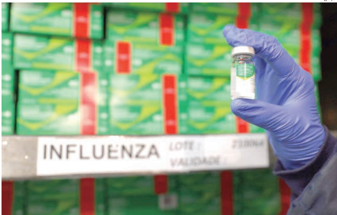
Amazonas está pronto para vacinar 1,8 milhão de pessoas contra sarampo e influenza a partir de 4 de abril

“A vacinação da influenza é importante para evitar a disseminação de outros vírus, além do que causa a Covid-19, sobretudo nesse período que ainda é sazonal para doenças respiratórias. A vacinação contra o sarampo,