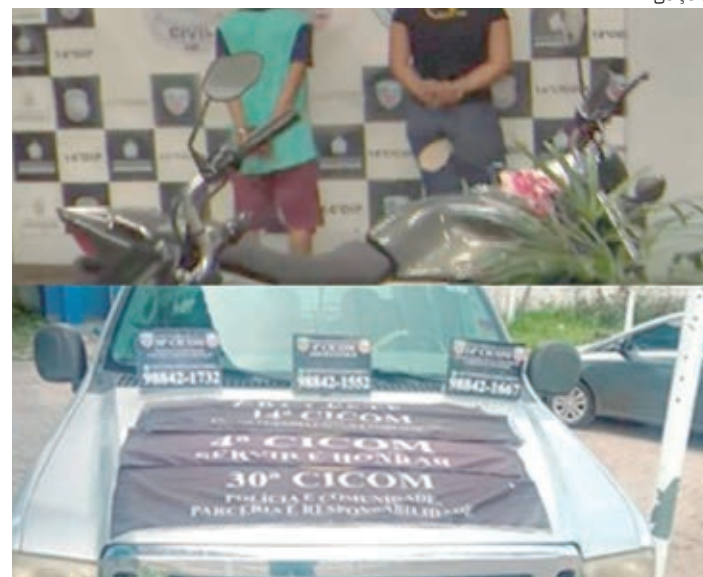
Casais de criminosos foram levados para delegacias de Manaus