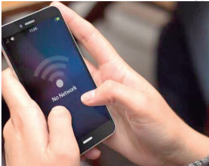
Problema pode gerar danos morais dada a natureza essencial do serviço

Só durante os primeiros meses deste ano, a capital amazonense viveu três grandes apagões de internet, o que deixou muitos amazonenses sem acesso à conexão durante todo o dia. A dificuldade de conexão mais recente aconteceu no dia 22 de março, quando usuários das operadoras de telefonia e internet da Claro, Oi, Vivo e Tim relataram que ficaram sem o sinal em várias zonas de Manaus. Conforme explica especialistas do consumidor, a falha na internet gera dano moral dada a natureza essencial do serviço.