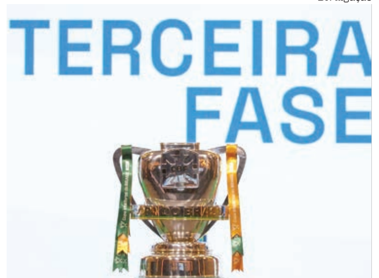
CBF realizou sorteio para definir confrontos da Copa do Brasil

América-MG x CSA Cruzeiro x Remo Flamengo x Altos-PI Santos x Coritiba