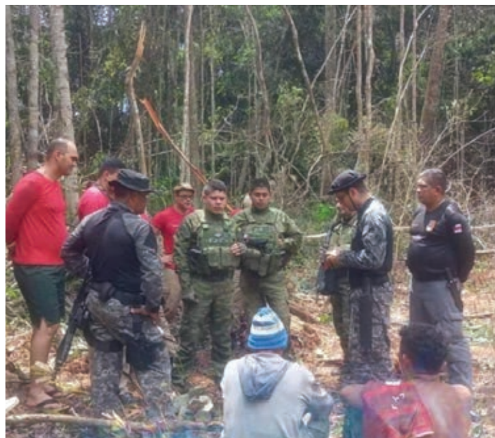
Corpo de caçador desaparecido em Urucará foi encontrado pela polícia

A Secretaria de Segurança Pública do Amazonas (SSP-AM) enviou reforço policial para o município para apoiar nas buscas.