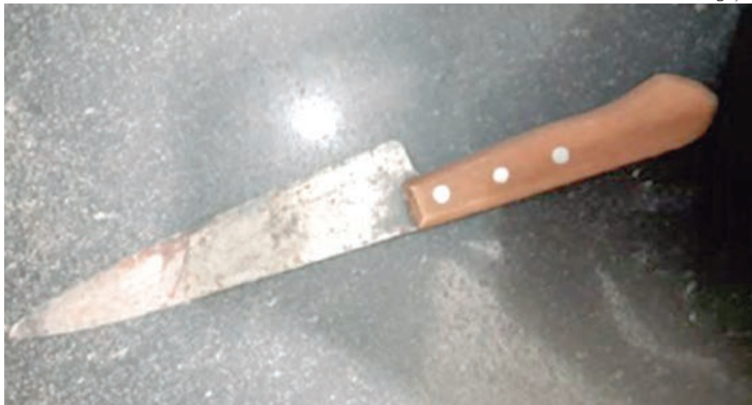
Ladrão utilizou uma faca tipo peixeira para tentar roubar motorista de aplicativo do transporte urbano