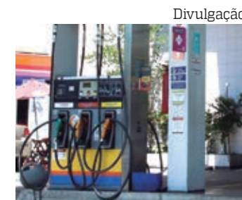
Troca de gasolina por etanol pode não ser vantajosa

D'Agosto explica que a quantidade de energia existente em um litro de etanol é diferente da quantidade em um litro de gasolina. “Aí, tem a famosa relação dos 70%. Significa que um litro de etanol equivale a cerca de 70% do litro da gasolina em termos de conteúdo energético”. Portanto, o preço do etanol tem que ser menor ou igual a 70% do preço da gasolina. Caso contrário, o custo-benefício entre os combustíveis não será atrativo para os consumidores, explicou.