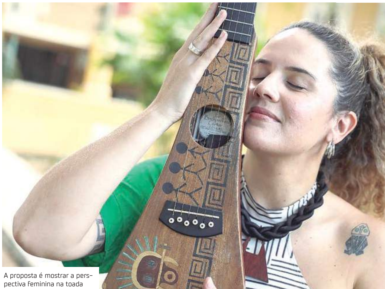
A proposta é mostrar a perspectiva feminina na toada

"É uma grande missão estar representando a voz feminina, a força da mulher dentro do ritmo do boi-bumbá. Lutamos tanto para ter esse espaço e num horário tão bacana, às 23h, nós poderemos mostrar um pouco da nossa arte. As pessoas vão adorar, tenho certeza que todo mundo vai