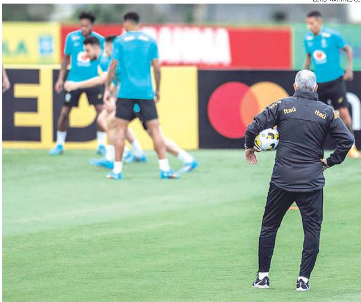
Tite falou sobre preocupação com foco de Neymar, visando à Copa do Mundo do Catar, no final do ano

Na véspera do duelo da Seleção Brasileira com o Chile, pelas Eliminatórias Sul-Americanas, o técnico Tite abriu o jogo sobre o momento de Neymar, que vem sendo muito criticado pelo desempenho no PSG. Em entrevista coletiva na Granja Comary, o treinador admitiu uma preocupação, mas afirmou que este tema é tratado internamente.