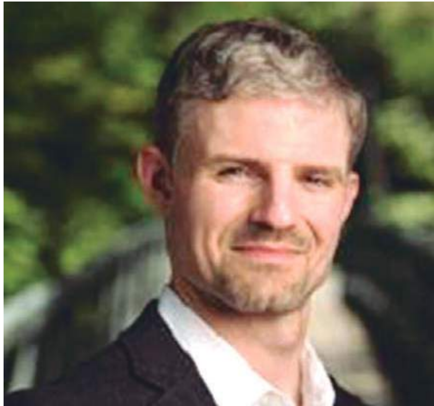
Paul Poast é cientista político da Universidade de Chicago

Para ele, armar ou financiar um dos lados de um conflito é também participar ativamente dele. E por isso, tanto os Estados Unidos quanto a Organização do Tratado do Atlântico Norte (Otan) - que nas últimas semanas não só enviaram bilhões de dólares em ajuda aos ucranianos