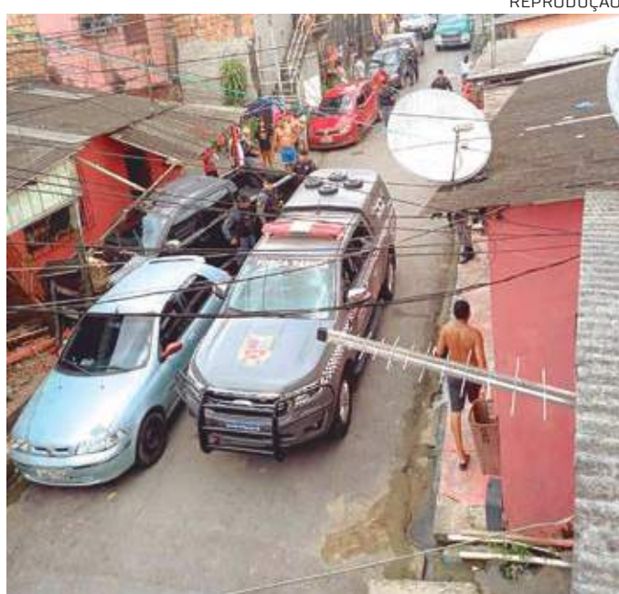
Wendel bateu no muro de uma residência, após ser baleado.

Ao ser abordado pelos PM's, o homem se recusou a parar o veículo e fugiu para o bairro da União,