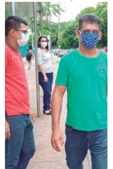
Prefeituras possuem autonomia para definir regras de uso do item