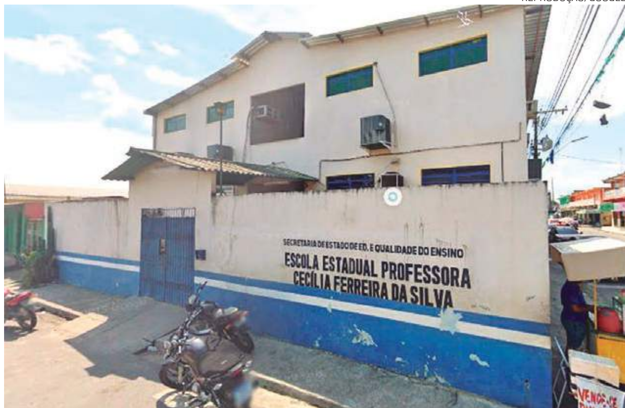
A equipe do Em Tempo teve acesso a uma carta, compartilhada por um grupo de alunos, relatando a rotina do local

Humilhação é o que os alunos da Escola Estadual Professora Cecília Ferreira da Silva, localizada na rua Hortelã, no bairro Jorge Teixeira, Zona Leste de Manaus, vivem nos últimos dias