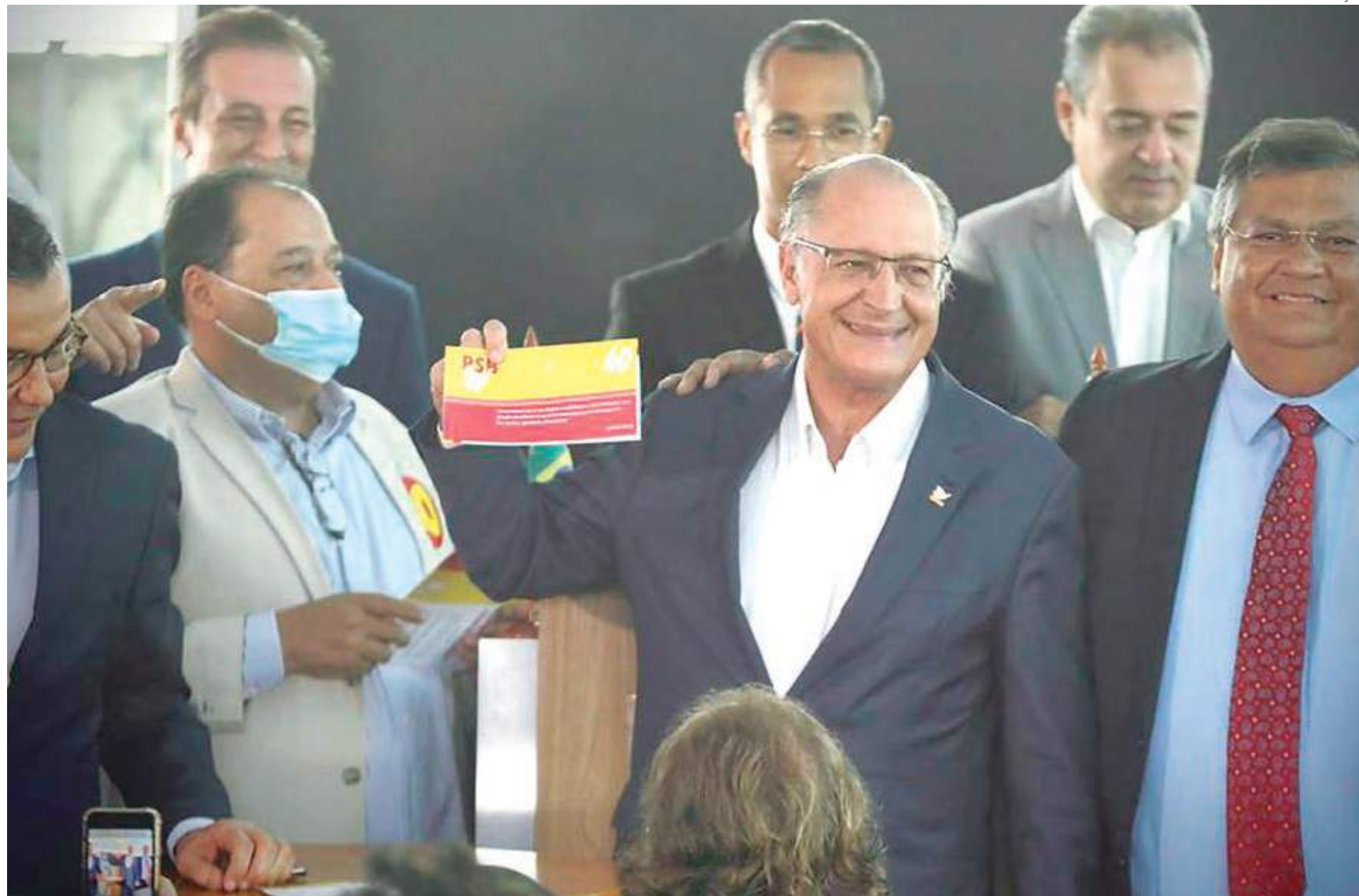
Além de fazer elogios ao ex-chefe do Executivo, Alckmin também lembrou as disputas eleitorais que teve com o petista

"Saúdo a presidente [do PT] deputada Gleisi Hoffmann, abraçando todos os deputados, senadores e lideranças do PT", disse.