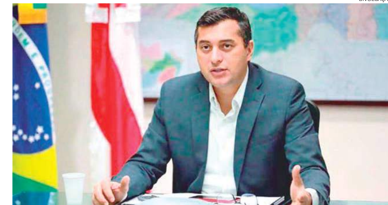
O anúncio do decreto foi feito pelo governador Wilson Lima através de suas redes sociais

“Nós temos números epidemiológicos favoráveis, os números de internações diminuíram significativamente. O estado do Amazonas tem a menor taxa de letalidade do país. Estamos recomendando a desobrigação do uso de máscara, mas é importante que as pessoas entendam, e nós vamos continuar vacinando, que a vacina é