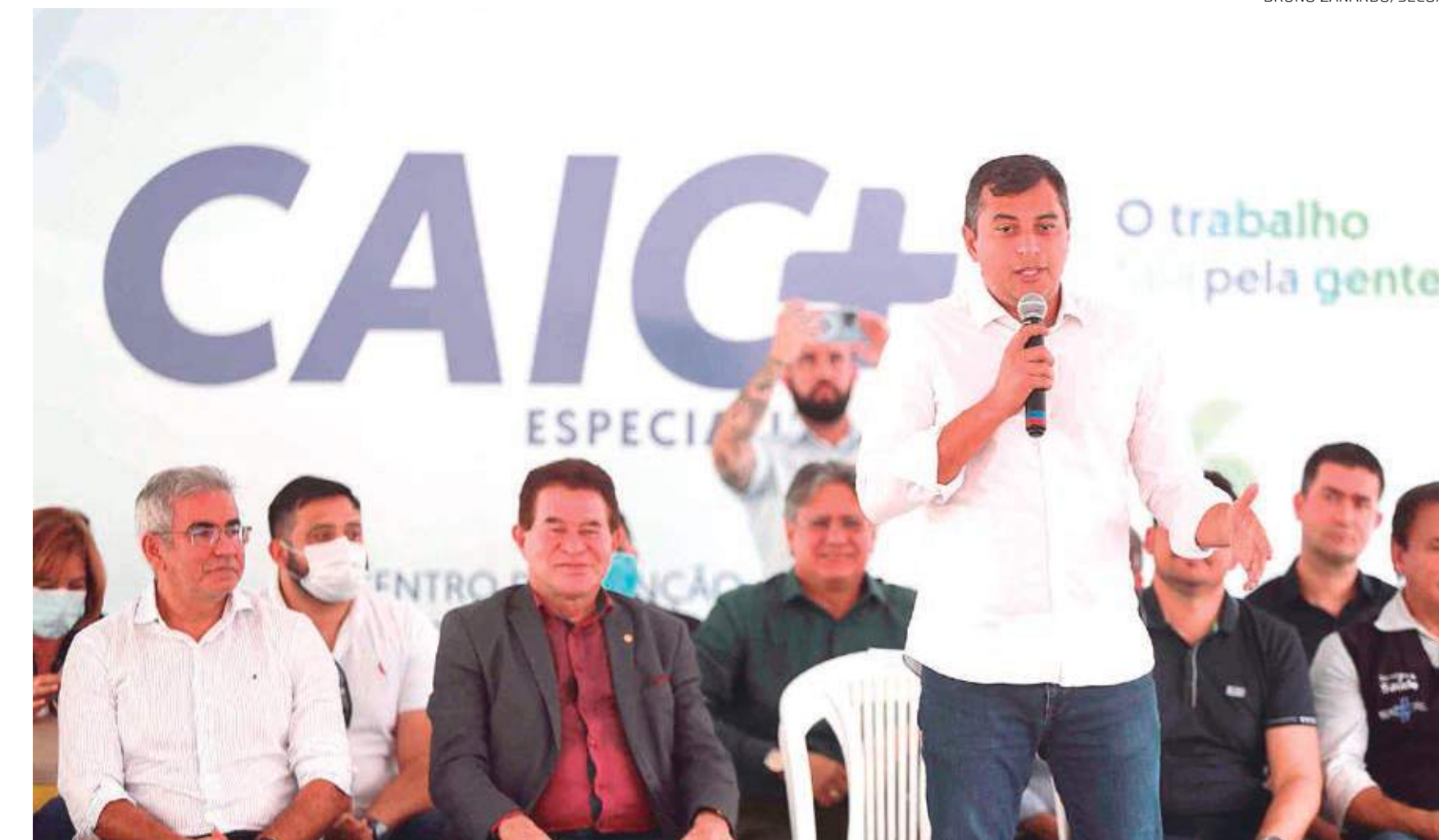
O novo perfil de atendimento Caic+ é resultado das ações do programa Saúde Amazonas, executado pela Secretaria de Estado de Saúde (SES-AM)