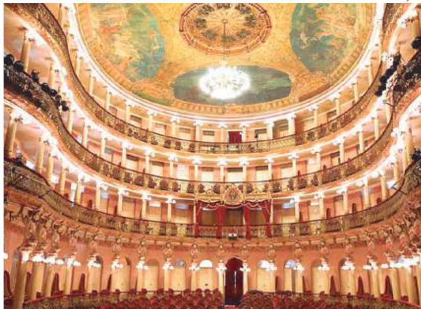
As publicações remetem ao show "É de Mim Mesmo", de Whindersson Nunes

O Teatro Amazonas ganhou uma série de posts especiais na rede social da gigante do streaming, a Netflix, nesta semana. Sete publicações foram feitas pela Netflix Brasil na rede social Twitter, com curiosidades sobre o Teatro Amazonas, espaço administrado pelo Governo do Amazonas, por meio da Secretaria de Estado da Cultura e Economia Criativa.