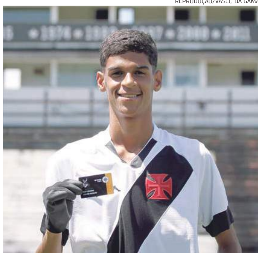
"Luva de Pedreiro" esbanja humildade ao imitar o craque Cristiano Ronaldo

Rapidamente, os bordões "Receba" e "Graças a Deus" caíram no gosto popular e seus vídeos passaram a viralizar e ganhar repercussão internacional. Diante disso, o Barcelona compartilhou um vídeo de Iran, além do Bayern de Munique, que mostrou o atacante Gnabry imitando a comemoração do influenciador durante o treinamento.