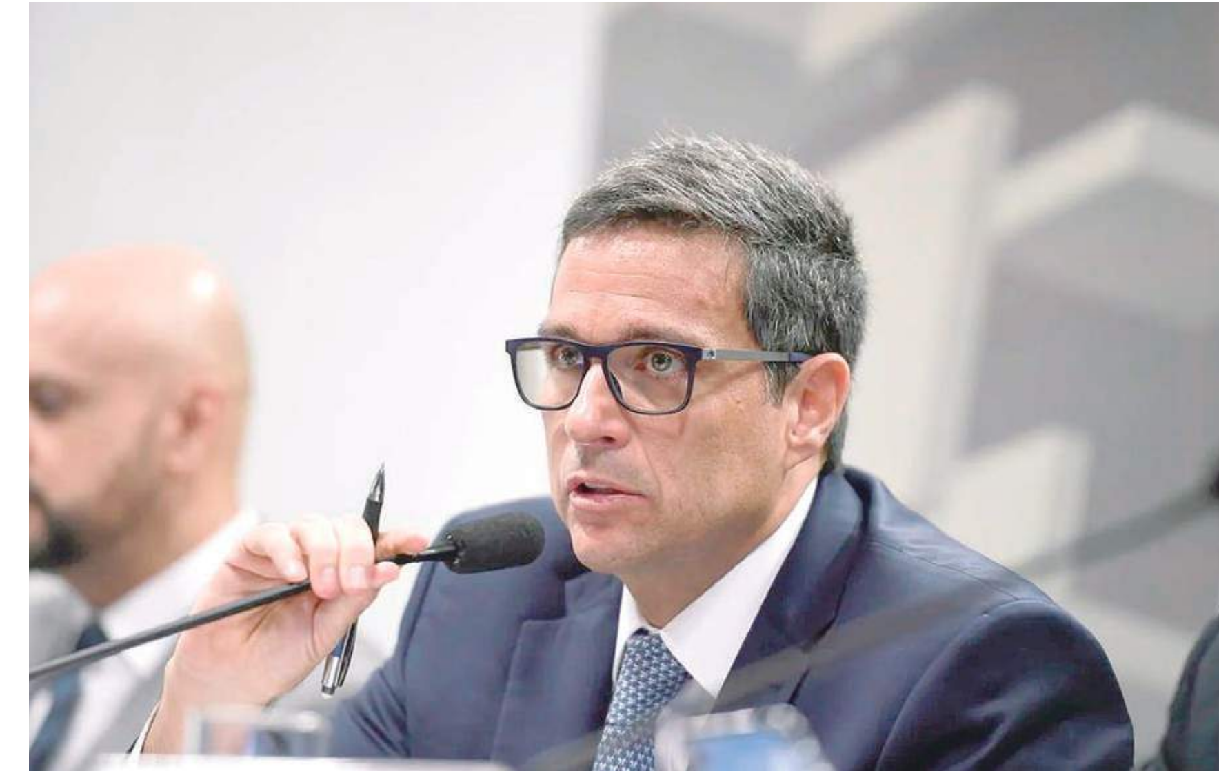
Roberto Campos Neto, presidente do Banco Central, disse que o Brasil pode se beneficiar com os efeitos do conflito

sando em uma situação muito mais grave", afirmou durante um evento promovido pelo Tribunal de Contas da União (TCU) e Federação das Indústrias do Estado de São Paulo (Fiesp).