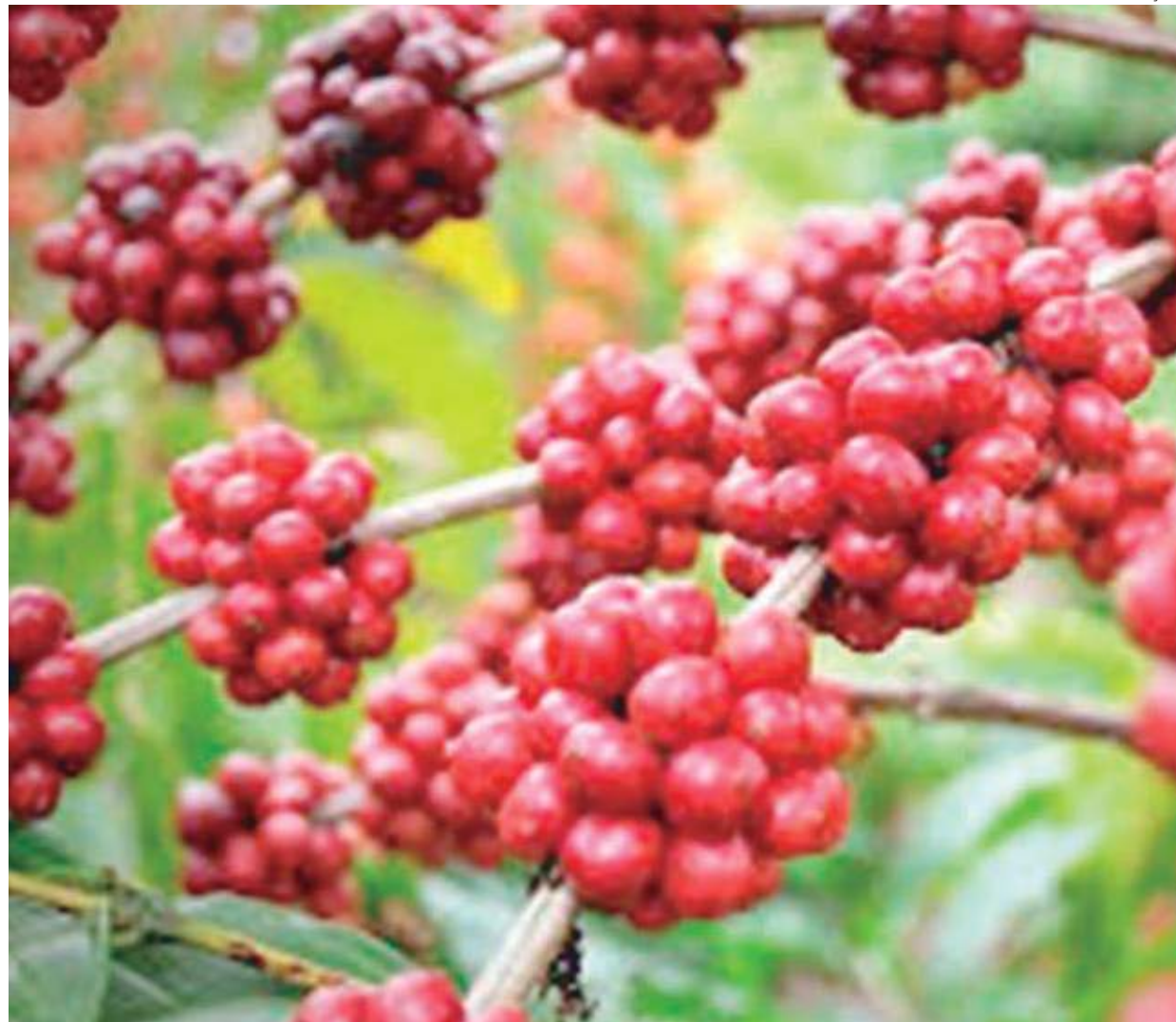
Produtores de café criticaram a medida do governo

Foi publicada em Diário Oficial da União, nesta quarta-feira (23), a decisão do Ministério da Economia de zerar as tarifas de importação sobre etanol e seis tipos de alimentos – café, margarina, queijo, óleo de soja, açúcar e macarrão –, até o fim do ano. A medida passa a valer a partir da data da publicação. Para a Associação Brasileira dos Importadores de Combustíveis (Abicom), a novidade tem potencial de levar redução de preço aos consumidores. Já para o diretor da FGV Transportes, Marcus Quintella, efeitos não devem ser sentidos a curto prazo.