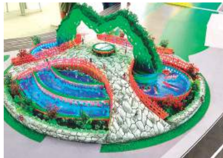
Espaço público tem como meta contemplar as zonas Leste de Morte

No parque temático, as figuras terão grande escala, baseadas na fauna e flora amazônicas, como onças com 5 metros de altura, jacarés com 30 metros de comprimento e tucunares com 15 metros de extensão. Todas as figuras ligadas à floresta serão manuseadas como brinquedos lúdicos para os pequenos e interativos para os adultos. A área total prevista para intervenção é de 147.453,87 metros quadrados.