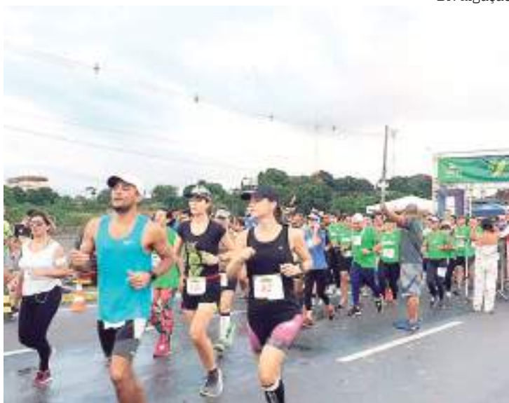
A prova pretende reunir em torno de 2 mil atletas

“Esse retorno representa uma festa de volta à vida. É a retomada das ações esportivas, das confraternizações e dos abraços. Temos também a intenção de trazer, neste dia, uma reflexão sobre os cuidados com o nosso planeta. Então, será um momento