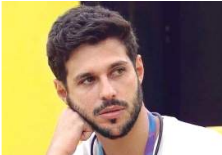
Mussi tem falado que quer ir embora da Unidade de Tratamento

O ex-BBB Rodrigo Mussi tem falado que quer ir embora da Unidade de Tratamento Intensivo (UTI) do Hospital das Clínicas, em São Paulo, onde ele está internado desde que sofreu um grave acidente de carro. Na segunda-feira (18), o gerente comercial de 36 anos precisou ser contido por médicos ao tentar deixar o local.