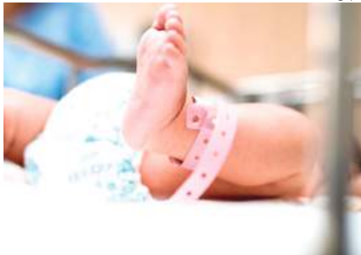
Bebê intersexual ganhou direito na Justiça de trocar de nome

“Os pais aguardavam com muita ansiedade essa resposta judicial, a fim de encerrar um ciclo e iniciar um novo momento em família, sem dúvida, a dignidade da criança será reestabelecida”,