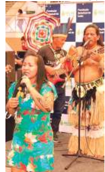
Comunidade indígena cresce e se desenvolve junto com a tecnologia

Além do município da Região Metropolitana, Manaus e outras cidades receberam a feira para buscar o individualismo do artesão de cada região, trabalhando assim o ecoturismo.