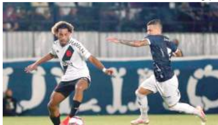
Jogadores revelados pelo Vasco seguem sem chance no time

Vale ressaltar que a chegada de novos jogadores, já lembrada no primeiro parágrafo deste texto, pode diminuir o espaço das revelações vascaínas.