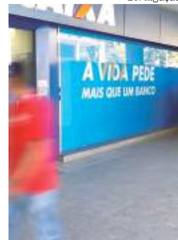
Depósitos começam nesta quarta a 3,9 milhões de trabalhadores

Para isso, é só acessar a Play Store ou a App Store e baixar o app Caixa Tem. Nesse momento, o acesso é exclusivo aos clientes que já possuem a conta poupança social ou poupança digital+ no Caixa Tem.