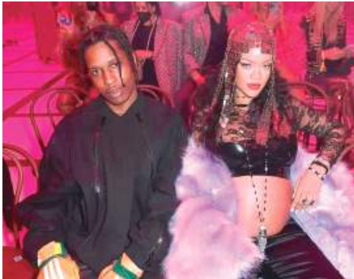
Prisão de A$AP Rocky, pai do filho de Rihanna, aconteceu quarta-feira

O site explicou que o próprio A$AP não tinha ideia de que seria abordado pela polícia. Mesmo com um mandado de busca emitido há mais de uma semana, nem ele, nem sua equipe, estavam sabendo, o que vai contra um pro-