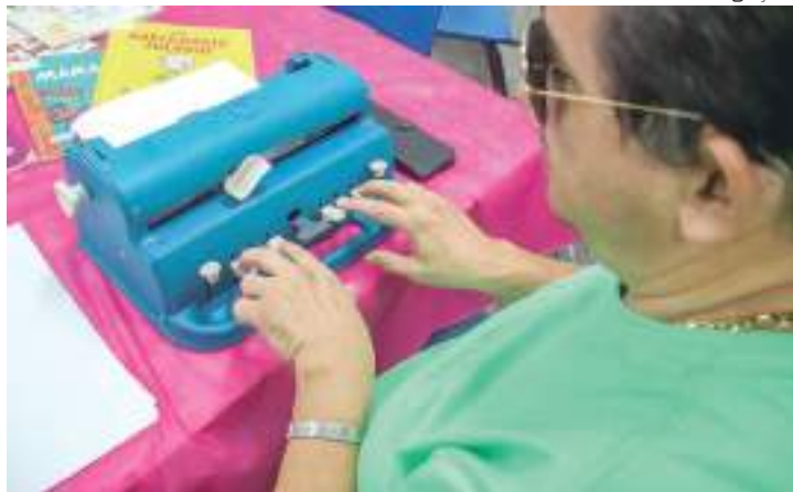
Estudantes com deficiência visual participam de programa da Semed

“O prefeito David Almeida tem um carinho muito grande por todos os nossos estudantes e contamos com o apoio dele para desenvolvermos programas que possam auxiliar e melhorar a aprendizagem dos alunos da educação especial. Queremos que a inclusão aconteça em toda a rede municipal, mas o nosso maior desejo é que esses alunos tenham também autonomia para as tarefas do dia a dia, e vamos seguir trabalhando para que eles tenham esse suporte”, de-