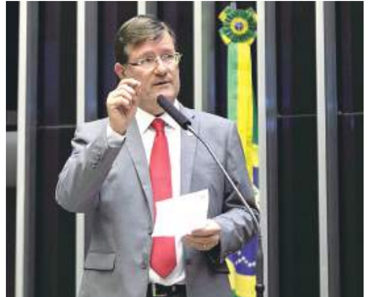
Solicitação no MPE e MPF é para que apurem todos os fatos no município

“Os moradores dessa região vivem assustados, porque estão sendo ameaçados, inclusive, de morte, e violados em seus direitos básicos, garantidos na Constituição Federal, como