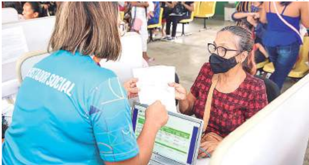
Em mutirão de atualização do CadÚnico, Prefeitura de Manaus atende 700 pessoas

“O nosso objetivo é alcançar todas as 80 mil famílias que precisamos atualizar (o cadastro), então nós estamos nos organizando em mutirões por toda a cidade,