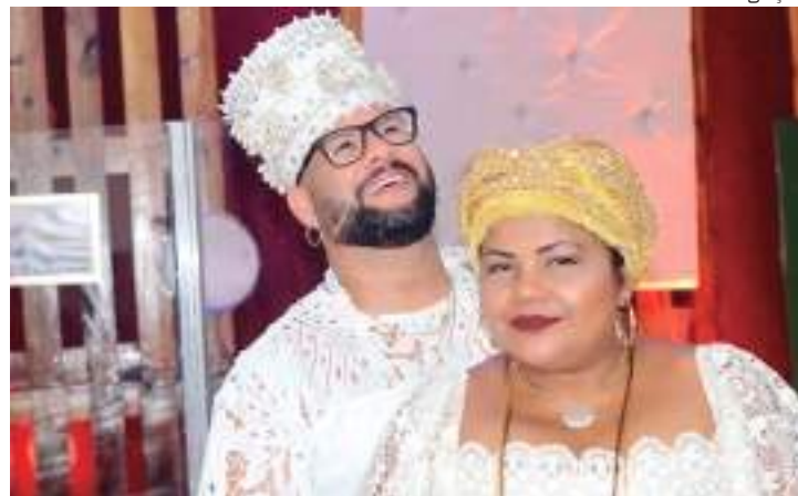
“Ogunhê é um samba de terreiro, uma celebração para falar sobre amor

No dia 23 de abril é comemorado o Dia de Ogum, um Orixá conquistador que fez com que vários reinos se curvassem diante de seu poderio militar em toda a África. Entre eles, estava a cidade de Iré, da qual se tornou senhor após libertar a cidade da tira-