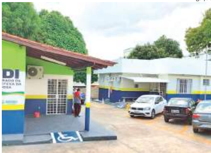
Centro de proteção atendeu idosos na faixa etária entre 60 a 80 anos

Os atendimentos mais frequentes estão na faixa etária entre 60 a 80 anos. O Cipdi presta o suporte psicossocial, recebe denúncias, faz encaminhamen-