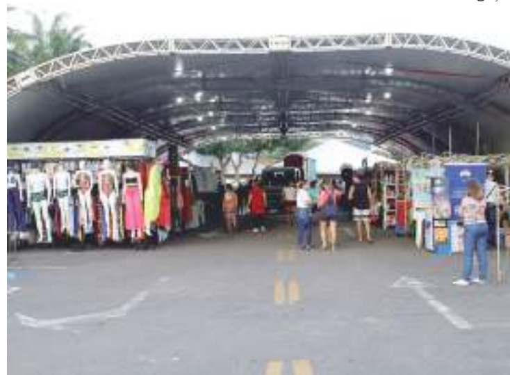
Agrishow Amazonas) iniciou nesta quinta-feira e segue até domingo (24)