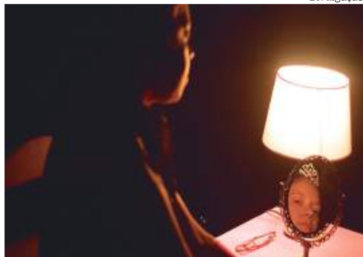
Programação passará por Iranduba, Manacapuru, Novo Airão e Manaus