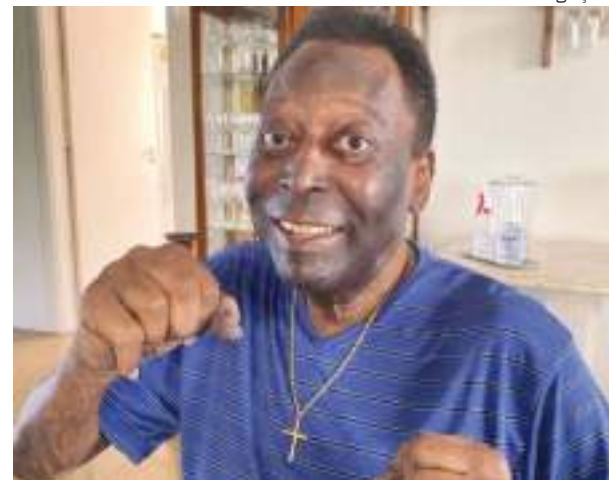
Pelé estava internado desde a terça-feira (19), no Albert Einstein

Em 2021, o tricampeão mundial (1958, 1962 e 1970) foi hospitalizado para realização de exames de rotina, em que foi constatado um tumor no cólon direito, que faz parte do intestino grosso. Apesar da internação em UTI, Pelé tranquilizou os fãs através de postagens nas redes sociais na ocasião.