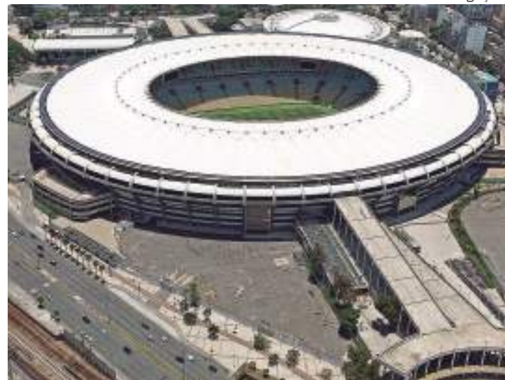
Gramado será reformado para próxima temporada de futebol