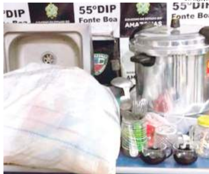
Objetos furtados das escolas públicas são recuperados pela polícia

Os indivíduos responderão por furto qualificado e ficarão à disposição da Justiça.