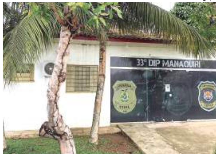
Policiais de Manaquiri realizaram as detenções de traficantes

Procedimentos - Pedro responderá por tráfico de drogas e corrupção de menores e José Henrique por tráfico de drogas e ficarão à disposição do