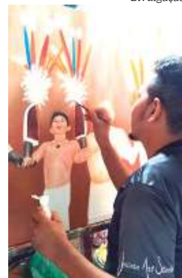
Exposição fica em cartaz na primeira galeria de artes

Também ministrou aulas no Liceu de Artes e Ofícios Claudio Santoro, na unidade de Parintins.