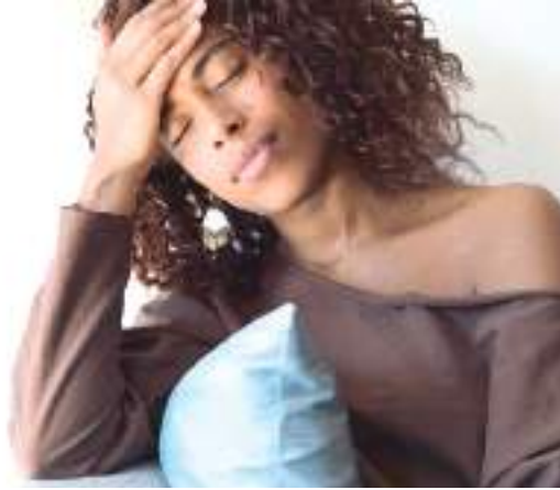
Porcentual cada vez maior de brasileiros sofre de depressão

O levantamento mostrou também que, em média, há mais pessoas no País com depressão do que com diabetes (9,1%) – doença crônica considerada muito comum. O trabalho revelou ainda que a frequência de adultos com diagnóstico médico de depressão variou bastante entre as capitais. Foi de 7,2% em Belém, a 17,5% em Porto