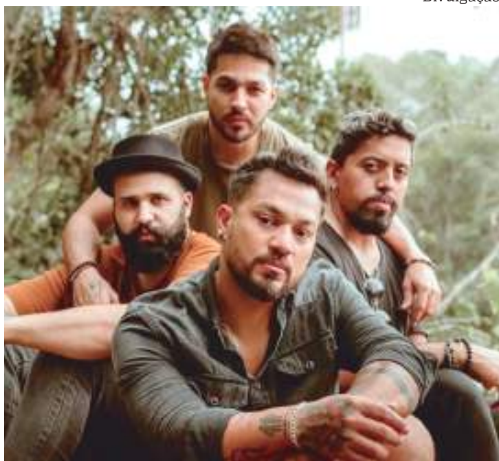
Banda faz show nesta terça (26) e quarta-feira (27) no Terminal 3 e 5

Imagine a rotina da população nos Terminais de Ônibus ser surpreendida por um show de música. A banda Redphone teve essa