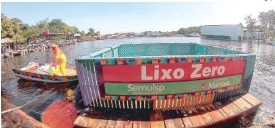
Prefeitura entrega coletor flutuante e lança projeto ‘Gari Comunitário Fluvial’ na marina do Davi