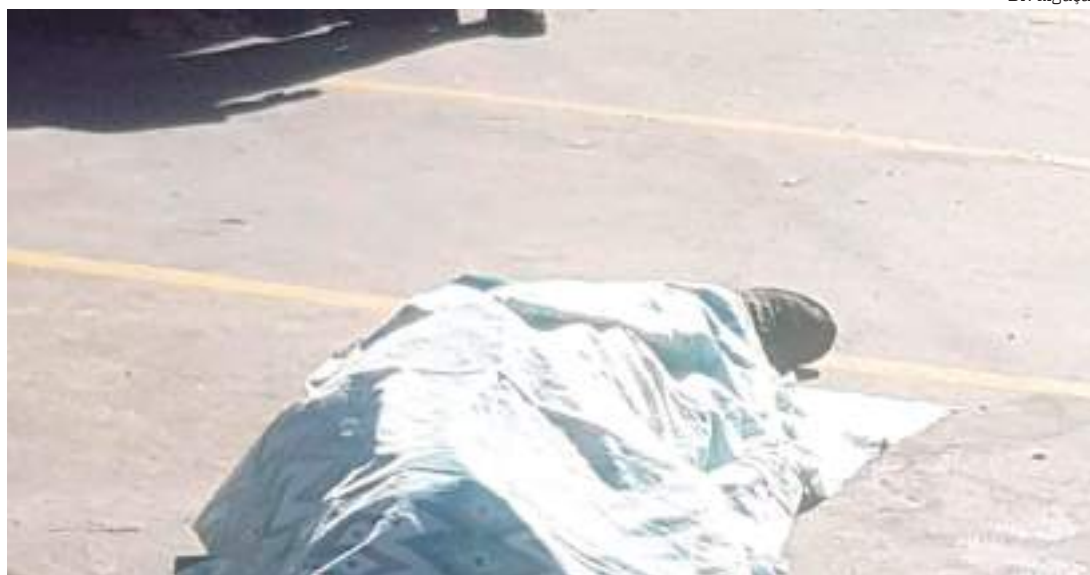
Homem foi morto a tiros no momento em que caminhava na avenida Buriti, no Distrito Industrial

Uma das versões é que Eduardo estava a caminho do trabalho, quando começou a ser perseguido por criminosos, não identificados. Os suspeitos começaram a atirar e a vítima, que estava armada, reagiu e atirou contra os executores. Na