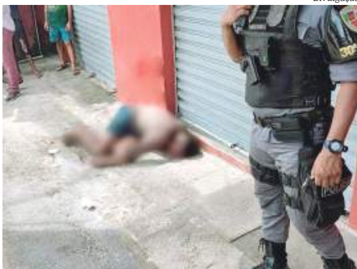
Homem invadiu comércio para roubar, mas acabou assassinado

“Esse homem além das pauladas levou cerca de 20