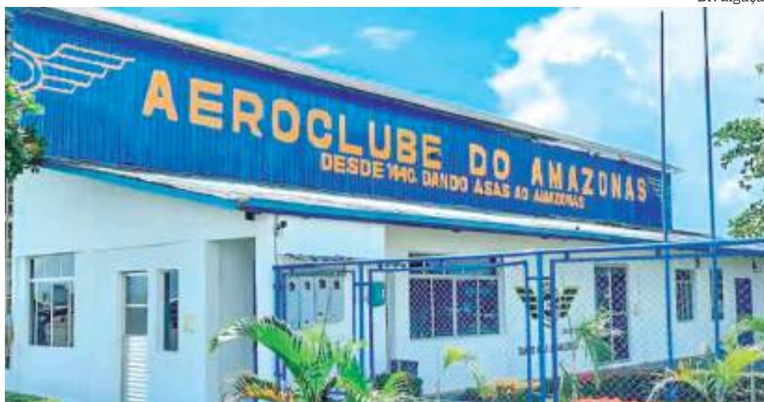
Presidente do aeroclube disse que o paraquedismo é uma atividade e que cada um é responsável pelo seu salto

O presidente do aeroclube ressalta que o paraquedismo é uma atividade