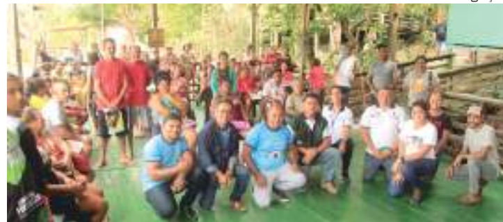
Atividade contou com a participação de 80 famílias rurais

“A inclusão dos pescadores artesanais no Cartão do Produtor Primário é um reconhecimento do Governo do Amazonas que ao longo dos anos vai garantir muitos benefícios às famílias. Benefícios esses que vão desde a compra de insumos