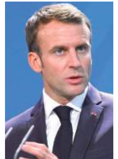
Presidente reeleito da França prometeu lidar com divisões no país