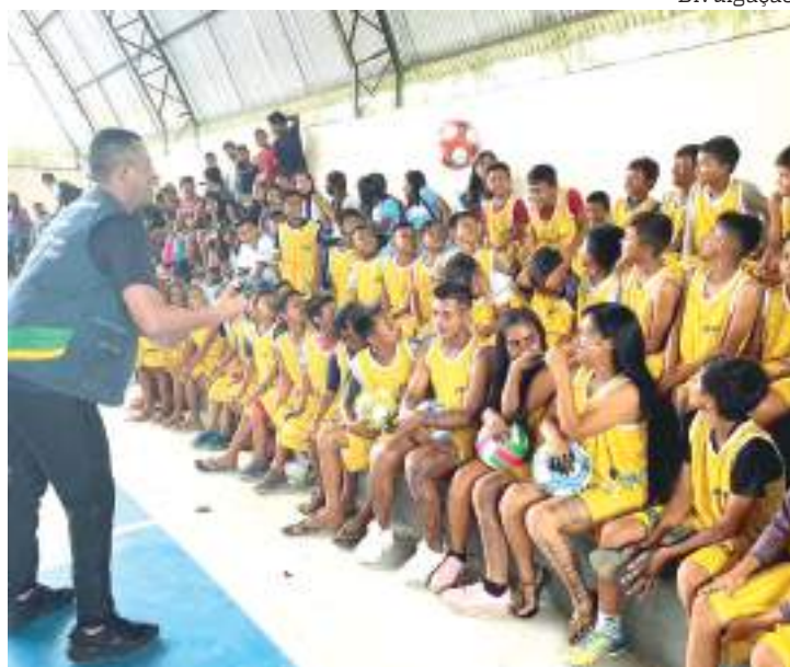
Comunidade Umariáçu faz parte do projeto do Governo do Amazonas