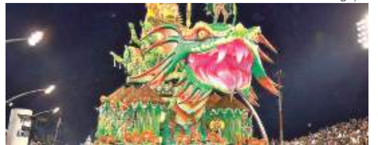
Mancha Verde conquista seu segundo título do Carnaval de São Paulo

No entanto, após a divulgação das notas do quesito fantasia, a Mocidade assumiu a ponta e teve a companhia da Mancha Verde na disputa. A partir daí, a escola da principal torcida organizada do Palmeiras foi nota a nota até o último quesito,