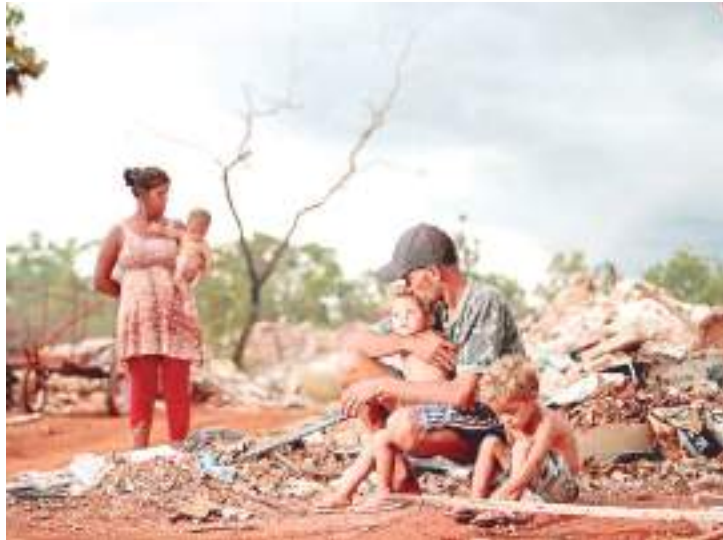
Entre os mais vulneráveis estão as mulheres, jovens, pessoas pretas

Lucas destacou que o estudo é importante porque “o país tem uma distribuição significativa do ponto de vista geográfico e social, e coloca foco sobre os grupos