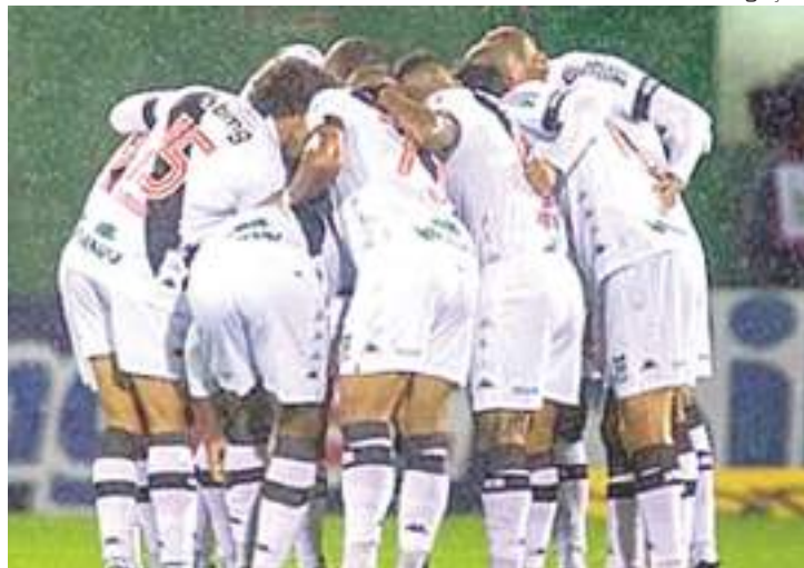
Vasco não consegue vencer na Série B e a "crise" bate à porta