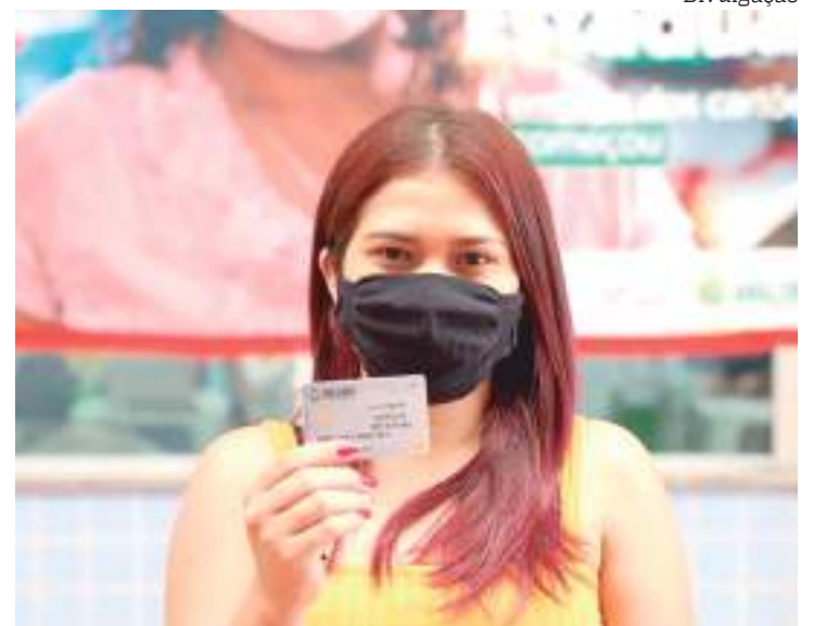
Governo vai entregar cartão auxílio em 24 cidades do Amazonas

Em Manaus, o prazo de entrega foi estendido até 29 de abril, das 8h às 16h, exclusivamente no Centro de Convivência do Idoso, no bairro Aparecida.