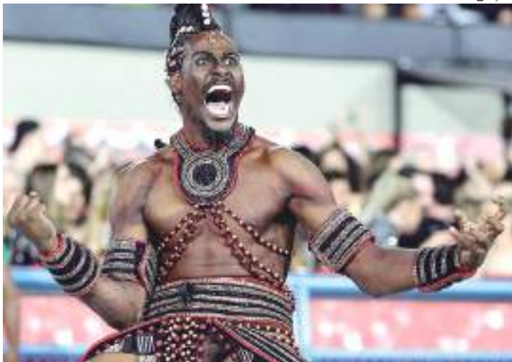
Grande Rio faturou seu primeiro título do Grupo Especial do Carnaval

A São Clemente, que homenageou o ator Paulo Gustavo, morto pela Co-