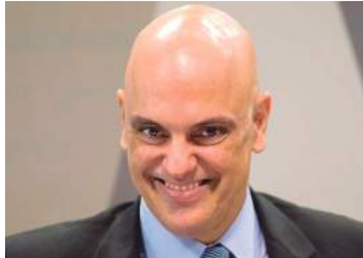
Deputado foi condenado após ataques ao STF e ao sistema democrático

Até o momento, os ministros do STF têm evitado