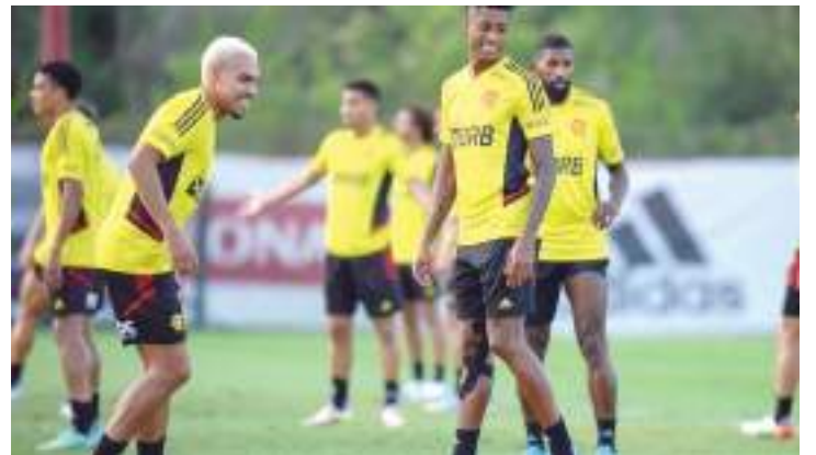
Time realiza preparação para jogo da quinta-feira (28), no Chile

Dentro de campo o time segue trabalhando para o duelo contra a Universidad Católica, na quinta-feira, em Santiago, no Chile.