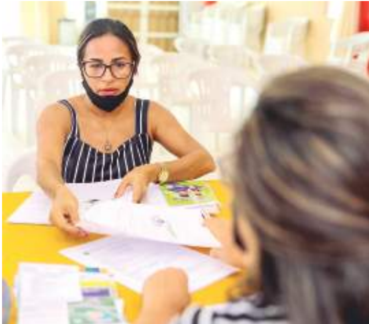
Moradores da Santa Inês vão receber título definitivo de terras

definitivo não tem custos para o beneficiário. Com o documento, o cidadão poderá ir ao cartório para fazer o registro e ter a matrícula do imóvel.