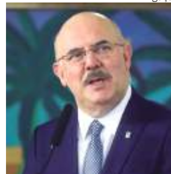
Disparo acidental feito pelo ex-ministro da Educação em aeroporto

No depoimento obtido pela colunista Bela Megale, do GLOBO, o ex-ministro relata que o disparo acidental ocorreu no momento em que estava no balcão da companhia aérea Latam, por volta das 17h.