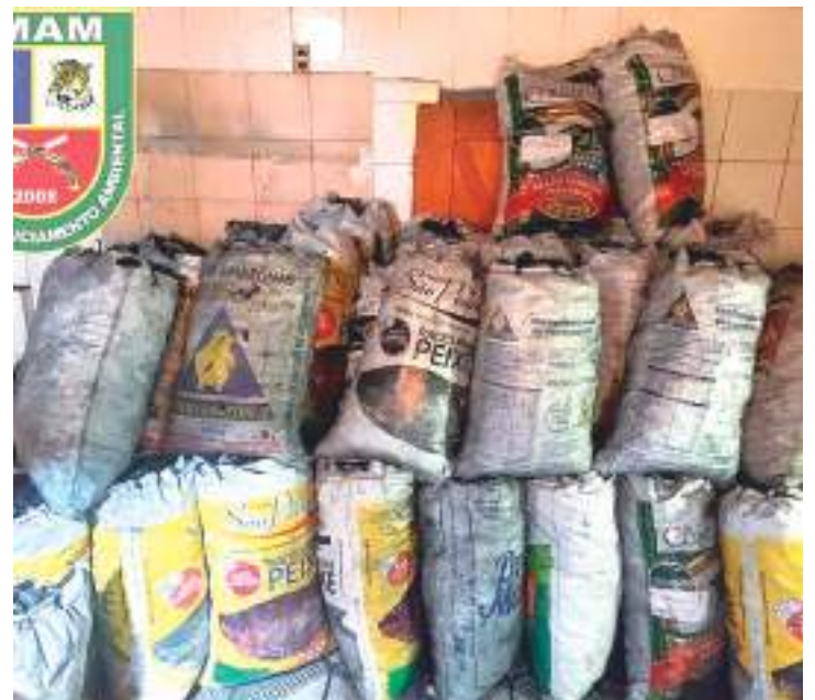
Policiais do Batalhão Ambiental apreenderam carga de carvão ilegal

A Polícia Militar orienta à população que informe imediatamente ao tomar conhecimento de ações criminosas, por meio do disque-denúncia 181, ou do 190.