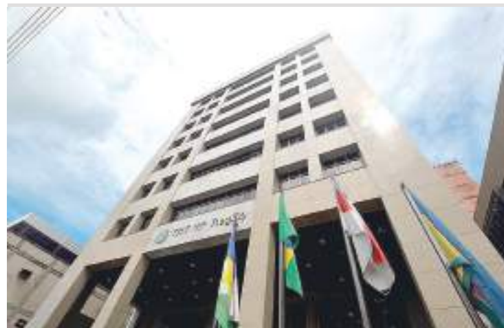
Justiça do Trabalho garantiu o pagamento de R$ 402 milhões a trabalhadores

De acordo com o levantamento, do total pago aos trabalhadores em 2021, 50% foram decorrentes de acordos feitos no período, 42,70% referem-se a valores pagos decorrentes de execução e 7,19% resultaram de pagamento espontâneo. Por sua vez, em 2020 do valor arrecadado, 48% decorreram de acordo judicial, 49,33% de execução e 2,63% resultaram de pagamento espontâneo.