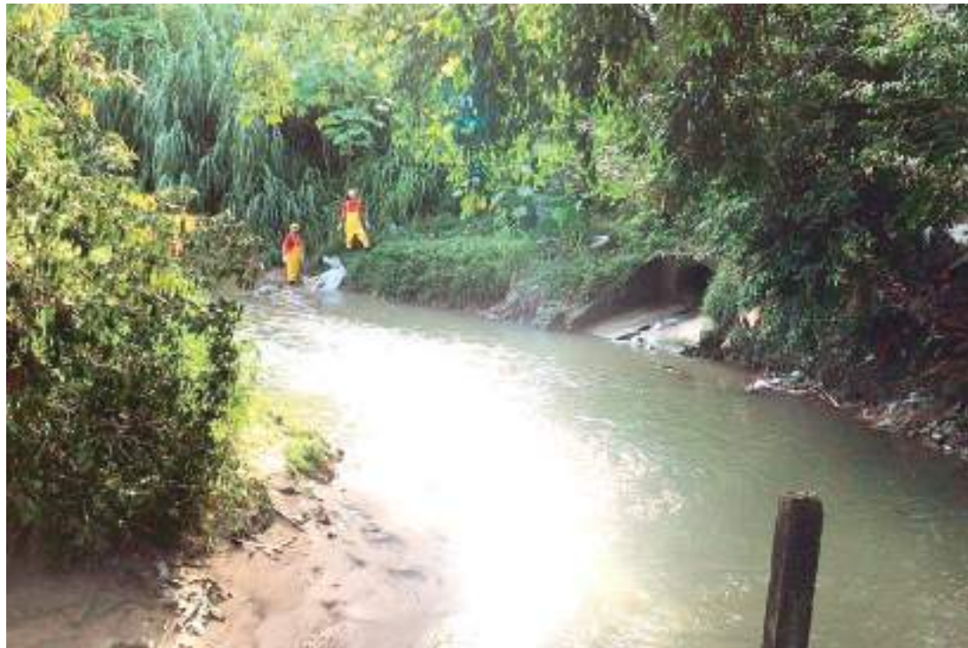
Corpo é resgatado de dentro de igarapé na avenida Autaz Mirim, bairro São José, Zona Leste de Manaus

De acordo com informações repassadas pela Polícia Militar, populares que passavam pelo local, por volta das 6h, avistaram o corpo boiando dentro do igarapé, na Zona Leste. A vítima estava trajando uma camisa do Flamengo. Em seguida, acionaram a polícia e o Corpo de Bombeiros.