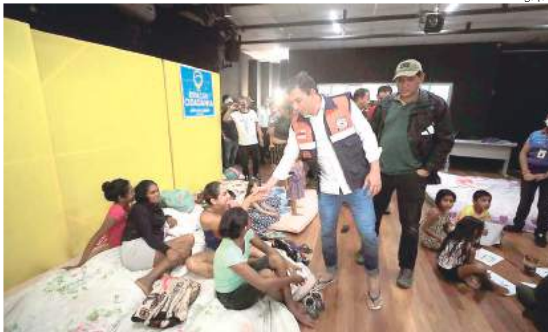
Governador Wilson Lima anunciou visita a abrigo onde famílias de Parintins estão alojadas

Mais de 1,3 mil famílias sofrem os impactos de mais de 15 horas de chuvas intensas, que resultaram em alagamentos e deslizamentos de terra em 15 bairros da cidade, segundo monitoramento do Subcomando de Ações de Proteção e Defesa Civil do Governo do Estado. O volume de chuva registrado em Parintins no último domingo é o maior