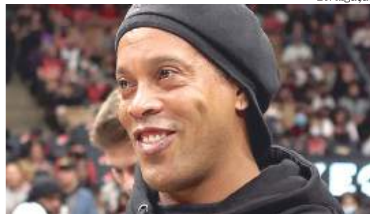
Ronaldinho Gaúcho esteve presente em jogo da NBA, nos EUA

Com a vitória do Spurs (33-45) sobre o Blazers, a distância entre os dois times aumentou e o Lakers vai precisar de um milagre para retomar a vaga.