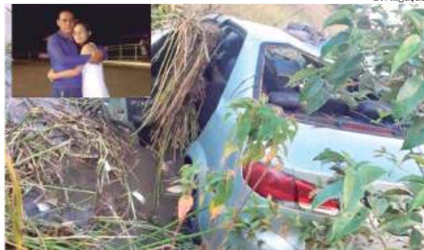
Além dos dois, um primo da família também não resistiu aos ferimentos

As causas do acidente devem ser reveladas após perícia.