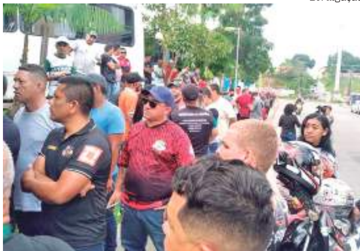
Suspeito das agressões ao motorista seria namorado da passageira

A manifestação ocorreu ao lado de uma base da Secretaria de Segurança Pública do Amazonas (SSP-AM). O grupo aproveitou para repudiar a atuação de policiais militares que, segundo eles, também agrediram o rapaz e receberam os profissionais com tiros de bala de borracha na frente do Comando Especializado de Polícia (CPE) no bairro