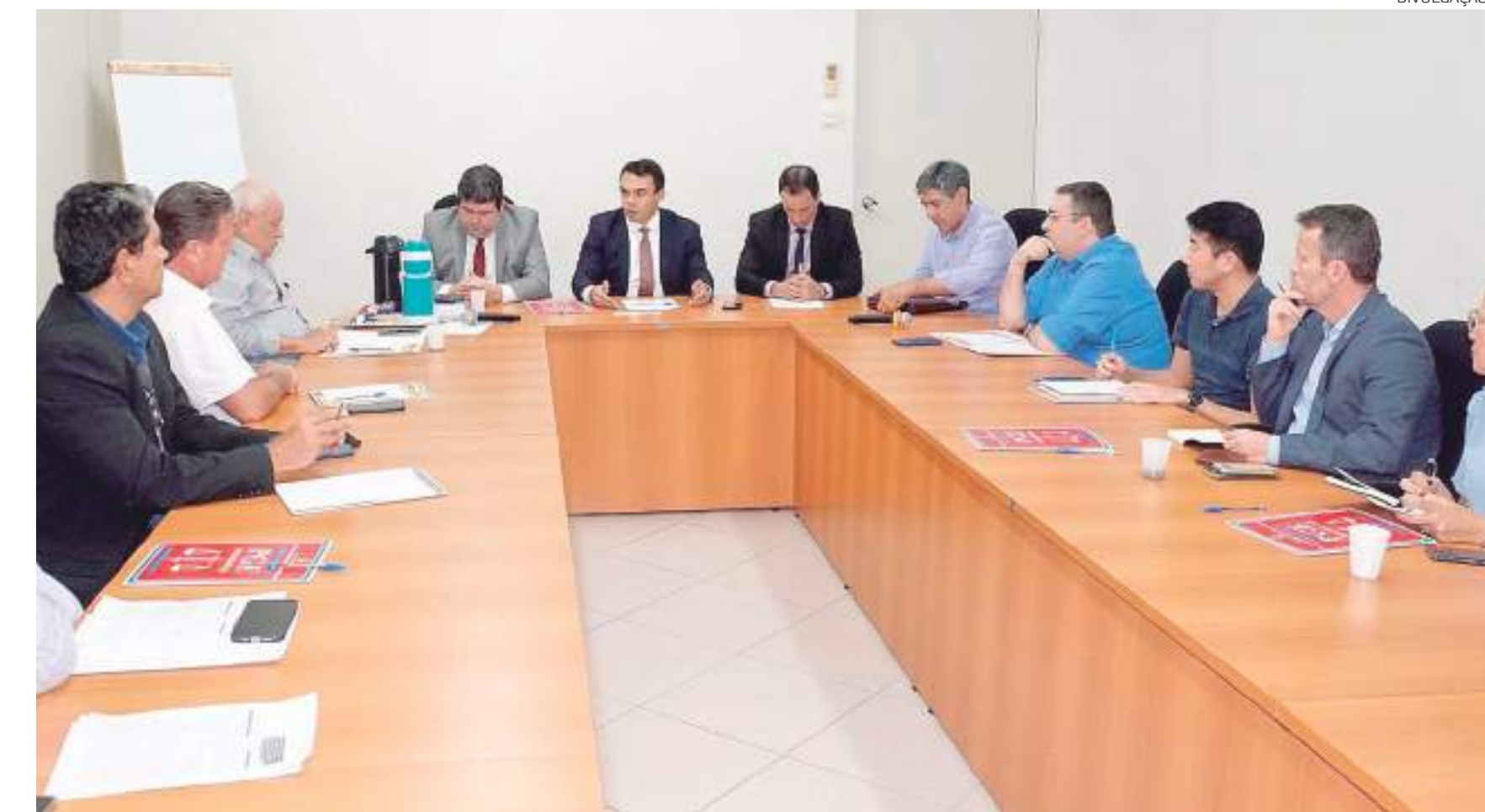
A busca de solução para o impasse segue determinação do governador Wilson Lima