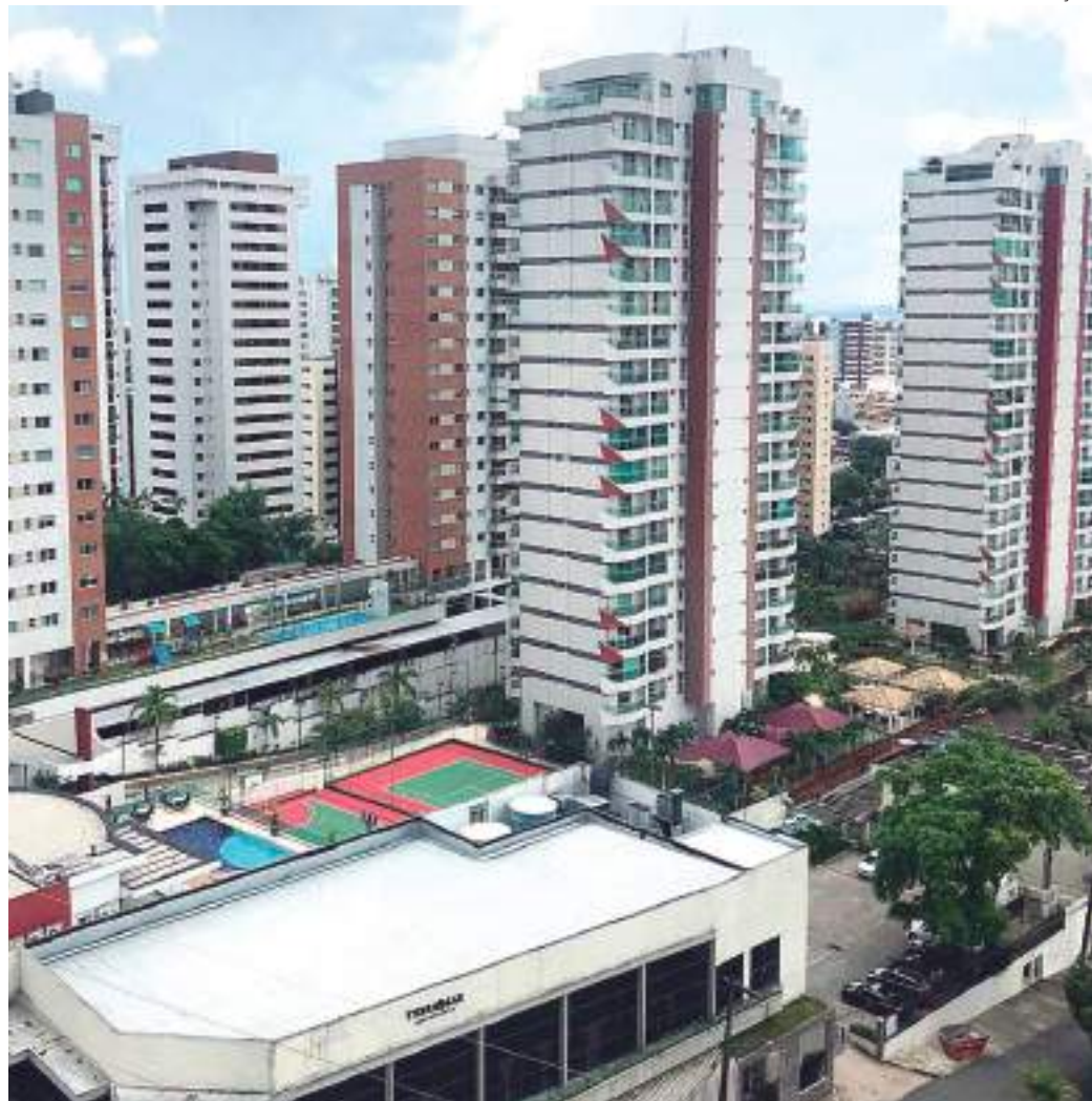
Para a Semtepi, Manaus é uma capital inovadora e com cultura empreendedora

As ações desenvolvidas em Manaus por parte do setor privado e do poder público voltadas ao empreendedorismo renderam o terceiro lugar no Ranking Connected Smart Cities de 2021, no eixo empreendedorismo.