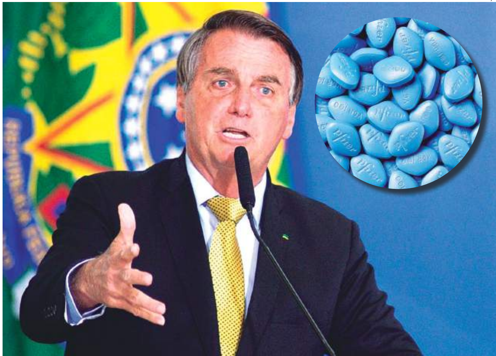
Segundo informou o Ministério da Defesa, o medicamento, usado em casos de disfunção erétil, será utilizado no tratamento de militares com hipertensão pulmonar arterial

O painel de compras do Governo Federal aponta que entre 2018 e 2020 foi reservado R$ 546 mil para a compra de toxina botulínica, o botox, para os militares. Já em 2021 e 2022, foram 17 frascos comprados, sendo 8 em 2021 e 9 neste ano. Nesta semana, diversos veículos repercutiram a informação de que as Forças Armadas realizaram compras de