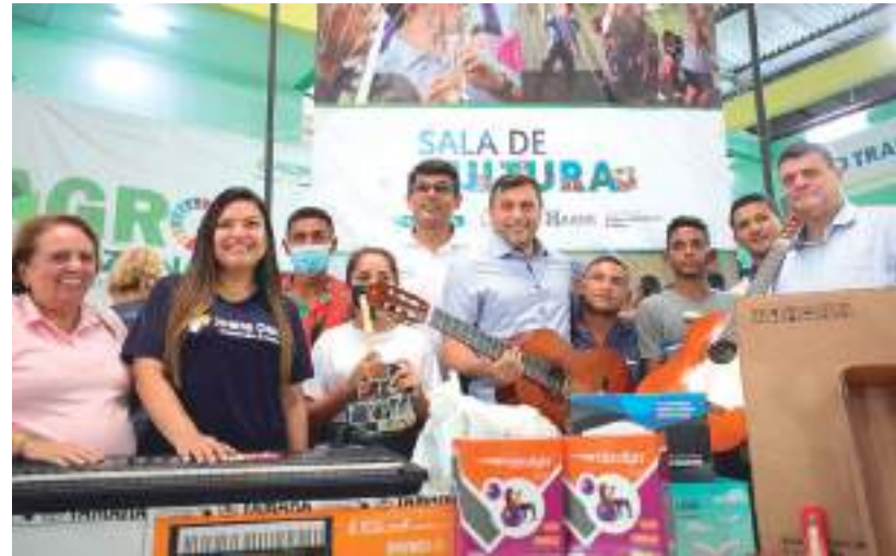
O governador estava acompanhado de deputados estaduais e federais na ação

Por meio da Secretaria de Estado de Saúde (SES-AM) e da Fundação de Vigilância em Saúde do Amazonas - Dra. Rosemary Costa Pinto (FVS-RCP), o Governo do Estado está intensificando a vacinação contra a Covid-19. Durante o Governo Presente, servidores de ambas as instituições oferecem 1ª, 2ª e 3ª doses do imunizante para a população acima de 5 anos.