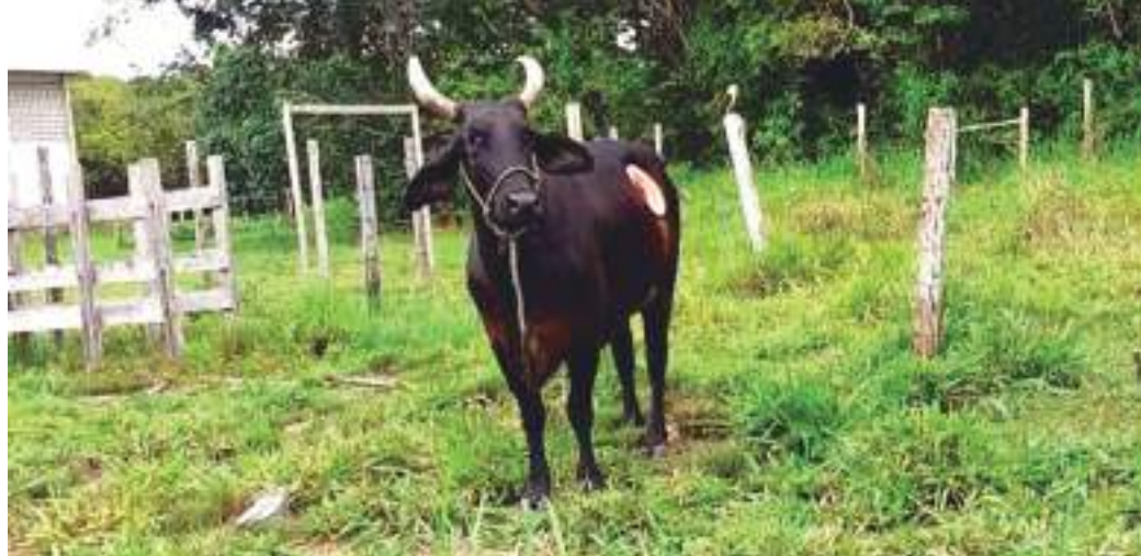
A vaca 'Cinderela' era usada em pesquisas do curso de zootecnia, na UFAM, em Parintins

Ao notarem a ausência da vaca do curral, funcionários da UFAM foram em busca de Cinderela e encontraram a corda e o equipamento usado para proteger o canal da cirurgia, utilizada para observação do processo digestivo da vaca, nas proximidades