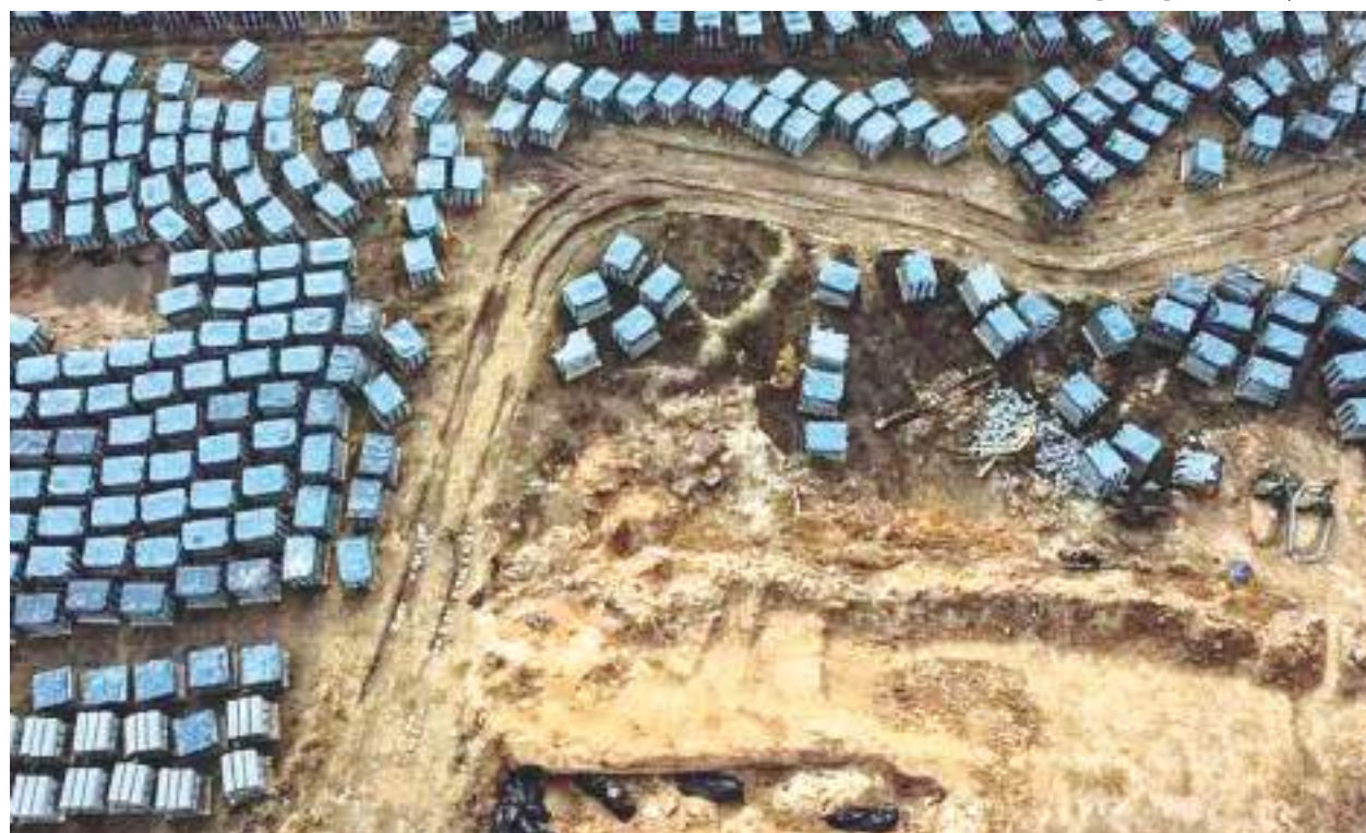
Sacos de cadáveres em uma vala no jardim ao redor da igreja de St Andrew em Bucha, na Ucrânia

O prefeito de Mariupol, na Ucrânia, disse nesta terça-feira (12) que cerca de 21.000 civis foram mortos na cidade portuária desde o início da invasão russa, em 24 de fevereiro. "A situação de Mariupol dificulta a contagem de vítimas, a cidade está sitiada e bloqueada. Estamos calculando entre 20.000 e 22.000 óbitos na região", disse Pavlo Kyrylenko, chefe da administração militar regional. A situação de Mariupol, com cerca de 400.000 habitantes antes da guerra, é a mais grave do ponto de vista humanitário desde o início do conflito. Autoridades ucranianas estimam que centenas de milhares de moradores estejam presos sob bombardeios e sem acesso a comida, água, energia elétrica e aquecimento