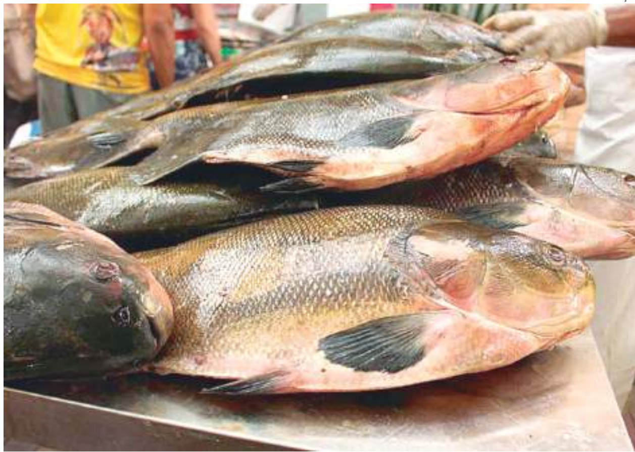
Prato preferido dos amazonenses, o pescado ficou mais caro na Semana Santa

também foi à Manaus Moderna para as tradicionais compras de Semana Santa. Na hora de comprar Jaraqui, disse que tomou um susto. "Praticamente, R$ 20 só 10 unidades. Ano passado eu cheguei a pagar a mesma quantidade a R$10.