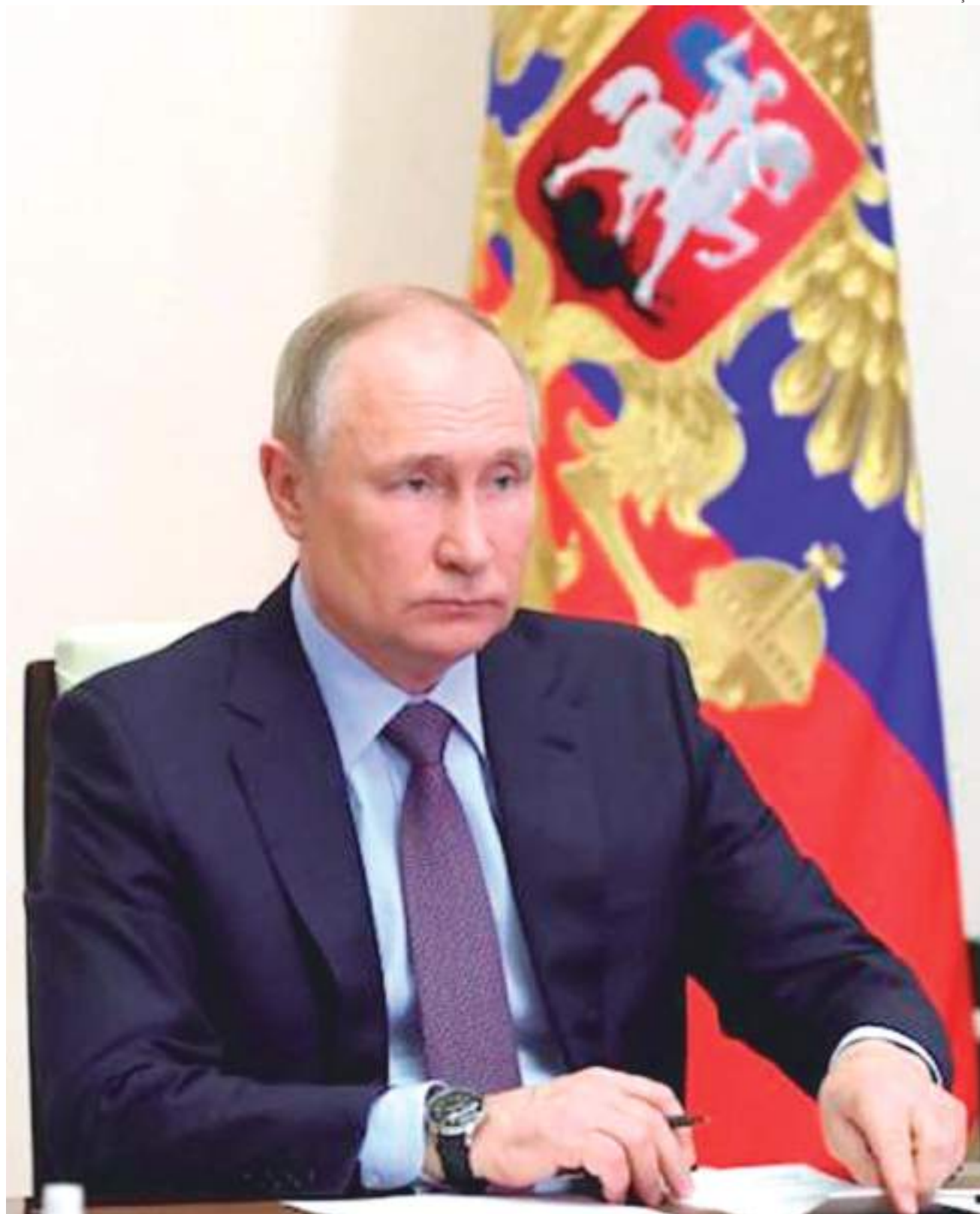
Os reveses da Rússia durante a invasão da Ucrânia podem levar o presidente russo, Vladimir Putin, a usar armas nucleares táticas

Rússia ameaça usar armas nucleares se novos países aderirem à Otan