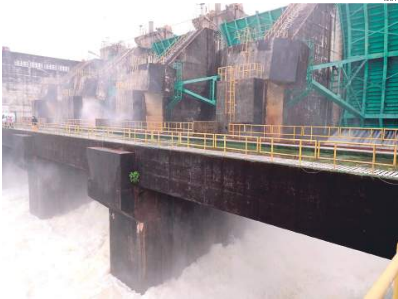
Abertura das comportas pode causar impacto nas comunidades do entorno

Por meio da fiscalização, o Estado busca, ainda, o diálogo com a empresa Eletrobras, responsável pela operação da usina, para assegurar que seja prestada a assistência necessária aos moradores do entorno da hidrelétrica. De acordo com a Prefeitura de Presidente Figueiredo, ao menos 1.300 pessoas são diretamente afetadas, muitas delas moradoras do ramal da Morena, um dos mais atingidos pelas águas do rio Uatumã, que também foi visitado pela comitiva. Segundo o tenente-coronel Hélcio Cavalcante, da Defesa Civil do Amazonas, a primeira resposta é de responsabilidade da Defesa Civil do município, mas todo o processo é acompanhado de perto pelo órgão estadual. "A Defesa Civil do Estado apoia e orienta, verificando as pessoas que estão em área de risco para prestar apoio, retirar as