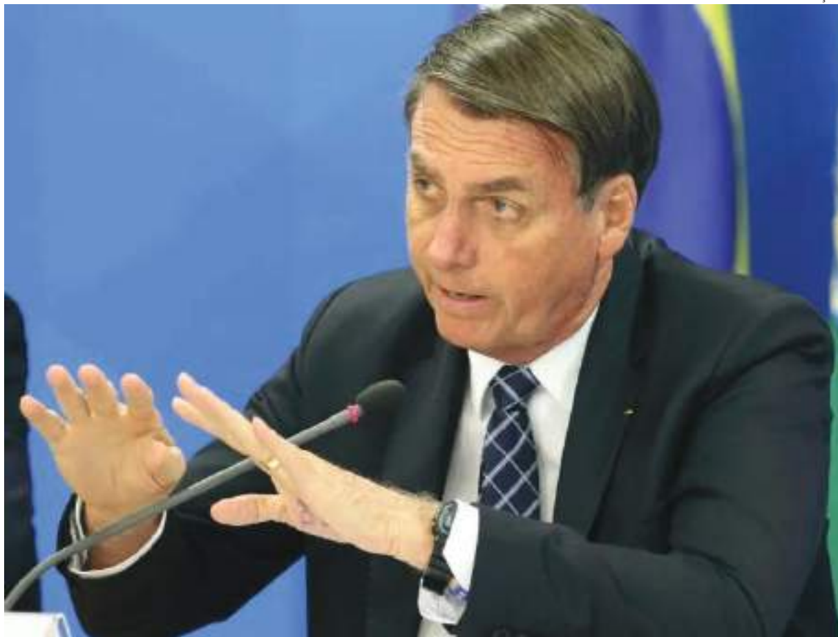
Reajuste segue previsão de 6,7% do INPC para este ano

Em 2022, o salário mínimo está em R$ 1.212. O aumento representou 10,18% em relação a 2021, um pouco maior que o INPC acumulado de 10,16%.