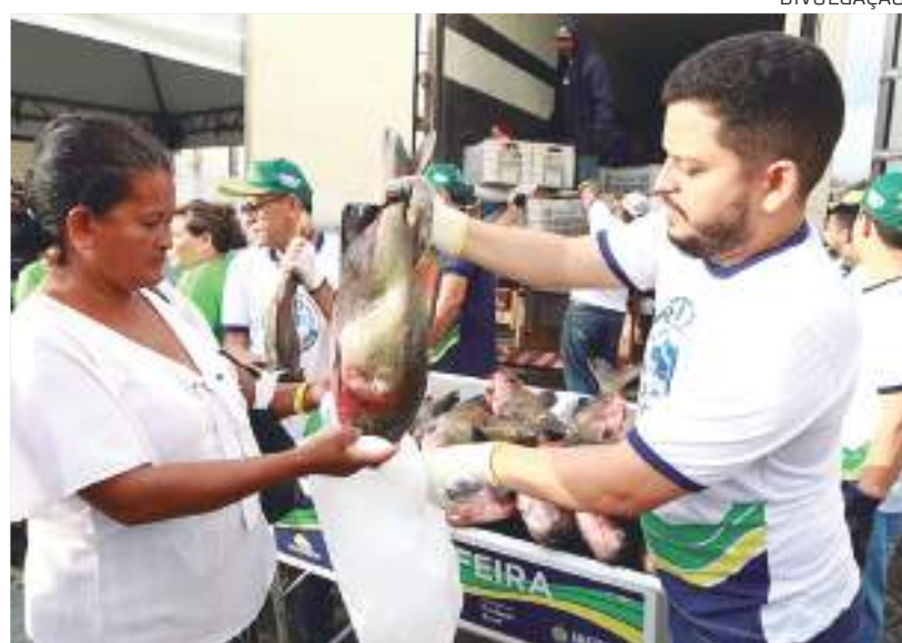
Distribuição foi de mais de 60 toneladas de tambaqui, beneficiando 25 mil pessoas

passai e vi, aqui eu tive a oportunidade de pegar e vai ajudar bastante nesta Semana Santa", disse o mototaxista.