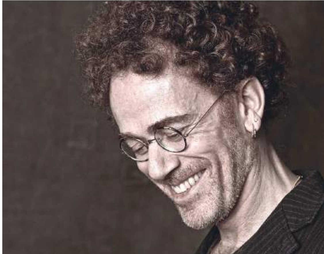
O evento será dividido em quatro setores (pista, arquibancada, frisa e camarote)