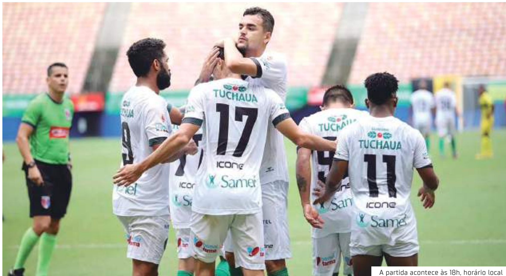
A partida acontece às 18h, horário local

Times amazonenses representam o estado no Campeonato Brasileiro C e D