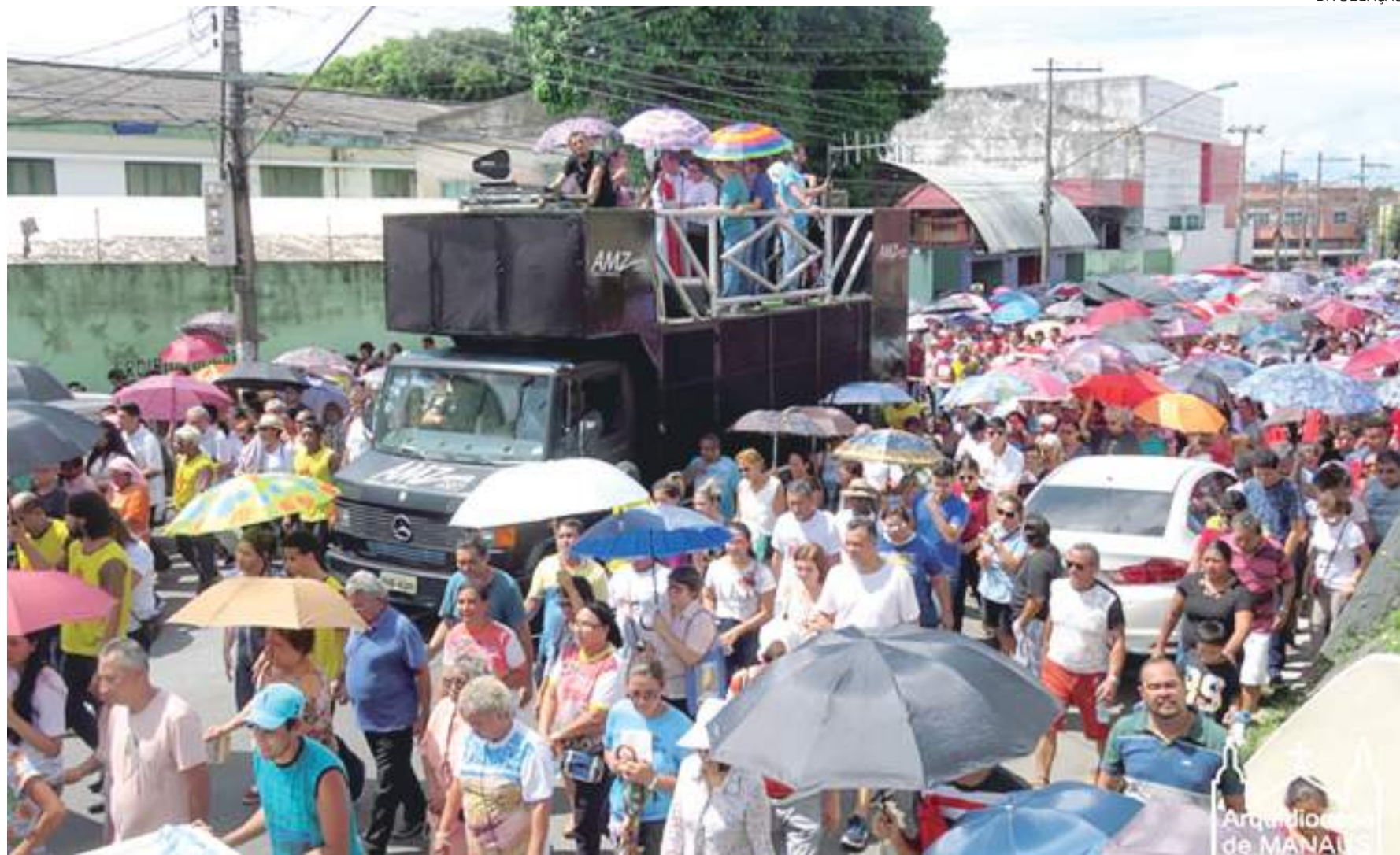
Na última Via-Sacra, em 2019, mais de 8 mil pessoas participaram da celebração que partiu da 'Igreja da Matriz' até o Santuário de Fátima

remos o álcool necessário para higienização e teremos todos os cuidados", afirmou o arcebispo.