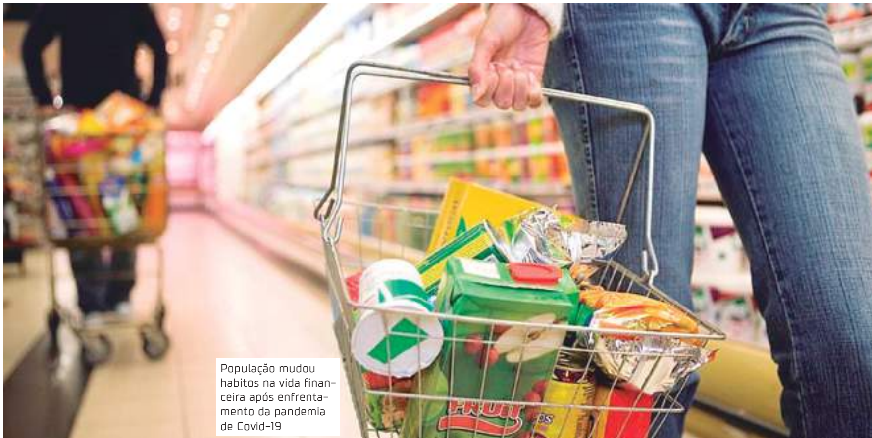
População mudou hábitos na vida financeira após enfrentamento da pandemia de Covid-19

A pesquisa "Pandemia e os Impactos Financeiros", realizada pela Serasa em parceria com o Instituto Opinion Box, revela o que mudou na vida financeira dos brasileiros após dois anos de enfrentamento da Covid-19 e os reflexos dessas transformações nos hábitos de consumo, lazer e comportamento. O estudo mostra que o brasileiro aumentou sua disposição para empreender, buscando renda por conta própria, reduziu o uso do dinheiro vivo, substituindo-o pelo PIX, passou a priorizar os gastos em casa, como TVs por assinatura, e reduziu drasticamente os investimentos com lazer externo. Essa tendência também foi seguida na Região Norte.