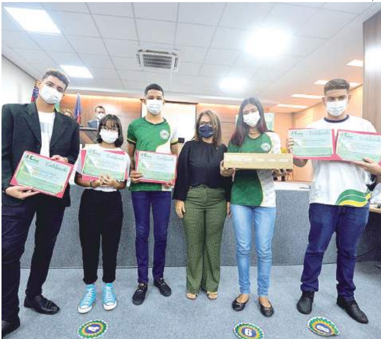
Os 10 primeiros classificados nas três categorias receberam certificados de participação