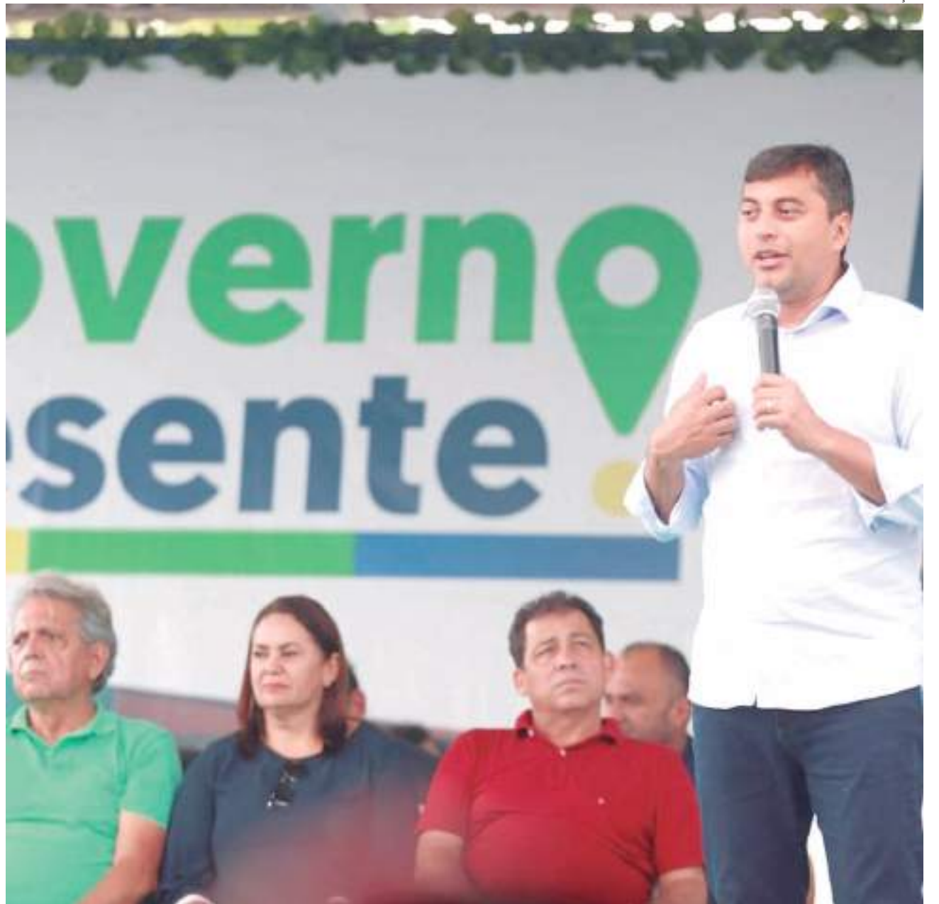
O governador do Estado ressaltou a ampliação de oportunidades de emprego para os habitantes do Alto Solimões

"O Cetam proporcionou muitas coisas na minha vida. A partir do momento em que me formei pelo