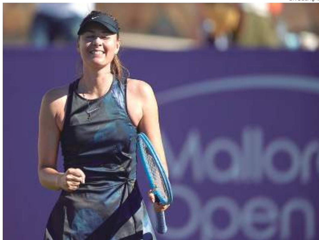
A tenista é uma das atletas mais bem sucedidas da Rússia nos últimos tempos

Durante sua carreira, Sharapova conquistou cinco títulos de grand slams, com um Wimbledon, um Australian Open, um US Open e dois Roland Garros. Além disso, também soma uma medalha de prata olímpica em Londres 2012. Nos últimos anos, conviveu com recorrentes lesões, realizando seu último jogo na primeira fase do Australian Open, quando perdeu para a croata Donna Vekić.