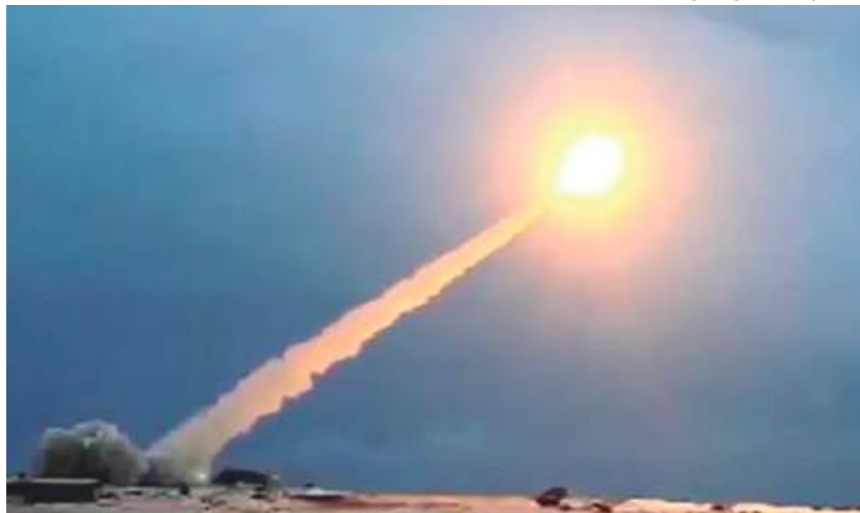
Rússia quer mostrar seu poderio armado para o mundo por meio da Guerra na Ucrânia

A Rússia disse ontem (20) que realizou um primeiro teste de lançamento de seu míssil balístico intercontinental Sarmat, uma nova e esperada adição ao seu arsenal nuclear que o presidente Vladimir Putin disse que faria os inimigos de Moscou pararem e pensarem. Putin foi mostrado na televisão sendo informado pelos militares que o míssil havia sido lançado de Plesetsk, no noroeste do país, e atingiu alvos na península de Kamchatka, no extremo leste. O Sarmat está em desenvolvimento há anos e, portanto, seu lançamento de teste não é uma surpresa para o Ocidente, mas ocorre em um momento de extrema tensão geopolítica sobre a guerra na Ucrânia. “O novo complexo tem as mais altas características táticas e técnicas e é capaz de superar todos os meios modernos de defesa antimísseis. Não tem análogos no mundo e não terá por muito