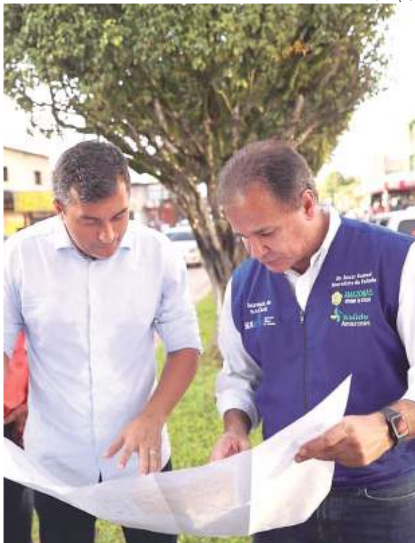
Wilson Lima leva obras para municípios de Benjamin Constant e Tabatinga

Os investimentos que o Governo do Amazonas fará na infraestrutura dos municípios de Benjamin Constant e Tabatinga somam mais de R$ 58 milhões, entre obras diretas e convênios firmados com as prefeituras locais. Os dois municípios receberam ontem (20), ações do programa Governo Presente, coordenadas pessoalmente pelo governador Wilson Lima.