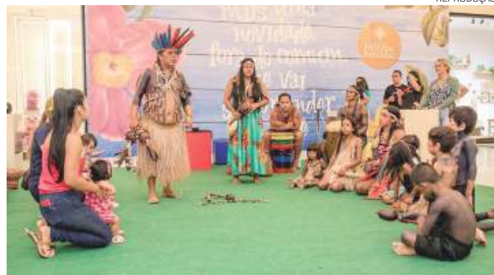
Evento prossegue até o próximo domingo, 24