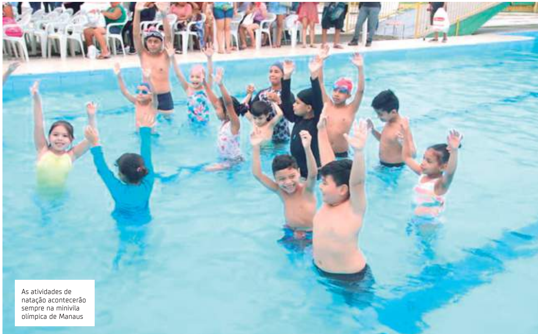
As atividades de natação acontecerão sempre na minivila olímpica de Manaus