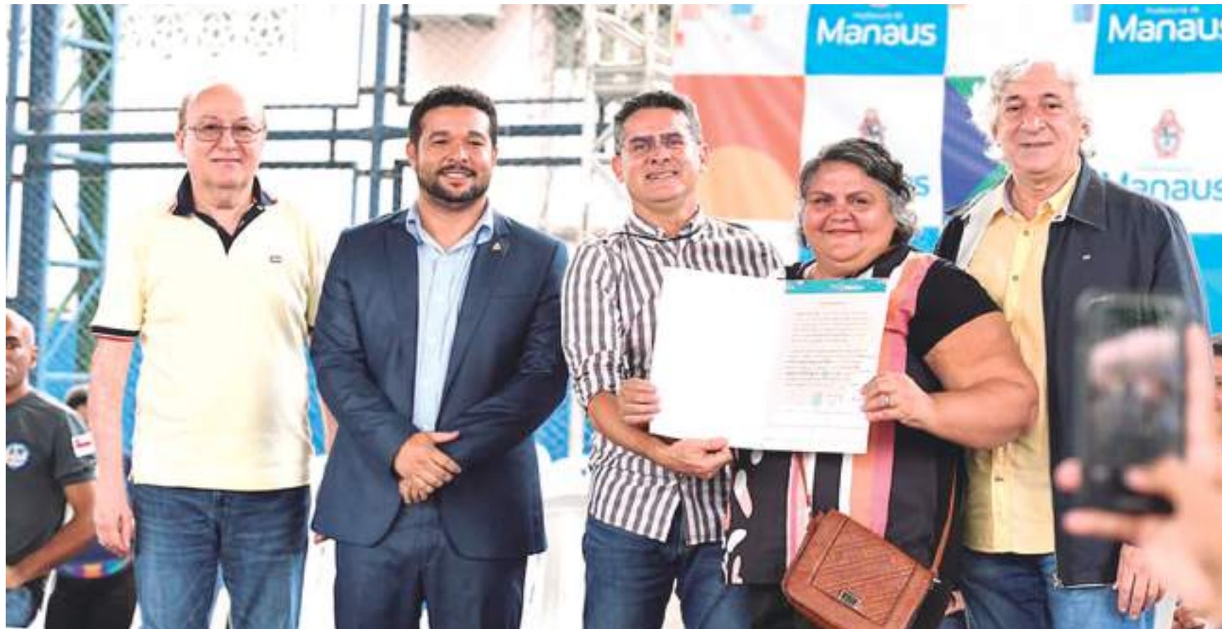
Os documentos que serão entregues são definitivos, já registrados em cartório e sem custo ao beneficiário