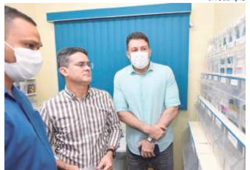
A unidade, de porte I-B, recebeu trabalhos de revitalização, como a troca de telhado, restauração de equipamentos médicos hospitalar e odontológico

A carteira de serviços de saúde da unidade S-33 no bairro do Japiim, cuja população estimada é de 59.038 pessoas, compreende a coleta de material para exame laboratorial, coleta de preventivo do câncer de colo do útero (Papanicolau), curativos, retirada de pontos, aferição de pressão arterial e glicemia capilar, verificação de peso e altura, administração de medicamen-