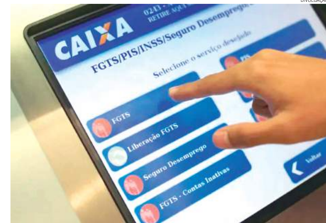
Valores só podem ser movimentados por meio do aplicativo Caixa Tem

O trabalhador precisa ficar atento. A maioria dos cerca de 42 milhões de trabalhadores receberá o dinheiro automaticamente, na conta poupança social digital da Caixa. No entanto, em caso de dados incompletos que não permitam a abertura da conta digital, ele terá de pedir a