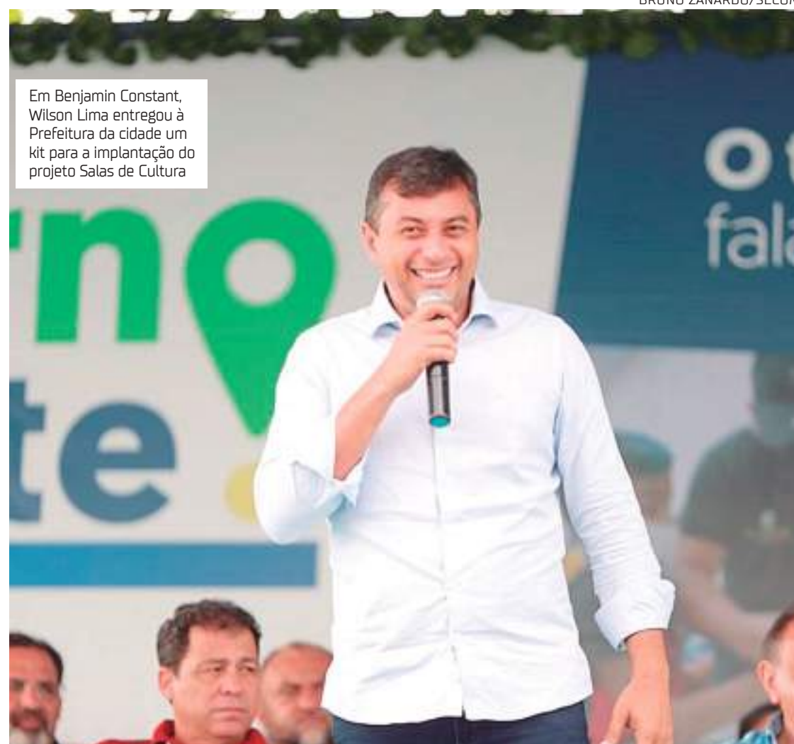
Em Benjamin Constant, Wilson Lima entregou à Prefeitura da cidade um kit para a implantação do projeto Salas de Cultura

Como intuito de emitir mais de 4 mil RGs, o programa Governo Presente, na calha do Alto Solimões, atendeu os moradores dos municípios de Benjamin Constant e Tabatinga, distantes a 1.121 e 1.108 quilômetros de Manaus, respectivamente. Nesta quarta-feira (20), o governador Wilson Lima acompanhou as ações do projeto, que também oferece outros serviços para a população.