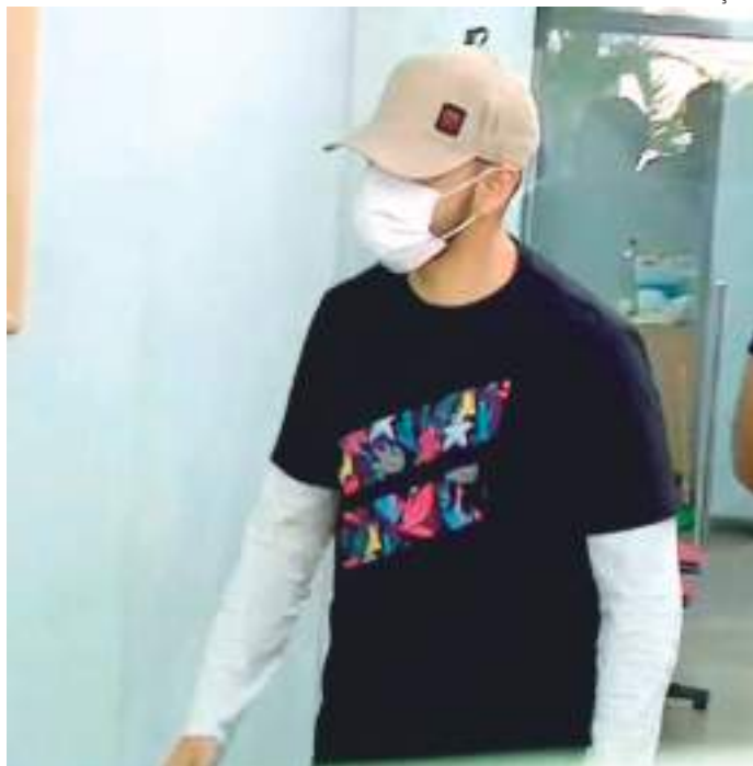
O torcedor, sem blusa, com uma tatuagem que faz apologia ao nazismo, causou revolta

A tatuagem de Águia desenhada nas costas do torcedor é símbolo do Partido Nacional Socialista dos Trabalhadores Alemães, e foi amplamente usada durante o nazismo, um dos capítulos mais tristes da história da humanidade.