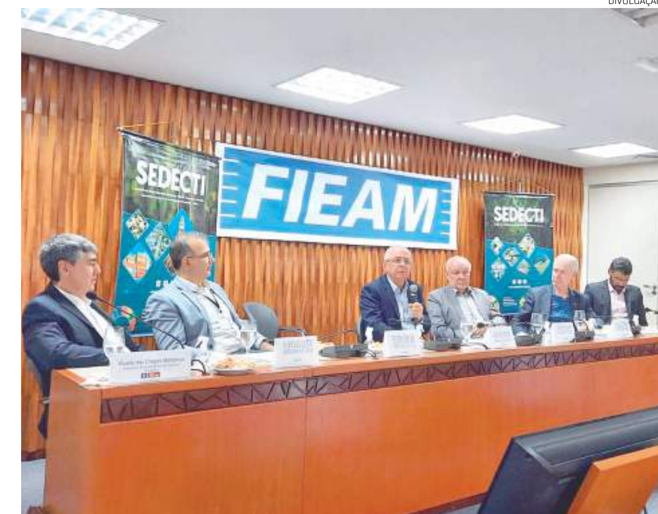
A reunião aprovou 37 projetos, sendo 13 de implantação, 23 de diversificação e um de atualização.

Projetos e novos empregos A reunião aprovou 37 proje-