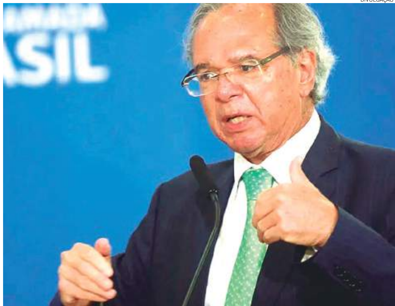
Ministério da Economia estima que programa libere R$ 14 bi em crédito para empresas

O pacote também inclui a redução a zero da alíquota do Imposto sobre Operações Fi-