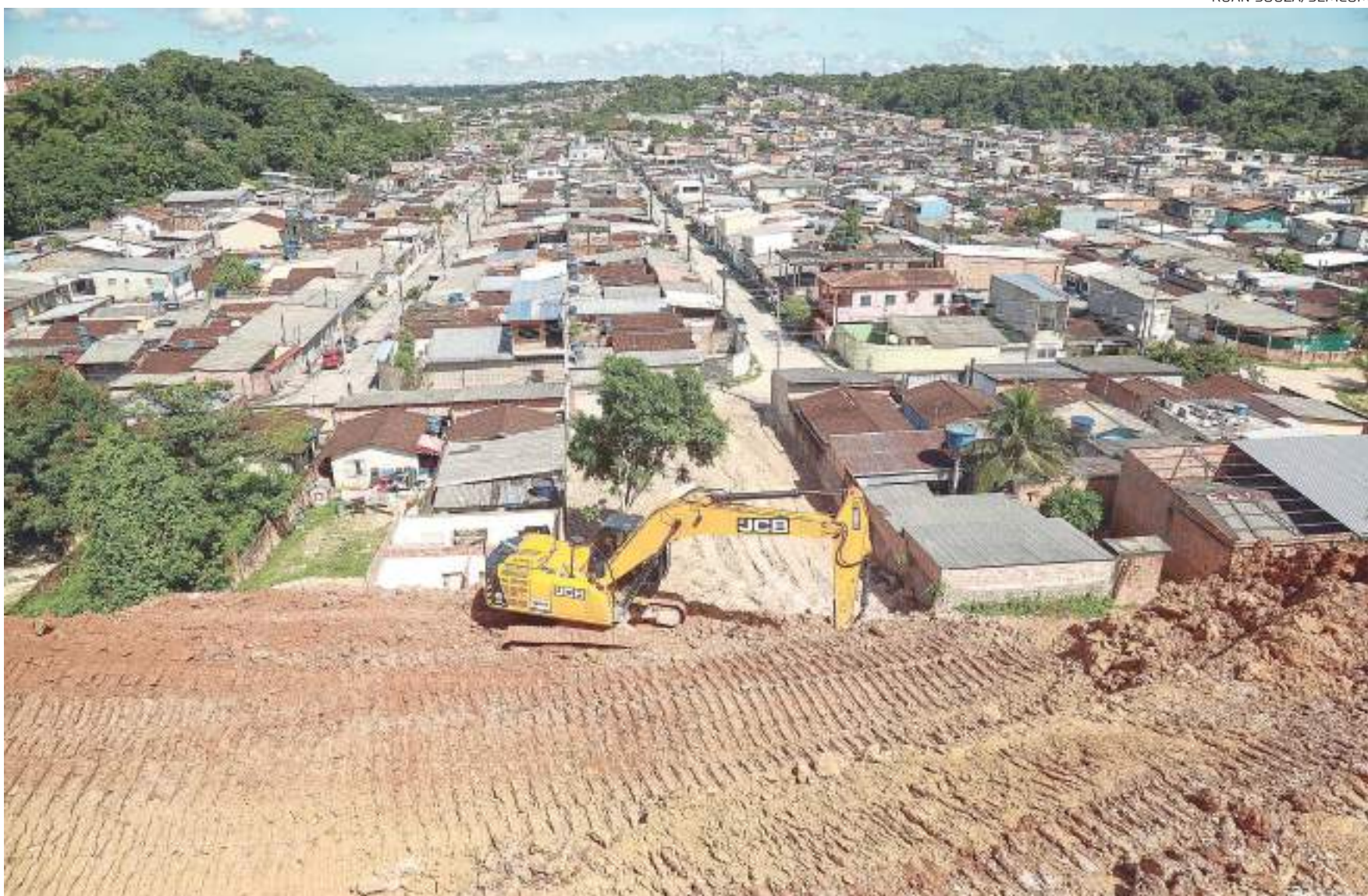
Além do Mauazinho, o prefeito David Almeida ainda vistoriou os serviços realizados no bairro Cidade Nova, no Francisca Mendes e no Grande Vitória

David Almeida realizou uma série de fiscalizações em obras de recuperação em áreas atingidas por erosões