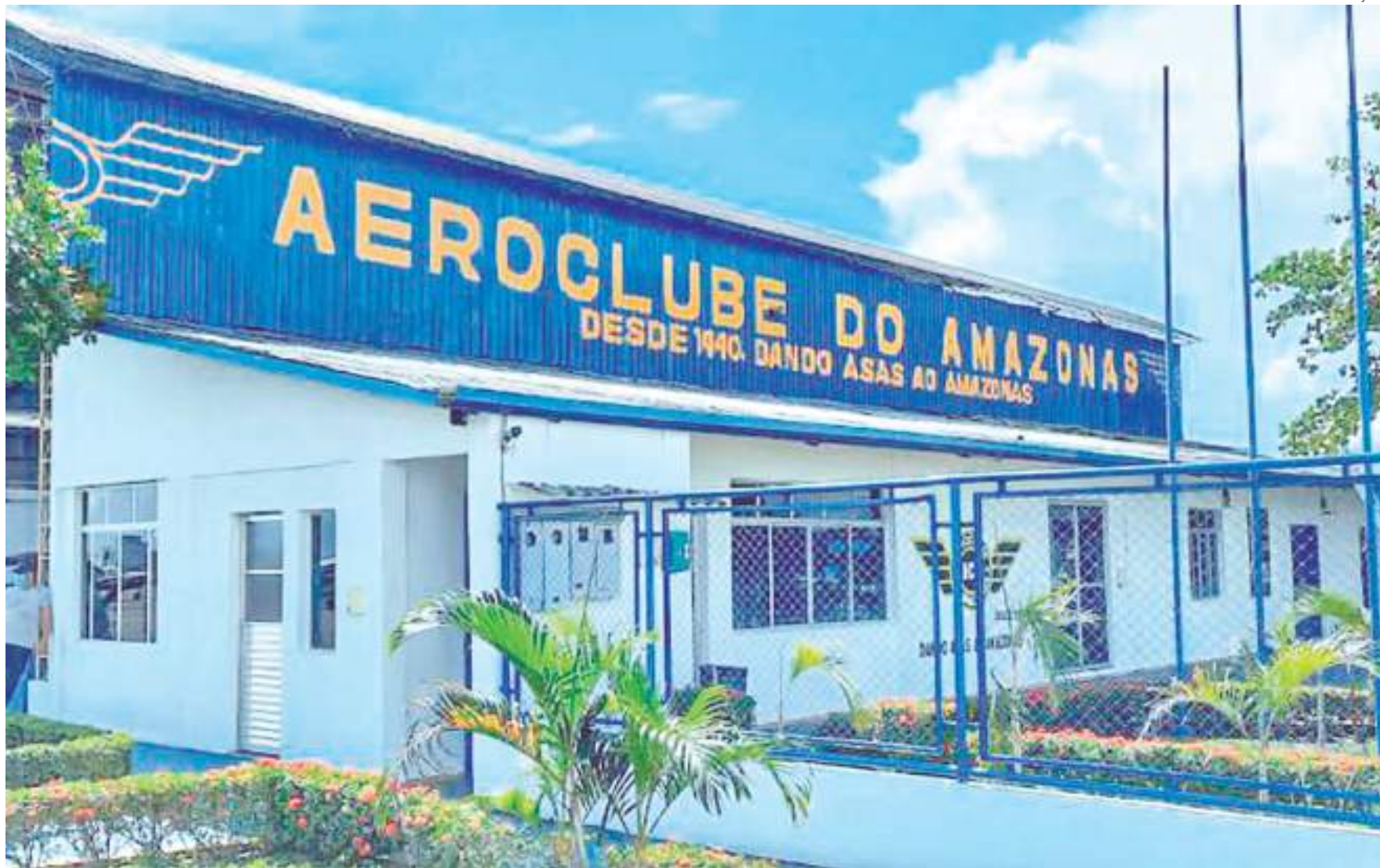
No dia do acidente, o avião saiu do aeroclube e os paraquedistas tinham a intenção de tocar o solo no mesmo local. Quatro deles tiveram pousos alterados

"O atleta quando entra na aeronave, não é obrigado a saltar. Então, todos que saltaram tinham a segurança que iriam pousar. Isso foi uma fatalidade, ninguém saltaria do avião se eles se sentissem