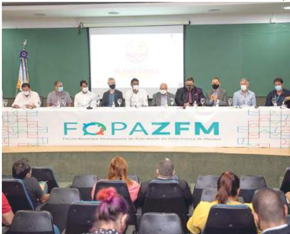
Fórum Municipal Permanente de Articulação da Zona Franca de Manaus