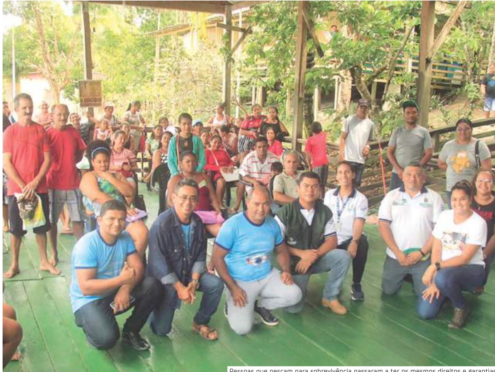
Pessoas que pescam para sobrevivência passaram a ter os mesmos direitos e garantias

O direito que beneficia famílias rurais de todas as regiões do Amazonas surgiu após inúmeros pedidos do setor pesqueiro, e já vem sendo executado pelo Idam