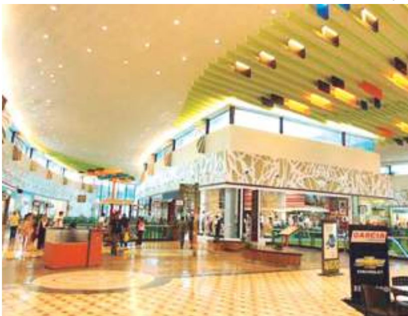
Shoppings têm a preferência dos consumidores para as compras

Para analisar o comportamento dos consumidores manauaras na segunda maior sazonalidade do setor comercial, o Dia das Mães, o Instituto Fecomércio de Pesquisas Empresariais do Amazonas, realizou, no período de 4 a 14 de abril, pesquisa de intenção de compra. O levantamento entrevistou 315 consumidores em diferentes zonas da cidade. Veja abaixo, os destaques da pesquisa: