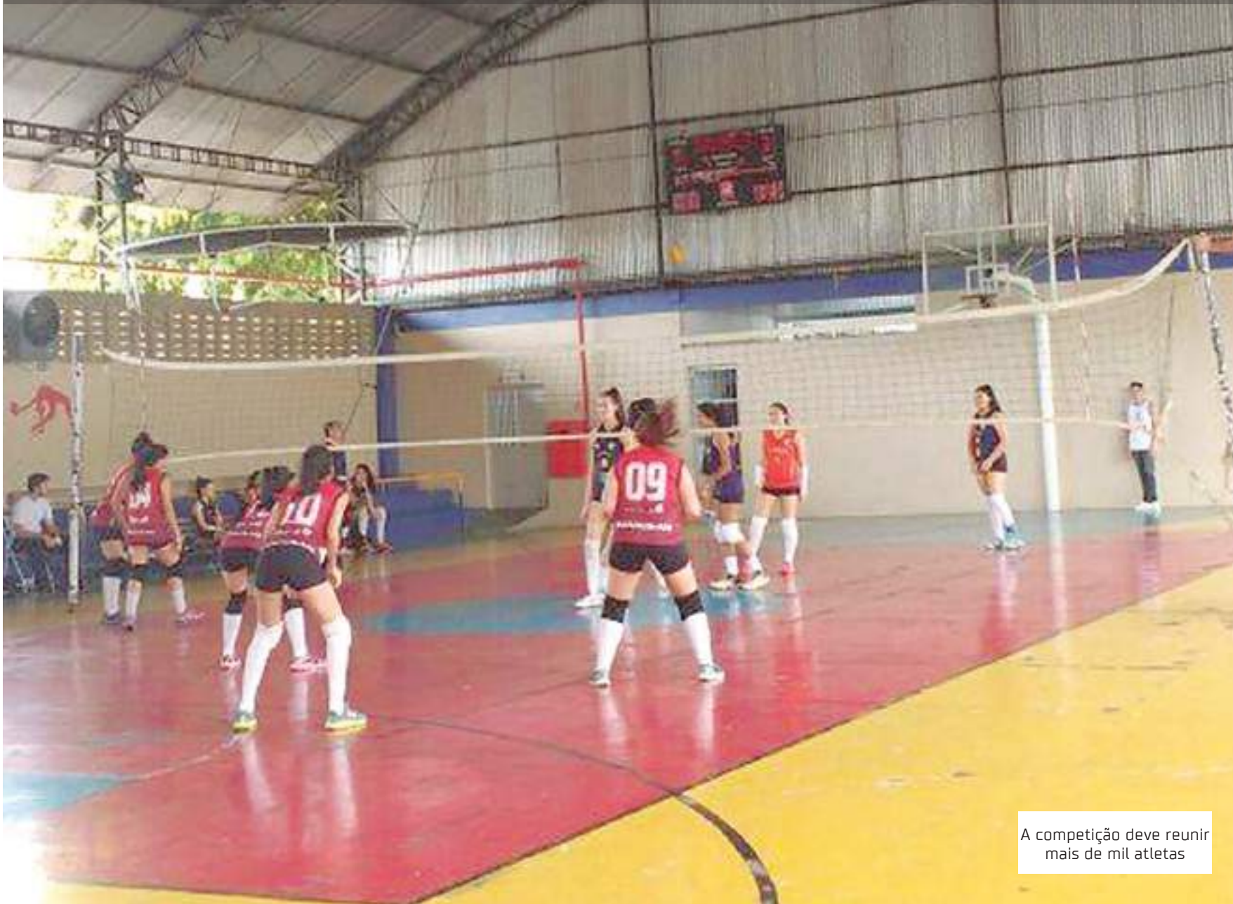
A competição deve reunir mais de mil atletas

Serão mais de 15 modalidades disputadas por equipes ou individuais