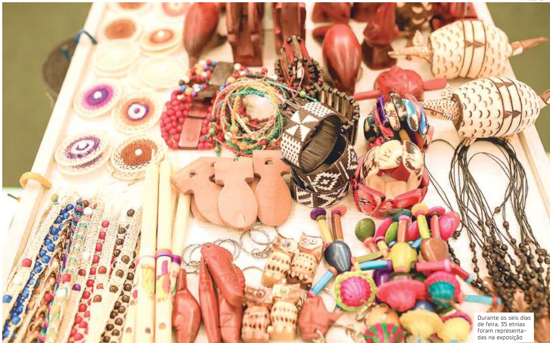
Durante os seis dias de feira, 35 etnias foram representadas na exposição

Ao menos 20 artesãos que produzem itens indígenas puderam participar da oportunidade de comercializar seus artigos