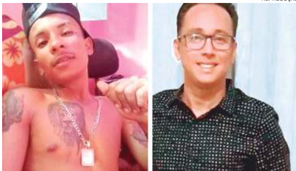
Crímonoso demonstrou frieza após cometer o crime, segundo o delegado da DERFD