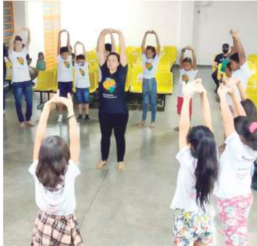
O projeto busca introduzir a prática ao mundo do audiovisual