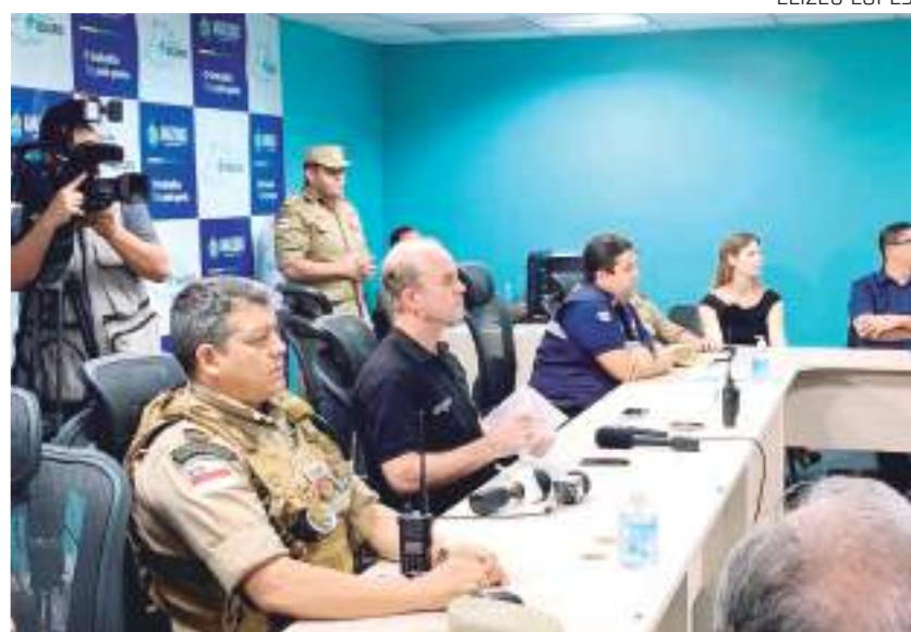
Com o fim do gabinete de crise, buscas seguirão apenas com equipe reduzida

“Nós estamos aqui reunidos para realizar o encerramento do gabinete de crise, que foi aberto quando soubemos dessa ocor-