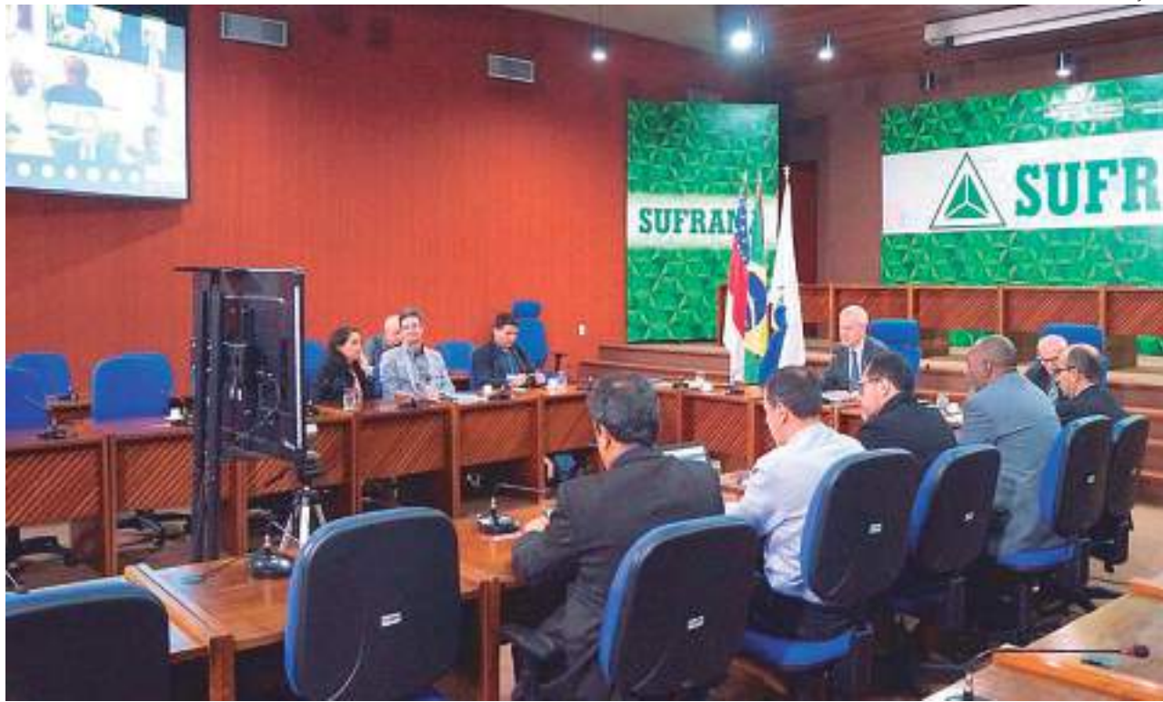
Entre os projetos constam 34 projetos industriais, de serviços e agroindustriais aprovados

Outro destaque é o da fabricante Brudden da Amazônia para a produção de motocicletas elétricas e investimentos previstos de R$ 4,6 milhões. A empresa Flextronics da