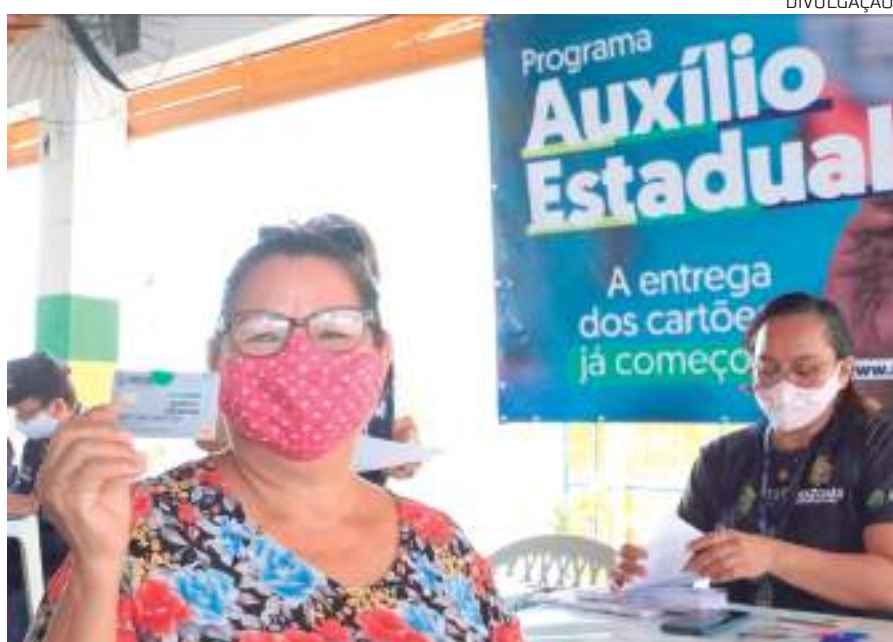
Programa faz parte da política estadual de combate à fome

O Governo do Amazonas prorrogou até o próximo dia 6 de maio o prazo de entrega do Auxílio Estadual permanente às novas famílias selecionadas para receber o benefício.