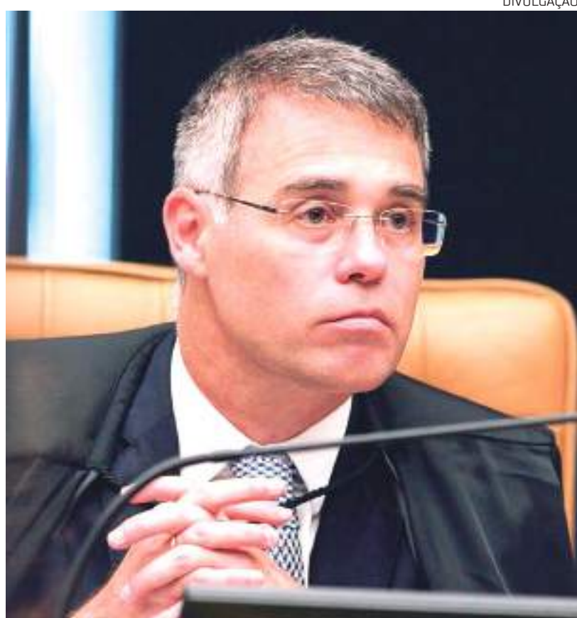
A audiência foi marcada para o dia 3 de maio, às 11h

O ministro do Supremo Tribunal Federal (STF), André Mendonça, marcou, para o próximo dia 3 de maio, uma audiência de conciliação entre o Estado do Amazonas e a União para uma tentativa de solução quanto aos efeitos negativos para a Zona Franca de Manaus (ZFM) do Decreto Federal nº 11.047, de 2022, que reduziu o Imposto de Produtos Industrializados (IPI) em todo o país.