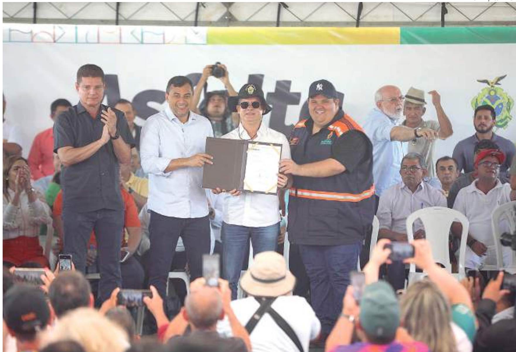
Está prevista a geração de pelo menos 6 mil empregos para atender as 31 frentes de obras que serão distribuídas por todas as zonas da cidade

“A gente tem uma parceria com a Prefeitura de Manaus, a gente assinou no ano passado, e isso contempla a questão da pavimentação, que talvez seja o maior problema urbano que a