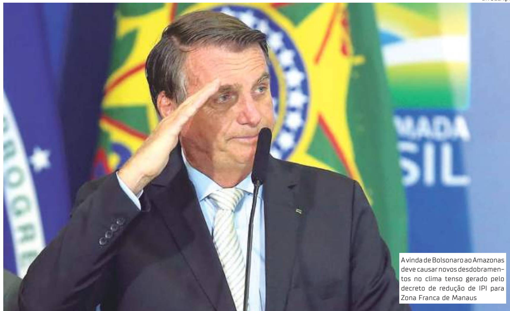
A vinda de Bolsonaro ao Amazonas deve causar novos desdobramentos no clima tenso gerado pelo decreto de redução de IPI para Zona Franca de Manaus