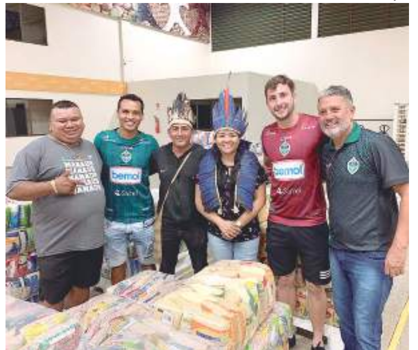
Entrega da arrecadação de alimentos foi feita na noite de quarta-feira (27)