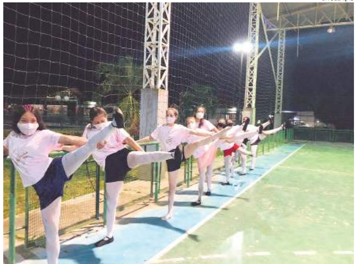
Além do balé infantil e adulto, o projeto promoverá a oficina "Mãe e Filha"

"A ideia de criar a oficina surgiu porque, ao longo de minha carreira, vi diversas mães de alunas com o sonho de fazer aulas de balé, mas nunca tiveram oportunidade. Anos depois, esse sonho ainda permaneceu vivo. Então, vi a necessidade de realizar esses sonhos, ao despertar a bailarina que estava adormecida, além de plantar a sementinha da dança em cada uma delas, pois, a dança tem o poder de mudar vidas", acrescenta.