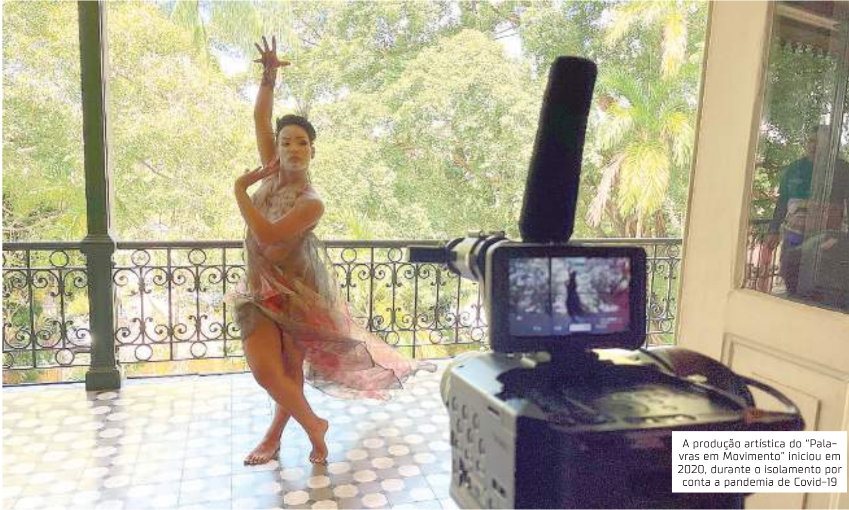
A produção artística do "Palavras em Movimento" iniciou em 2020, durante o isolamento por conta a pandemia de Covid-19

Vídeos inspirados nas obras do escritor amazonense foram gravados em espaços culturais do Estado