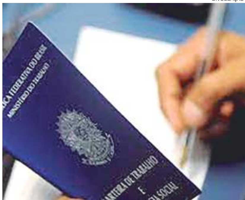
Setor de serviços foi o maior gerador de empregos no País

Brasil fechou o mês de março de 2022 com a criação de 136.189 empregos formais, segundo balanço do Cadastro Geral de Empregados e Desempregados (Novo Caged) apresentado nesta quinta-feira (28) pelo Ministério do Trabalho e Previdência. O número é menor do que os 153.431 empregos novos gerados em março do ano passado. O saldo de março último foi resultado de 1.953.071 contratações menos 1.816.882 de demissões. O estoque de empregos formais, que é a quantidade total de vínculos celetistas ativos no país, encerrou março 41,2 milhões de empregados, variação de positiva de 0,33% em relação ao mês anterior. No acumulado do ano de 2022, foi registrado saldo de 615.173 empregos, decorrente de 5.820.897 admissões e de 5.205.724 desligamentos. "Este é o terceiro mês consecutivo que