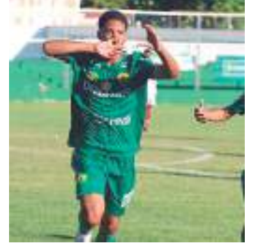
Dourado venceu o Rolo Compressor pelo placar de 4 a 1, no MT