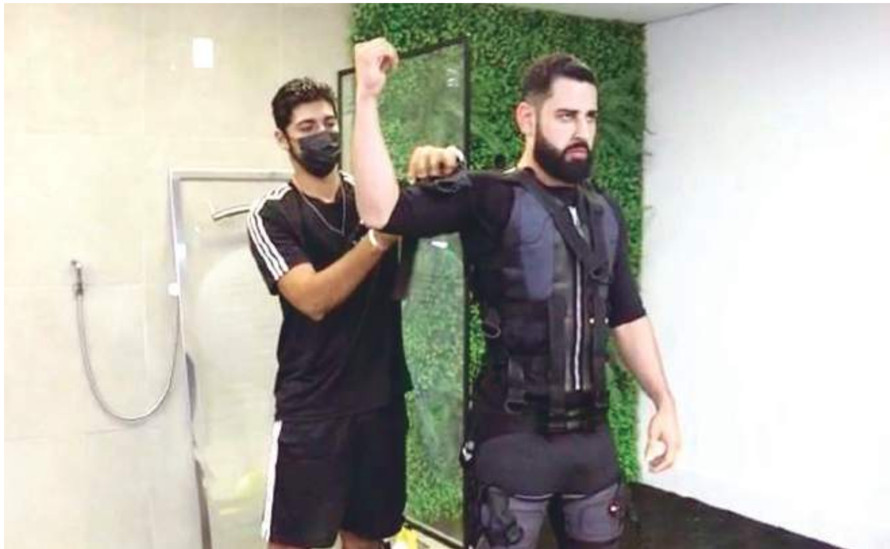
A máquina XBody – tecnologia que usa a eletroestimulação muscular – é uma nova forma de se exercitar

Basta vestir esse colete de treinamento, sobre uma roupa de