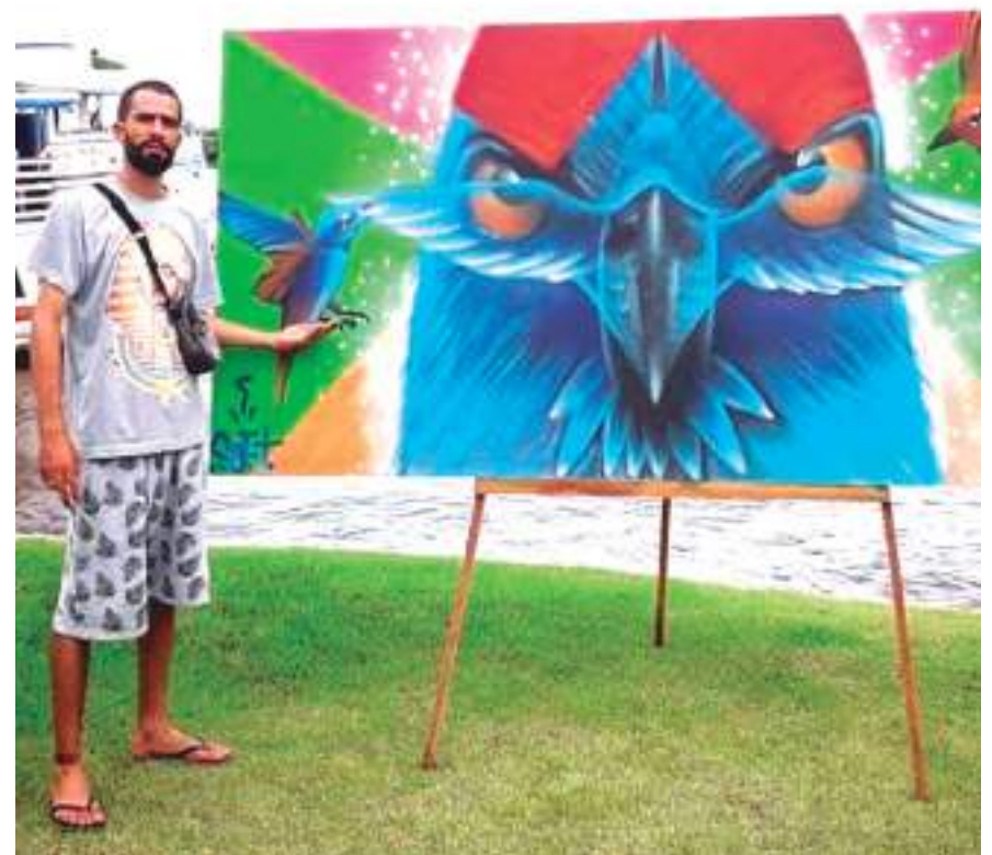
Evento promete impactar o público de 7 a 10 de abril

"Certamente foi um trabalho desafiador levar minha arte para um outro tipo de superfície e também para outras pessoas, além do contato com todo o ambiente da Ponta Negra. Na minha obra busquei passar uma mensagem para que todos que forem na exposição possam refletir e ampliar seus horizontes", acrescentou a artista.