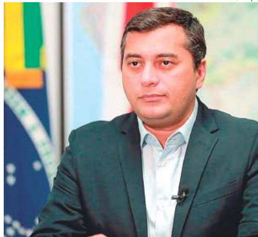
Por enquanto, o governador ainda não definiu seu vice na chapa