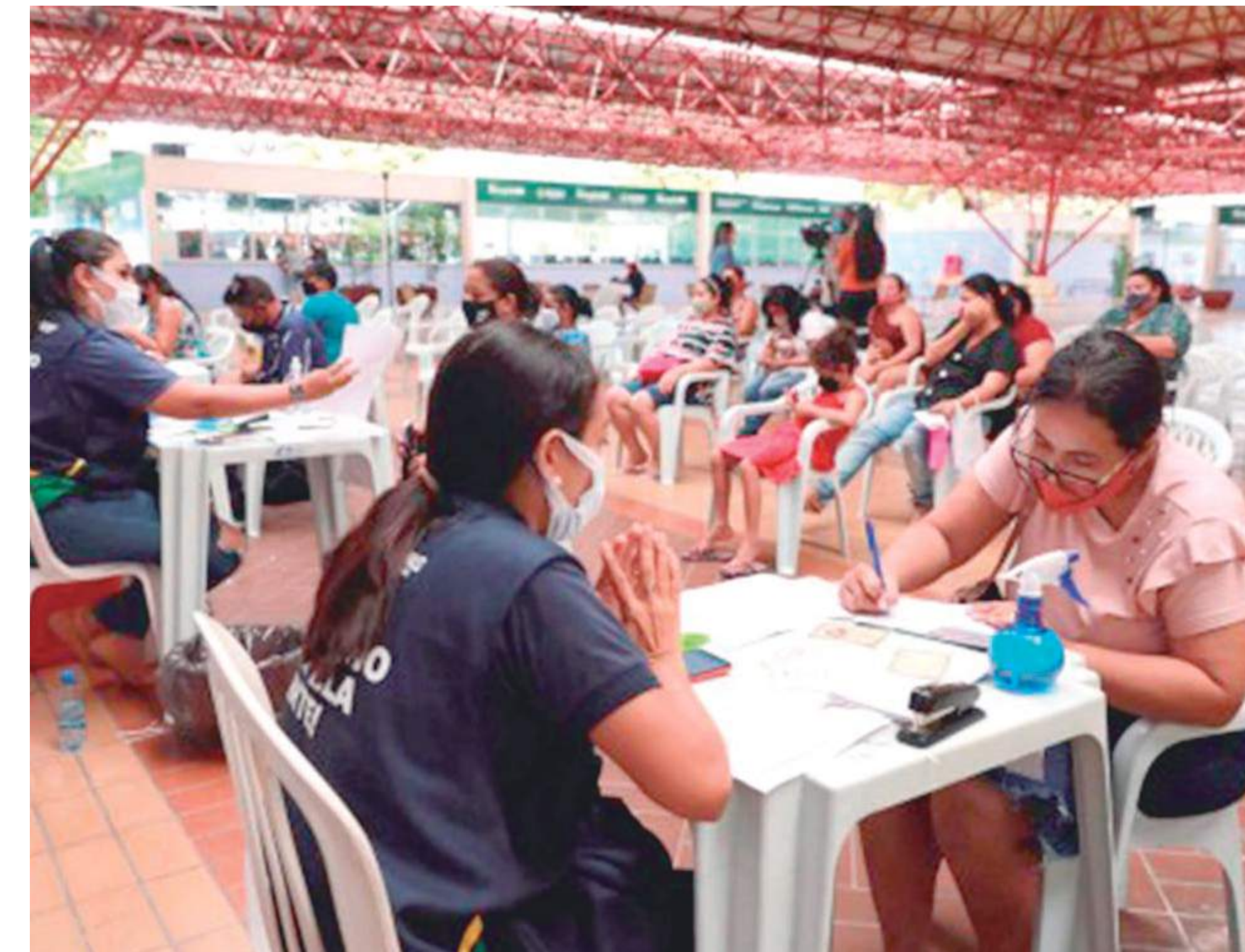
Novos contemplados foram selecionados por meio do cadastro único

Os novos contemplados foram selecionados por meio do Cadastro Único para programas sociais do Governo Federal, o CadÚnico,