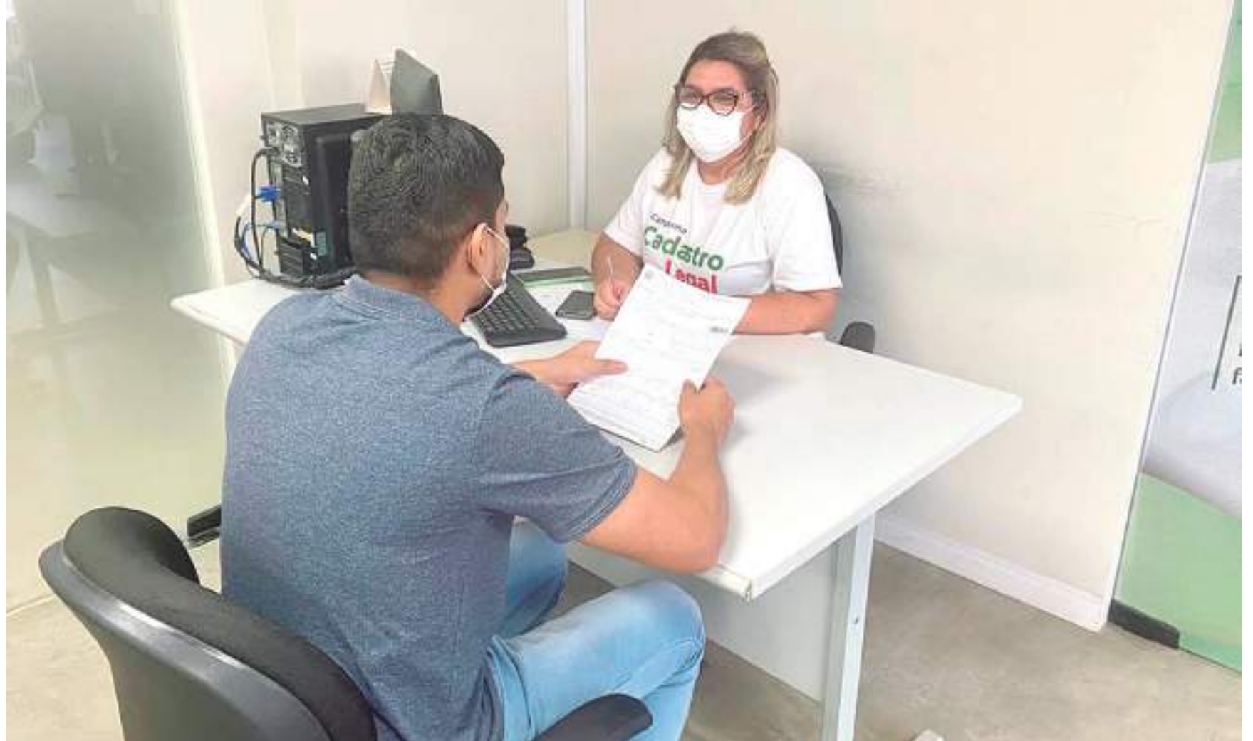
Foram abertas 1.051 empresas de prestação de serviços, 741 de comércio e 75 na indústria

Guimarães, avalia que a transformação digital é um dos principais fatores que possibilitaram a conquista de resultados tão positivos alcançados nos últimos meses.