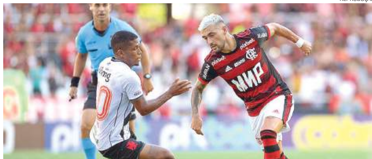
Isla também é cortado, com lesão no quadríceps sofrida pela seleção chilena

Por outro lado, o clube terá a presença do reforço Santos. O goleiro vindo do Atlético-PR foi anunciado neste domingo, e já fica à disposição de Paulo Sousa. Para a mesma posição, também estão relacionados Hugo, atual titular, e Diego Alves.