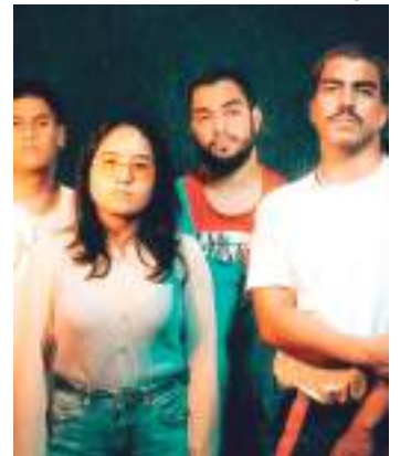
O grupo decidiu celebrar os sons que marcaram os fãs