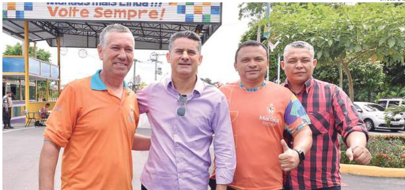
O secretário da Semulsp destacou que o trabalho não vai parar em todos os bairros de Manaus