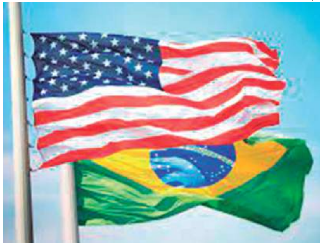
EUA tem interesse em parcerias no Amazonas