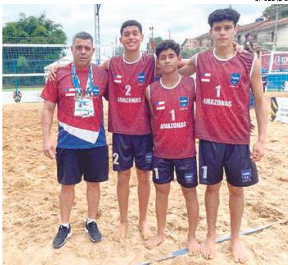
A equipe amazonense agora está credenciada a disputar a Série Ouro em 2023