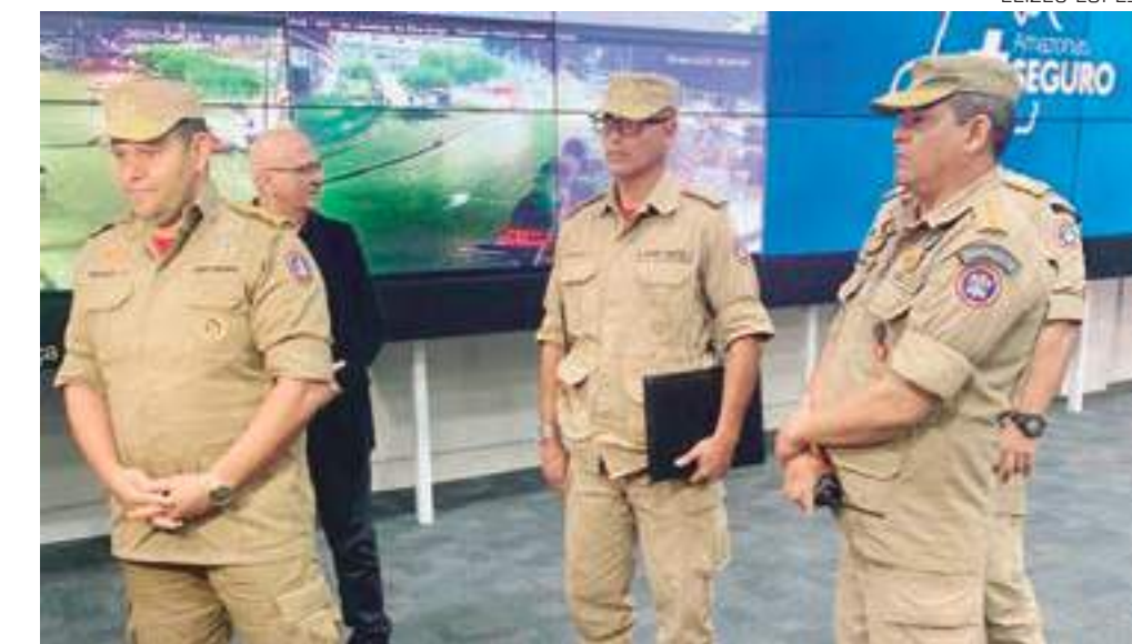
Toda a estrutura dos Bombeiros está sendo empregada nas buscas

posta estão sendo usadas, com cinco embarcações da Marinha e mais uma aeronave. Também foi usado um contingente de 90 pessoas, do Corpo de Bombeiros e da Polícia Militar, nesta segunda-feira", disse o Cel.