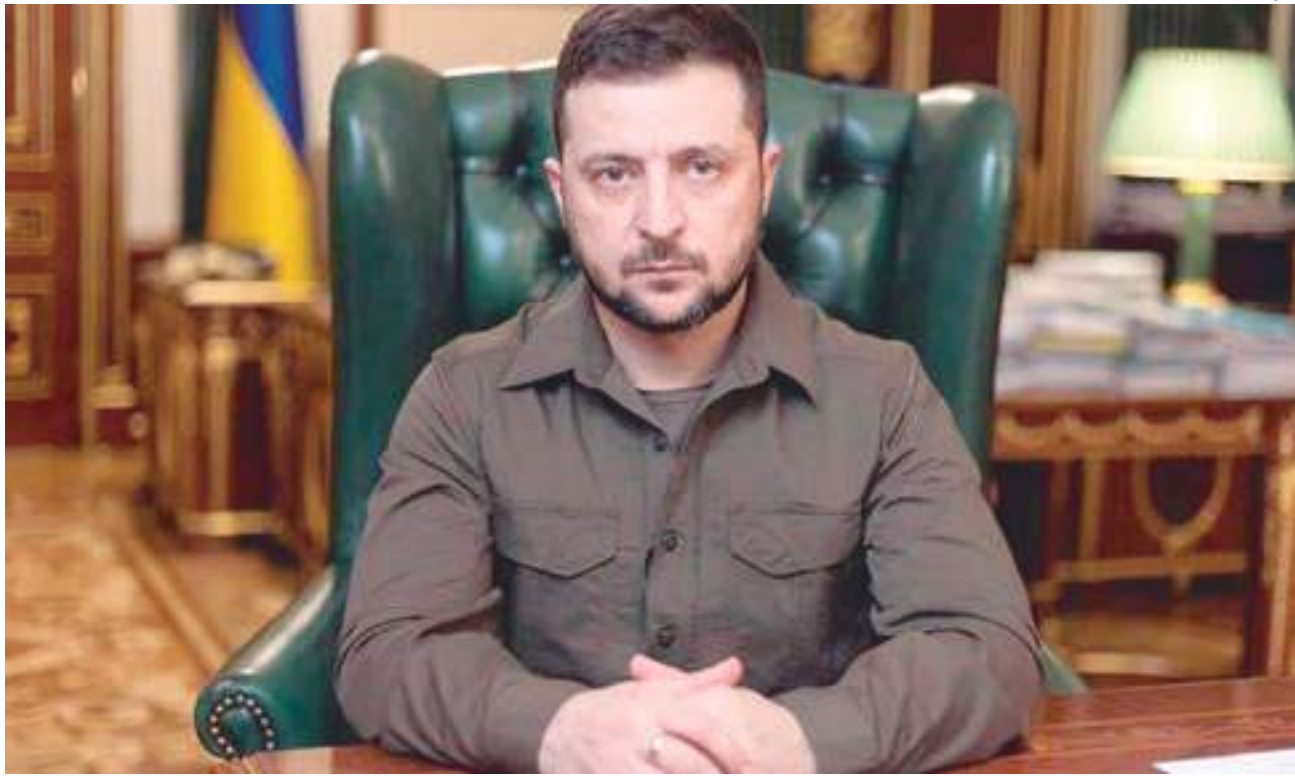
Rússia se preparou para a Batalha de Donbass, disse Zelenskiy

O secretário do Conselho de Segurança da Ucrânia, Oleksiy Danilov, disse em comentários televisionados: "Eles [as forças