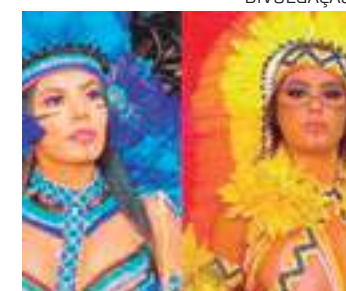
Artistas dos bumbás se unem a outros nomes da cultura