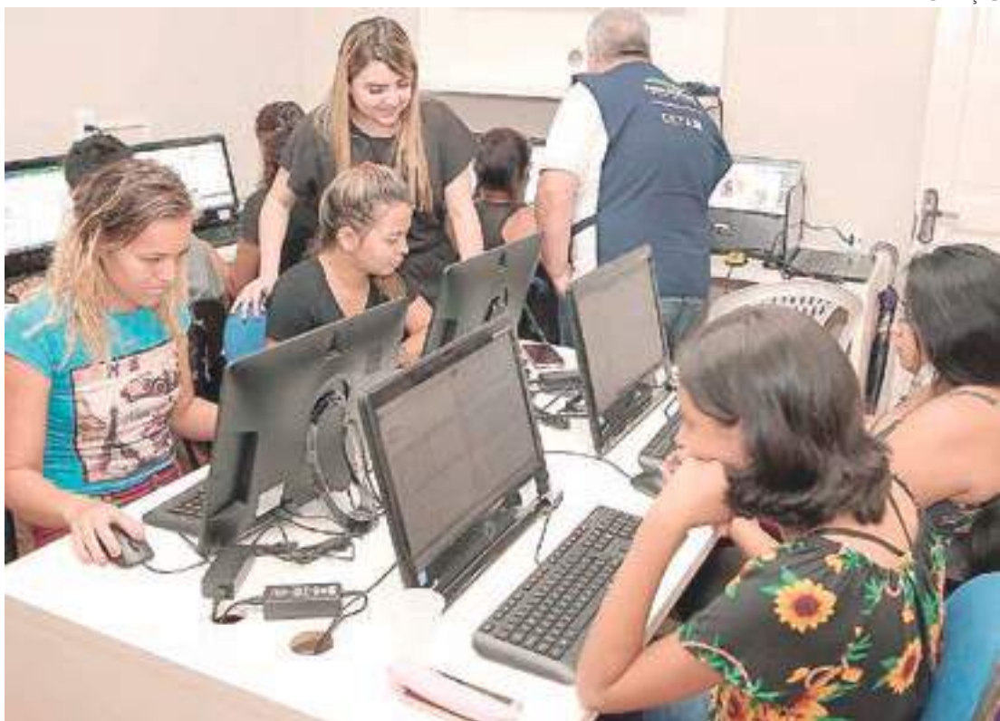
Instituto Jovens do Futuro oferece cursos na Zona Norte

O Governo do AM realizou ontem (18) a entrega de fomento, por meio de edital do Fundo de Promoção Social e Erradicação da Pobreza (FPS), para o Instituto Jovens do Futuro e para o Instituto Restaurar, organizações da sociedade civil (OSCs) que atuam no setor social na zona norte de Manaus. O valor total dos recursos entregues às entidades foi de R$ 259.782,67.