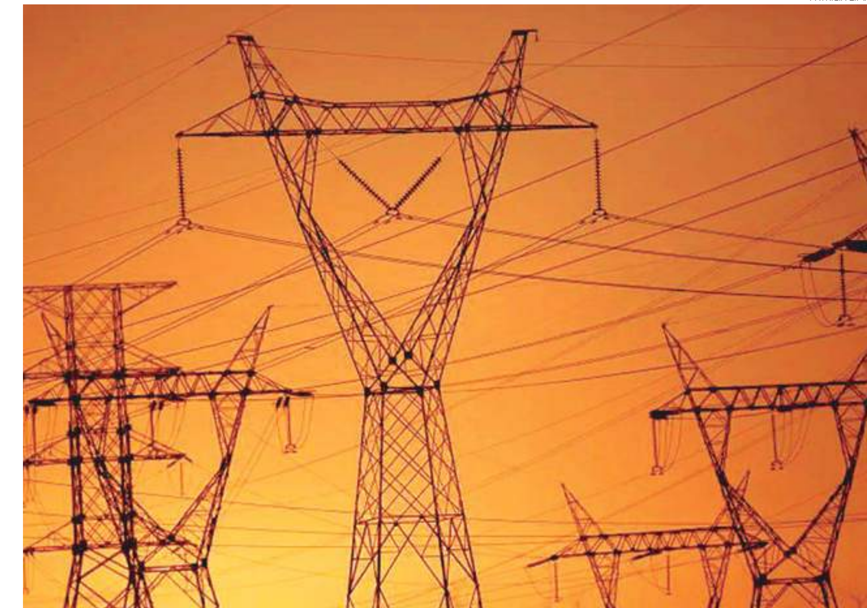
Com o fim da escassez hídrica e a entrada em vigor da bandeira verde, provavelmente as tarifas não voltarão a subir.

Pesquisa feita pelo Sebrae nacional em dezembro do ano passado, com 6.883 empreendedores de todos os estados e do Distrito Federal, composta por 59% de microempreendedores individuais (MEI), 36% de microempresas (ME), 5% de empresas de pequeno porte (EPP), e focada no momento que os pequenos negócios atravessam, constatou que a grande maioria dos empreendedores nacionais tomou medidas para diminuição dos custos com energia elétrica.