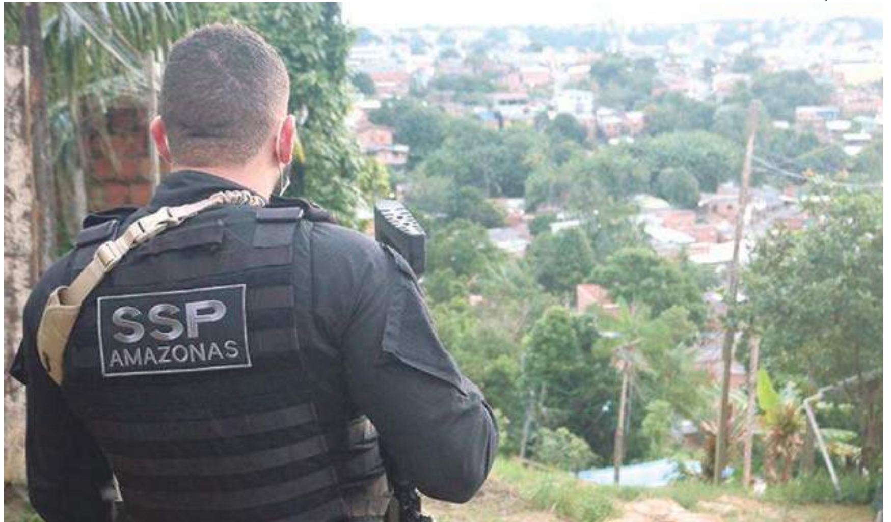
Feriado foi agitado e forças de segurança trabalharam para investigar crimes

De acordo com o relatório do Instituto Médico Legal (IML), dos 19 mortos, 15 foram por arma de fogo, três por arma branca e uma agressão física. Os casos aconteceram entre as zonas Leste, Norte e Oeste, locais onde há mais registros de homicídios na capital amazonense. Relembre alguns casos.