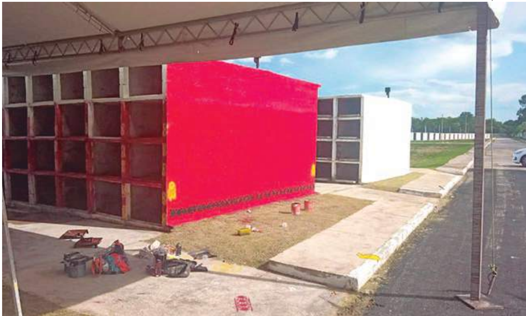
Os trabalhos de construção foram coordenados pela Secretaria Municipal de Limpeza Urbana (Semulsp), bem como o projeto técnico-arquitetônico

O cemitério indígena tem 216 gavetas em cada um dos cinco módulos, totalizando 1.080 espaços no campo-santo. A preparação das ocas, o jardim e a pintura do grafismo estão sendo realizados pelo órgão Coordenação dos Povos Indígenas de Manaus e Entorno (Copime).