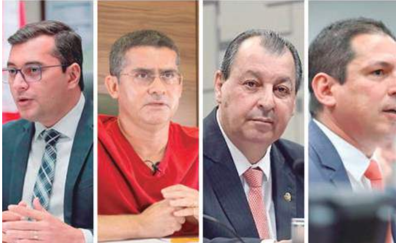
Protagonistas da política amazonense repudiaram a postura do presidente Jair Bolsonaro

Segundo ele, os produtos fabricados na Zona Franca possuem o privilégio de incentivos, diferente de outras regiões do Brasil. O decreto, que tira a competitividade, gera a possibilidade de outros