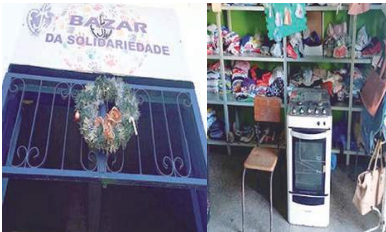
O 'Bazar da Solidariedade' serve para a instituição arrecadar valores com a venda e reverter para o local

"Estão faltando novidades no nosso bazar, que funciona todos os dias próximo ao portão da instituição. Nós aceitamos todo tipo de doação, desde roupas, calçados, eletrodomésticos, móveis, pois todo o recurso é revertido na compra de verduras e