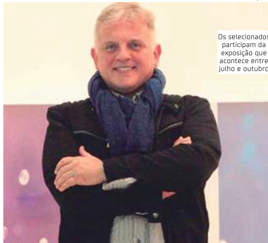
Os selecionados participam da exposição que acontece entre julho e outubro

Surgiu da percepção do artista e empreendedor Renato Gosling de propiciar a criadores visuais uma nova maneira de ascensão na carreira, em uma perspectiva inclusiva tanto entre aqueles que geram arte como entre aqueles que a avaliam. Contemplado pela Lei Rouanet via Magazine Luiza, o projeto conta, por isso, com um júri que apresenta diversidade étnica, de gênero e de função dentro do sistema da arte contemporânea.