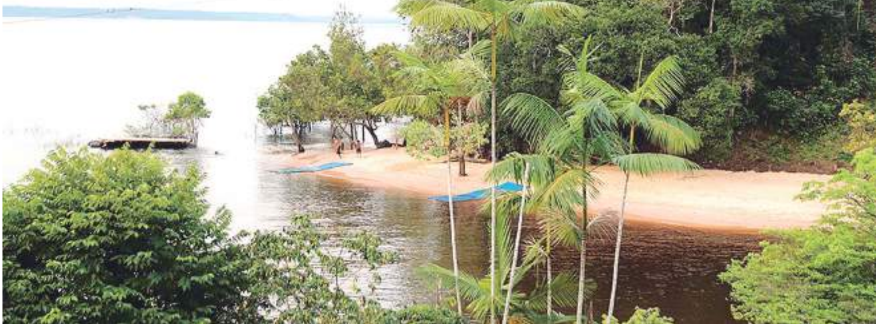
Em Tempo preparou um roteiro com alguns locais indispensáveis para aqueles que desejam curtir e descansar no feriado em locais com vista paradisíaca

Para chegar até o Sítio Bom Futuro é preciso passar pela ponte Rio Negro, trafegar pela Rodovia AM-070 até chegar no KM-021, e entrar em um ramal.