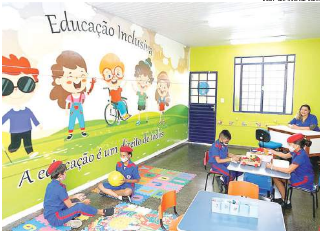
O espaço busca auxiliar na inclusão de estudantes que apresentam algum tipo de deficiência (física, sensorial ou intelectual)

A Escola Estadual Senador Flávio Brito, localizada na Zona Oeste de Manaus, no bairro Compensa, ganhou uma nova sala de recursos multifuncionais. O espaço, inaugurado pelo Governo do Amazonas, busca auxiliar na inclusão, conscientização e no enfrentamento ao preconceito com estudantes que apresentam algum tipo de deficiência (física, sensorial ou intelectual).