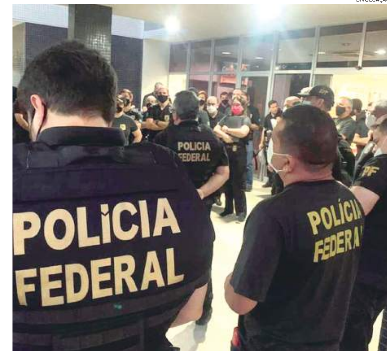
Policiais se revoltaram com o aumento concedido que desagradou a categoria

A decisão já tem data para ser tomada. "Na terça-feira (19), às 10h, vamos realizar uma assembleia-geral extra-