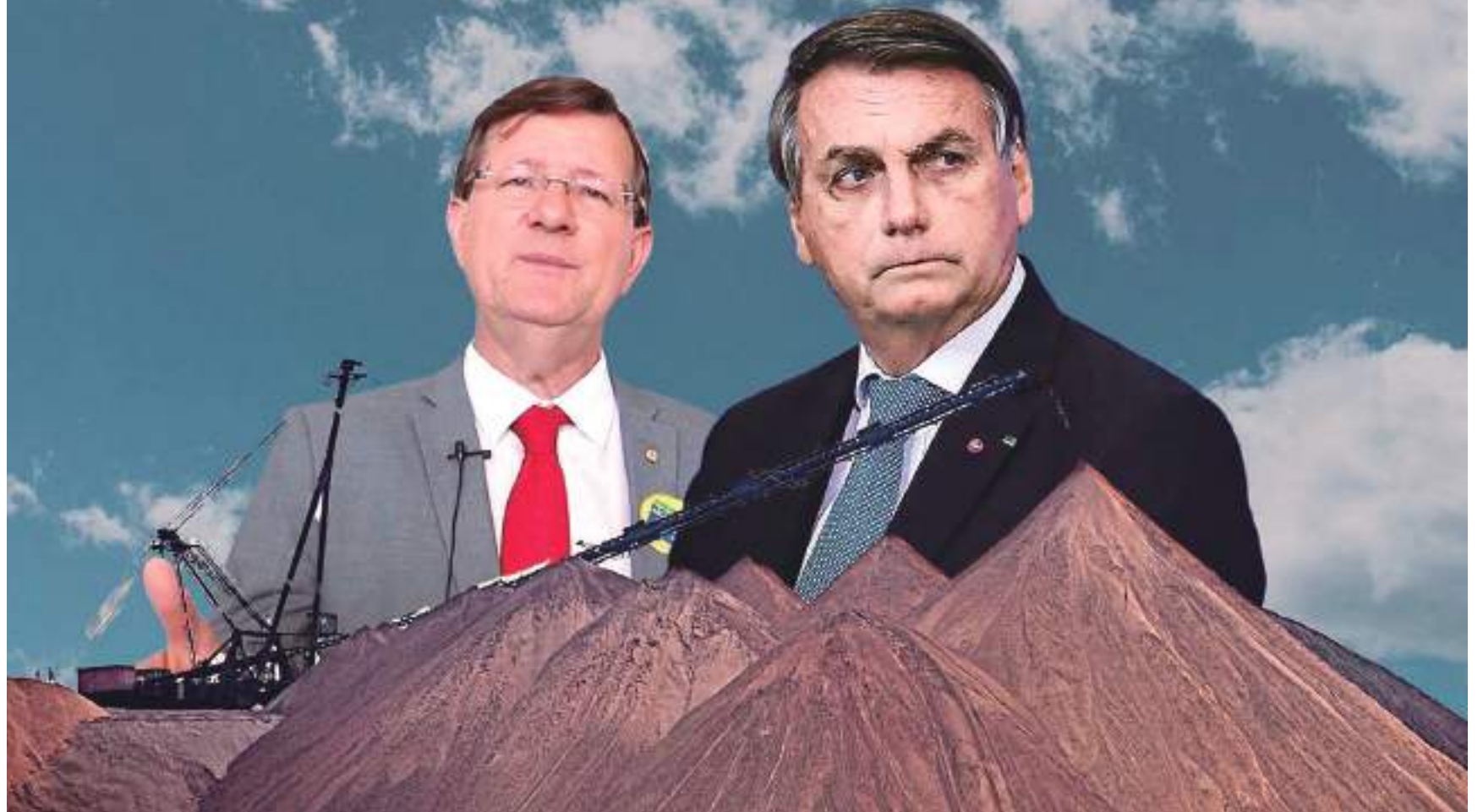
O município de Autazes foi reconhecido pelo Ministério da Agricultura como uma área com grande potencial de produção de fertilizantes

O ato vai contra a Convenção nº 169 da Conferência Internacional do Trabalho. O documento prevê avanços no que diz respeito às condições de vida e trabalho da população indígena brasileira. Os artigos 15 e 16 estabelecem o direito de consulta e participação dos povos indígenas para uso, gestão e conservação de seus territórios.