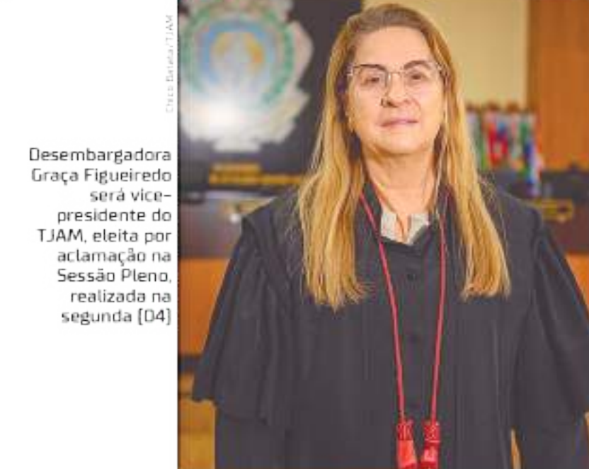
Desembargadora Graça Figueiredo será vice-presidente do TJAM, eleita por aclamação na Sessão Pleno, realizada na segunda (04)