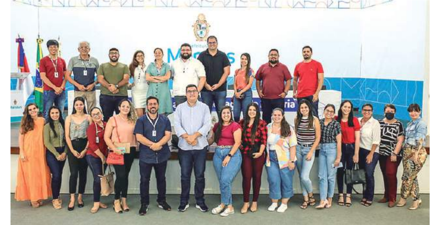
Novo site institucional, que deve entrar ao ar no próximo semestre, está sendo desenvolvido em conjunto por servidores da Semcom e da Subti

“É uma determinação do prefeito David Almeida que a prefeitura seja direta na resolução dos problemas e facilite a oferta de serviços ao cidadão. E essa é a proposta do novo site da Prefeitura de Manaus. Quem procura, vai achar rápido o que precisa. Hoje apresentamos a versão beta ao competente time de assessores das secretarias e integramos cada um na missão de catalogar os serviços mais procurados pelos usu-