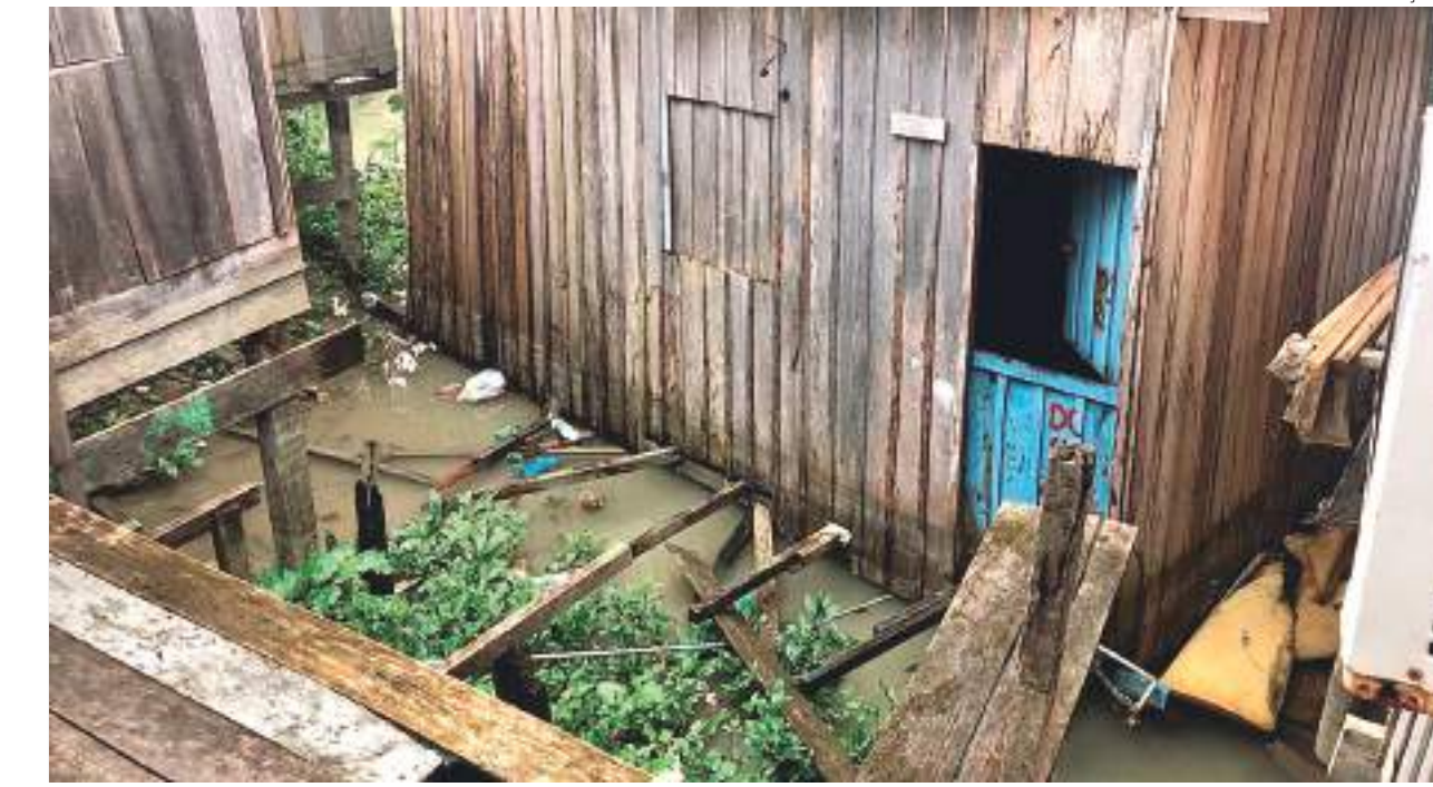
A forte chuva causou estragos para famílias de Manaus

berto, que viu o desabamento, não é a primeira vez que acontece o problema na localidade.