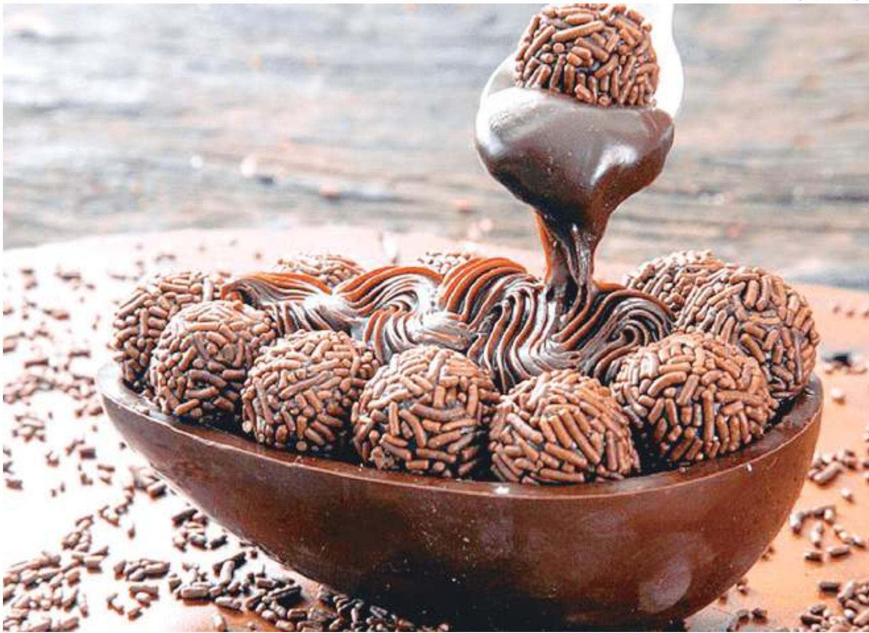
Período de Páscoa tem como tradição o consumo dos ovos de chocolates. Alguns grupos, porém, seja por problemas de saúde ou por opção, buscam alternativas

"Normalmente, eu busco nos restaurantes e estabelecimentos veganos já conhecidos aqui em Manaus, que já costumam fazer um menu especial para a Páscoa. Porém, no cotidiano, eu confesso que é um pouco difícil achar chocolates veganos com facilidade. Você só encontra nos esta-