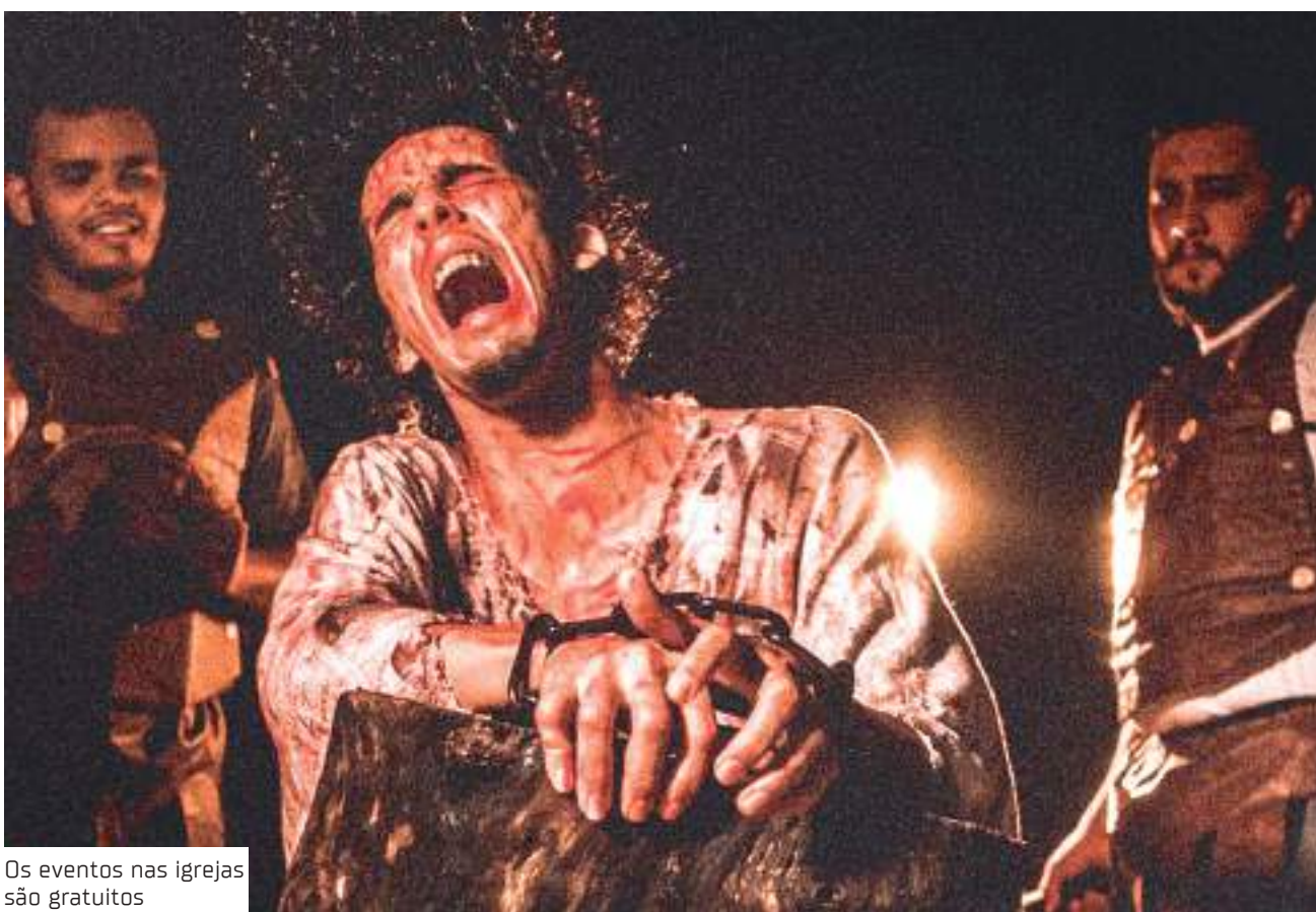
Os eventos nas igrejas são gratuitos

"Para os judeus a paz era comemorada com o maior sacrifício do ano, onde um cordeiro era sacrificado e o seu sangue representava o pagamento dos pecados do povo. Quando Jesus veio ele veio ser o cordeiro definitivo, por isso que João Batista disse: 'Esse é o cordeiro de Deus que tira o pecado do mundo'. E foi por isso que Jesus morreu na Páscoa, provando que ele era o cordeiro de Deus e seu sangue derramado nos deu o perdão dos pecados. A sua ressurreição provou que ele tinha poder sobre a morte. Então, a Páscoa é celebração, é louvor, é gratidão pela obra de Jesus por nós", afirmou