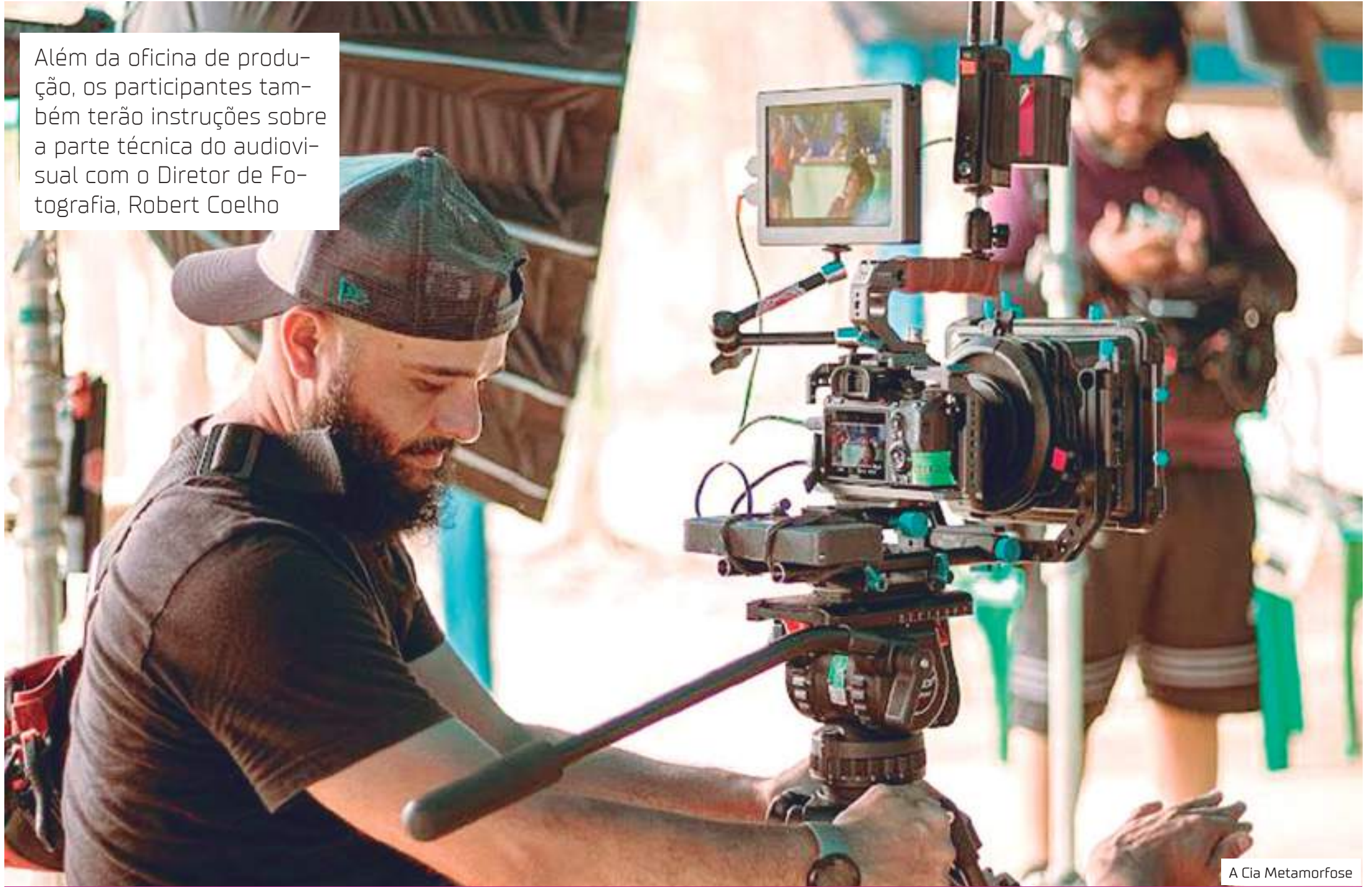
A Cia Metamorfose

Além da oficina de produção, os participantes também terão instruções sobre a parte técnica do audiovisual com o Diretor de Fotografia, Robert Coelho