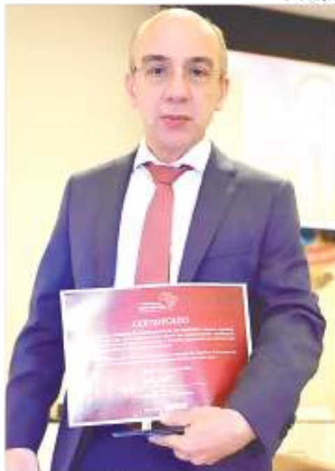
De forma inédita entre os Tribunais de Contas, o projeto 'Ouvidoria Estudantil', idealizado e desenvolvido pela Ouvidoria do TCE-AM, quando da gestão do conselheiro Érico Desterro, foi agraciado com o segundo lugar no Concurso de Boas Práticas da Controladoria Geral da União, na categoria "Fomento à participação e ao controle social pela população em situação de vulnerabilidade". Esta é a primeira vez que uma Corte de Contas é agraciada com a premiação. O evento aconteceu durante o Seminário Nacional de Ouvidorias, realizado pelo TCE-AM, em parceria com a CGU e a CGE, na quarta (06), no auditório da Corte de Contas. Na foto, o presidente do TCE-AM, conselheiro Érico Desterro