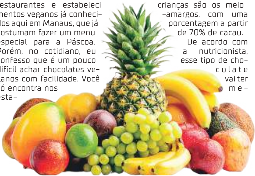
As frutas são companheiras de pessoas com diabetes, sendo uma alternativa nos dias de Páscoa