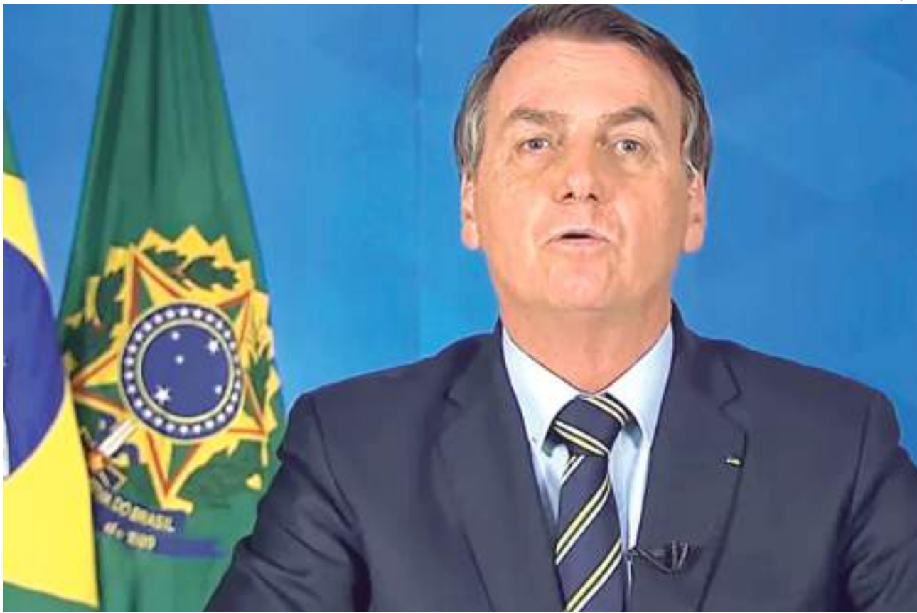
Integrantes do Planalto afirmam que Bolsonaro estaria irritado com a bancada de parlamentares do Amazonas

Disse o governador, ao comentar os impactos do decreto para a ZFM. A redução do IPI para todo o país compromete a competitividade do Polo Industrial de Manaus (PIM), que reúne cerca de 500 indústrias e gera mais de 100 mil empregos diretos. A Procuradoria Geral do Estado (PGE-AM) já estaria com a Adin pronta para apresentar ao STF, pedindo a revogação do decreto, em respeito às garantias constitucionais da ZFM”, disse o governador.