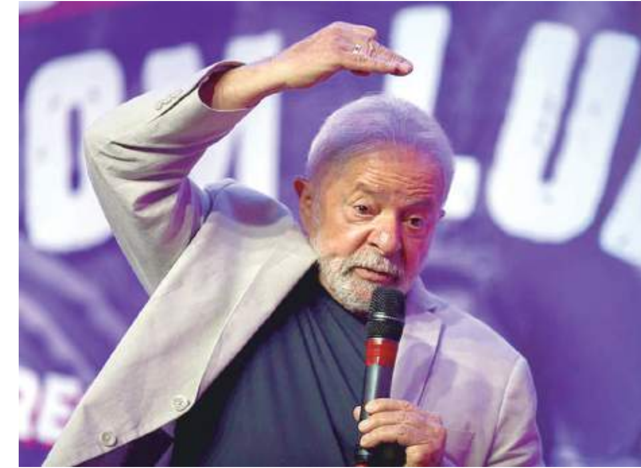
O ex-presidente deixou claro, no entanto, que a intenção não é simplesmente revogar a reforma

De acordo com uma fonte ouvida pela Reuters, o sentido é revogar o que prejudicou os tra-