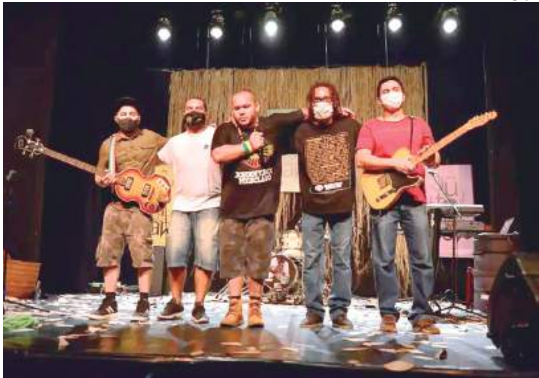
No Amazonas há algumas bandas de reggae que se destacam no estilo musical