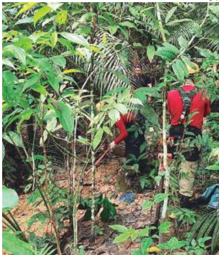
Bombeiros removeram corpo de homem em mata na Zona Norte

O Serviço de Atendimento Móvel de Urgência (SAMU) esteve