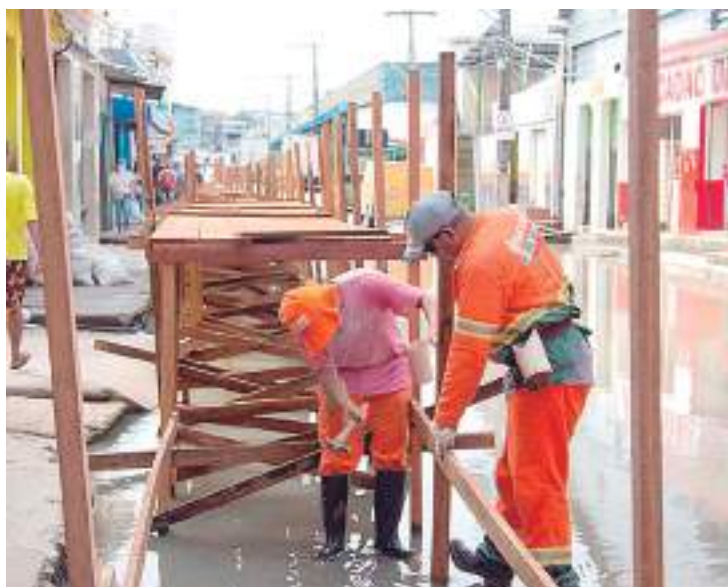
Chuvas intensas podem levar Rio Negro a atingir cota superior a 29,8 m

A metragem é considerada pelo CPRM como severa, semelhante à do ano passado, que alcançou 30,01 metros em junho de 2021, e motivou, desde o mês de janeiro de 2022, esforços da Defesa Civil de Manaus e de outros 18 órgãos municipais para prestar assistência a mais de 4 mil famílias diretamente afetadas pelo fenômeno natural. A prefeitura estima que este seja o total de afetados pelos alagamentos naturais deste ano e, por isso, se antecipou com ações de contingência