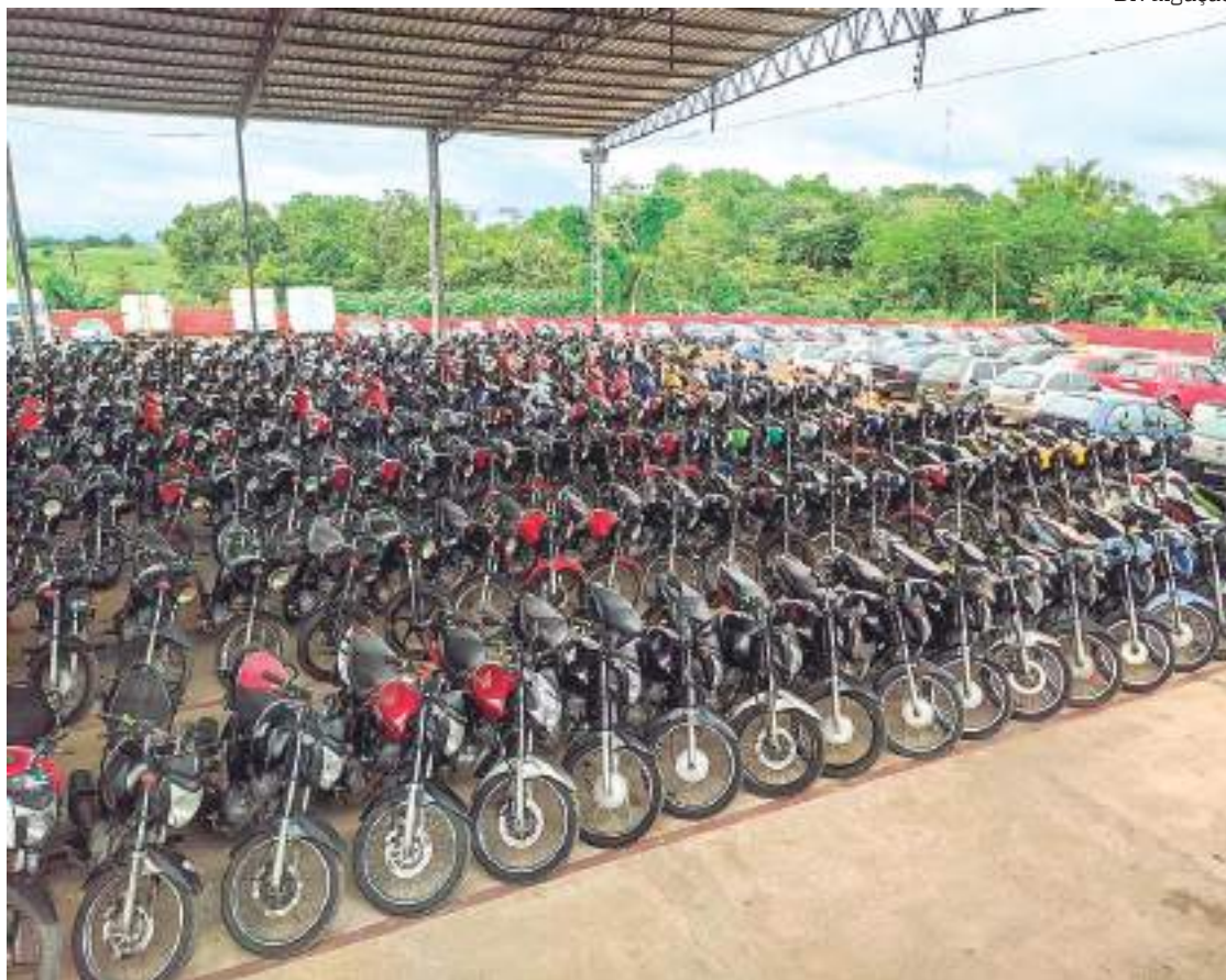
Segundo leilão do Departamento Estadual de Trânsito do Amazonas (Detran-AM) vai acontecer no dia 26 de maio

Com 280 veículos disponíveis para arremate, o Departamento Estadual de Trânsito do Amazonas (Detran-AM) realizará, no dia 26 de maio, o segundo leilão de 2022.