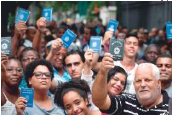
taxa média de desocupação registrada no Brasil foi de 11,1%

A taxa de desocupação, entre janeiro e março de 2022, foi 0,1 ponto percentual inferior à registrada no trimestre anterior (13,1%), no Estado, e representa estabilidade. Já na comparação entre o 1º trimestre de 2022 e o mesmo trimestre de 2021, houve queda de 4,6 pontos percentuais. Os dados são da Pesquisa Nacional por Amostra de Domicílios (PNAD) Contínua, divulgados na sexta-feira (13), pelo IBGE.