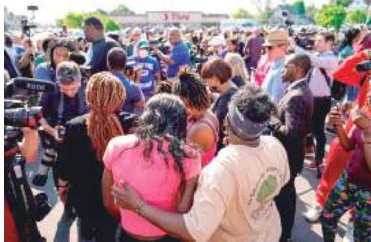
Homem publicou um manifesto racista na internet antes do crime

Sem identificar Gendron, a polícia disse que o estudante foi detido e submetido a uma avaliação