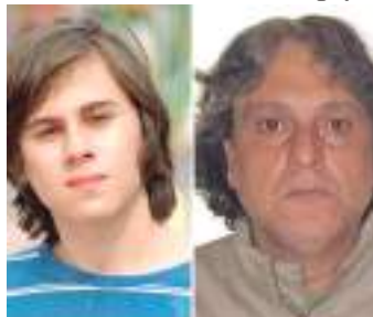
Ator Rafael Miguel foi morto pelo sogro em 2019

“A gente vai fazer uma legitimação para provar que é ele mesmo. O pessoal do 98º Distrito Policial está chegando aqui na divisão de capturas. Mas assim, é 90% de informação de policiais do 98º DP”, reforçou.