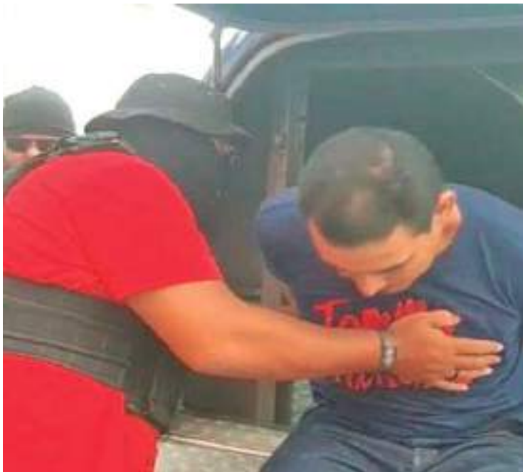
Homem preso é acusado de estuprar três filhas, enteada e sobrinha

Um homem, de 40 anos, foi preso na manhã desta segunda-feira (16), em Manaus, suspeito de estuprar as três filhas, uma adolescente de 13 anos e outras duas de 11, que são gêmeas.