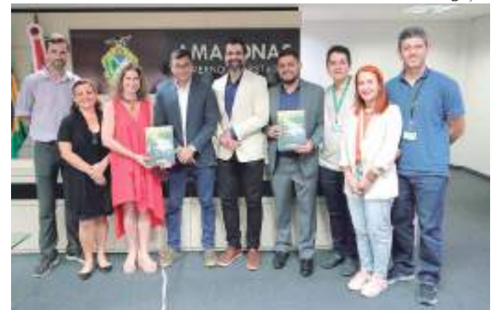
Wilson Lima discute parceria entre UEA e Universidade do Colorado

“A troca de conhecimento é muito importante para que possamos desenvolver pesquisas eficientes sobre a Amazônia, que serão de fato aplicadas, além de podermos mostrar para pesquisadores de outros países o que tem sido feito na nossa região”, ressaltou o reitor.