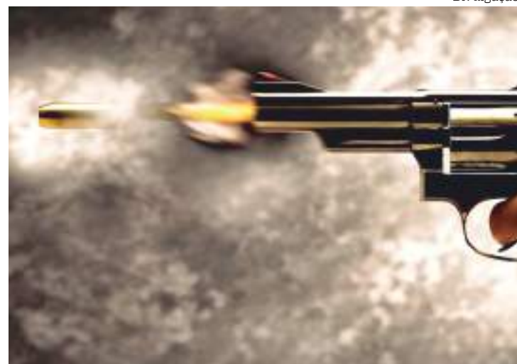
Tiroteio entre criminosos resultou em uma criança, de 6 anos baleada