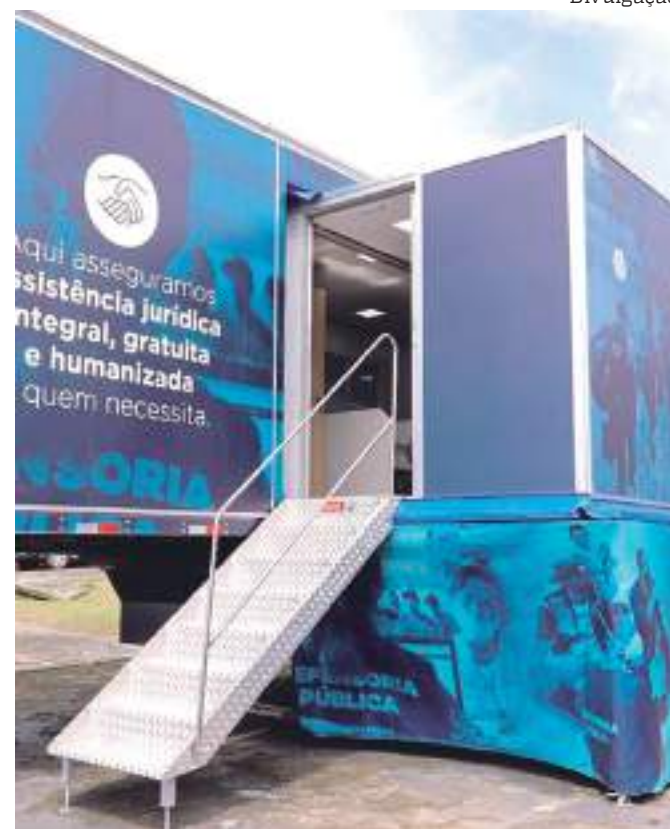
Defensoria oferta atendimento itinerante em Manaus