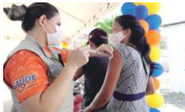
Amazonas segue com vacinação contra Covid em todo o Estado