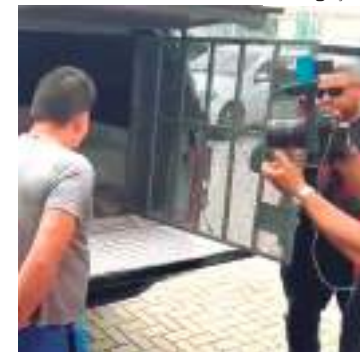
Suposto estuprador foi preso por investigadores da Depca

Após os procedimentos cabíveis, o acusado do crime ficará à disposição da justiça e será encaminhado para o Centro de Recebimento e Triagem (CRT) para dar baixa no presídio.