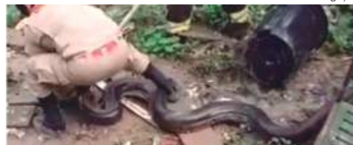
Sucuri de mais de 4 metros é capturada próximo de casas no AM

Após o resgate, a cobra foi levada para seu habitat natural, bem longe das residências.