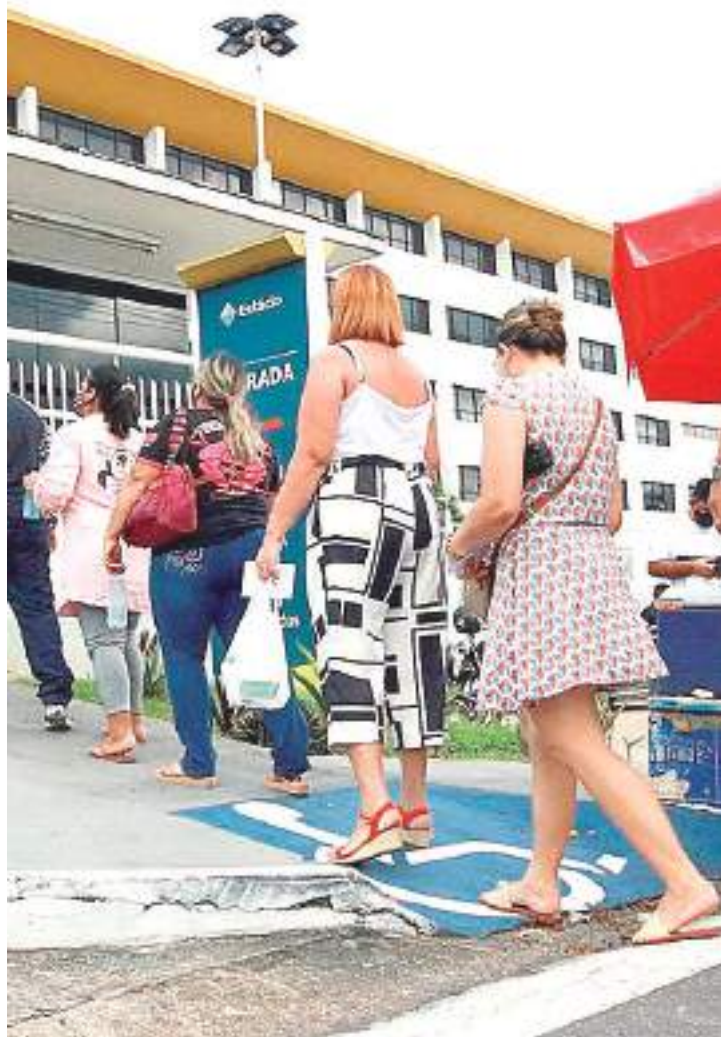
Auditor aponta irregularidade na exigência do exame psicotécnico/psicológico

Ainda conforme a Secex, a exigência, sem justificativa legal, contraria o disposto na Súmula Vinculante 44 do Supremo Tribunal Federal (STF). Segundo a súmula, só por "lei se pode sujeitar a exame psicotécnico a habilitação de candidato a car-