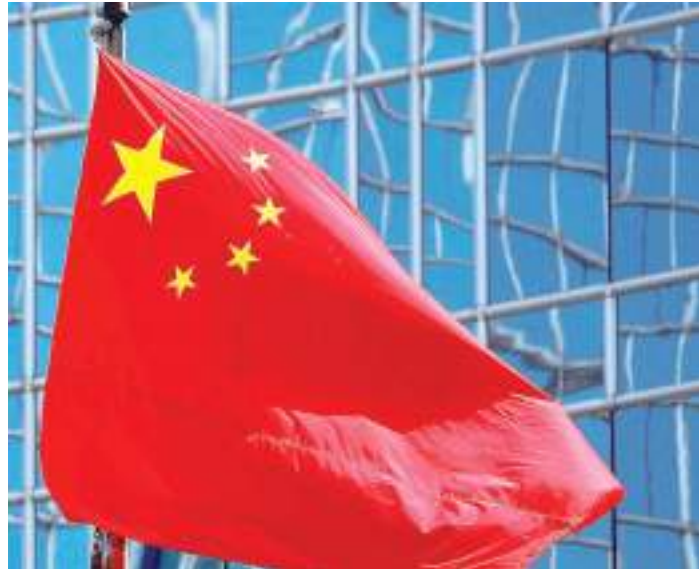
China é um dos principais parceiros comerciais do Brasil

Outro impacto sobre a economia brasileira se dará