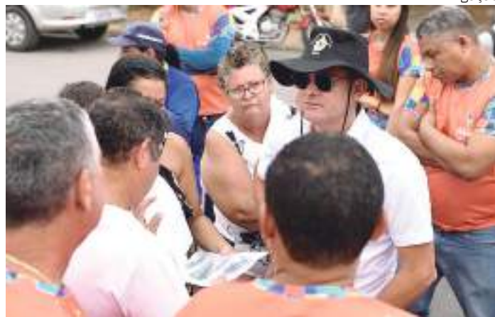
Combate ao Aedes aegypti foi intensificado nos bairros da capital

Os primeiros seis bairros prioritários são: Redenção, Alvorada, Compensa e Lírio do Vale, na zona Oeste; e Jorge Teixeira (3ª e 4ª