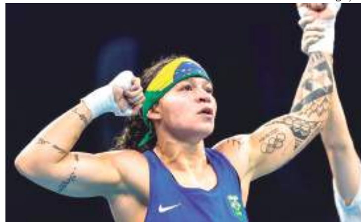
Beatriz Ferreria é a atual campeã Mundial de Boxe Feminino

O confronto entre Bia e Ellis reedita a semifinal do último Mundial, disputado em 2019, na cidade russa de Ecaterimburgo. Na ocasião, a brasileira venceu com decisão favorável de quatro dos cinco jurados. Elas também duelaram, em abril deste ano, na final do Campeonato Continental das Américas, em Guayaquil (Equador), novamente com triunfo da baiana.