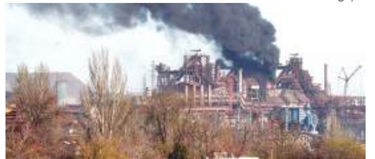
Kiev culpa a Rússia pela ausência de progresso na ação de paz

“Putin não está pronto para negociar”, disse, no aplicativo de mensagens Telegram. “A única chance [de paz] é a destruição da ocupação russa. Sobre quando eles estarão prontos para aceitar a derrota, acho que é uma questão de meses.”