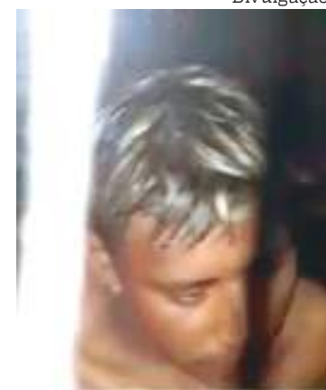
Homem matou mulher por vingança na cidade de Maués