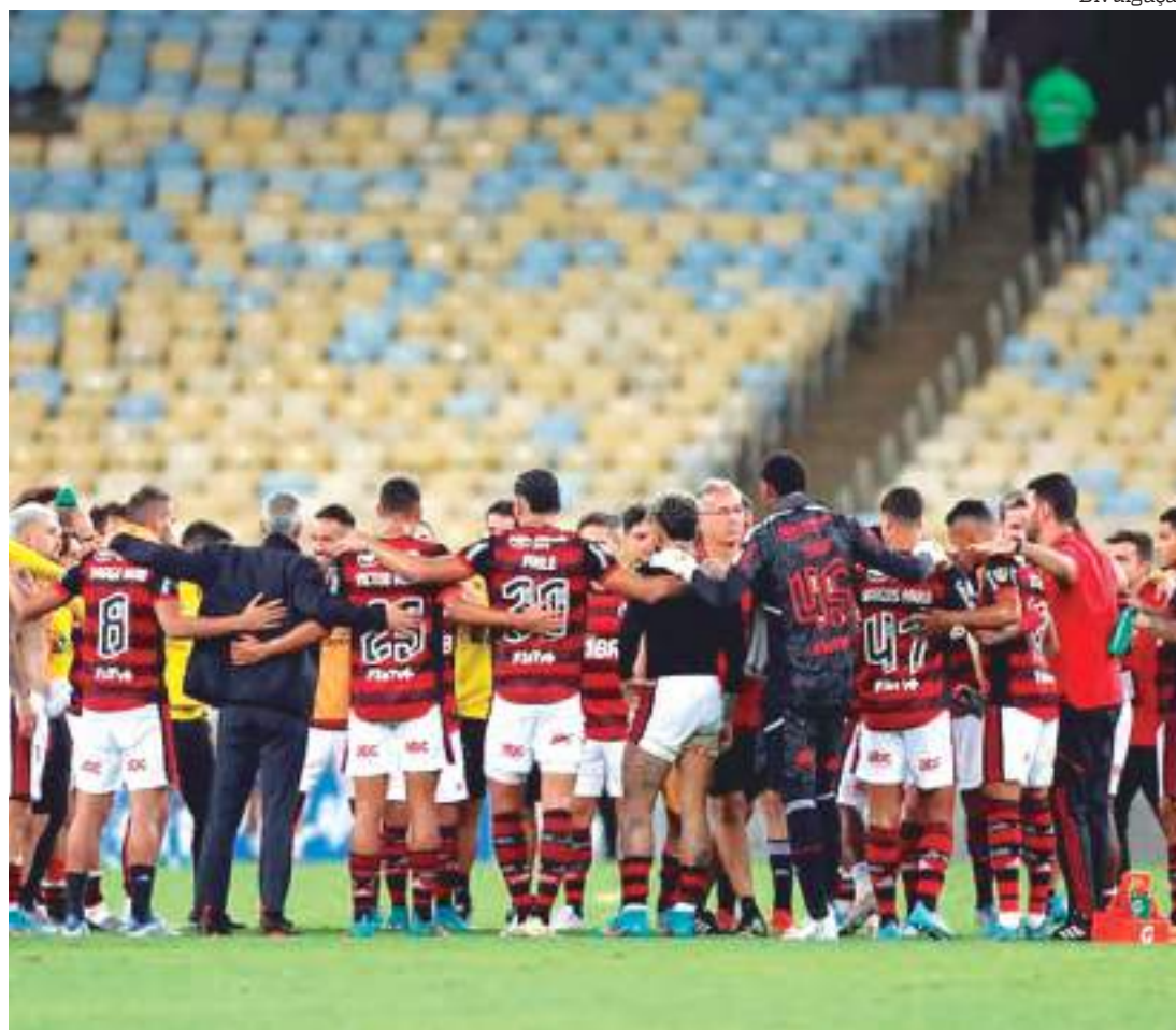
Flamengo vive melhores sequências históricas como mandante e visitante na Libertadores

Contando com o 3 a 0 da terça-feira (17), o Flamengo venceu 13 dos últimos 16 jogos que disputou como mandante, sendo que dois foram no Mané Garrincha e os outros 14 foram no estádio do Maracanã, no Rio de Janeiro. As vitórias foram sobre: Universidad Católica, Talleres, Barcelona (2), Olimpia, Defensa