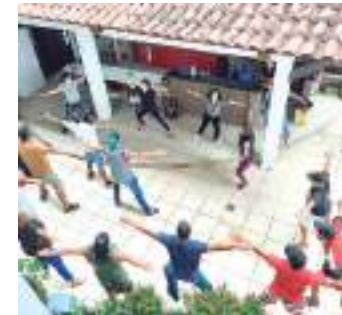
Unidades de saúde desenvolvem programação voltada ao tema