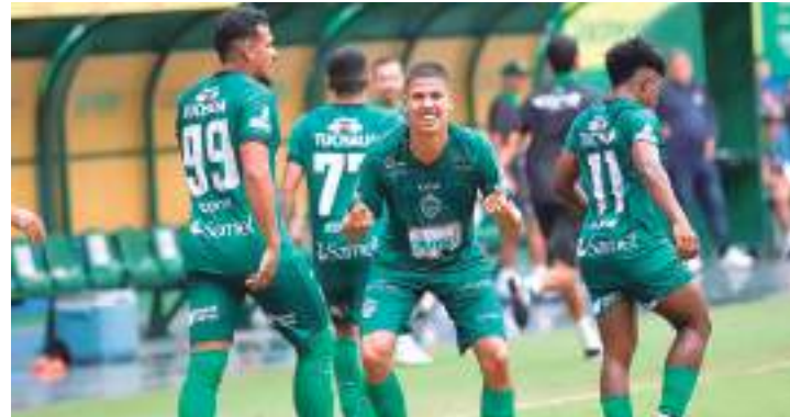
Ingresso Solidário terá valor de R$ 20 + quilo de alimento não-perecível