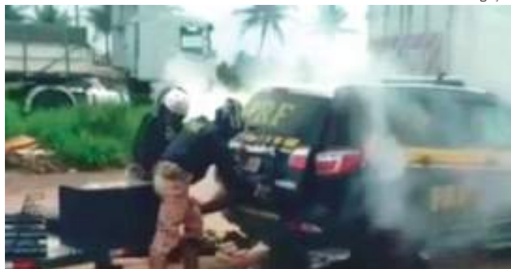
Homem está no chão e depois é colocado no porta-malas da viatura

“Eles pediram para que ele levantasse as mãos e encontraram no bolso dele cartelas de medicamentos. Meu tio ficou nervoso e perguntou o que tinha feito. Eu pedi que ele se acalmas-