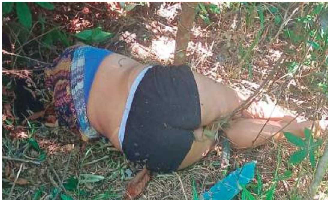
Mulher foi encontrada morta em área de mata do conjunbto Viver Melhor, na Zona Norte

a área em que o corpo foi encontrado e posteriormente acionaram os órgãos competentes para as investigações. O corpo da jovem foi encontrado deitado de lado e ela trajava um short preto com detalhe branco, um top azul e uma blusa estampada.