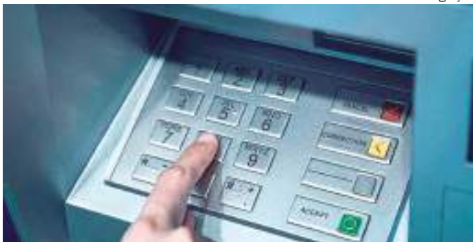
Homem é preso por tenta aplicar golpe em instituição social