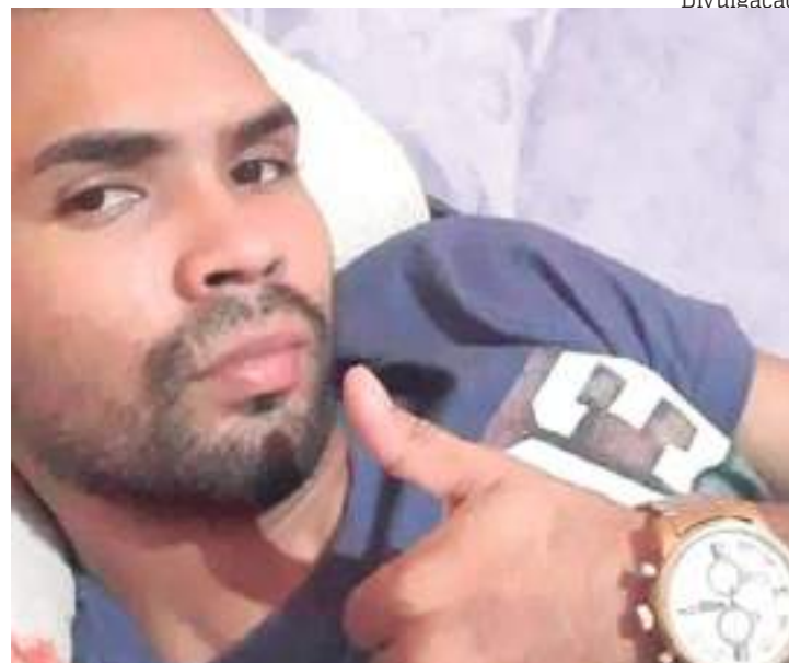
Presidiário foi morto por criminosos no município de Novo Airão

O crime chocou os moradores de Novo Airão, que não costumam presenciar situações do tipo no município. A Polícia Civil irá investigar o crime.