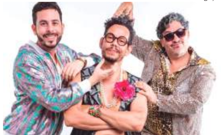
The Stone Ramos volta aos palcos após um hiato de dois anos

Localizado dentro do Complexo Portuário, Centro de Manaus, o local revitalizado é representativo do patrimônio histórico