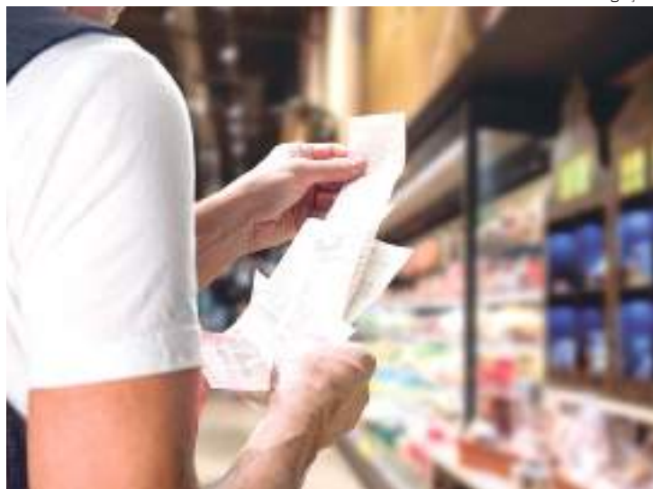
Levantamento mostra que inflação aparece com reprovação nas redes

O burburinho de rede social, quando o assunto é economia, segue tomado pela inflação, segundo monitoramento feito entre 17 e 23 de maio pela agência de análise de dados e mídia .MAP com base na avaliação qualitativa de publicações no Facebook e no Twitter. A reprovação supera 80%, impulsionada pela alta nos preços dos combustíveis e dos alimentos.