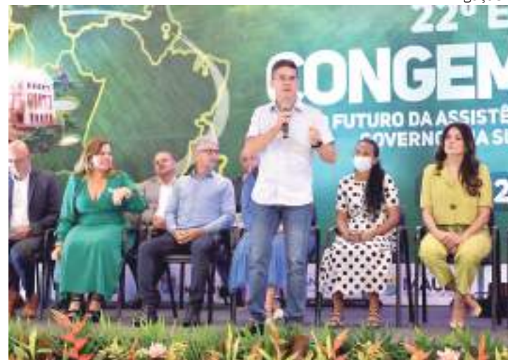
Prefeito David Almeida anunciou reforma de 20 CRAS de Manaus

irá priorizar as discussões mais técnicas, com palestras e debates sobre “Desfinanciamento, subfinanciamento e os impactos da Emenda Constitucional 95/16”, “Os impactos da pandemia na ampliação das desproteções sociais e as emergências e calamidades: o lugar da Assistência Social”, “Fluxos migratórios e proteção social na região Norte”, e “A relação do Suas com o Sistema de Ga-