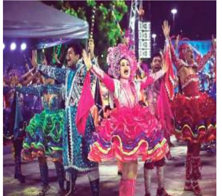
Evento comemora também o aniversário da banda Xiado da Xinela

com espaços exclusivos para quem quer serviços diferenciados. Ingressos para o Open Bar Premium (com bebida libera-