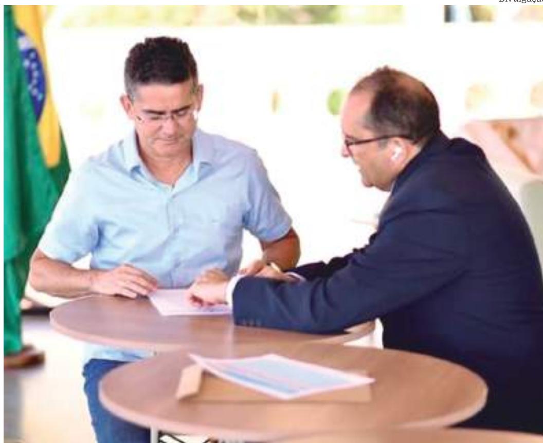
Concurso ofertou 124 vagas para o cargo de médico em 19 especialidades

Do total de candidatos disputando as 30 vagas, 809 se inscreveram para o cargo de clínico geral, para cumprimento de jornada de trabalho de 20 horas. Essa especialidade também registrou o segundo maior número de inscritos (446), mas para jornada de 40 horas, com 25 vagas ofertadas.