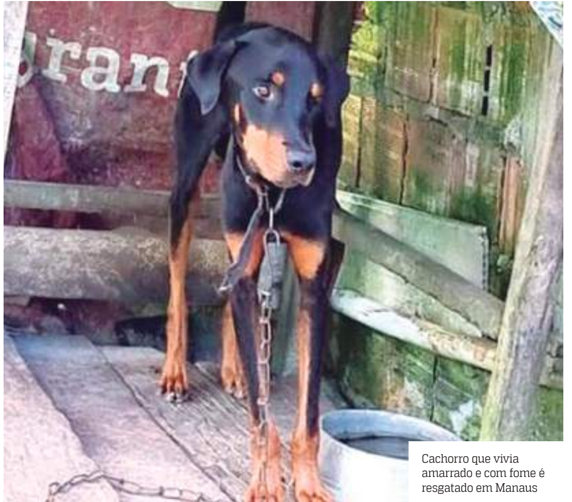
Cachorro que vivia amarrado e com fome é resgatado em Manaus

Para denunciar casos como esse de maus-tratos a animais envie mensagem para a equipe de proteção animal pelo WhatsApp (92) 98176-4497 ou pelos canais da Dema (92) 3239-3870 e (92) 9962-2340.