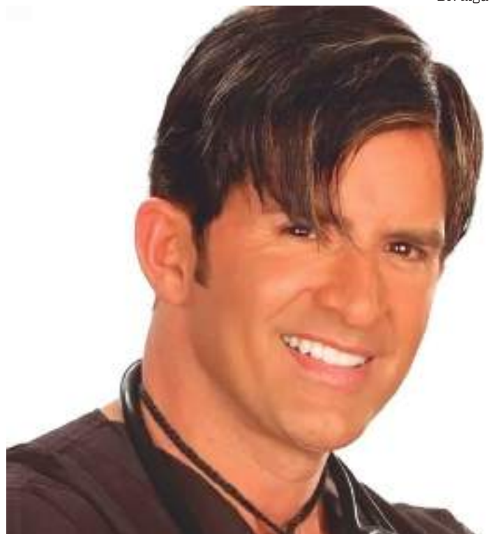
Cirurgião plástico ainda disse que seu casamento estava "quebrado"

Nos últimos anos, Dr. Rey se aproximou do campo político. Em 2014, o médico concorreu a uma vaga para deputado federal em São Paulo, pelo Partido Social Cristão (PSC), mas não foi eleito. Em seguida, filiou-se ao Partido Ecológico