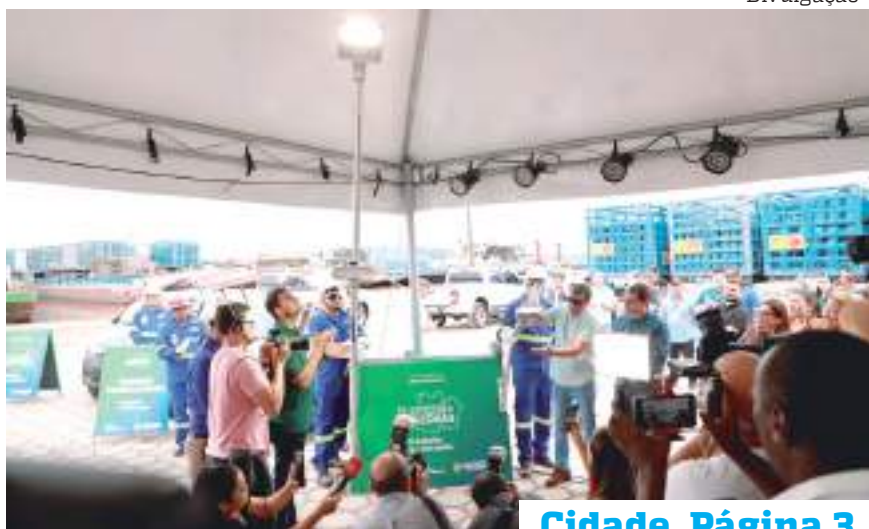
Cidade Página 3