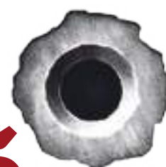
Polícia Página 7