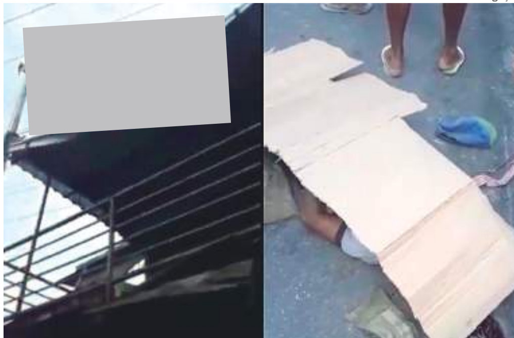
Homem caiu de telhado no momento em que fazia uma instalação elétrica em casa na Zona Leste