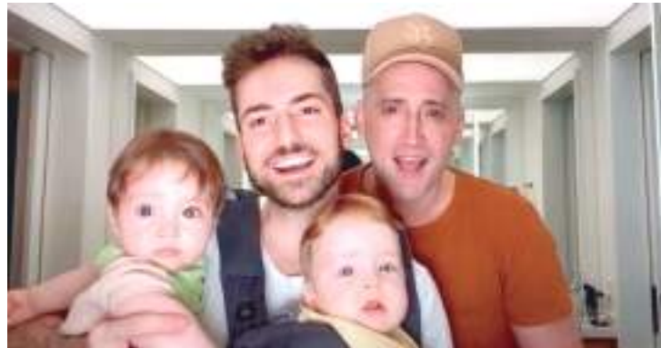
Faz exatamente um ano da morte do humorista e ator Paulo Gustavo

"A gente jogou um pouquinho (das cinzas) em Itaipava e guardei um pouco para jogar lá (em Nova York),