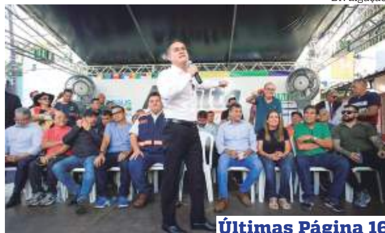
Últimas Página 16