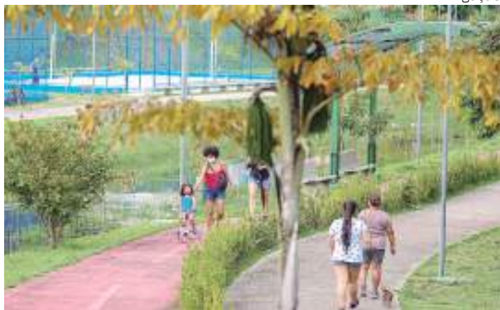
Governo e Prefeitura alinham convênio para administração do Prosamin

O novo convênio está inserido no protocolo de intenções assinado pelo governador Wilson Lima e o prefeito David Almeida, que vai permitir, além da manutenção, um melhor aproveitamento dos espaços do