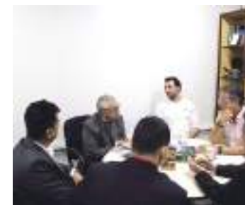
Sedecti e PanAmazônia exercem papel no desenvolvimento econômico