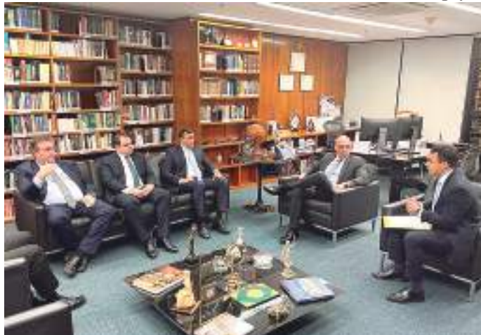
ADI ajuizada pelo Governo aponta desemprego no resto do Brasil

Além disso, as sucessivas renúncias de receitas de IPI provocadas pela União têm impacto direto na arrecadação. Somente com o Decreto nº 11.055/2022, Estados, Municípios e Distrito Federal deixarão de arrecadar R$ 10,4 bilhões. No caso do Estado do Amazonas, a renúncia é na ordem de R$ 18,4 bilhões.