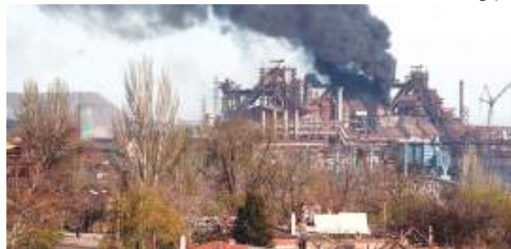
Civis precisarão ser retirados de bunkers sob uma siderúrgica

Autoridades ucranianas acreditam que cerca de 200 civis permanecem presos, junto com combatentes, na rede de bunkers subterrâneos, no extenso complexo