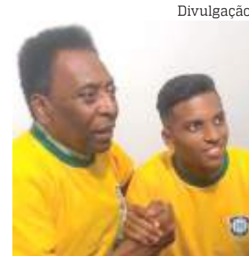
Ídolo Pelé chamou o craque do Real Madrid de "iluminado"

Rodrygo terá a chance de brilhar novamente na Champions no dia 28 deste mês, quando Real Madrid e Liverpool definem o título continental, no Stade de France, em Paris.