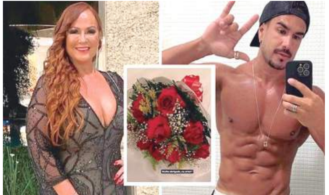
Neymãe viajou com o possível novo namorado para Campo Grande, no Mato Grosso do Sul

No Instagram, Rafa mostra seus treinos, dá dicas de nutrição, rotina saudável,