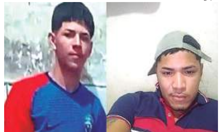
Irmãos desaparecem no rio após colisão entre balsa e rabeta

Corpo de Bombeiros Militar do Amazonas (CBMAM), que desde a manhã de quarta realizam as buscas no local.