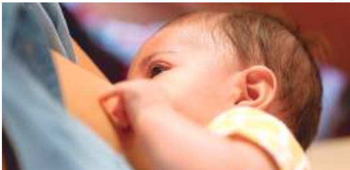
Dados são do Observatório de Saúde na Infância (Observa Infância)

O Brasil registra por ano 22,9 mil mortes de bebês de até 1 ano que poderiam ser evitadas se houvesse tratamento para doenças como diarreia. O risco aumenta com a queda da cobertura vacinal. Os dados são do Observatório de Saúde na Infância (Observa Infância) que fez uma média dos números registrados entre os anos de 2018 a 2020.