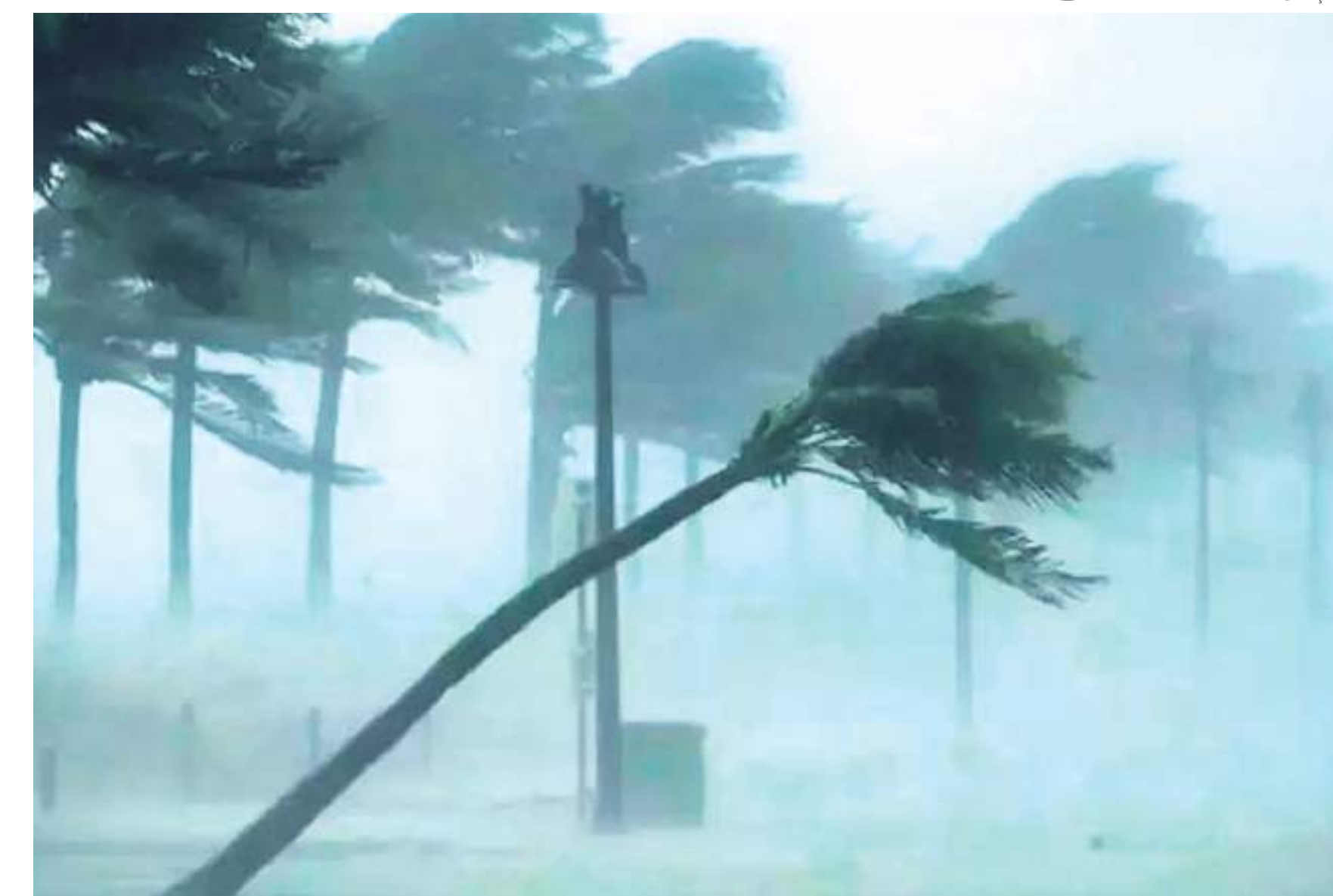
Tempestade deve provocar ventos de mais de 100 km/h

Em Santa Catarina, a Defesa Civil emitiu alerta. A população deve procurar locais bem abrigados, longe de janelas, vidros e evitar deslocamentos durante o período, devido ao risco de queda de árvores e postes. Em todo litoral, há previsão de mar grosso e agitado, com risco de ressaca, alagamentos e formação