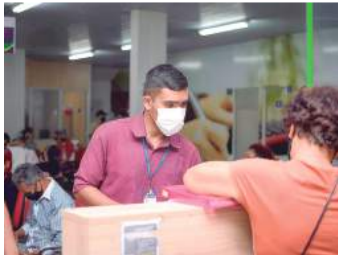
No mesmo período de 2021, houve 17 mil atendimentos

A maior parte dos atendimentos realizados pelo Procon-AM neste ano foram relacionadas à empresa de energia. Em 2022, foram 2.920 registros da concessionária, incluindo denúncias, reclamações e respostas a dúvidas de consumidores do estado do Amazonas.