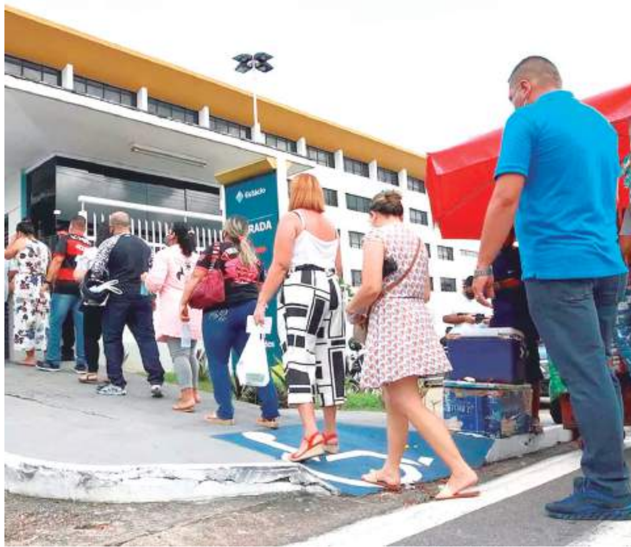
Pedido de medida cautelar suspendeu o concurso público da SSP-AM

Conforme a decisão publicada no Diário Oficial Eletrônico do TCE-AM, a suspensão do concurso