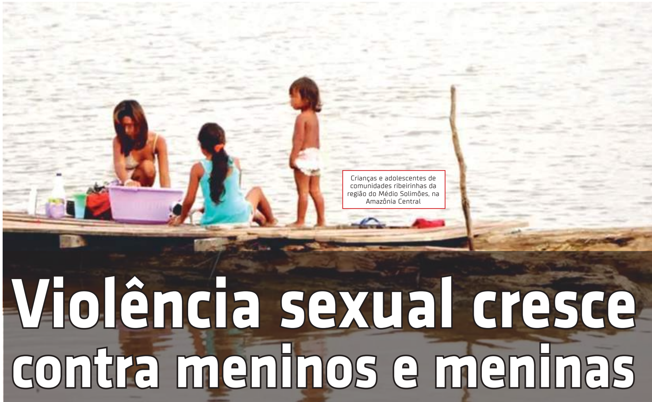
Crianças e adolescentes de comunidades ribeirinhas da região do Médio Solimões, na Amazônia Central