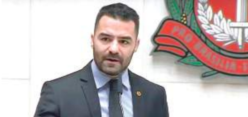
Deputado já tinha renunciado após ofender mulheres ucranianas

A sessão que aprovou a cassação começou às 16h45 e durou menos de duas horas. Ao transmitir o resultado da votação, o presidente da Casa, Carlão Pignatari (PSDB), disse que casos como o do ex-deputado serão "punidos com rigor" pela assembleia. "Fico muito triste que ainda estamos ouvindo sobre assédio, machismo, sexismo, não só contra mulheres, mas contra crianças e idosos. Espero