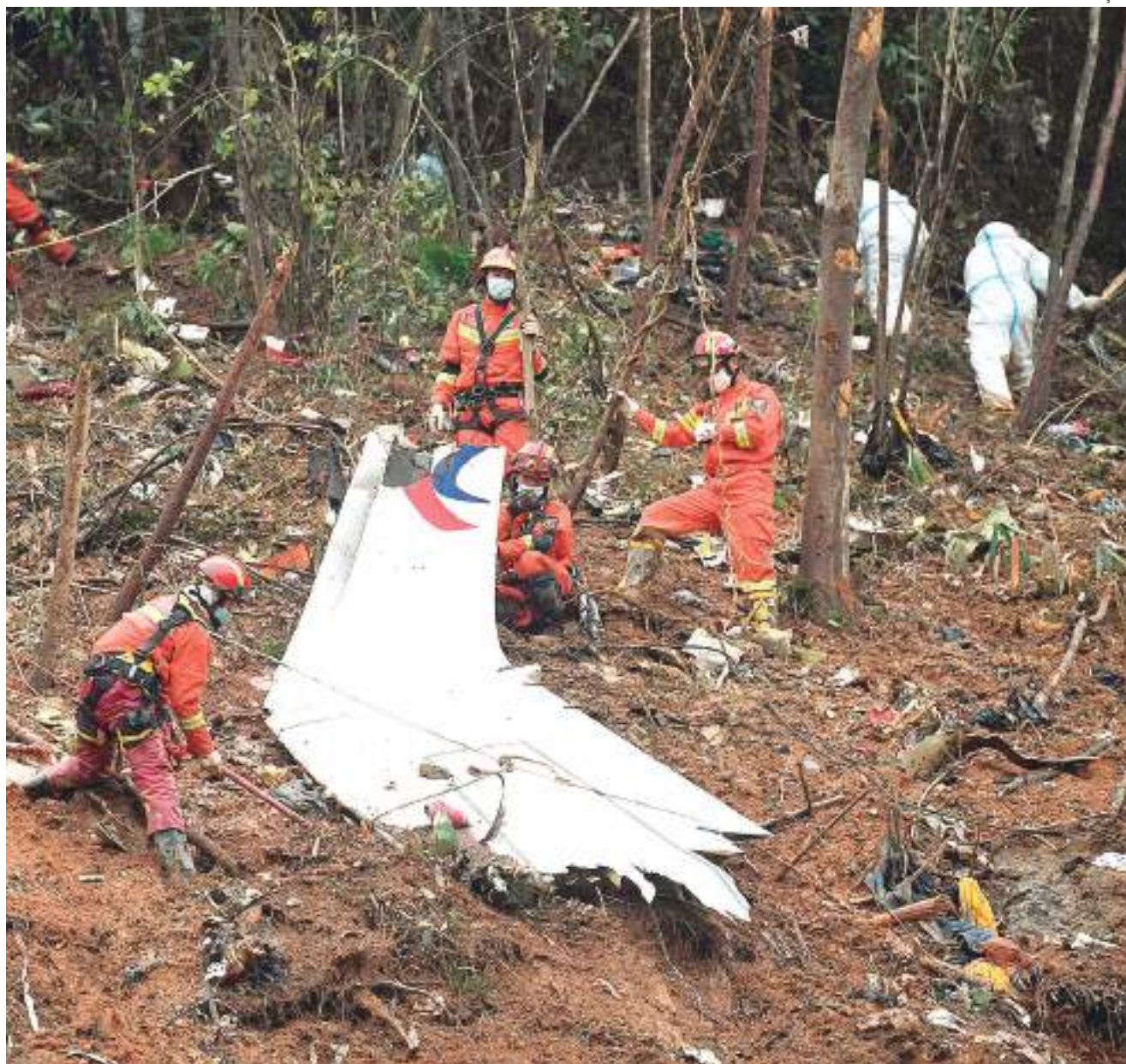
Parte da asa do Boeing 737-800 da Eastern China Airlines é vista em área de busca

"O avião fez o que foi mandado por alguém na cabine", disse a pessoa envolvida com a análise da caixa preta.