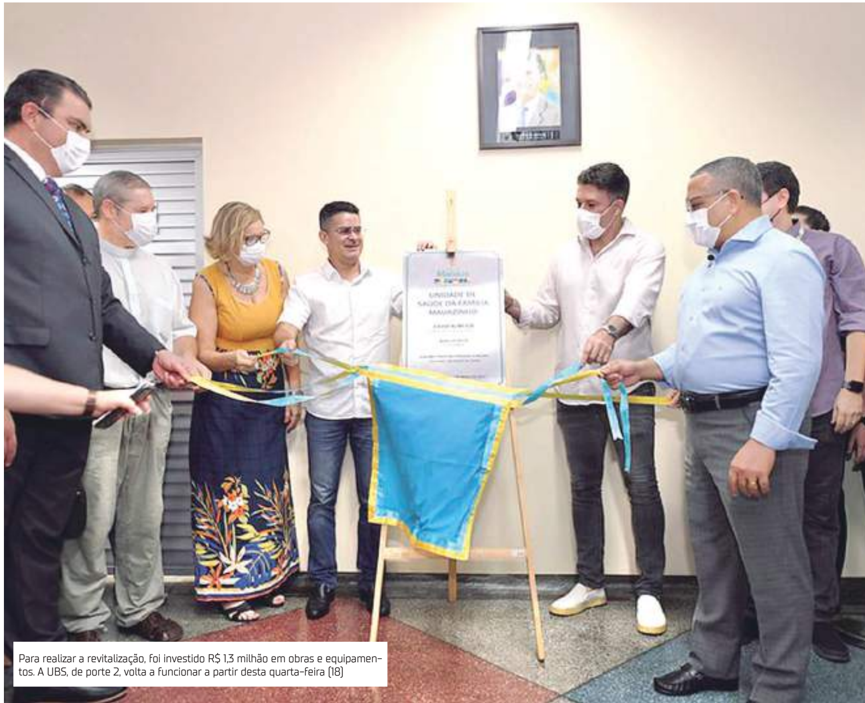
Para realizar a revitalização, foi investido R$ 1,3 milhão em obras e equipamentos. A UBS, de porte 2, volta a funcionar a partir desta quarta-feira (18)

A unidade contará com pediatra, clínico geral, enfermeiros, técnicos em enfermagem, auxiliar e técnico de patologia, auxiliar de saúde bucal, Agentes Comunitários de Saúde