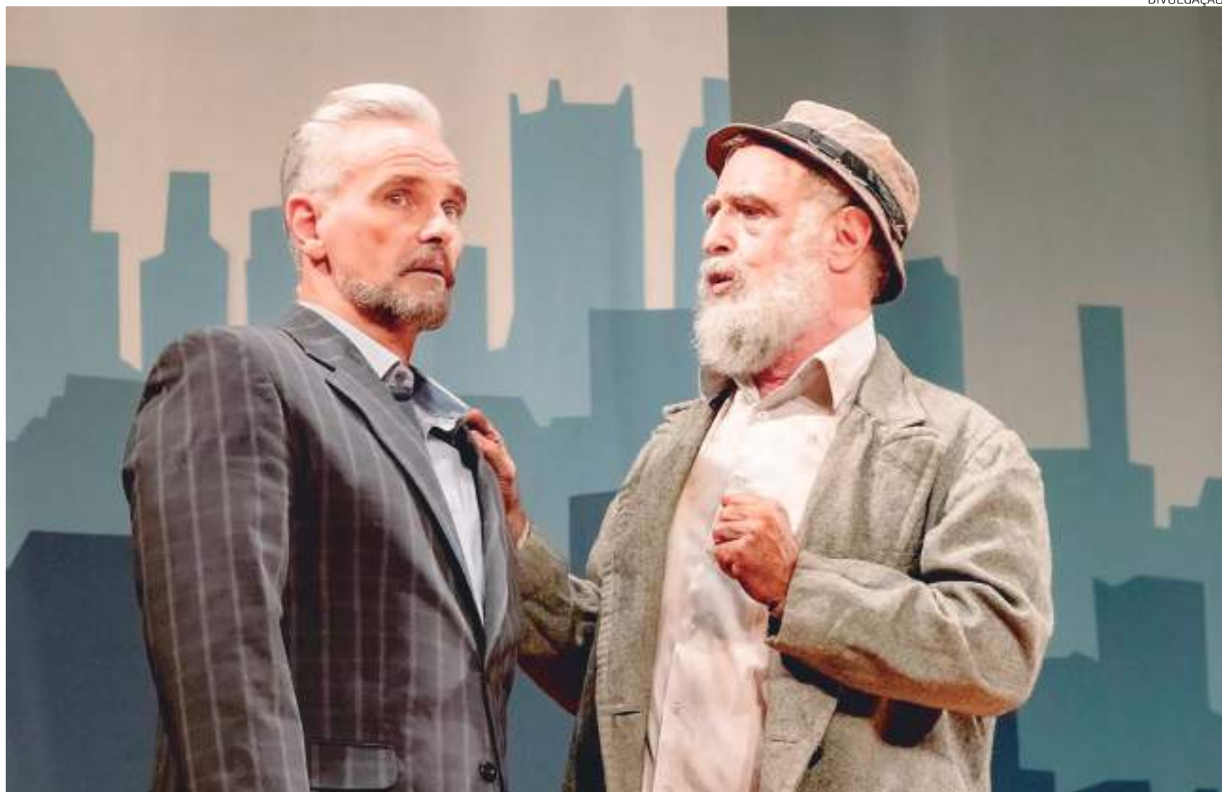
Esta é a primeira vez em que o livro "O Vendedor de Sonhos" ganha uma versão teatral