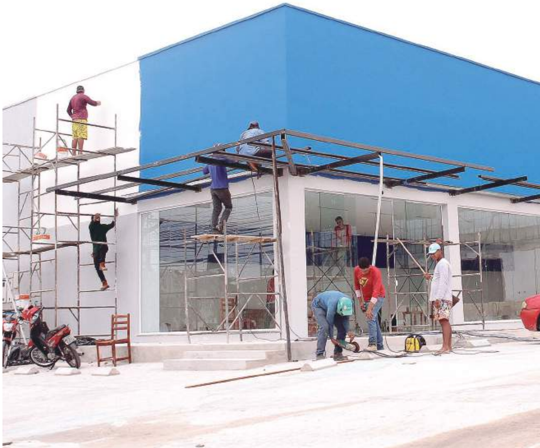
De acordo com a CBIC, a cada R$ 1 milhão de investimento, são gerados 7,64 empregos diretos

"A construção civil movimenta o serviço e o comércio, desde materiais como areia, cimento, tinta, ferro, itens de acabamento, assim como a indústria destes bens. E os serviços relacionados crescem, com mais transporte,