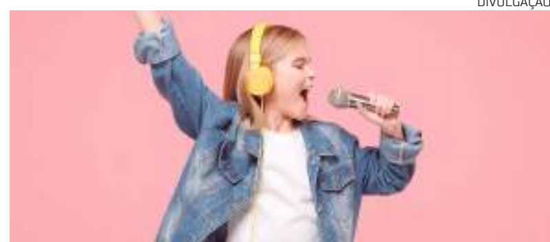
A inscrição é gratuita e individual. Não serão permitidos duplas, grupos ou bandas

Para conferir todas as informações do Festival de Calouros Curumim 2022, basta acessar o link: https://bit.ly/Regulamento-SescCurumim . Após as inscrições, os candidatas irão passar pela audição presencial, a ser realizada no dia 7 de junho, com banca de júri que irá selecionar dez calouros.