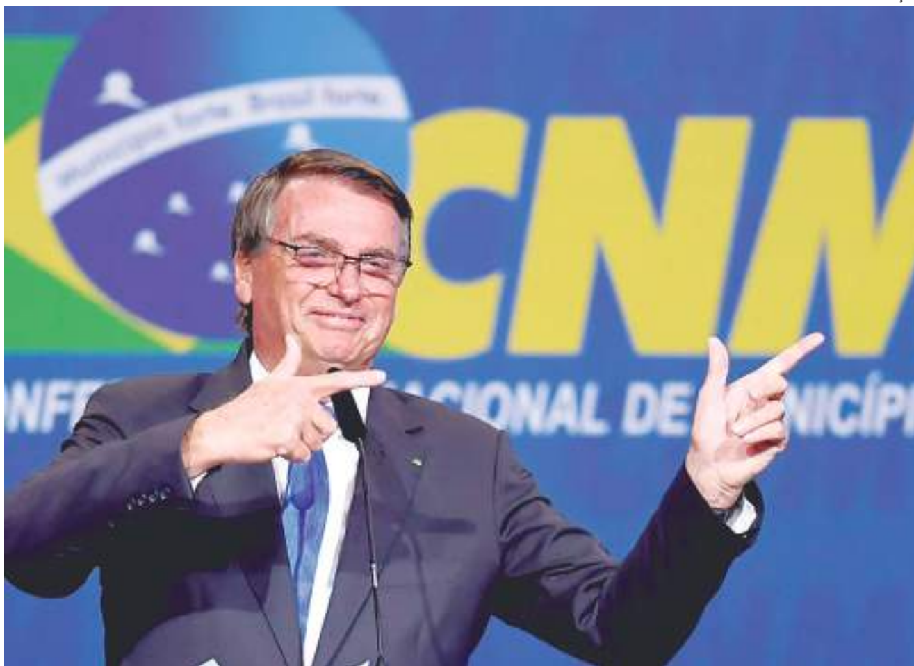
O governo do Iraque tem procurado novos parceiros para aquisição de armamento

A viagem é vista com reservas pela área econômica do governo. A equipe do ministro da Economia, Paulo Guedes, gostaria que o governo desse prioridade neste momento a contatos com países membros da Organização para a