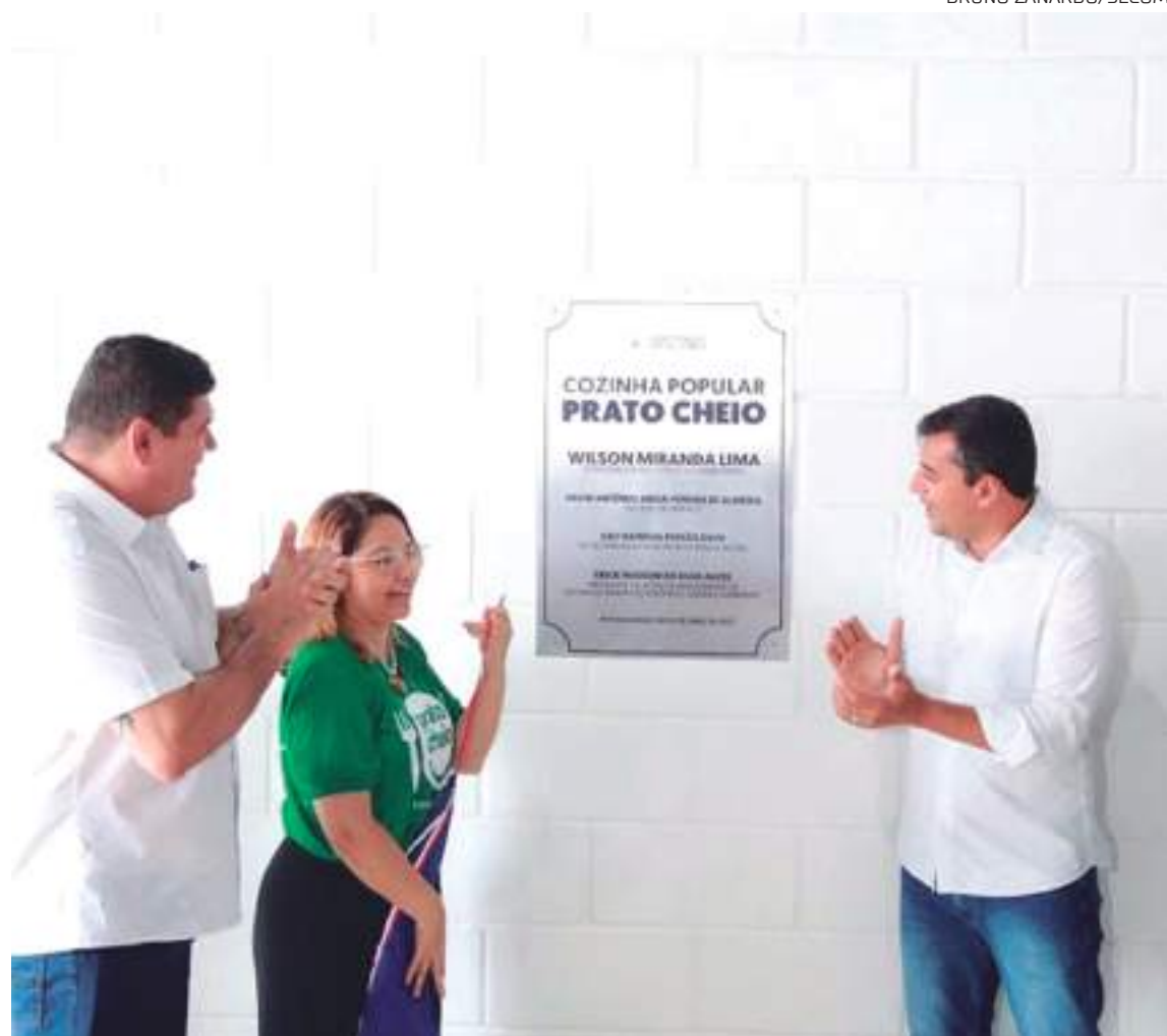
Unidade reformada e vai servir 400 litros de sopa, gratuitamente, de segunda a sábado