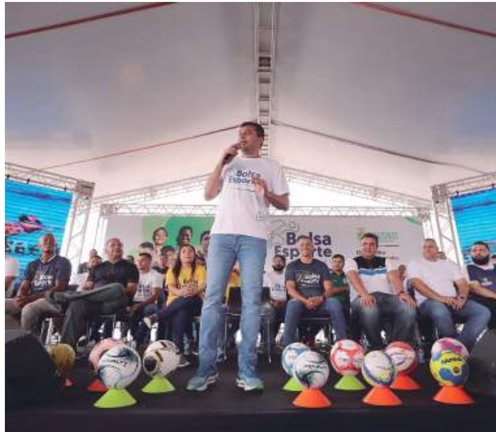
Valor de R$ 5 milhões é o maior investimento em patrocínio esportivo no futebol

“Com a bolsa, com a ajuda do governo, isso já ajuda bastante o time a poder crescer, porque é a única coisa que a gente quer. Só futebol, sem o apoio, muitas vezes a gente não consegue”, finalizou.