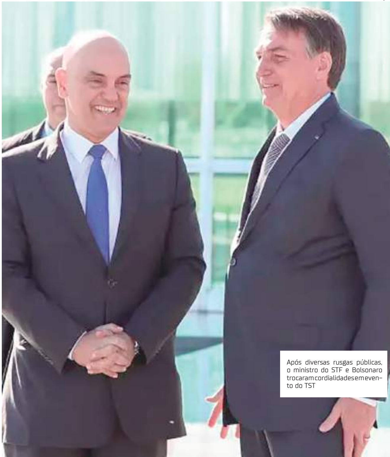
Após diversas rusgas públicas, o ministro do STF e Bolsonaro trocaram cordialidade no evento do TST