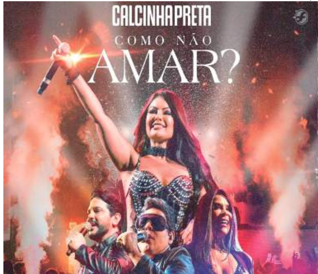
O projeto contém 26 faixas no total, em alusão aos 26 anos da banda