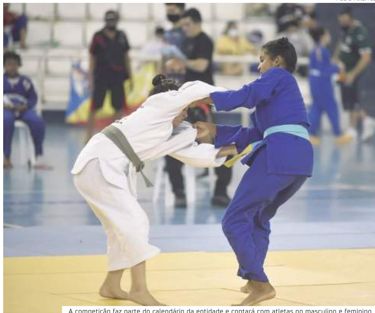
A competição faz parte do calendário da entidade e contará com atletas no masculino e feminino