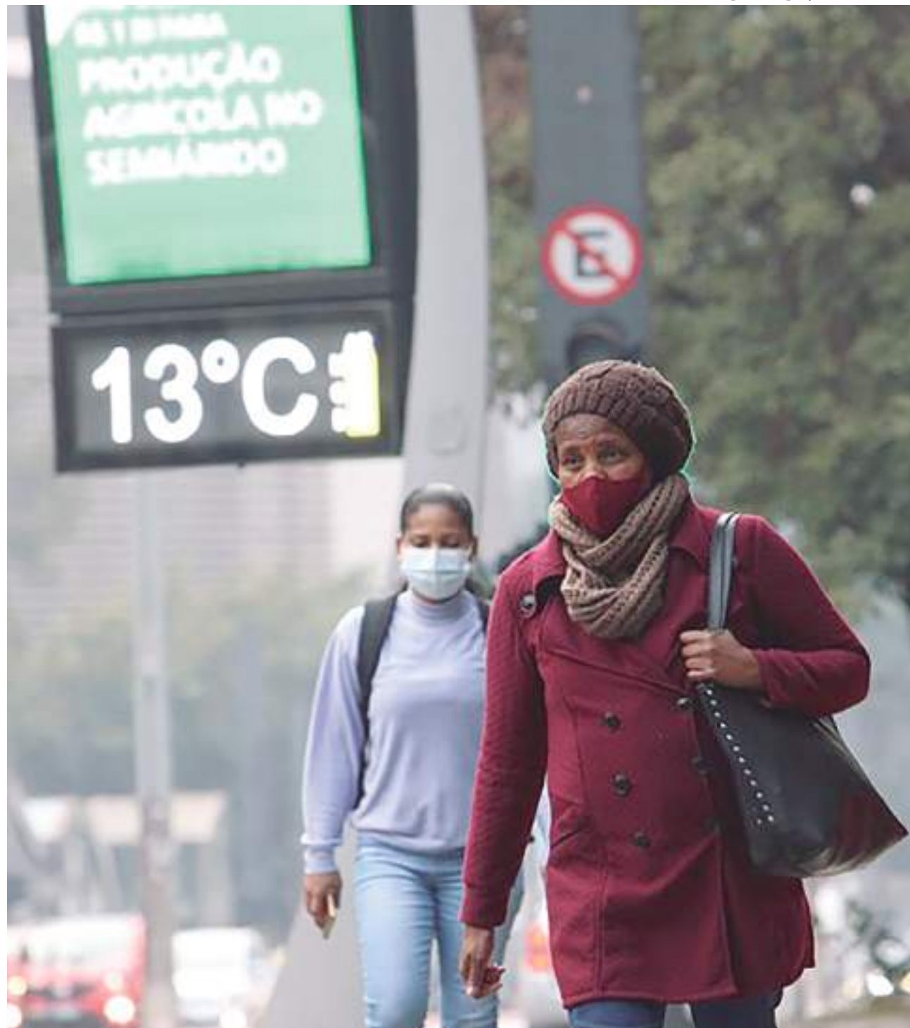
Estudo registrou 316 mortes

O Centro-Sul continua com frio intenso, com mínima de 7°C na capital paulista e quedas significativas nos extremos da cidade. Há possibilidade de geada, diz o Instituto Nacional de