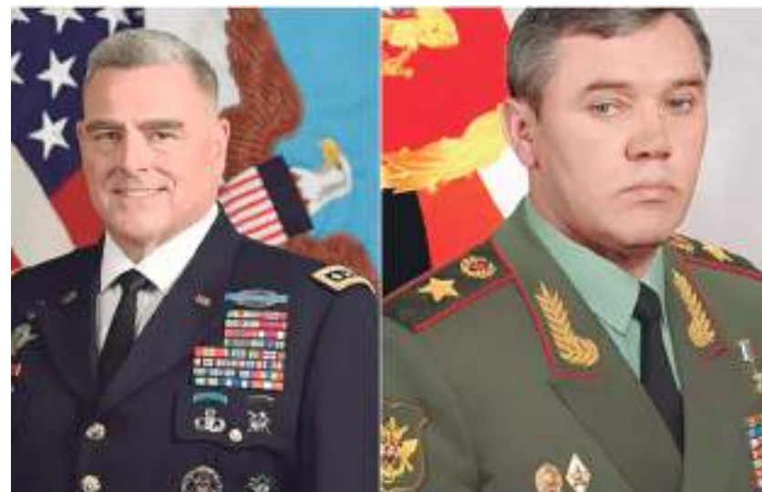
Encontro foi o primeiro desde o início do conflito. Conteúdo não foi divulgado

Mas a propagação dos combates para o leste e o sul da Ucrânia levou Biden a pedir outra rodada de apoio financeiro;