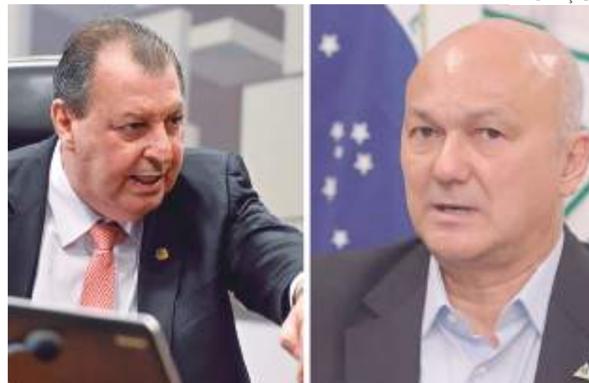
Diretório do PT-AM já declarou apoio público para o atual senador

Publicamente, Omar já havia se posicionado a favor da pré-candidatura de Lula para a presidência, indicativos do estreitamento de laços nes-