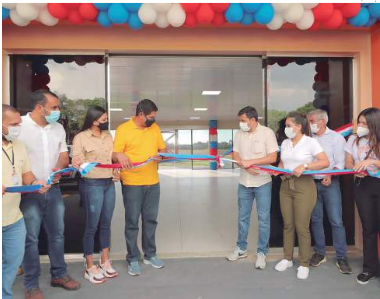
O Aero Mais Amazonas também inclui uma parceria com Infraero

Além disso, a Seinfra elaborou o projeto do aeroporto de