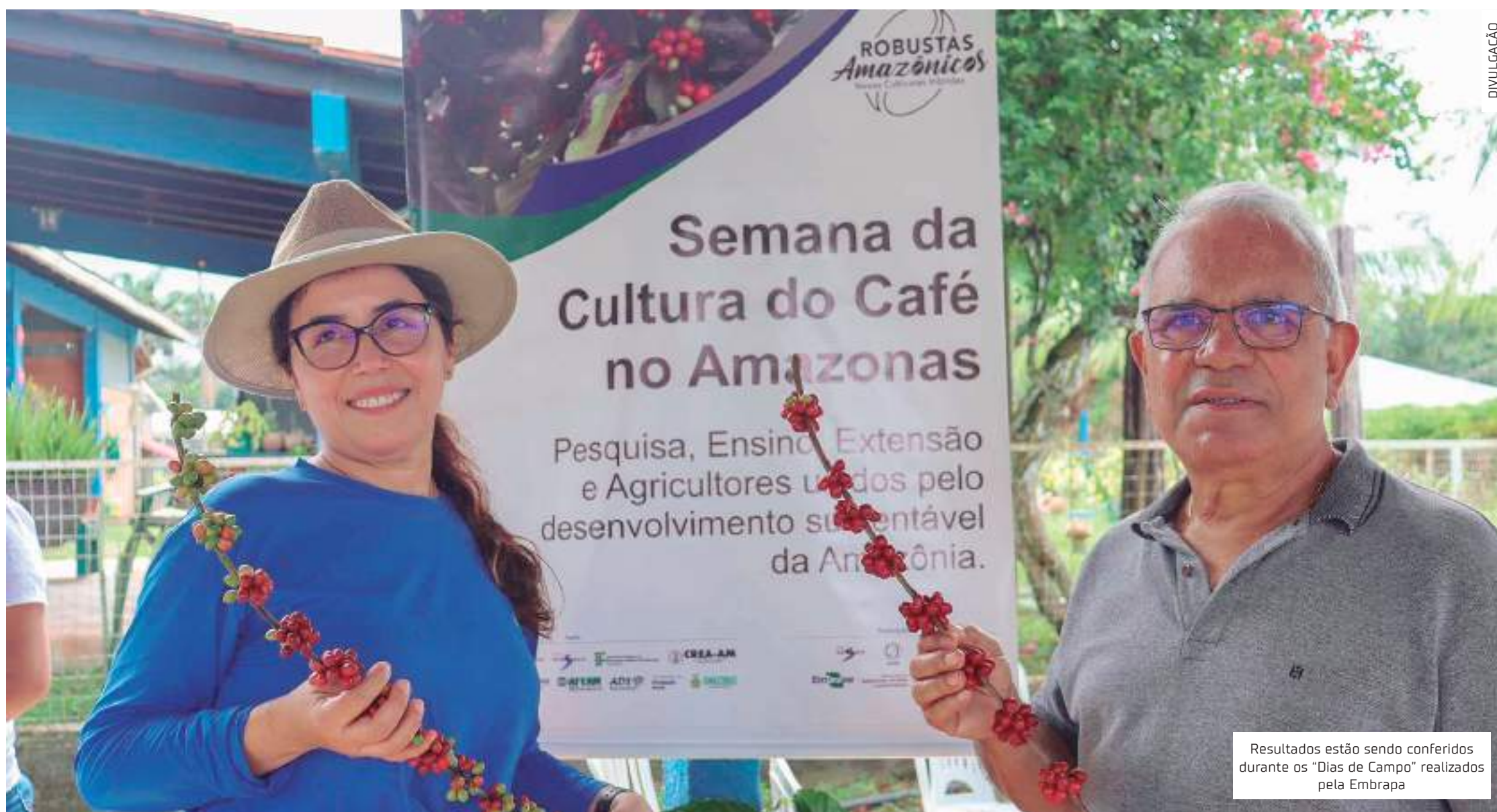
Resultados estão sendo conferidos durante os "Dias de Campo" realizados pela Embrapa

Resultados estão sendo analisados em atividades promovidas pelo Idam, Embrapa e outros órgãos em Itacoatiara, Silves e Manaus