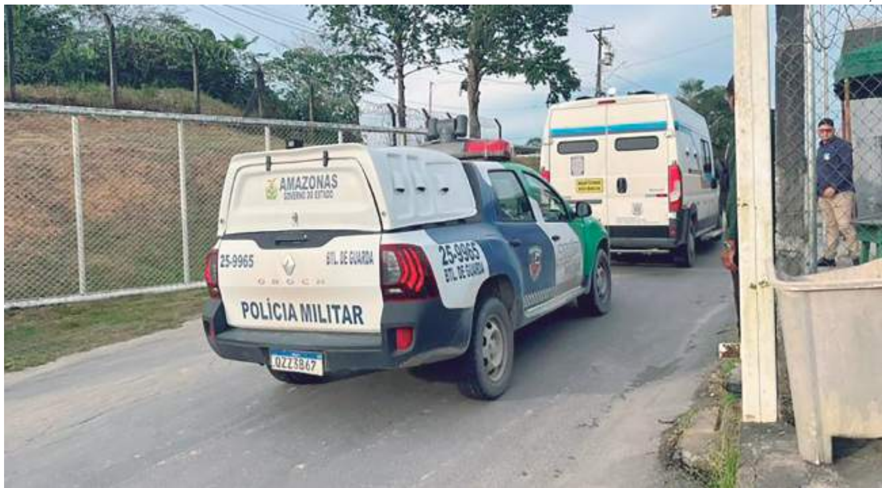
A Seap reforça que determinou que sejam tomadas todas medidas para apurar o ocorrido na forma da lei

Na ocasião cinco presos conseguiram fugir pelo teto do veículo e um outro ficou ferido ao cair do muro, este foi capturado e levado até a unidade policial