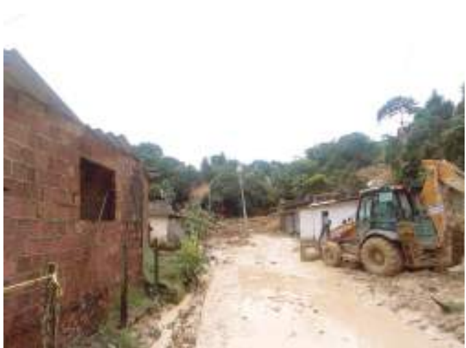
Os bombeiros continuam as buscas

Outros dois corpos foram retirados em Jaboatão dos Guararapes, na Região Metropolitana do Recife. Uma das pessoas era uma mulher. O quinto corpo, de uma vítima carregada pela enxurrada, foi localizado em Limoeiro, no agreste