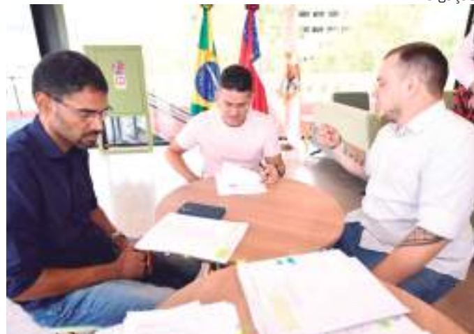
O perdão do Fumipeq é uma ação histórica

"Nós estamos dando perdão aos nossos permissivos que contraíram empréstimos do Fumipeq. Com isso, vamos beneficiar aproximadamente 5 mil empreendedores. São ma-