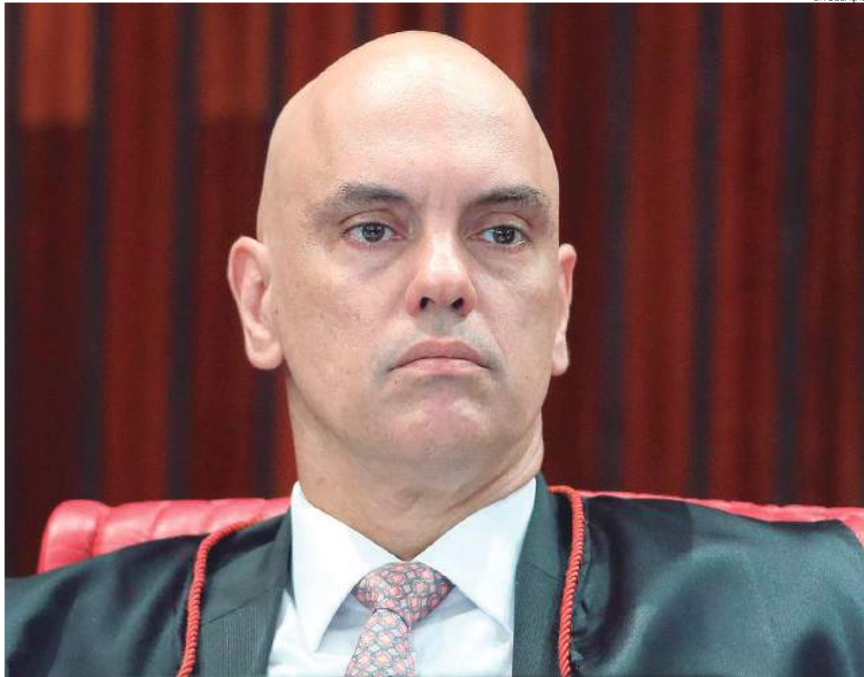
O ministro é um dos principais alvos do presidente Jair Bolsonaro em ataques que questionam a lisura dos processos do STF e TSE

Moraes, que também conduz investigações sensíveis contra o presidente Jair Bolsonaro, é o principal alvo de ataques do presidente. Bolsonaro já o chamou de canalha e chegou a insinuar que poderia não cumprir uma ordem judicial dada por ele.