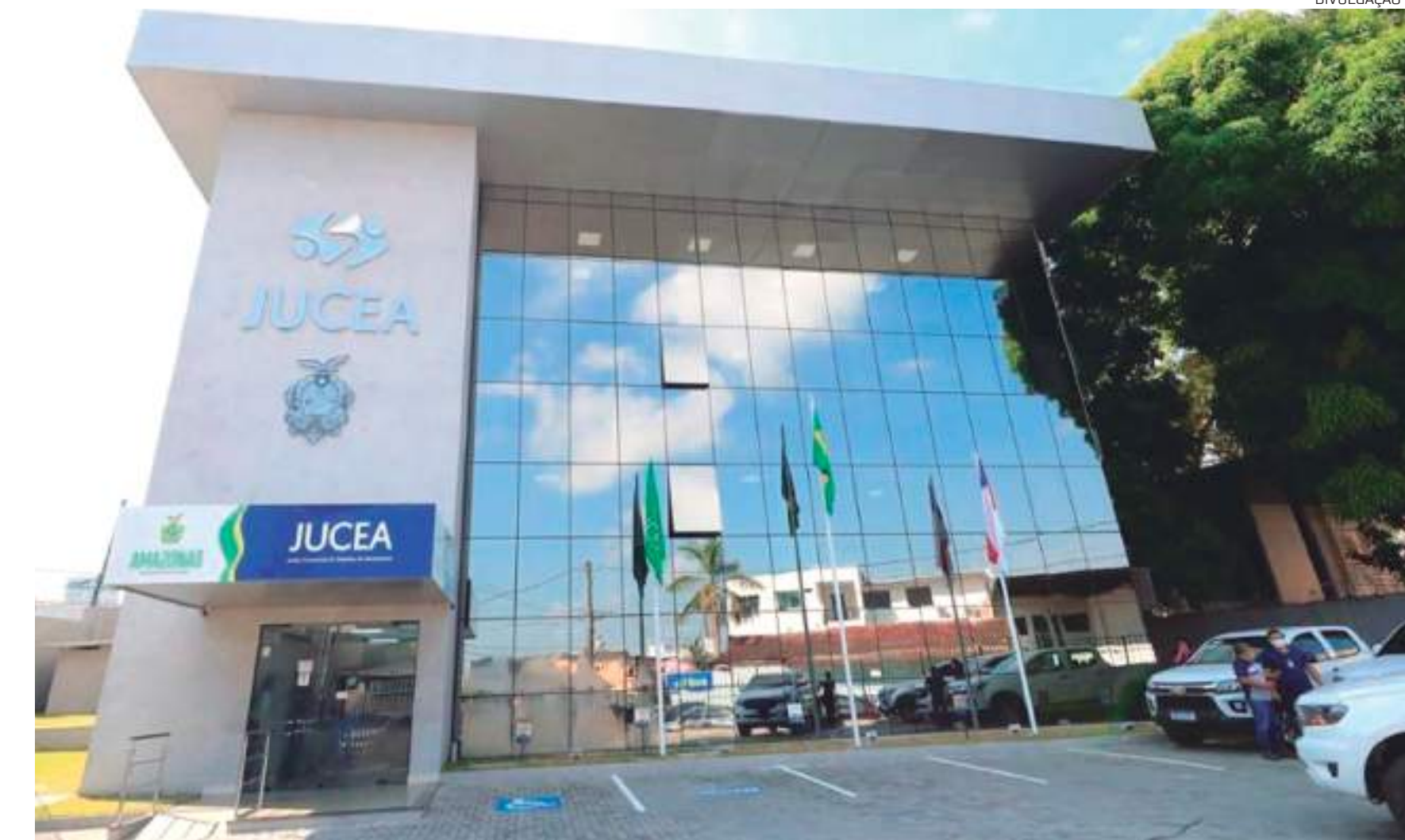
O número é 11,5% superior ao registrado no mesmo período do ano passado

"Nossa gestão tem trabalhado e investido recursos para garantir total acesso dos nossos serviços aos empreendedores da capital e do interior do estado, com a realização de campanhas, ações itinerantes e ainda a inauguração de postos de atendimento em pontos estratégicos no Amazonas. Tudo isso para promovermos um ambiente de negócios seguro e