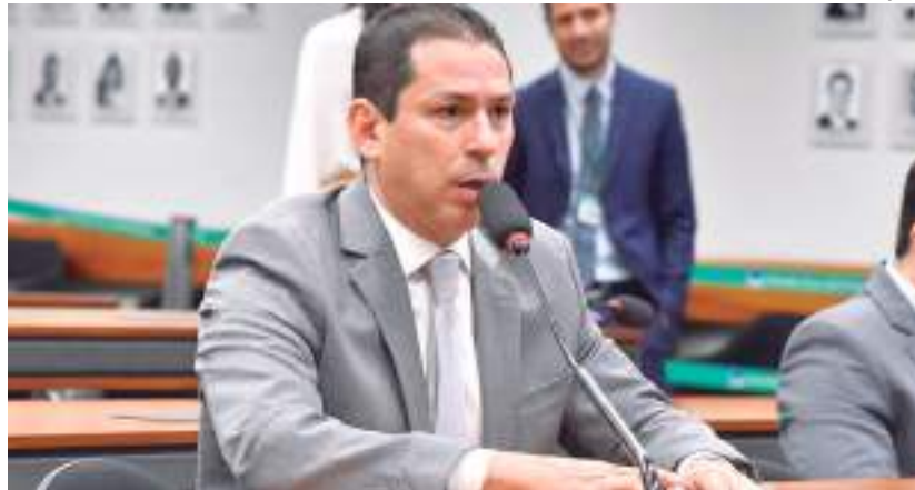
O ministro da Economia não compareceu em reunião sobre ZFM

Narrativa falsa sobre ZFM Marcelo Ramos disse que se Guedes tivesse comparecido