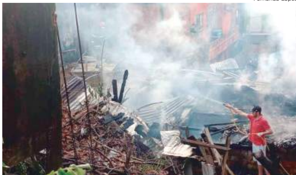
Bombeiro controlou o fogo, mas a casa já estava totalmente destruída

Nenhuma das pessoas retiradas da casa estavam no local para informar a polícia, sobre a possível causa do