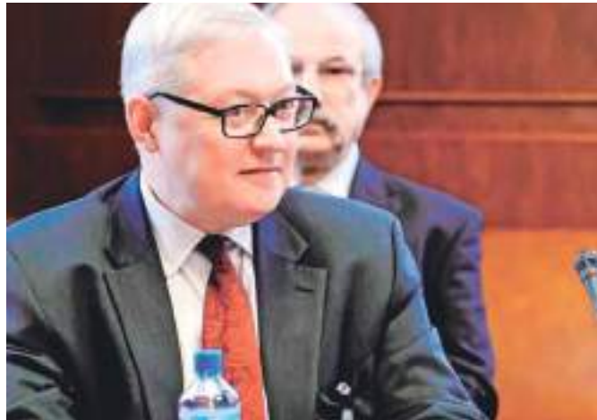
Há um ano, ele publicou imagens de fuzis automáticos

Washington afirmou que incluiria o sistema em um pacote de ajuda militar de