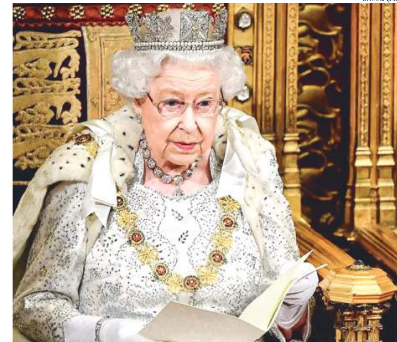
A festa está sendo preparada há meses, e eventos ocorrem desde o início do ano

Entre as primeiras comemorações, esteve a visita de líderes de comunidades e voluntários da casa de Sandringham, uma das residências reais, localizada em Norfolk, para comer bolos e ver uma exposição de itens relacionados ao jubileu. Na época, ela enviou uma mensagem ao povo,