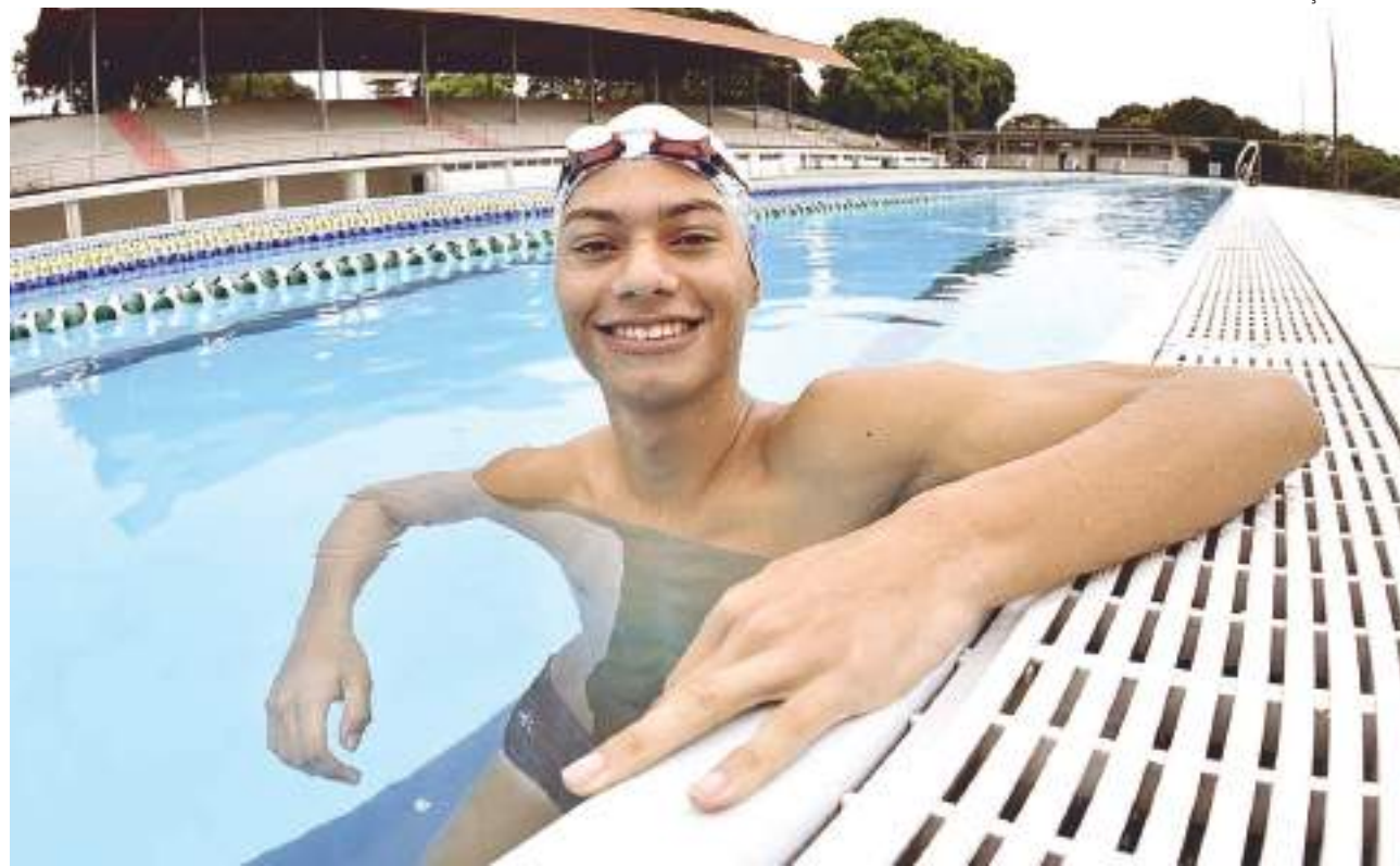
O atleta destacou a alegria de ter representado o Amazonas internacionalmente