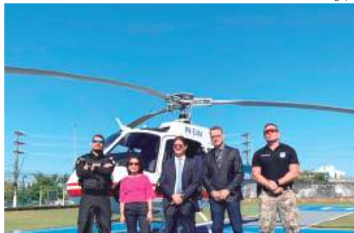
Equipe do MP e PC realizaram vistoria de invasões na cidade de Manaus

O Grupo de Atuação Especial contra o Crime Organizado (Gaeco) participou da inspeção, devido à