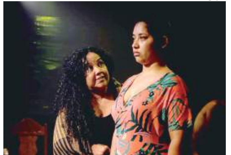
Tema delicado e urgente conduz o roteiro de “Alice Músculo +2”

A ficha técnica conta ainda com as atrizes Isabela Catão, Amanda Magaiver e Neuriza Figueira, escultura de Davi Baima, preparação de elenco de Viviane Palandi e pesquisa e sonoplastia de Diogo Navia. Francis Madson assina figurino e cenografia, enquanto a produção exe-