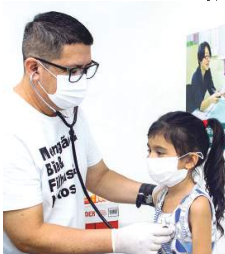
Atendimento Móvel de saúde chega a bairros da Zona Norte de Manaus

De acordo com Djalma, os serviços ofertados são: coleta de exame preventivo, consultas em enfermagem e com clínico geral, dispensação de medicamentos, teste rápido de Infecções Sexualmente Transmissíveis (ISTs) e inserção ou consulta de procedimentos no Sistema de Regulação (Sisreg).