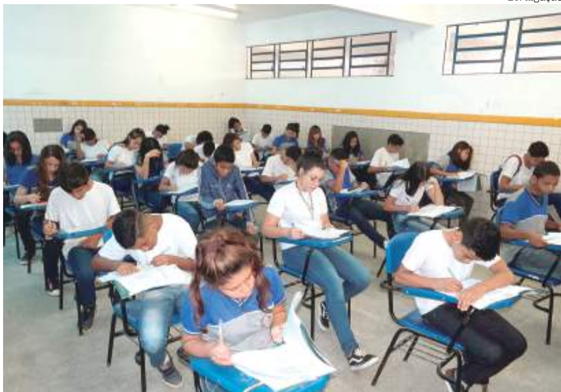
Estudantes de Manaus terão orientações para prevenção ao abuso sexual na grade curricular anual