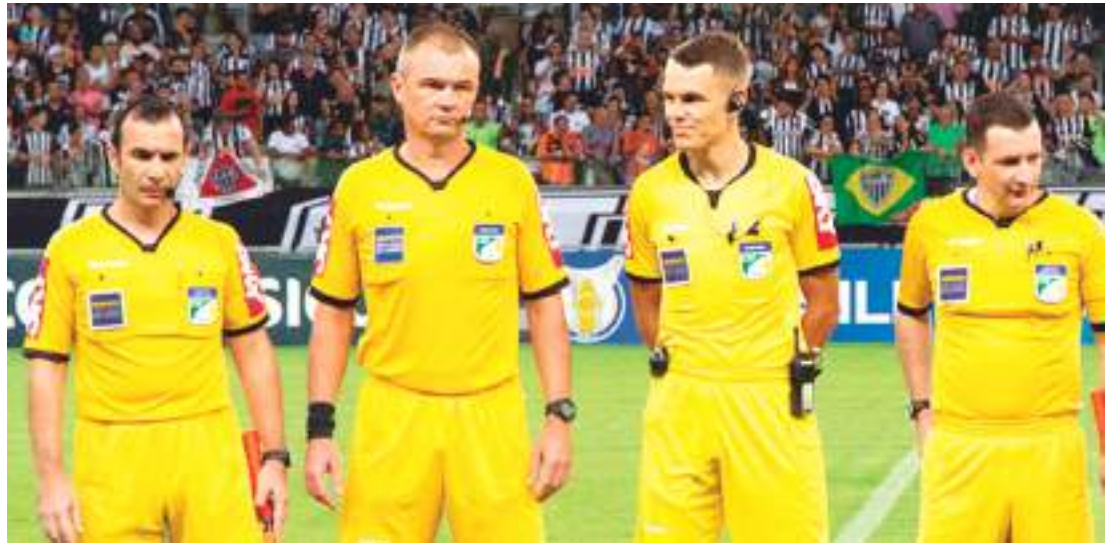
Anaf reivindica pagamento de patrocinadores da Confederação