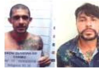
Homens morreram ao trocar tiros com PMs da Rocam