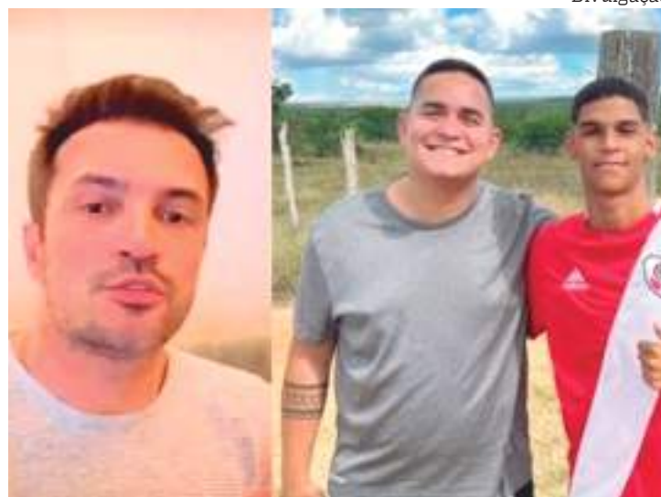
Falcão rebatendo áudio de ex-empresário de Luva de Pedreiro e acusações

“RECEBA o que for seu! Obrigado por ter me procurado e me escolhido em te ajudar! O mundo abraçou você e sua #Tropa @goleirodoluva @cruza-dordoluva e eu também!”, disse Falcão nas redes sociais.