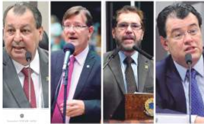
Caso de violência contra petista acende um alerta sobre eleições deste ano

O senador Omar Aziz (PSD) lamentou em suas redes sociais que duas famílias foram diretamente afetadas por um crime incitado pelo ódio.