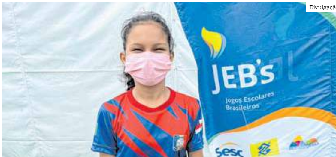
Estudante manacapuruense ganhou uma medalha de bronze no tênis de mesa e dedicou o prêmio à família

Com apoio do Governo do Estado, em parceria com a Federação Amazonense de Desporto Escolar (Fadede), 217 estudantes da rede estadual participaram da competição, que