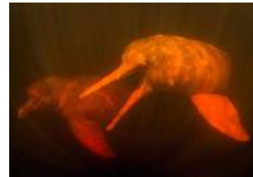
Densidade de botos diminuiu em Manacapuru

A pesca de botos amazônicos é proibida. Por isso, em 2015, o governo federal decretou, por cinco anos, uma moratória da pesca e da comercialização da piracatinga. A suspensão dessa atividade foi reno-