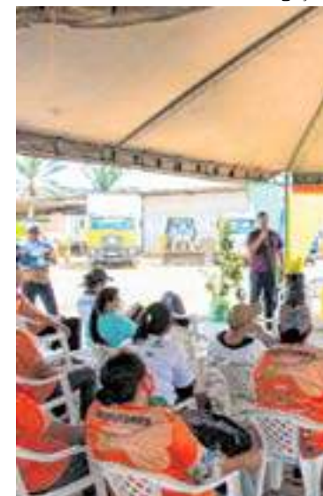
Eventos reuniram mais de cem agricultores e piscicultores