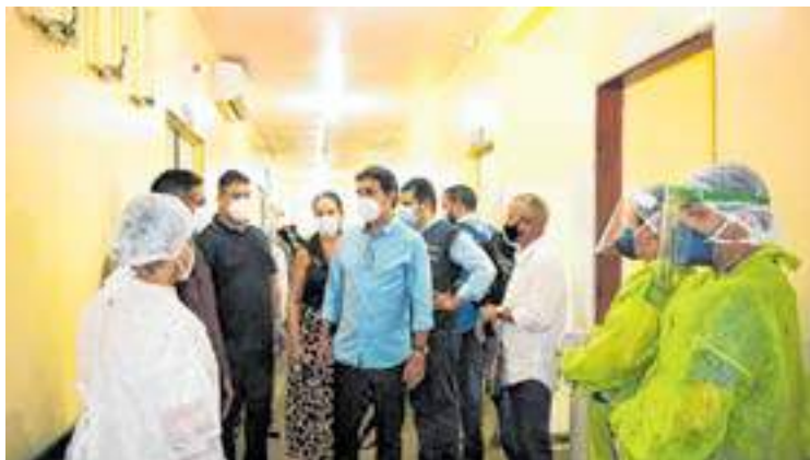
Itacoatiara passou por um período de dificuldades por conta da pandemia

A pandemia da Covid-19 que assolou o planeta e ceifou muitas vidas, ainda preocupa autoridades mundiais. No caso de Itacoatiara, a pandemia apresentou o seu primeiro pico em maio de 2020, quando 49,2% dos leitos do Hospital Regional José Mendes foram ocupados, e finalizou o ano com o saldo de 64 mortes pela Covid-19, sendo 11 mortes em abril, 42 em maio e 15 em no mês de junho.