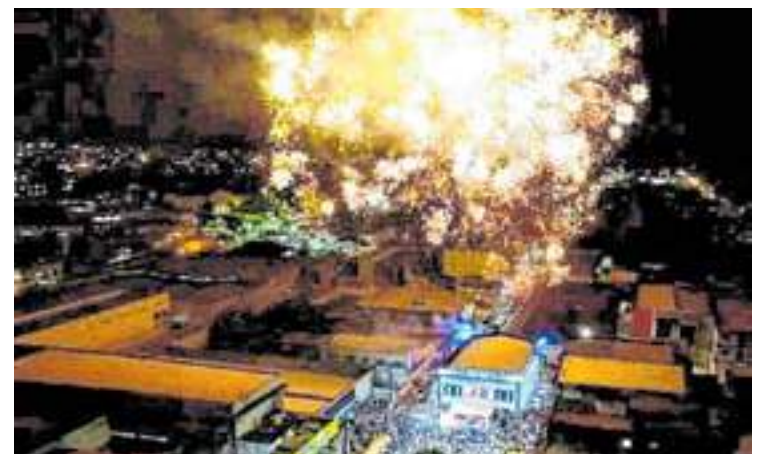
Festa de abertura teve música e fogos para animar a cidade