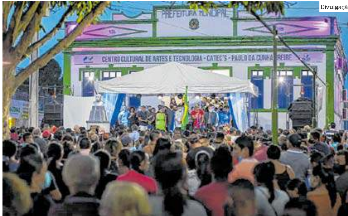
Espaço dedicado à divulgação da história, cultura e ao conhecimento artístico e tecnológico da cidade

“Os nossos jovens agora terão um local apropriado para desenvolverem, aprimorarem e apresentarem