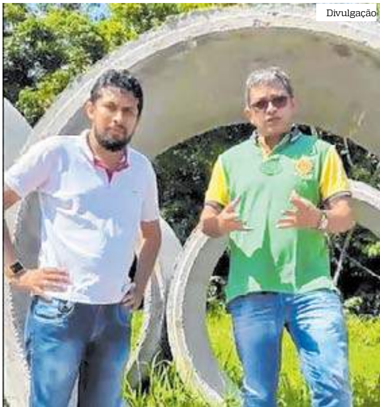
Ponte facilitará o escoamento de alimentos dos produtores rurais e a travessia

“Eu quero dizer para os nossos colegas agricultores e às pessoas que trafegam nesse ramal, estamos próximos de parar dessa peregrinação de não ter uma ponte com qualidade escoar nossa produção e o ir e vir das pessoas com mais segurança. No verão, as pessoas perdiam produção porque não