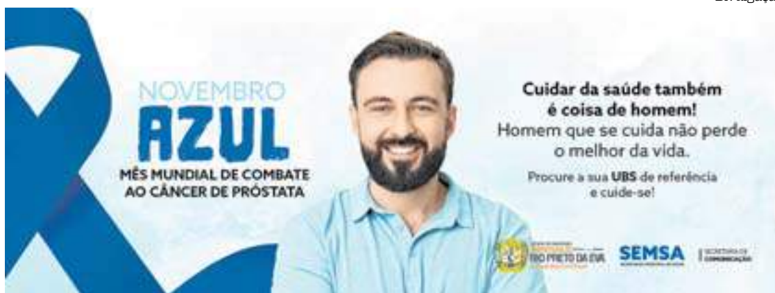
Órgão público usou as redes sociais para orientar sobre a doença e o tratamento

A prefeitura de Rio Preto da Eva (distante 79 quilômetros da capital) iniciou, nessa semana, a campanha do Novembro Azul, mês mundial de combate ao câncer de próstata. Para instruir os moradores, o órgão público usou as redes sociais para orientar sobre a doença e o tratamento e prevenção ao câncer.