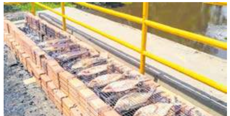
Durante a festa, foram distribuídas 2 mil bandas de peixe para população

“Tivemos uma crise muito grande com o pescado por conta ressurgimento da doença da Urina Preta, mas através da iniciativa do Governo do Estado que procurou divulgar com intensidade os benefícios do peixe, hoje realizamos este grande momento que foi entregar mais de mil bandas de tambaqui assado para a nossa população riopretense”, disse o prefeito.