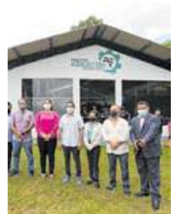
Vice-presidente da Câmara entregou obras sociais