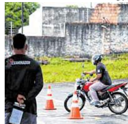
De 12 de novembro ao dia 3 de dezembro, os exames ocorrem no município Presidente Figueiredo

Com base nessas informações, o Departamento Estadual de Trânsito do Amazonas define as equipes de examinadores e prepara toda a logística para realizar as provas nos municípios.