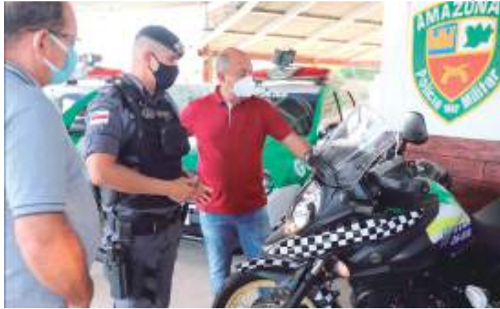
Os veículos fazem parte do Grupamento Tático Móvel

Os veículos fazem parte do Grupamento Tático Móvel (GTAM), do Governo do Amazonas, destinados aos municípios para reforçar os serviços de segurança pública nas cidades. Neste primeiro momento, foram contemplados dez municípios, incluindo Novo Airão. Os kits distribuídos são compostos por duas viaturas e três motocicletas. O objetivo é de estender a