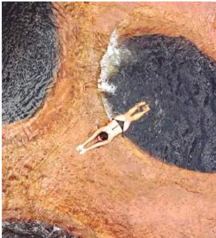
Cachoeira é conhecida pelas formações geológicas circulares

“Presidente Figueiredo é um ponto estratégico para