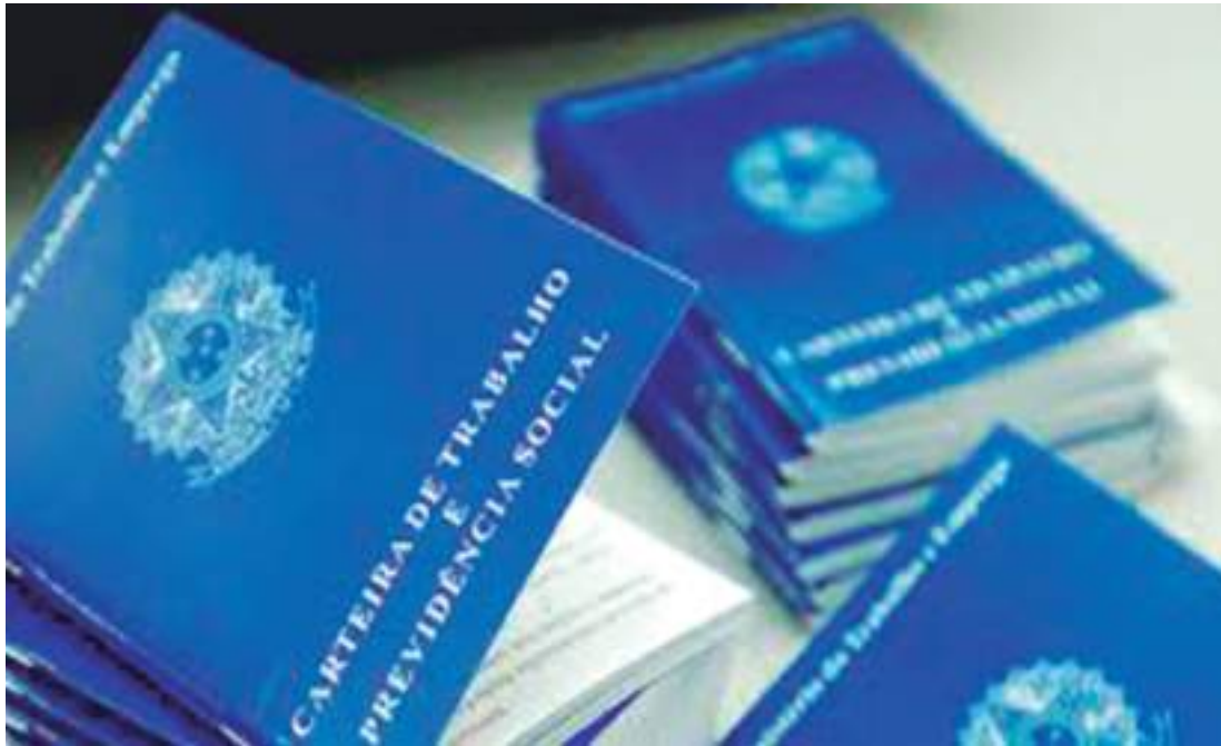
O serviço está disponível em Manaus (AM) e nas 10 Varas do Trabalho no interior do Amazonas

balhador deverá comparecer ao Fórum Trabalhista de Manaus levando os documentos pessoais (RG, CPF, comprovante de residência), e ainda os documentos relativos à relação de emprego (CTPS, contracheque, extrato do FGTS, CAGED, CNIS, Contrato de Trabalho) e outros que porventura possua e considere necessário juntar na ação trabalhista.