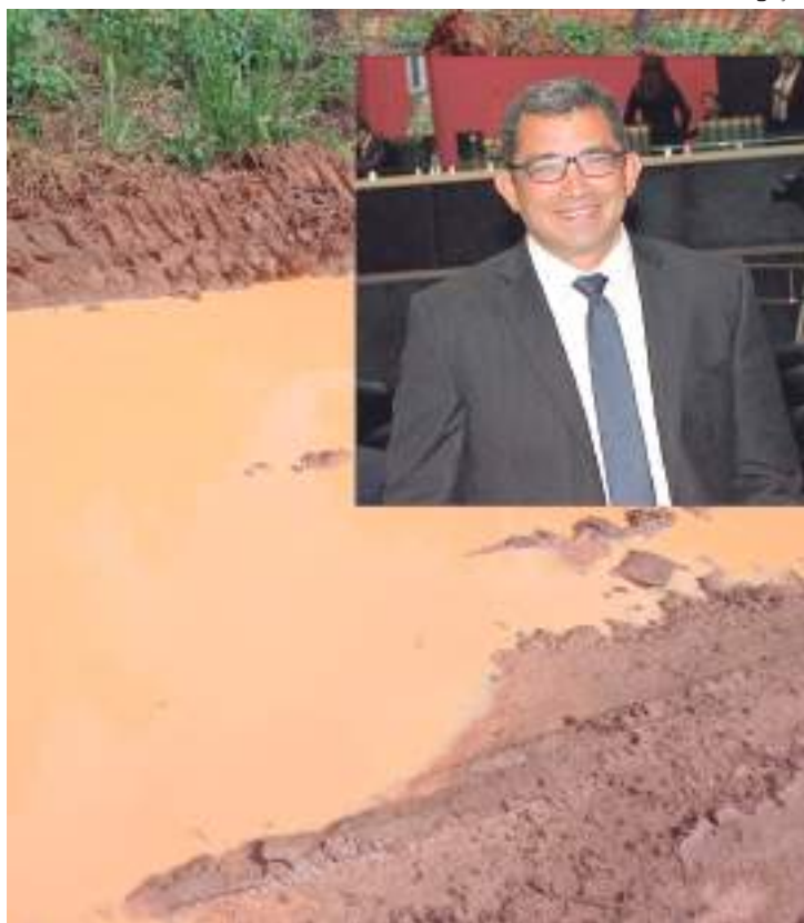
Irاندubenses questionam o prefeito sobre a falta de pavimentação

Enquanto os moradores de Paricatuba voltam