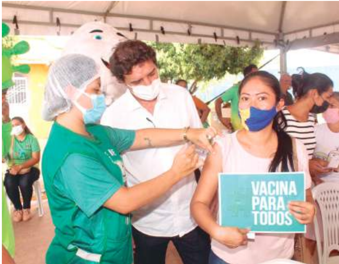
A Semsa finalizou o mês de janeiro deste ano alcançando números positivos no combate à doença

A população já apresenta a cobertura vacinal de 83,3% na primeira dose aplicada, 74,2% na segunda dose, e cerca de 65,7% com esquema vacinal completo para pessoas com idade a partir dos 5 anos. A mudança impactou em 73,8% a redução de internados em Itacoatiara.