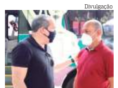
A ação será realizada na Praça Hugo Frederico Costa

e parabenizou o Tribunal e o Detran por promoverem facilidades à população, resolvendo pendências que, muitas vezes obriga o deslocamento à capital. “Esse é mais um gesto de atenção do Governo do Estado ao nosso município.”