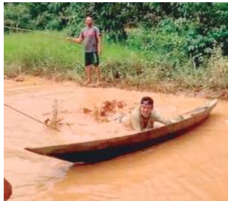
Populares do ramal do Caminhoneiro protestaram contra a administração

Em relação aos bairros da sede, a Prefeitura aponta para “ajustes do projeto” e faz uma nova promessa de conclusão das obras. “Foram necessários alguns ajustes do projeto, no que se trata da drenagem e, segundo a Seinfra (Secretaria de Estado de Infraestrutura), os ajustes estão sendo feitos e, por isso, as obras pararam. Porém, logo, serão retomadas. Quando chegar o verão, todas as obras serão concluídas, assim que parar o período chuvoso. Fora isso, a Prefeitura planeja revitalizar o Centro da cidade, bairro São Francisco e outras partes da cidade, assim como está sendo feito no Ariaú”, explica.