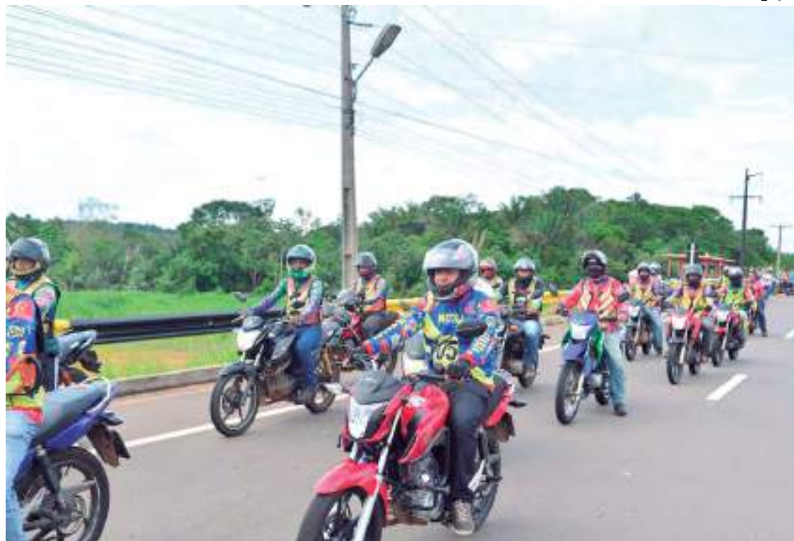
As inscrições começam nesta sexta-feira (14) e terminarão no dia 25 de janeiro

Nos municípios de Tefé, Tabatinga e Eirunepé, as inscrições ocorrerão entre os dias 24 de janeiro a 4 de fevereiro. As aulas para especialização serão realizadas de 1º a 5 de fevereiro, e para atua-