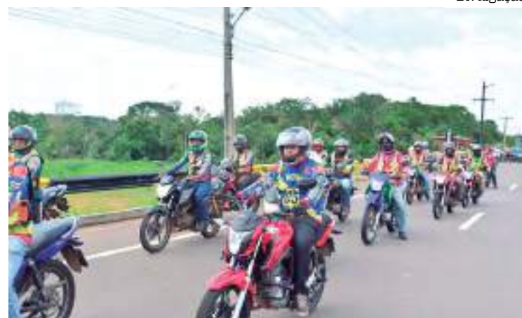
Os programas irão atender principalmente famílias em vulnerabilidade social.

O Pão na Mesa oferece pão gratuito para famílias em vulnerabilidade social; Exerga + Rio Preto realiza exames gratuitos e entrega armações de graça; Sorria + Rio Preto disponibiliza consultas, dentaduras ou peça dentárias de forma gratuita; e Rio Preto pela Inclusão, responsável por entregar muletas, cadeiras de rodas e próteses.