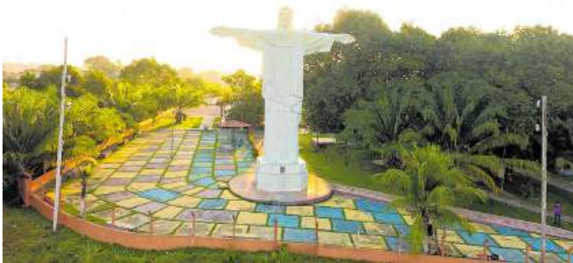
Rio Preto da Eva têm vários pontos turísticos que aproximam as pessoas com a natureza

A relação entre natureza e saúde mental tem ganhado cada vez mais destaque entre a comunidade científica. E não é para menos: diversos estudos já mostraram que a exposição à natureza pode trazer benefícios enormes para as pessoas, principalmente aquelas que vivem em grandes centros urbanos.