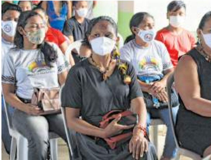
Curso é realizado pela Associação dos Professores Indígenas do município

O "Pirayawara" visa formar professores indígenas no Ensino Médio Técnico, para atuar nos Anos Iniciais do Ensino Fundamental, em suas comunidades, como professores-pesquisadores de seu próprio uni-