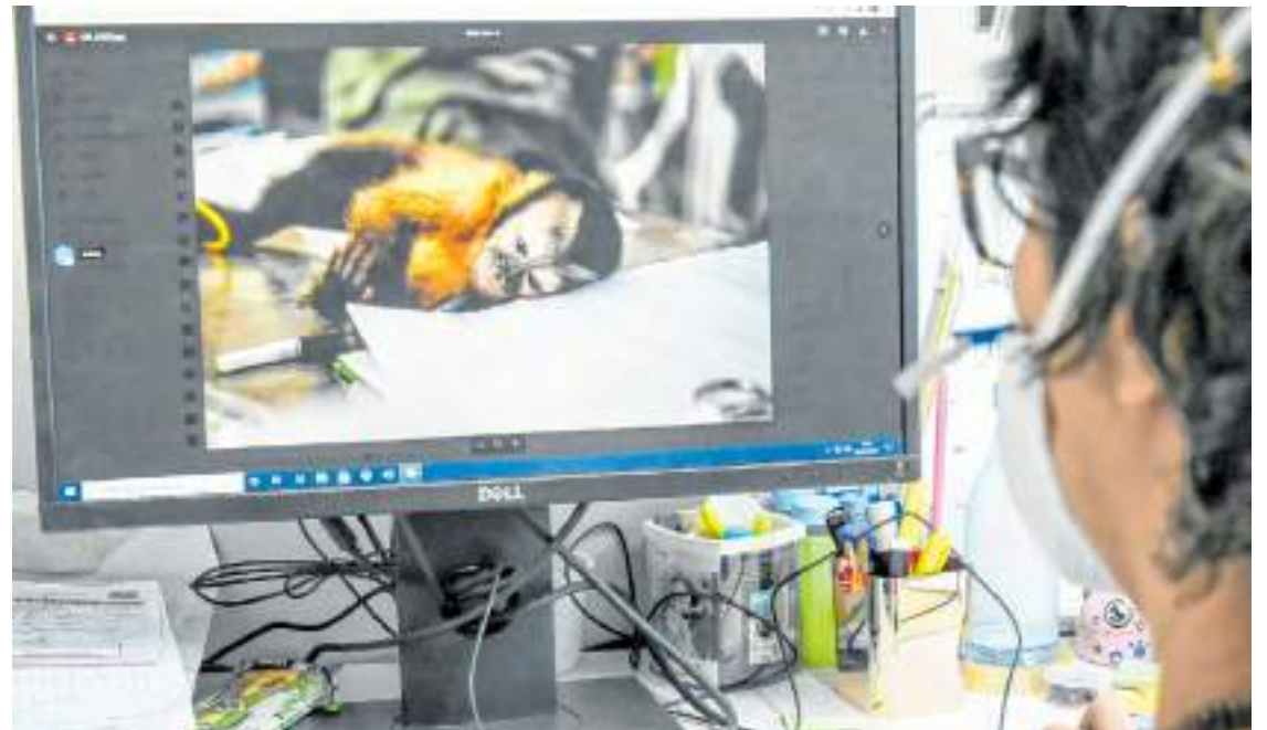
Pesquisa da Fiocruz Amazônia envolveu os animais silvestres de Presidente Figueiredo

Ela destaca que o primordial é saber quais pa-