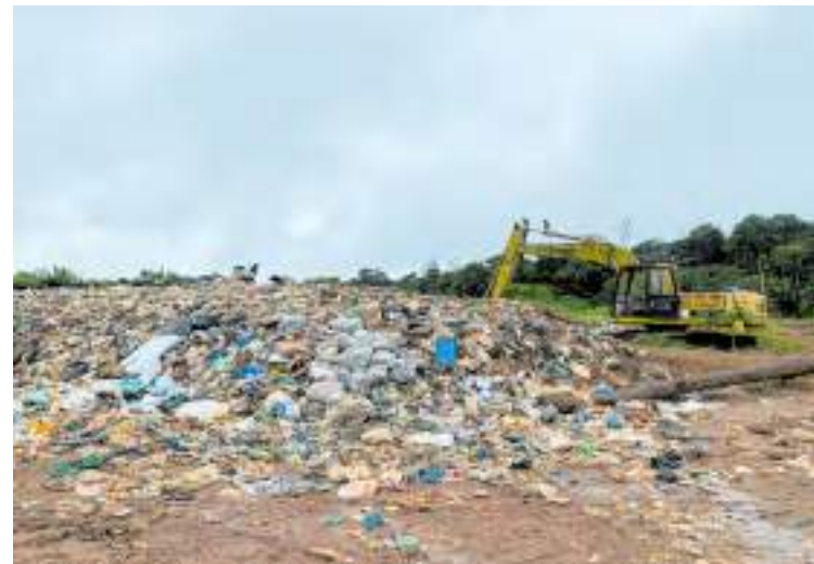
Depósito irregular de resíduos existe no local há anos