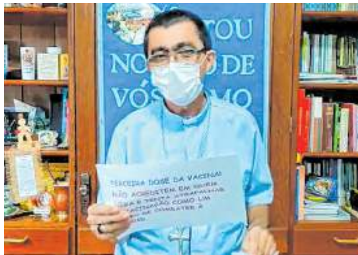
Líder religioso diz que os cristãos não podem ser contra a vacinação

“Temos que imitar Jesus, andar por toda parte fazendo o bem. Receber a vacina é uma forma de fazer o bem, de ajudar a gente a comba-