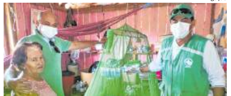
Levantamento fará a identificação dos locais onde há focos do mosquito

ve incluído entre os cinco municípios com alto risco de infestação em 2018, registrou 133 casos de dengue em