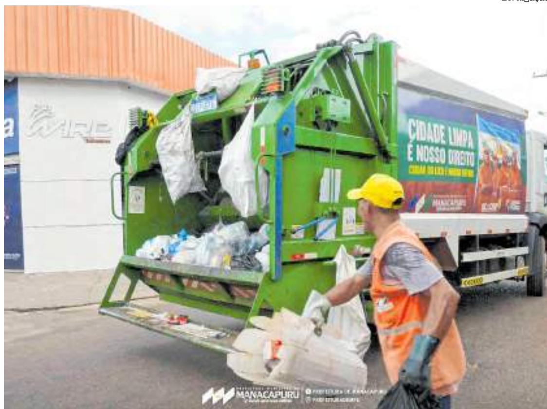
Equipes de limpeza vêm atuando para realizar ações em várias áreas da cidade