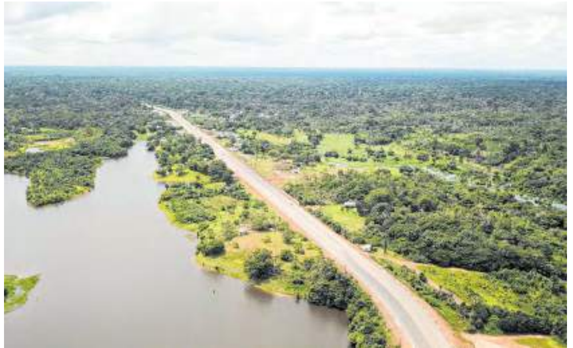
Duplicação da rodovia beneficia moradores de seis municípios do AM

“Estou aqui há 22 anos, mas vejo essa estrada desde que nasci. Não tinha asfalto, nem luz, era só na picarra. Agora virou cidade. Vem mais cliente e fica muito bom. É um presente de Natal, um presen-