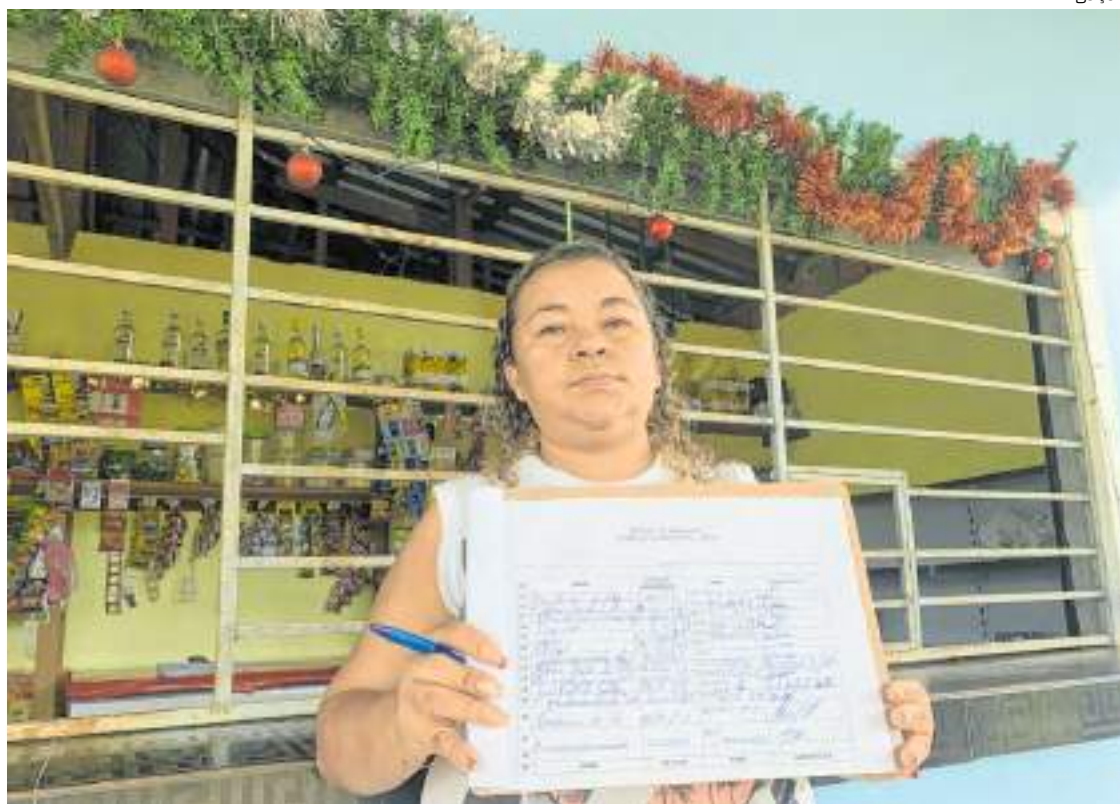
Habitantes fizeram abaixo-assinado solicitando dos órgãos públicos a retirada do lixão

Moradores da comunidade São Sebastião, localizada no Km 6, do Ramal dos Caminhoneiros, em Irاندوبا (a 28 quilômetros de Manaus), iniciaram esta semana um movimento para coletar adesões para o abaixo-assinado no qual solicitam dos órgãos públicos e ambientais do município e do Estado, a retirada imediata do lixão localizado na área.