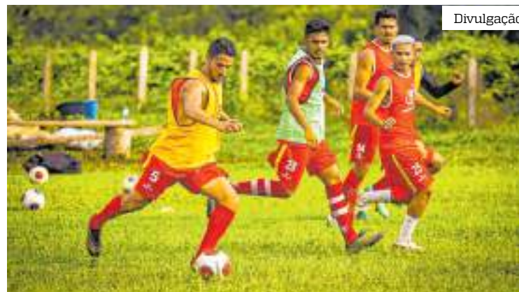
O Tubarão estreia no dia 26 de janeiro, no Gilbertão, contra o Iranduba

"Vamos tentar seguir a mesma linhagem do campeonato passado, apesar de não conseguirmos o título, fizemos um ótimo campeonato, a gente era a equipe a ser batida até o