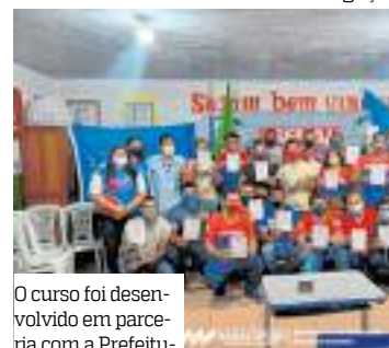
O curso foi desenvolvido em parceria com a Prefeitura e o Senai

Ao longo do ano, o Senai Amazonas, por meio da Escola Senai de Ações Móveis e Comunitárias (ESAMC), já realizou diversos cursos gratuitos, em parceria com as prefeituras, nos municípios de Iranduba, Manacapuru e Novo Airão.