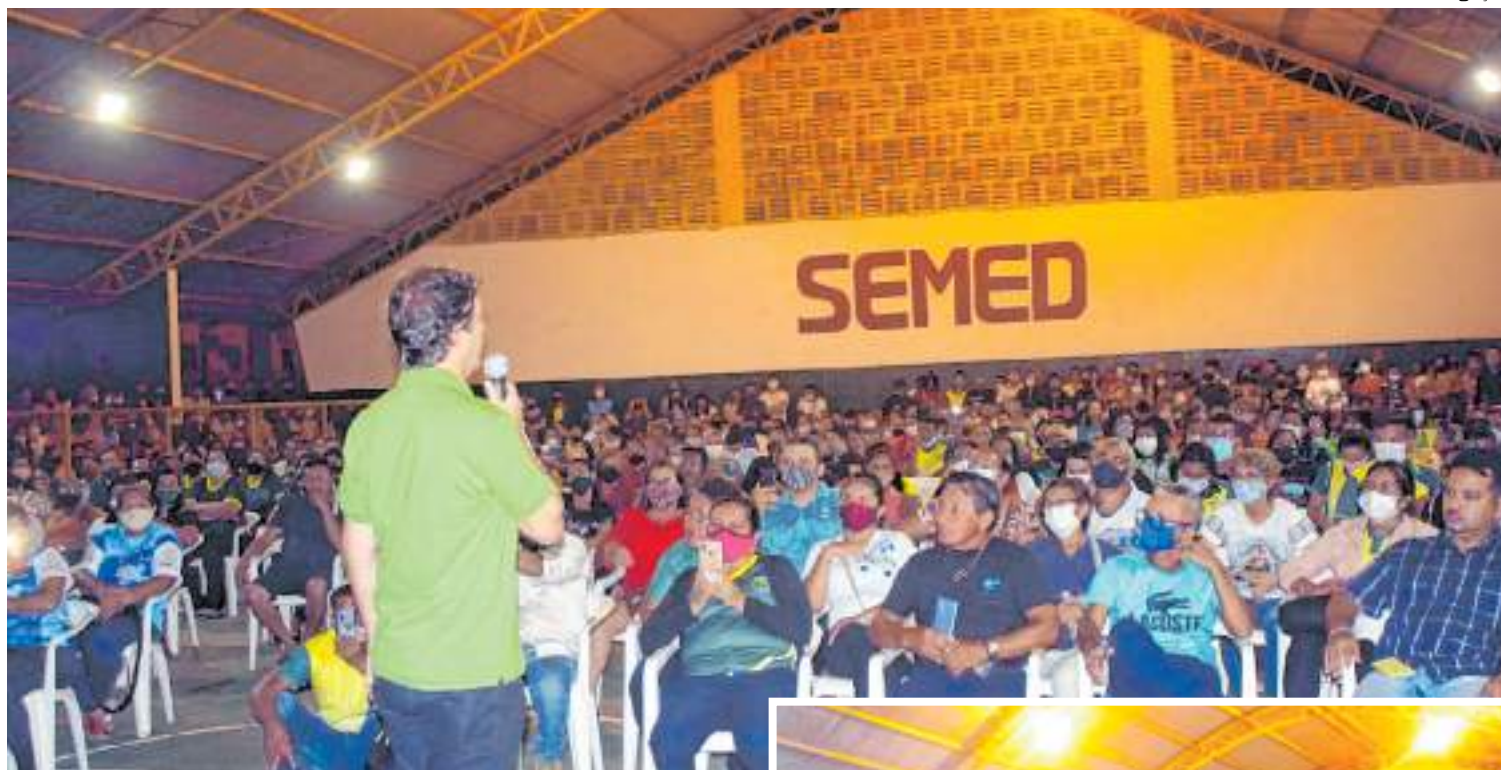
A prefeitura pretende fortalecer o poder aquisitivo de profissionais de educação

O prefeito de Itacoatiara, Mário Abraham (PSC), anunciou, na última quinta-feira (9), em evento realizado na escola municipal Jamel Amed, a perspectiva de aplicar mais de R$ 30 milhões na economia do município, distante 176 quilômetros de Manaus. A prefeitura pretende fortalecer o poder aquisitivo de profissionais, além de melhorar a educação, por meio de um pacote de investimentos.