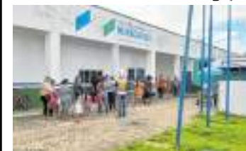
Os atendimentos foram realizados na sede e na zona rural