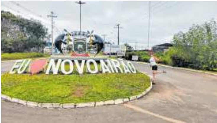
Prefeitura realizará festa entre os dias 17, 18 e 19 com atrações nacionais