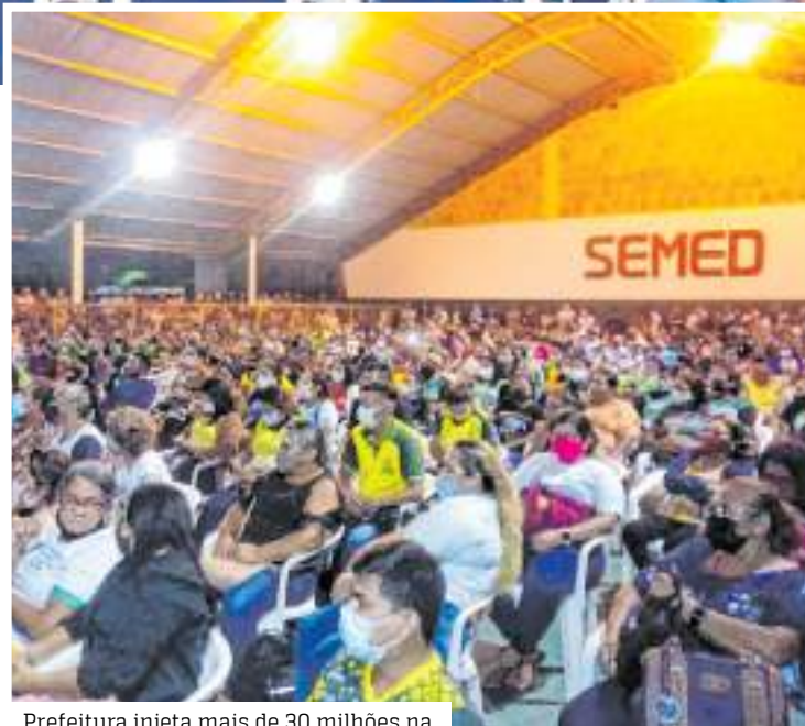
Prefeitura injeta mais de 30 milhões na economia do município neste mês

Combate ao desestímulo Em reunião com os