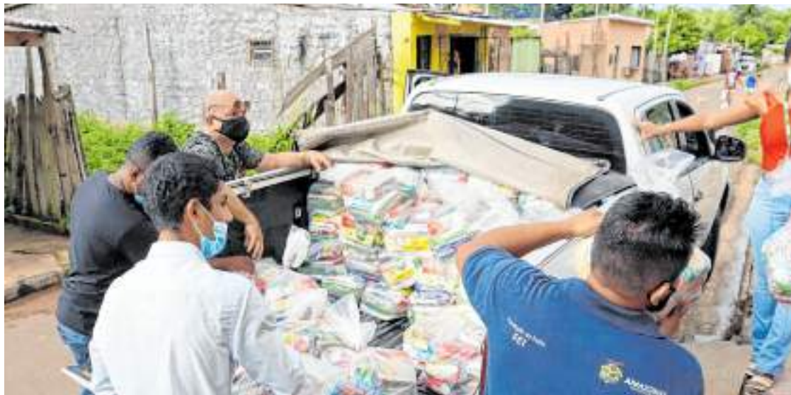
Entregas de cestas básicas realizadas pela FEI foram feitas em cinco comunidades indígenas

“Estamos realizando visitas em diversas comunidades e aldeias indígenas para que possamos ver as