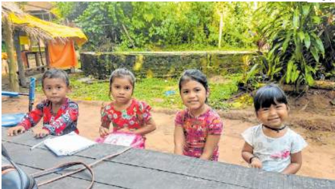
Crianças da tribo Sateré-Mawé precisam de auxílio para conseguirem os presentes de Natal

"Ornamentamos uma árvore de Natal com meias e cartinhas. As crianças têm