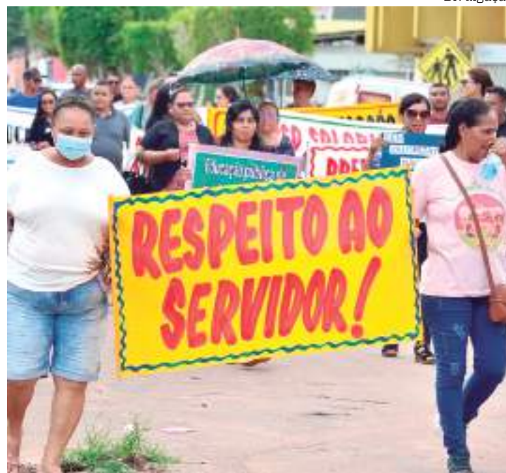
Professores pedem reajuste salarial e melhores condições de trabalho

De acordo com o sindicato, os professores estão se sentindo prejudicados com a falta do cumprimento da Lei do reajuste salarial e ainda apontaram que a prefeita vem tentando des-