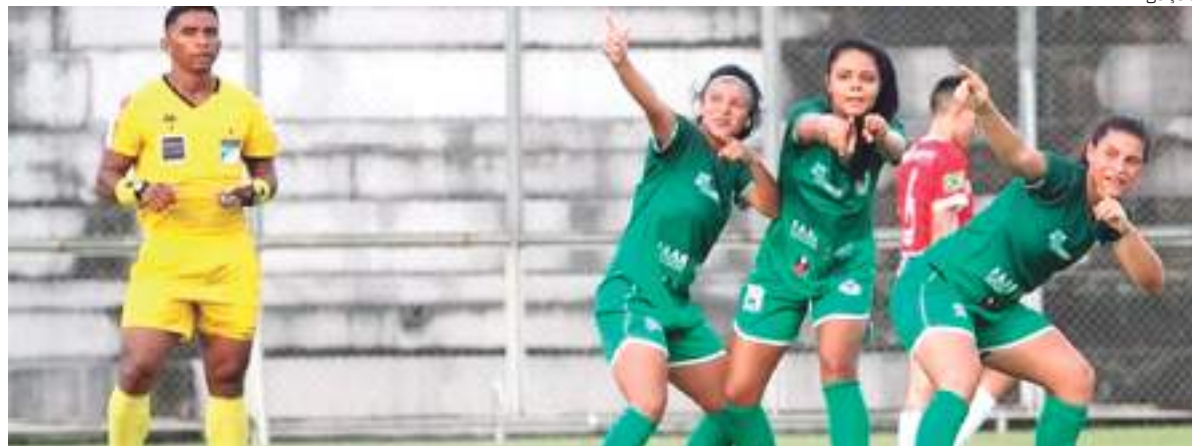
O Real Ariquemes ocupa a liderança com seis pontos e o Irاندوبا é o lanterna com um ponto

Na classificação do grupo D, o Real Ariquemes ocupa a liderança com seis pontos. Já o Irاندوبا é o lanterna com um ponto.