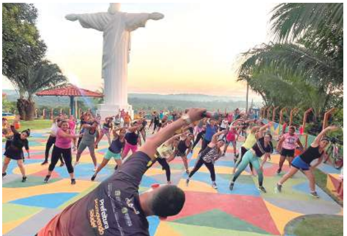
A aula de lançamento do projeto aconteceu aos pés do Cristo Redentor do município

As aulas do projeto Agita Rio Preto vão ocorrer todas as terças e quintas-feiras a partir das 17h30. A princípio as aulas serão ministradas no Mirante Cristo Redentor, mas a ideia é que o projeto seja itinerante, e possa ser realizado em todos os bairros do município, para alcançar o maior número de participantes.