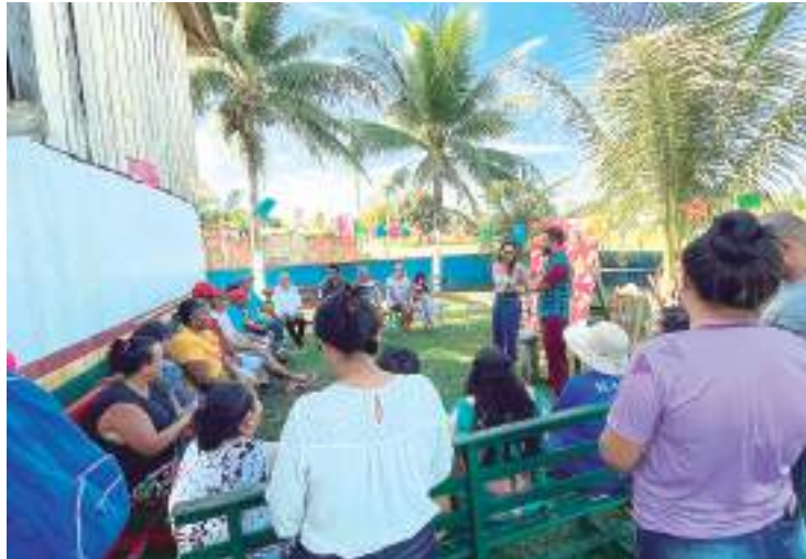
Campanha teve como objetivo conscientizar sobre diagnóstico precoce

A Prefeitura de Itacoatiara, por meio da Secretaria Municipal de Saúde (SEMSA), realizou uma ação específica como o dia “D” nas Unidades Básicas de Saúde (UBS’s), alusiva ao Dia Mundial da Conscientização do Diabetes, dia 26 de junho.