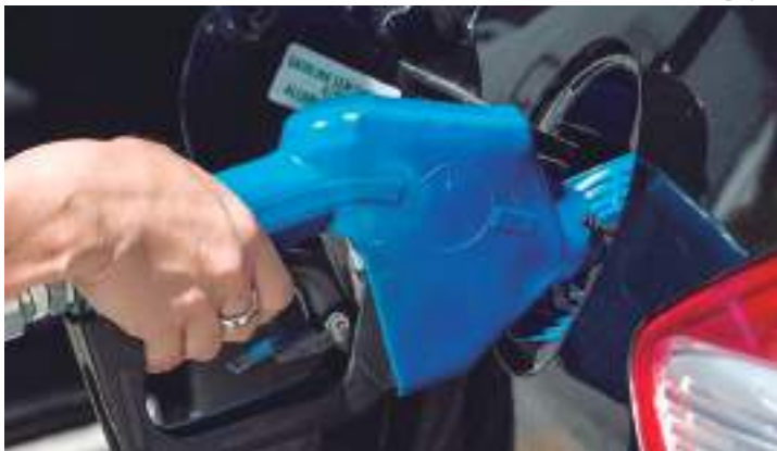
Aumento no preço já virou parte da rotina dos brasileiros