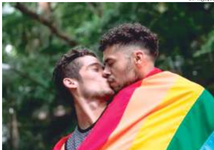
População LGBTQI+ enfrenta desafios diários para ter direitos respeitados