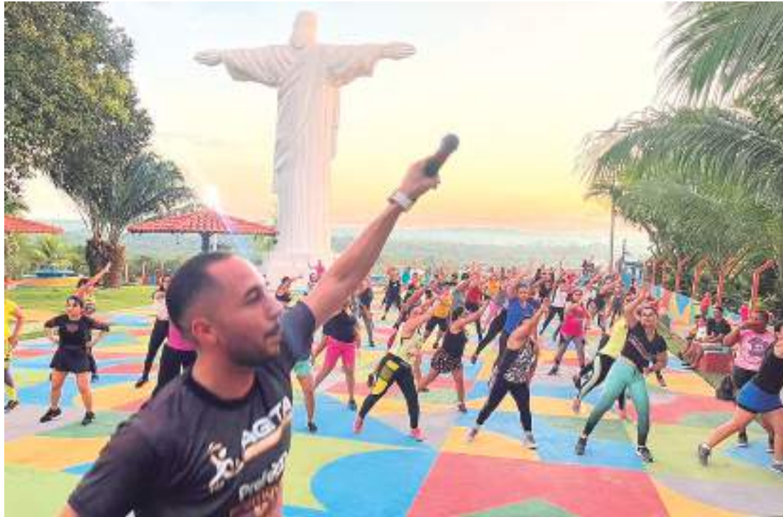
Projeto foi lançado pela prefeitura para levar mais qualidade de vida à população

A aula de lançamento do projeto aconteceu aos pés do Cristo Redentor do município, um dos cartões postais da cidade. Mais de 100 mulheres participaram