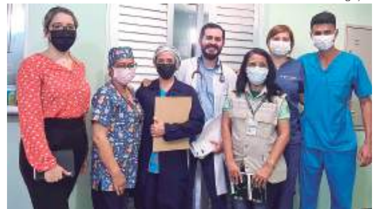
Rabdomiólise é conhecida como doença da urina preta

Durante o período de 27 a 30 de junho a FVS-RCP realizou visita técnica como o objetivo de investigar a doença para identificar possíveis causas e promover o monitoramento das ações promovidas pela Divisão de Vigilância em Saúde Municipal (DVS), que visitou comunidades ribeirinhas com o