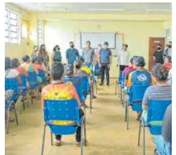
600 famílias vivem na comunidade do Lago do Limão, da agricultura e da piscicultura na região

Na manhã de sábado (23), ocorreu uma ação do Quem Ama Cuida aos comunitários do Lago do Limão na escola municipal Professora Maria Auxiliadora Mesquita Simas, onde foram oferecidos serviços de psicologia, assistência social, de médicos veterinários, orientação, atendimento de primeiros socorros, dentre outros serviços.