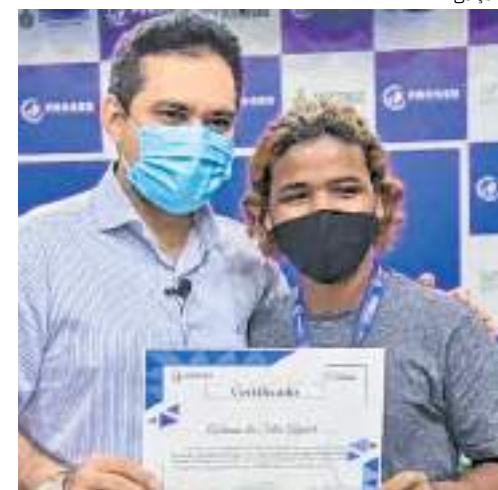
Projeto é executado pelo Centro de Educação do AM

Associação de Praças da Polícia e Bombeiro Militar do Amazonas (APPB-MAM), Comissão de Promoção e Defesa das Crianças, Adolescentes e Jovens da Aleam e o Centro de Educação Tecnológica do Amazonas (CETAM), o projeto "Praças do Futuro", tem proporcionado a formação de jovens de famílias de militares, vítimas da Covid-19, e a sociedade em geral.