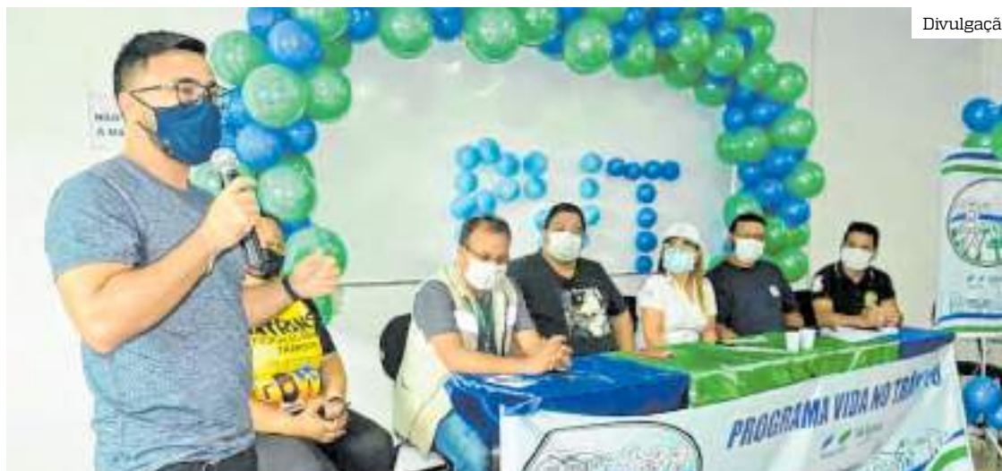
Programa irá atuar para diminuir acidentes no trânsito da cidade

Em parceria com outros órgãos como Instituto Municipal de Transportes de Manacapuru (Imtrans) e Departamen-