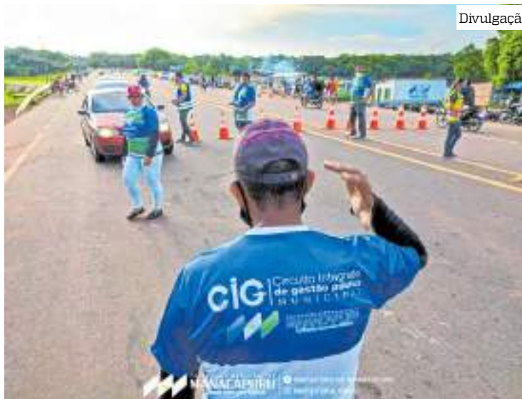
Ação tem o objetivo de sensibilizar para a importância da conservação e limpeza

Houve uma interação com os donos de estabelecimentos,