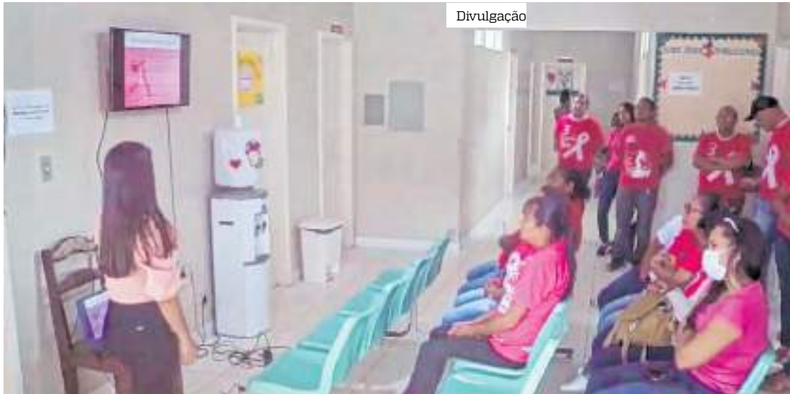
Campanha tem a intenção de alertar a sociedade sobre o diagnóstico precoce do câncer de mama

A profissional ainda destaca as vantagens do pré-