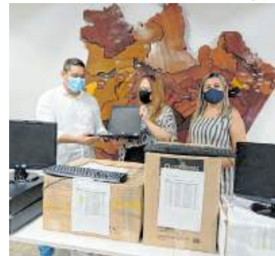
Doação faz parte de um esforço para fortalecer o empreendedorismo na cidade

“A parceria com o Sebrae tem dado bons frutos, e que está em estudos a doação do terreno, para a construção da futura sede própria do Sebrae local”, disse a secretária adjunta.