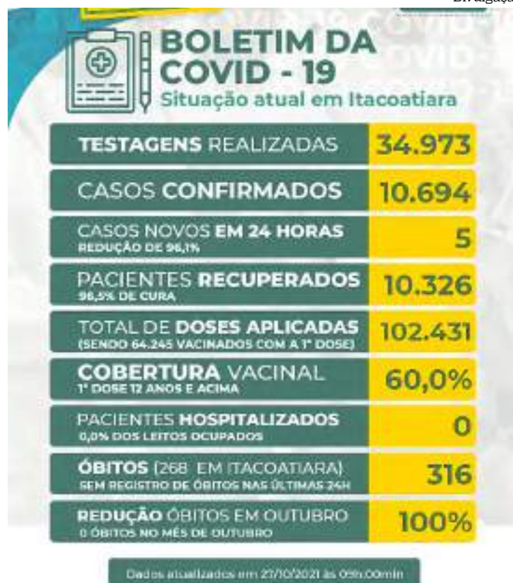
62,1 mil pessoas receberam a primeira dose, 37,4 mil a segunda da vacina contra covid