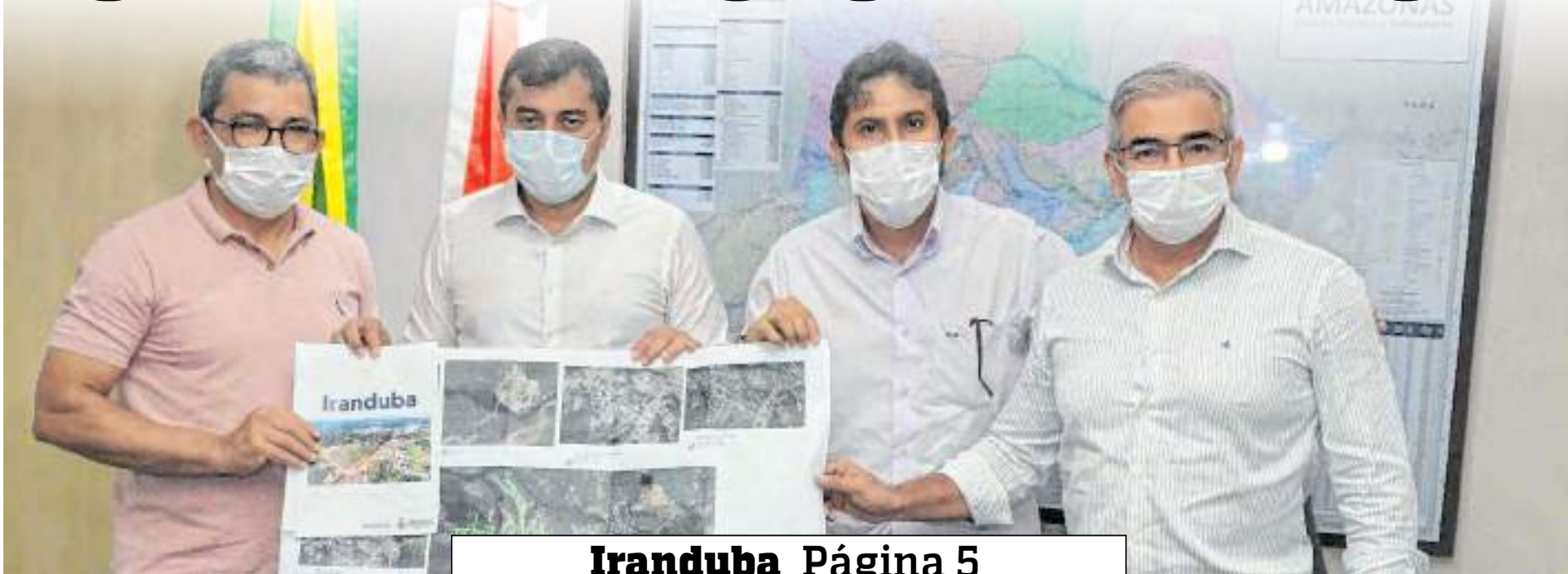
Iranduba Página 5

FIGUEIREDO REGISTRA MAIS CONTRATAÇÕES DO QUE DEMISSÕES