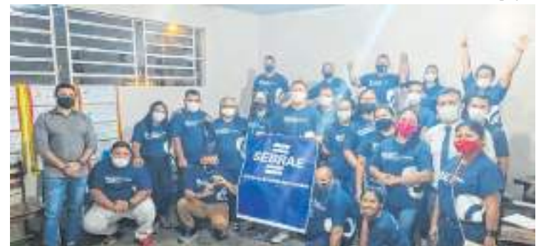
A atividade contou com 21 dias de palestras, oficinas e consultorias

circuito houve a aplicação de elementos que uniram a forma teórica e prática no desenvolvimento, com o intuito de aumentar consideravelmente as chances de os empreendedores crescer, conquistar mais espaço e ter bons resultados no seu início de jornada.