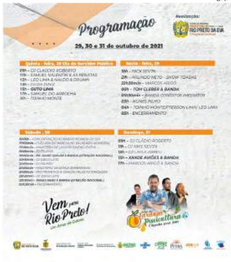
A abertura dos eventos musicais ocorre a partir desta sexta-feira (29)

No dia 30, ocorre a 11.ª edição da Marcha para Jesus em Rio Preto da Eva. A concentração, a partir das 16h, será no bairro Morada do Sol. Na ocasião, os fiéis percorrerão as ruas