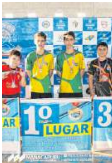
A 3ª etapa do campeonato amazonense ocorreu na cidade