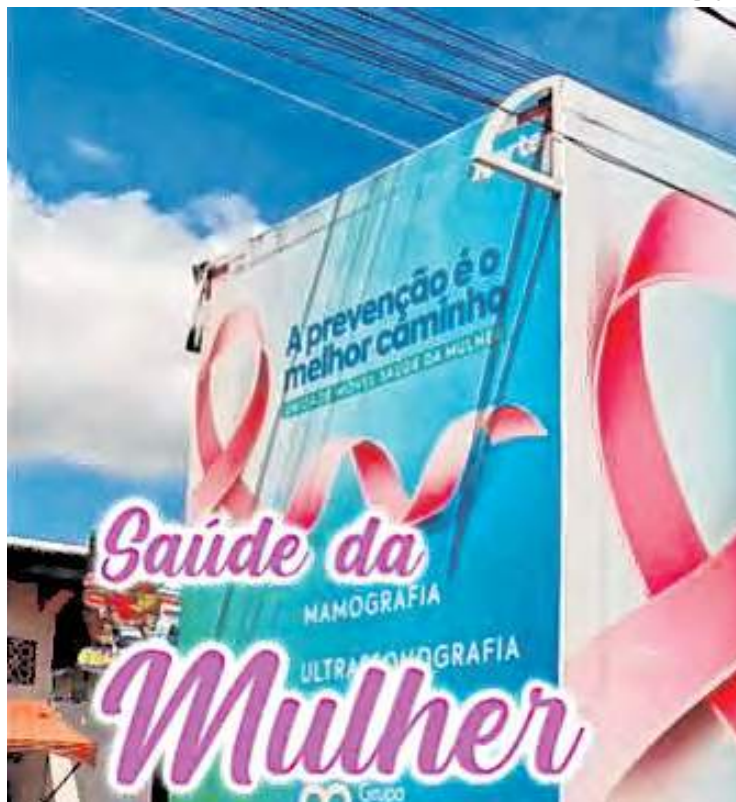
A carreta oferece exame de mamografia, teste rápido e preventivo.

A carreta já atendeu o Ariaú, nos dias 26 e 27, e Acajatuba no dia 28 de outubro. A programação atenderá os moradores do Largo do Limão, dia 3 de novembro. No dia 4, a carreta estará no quilômetro 26; no Serra Baixa, no dia 9 e 10; no