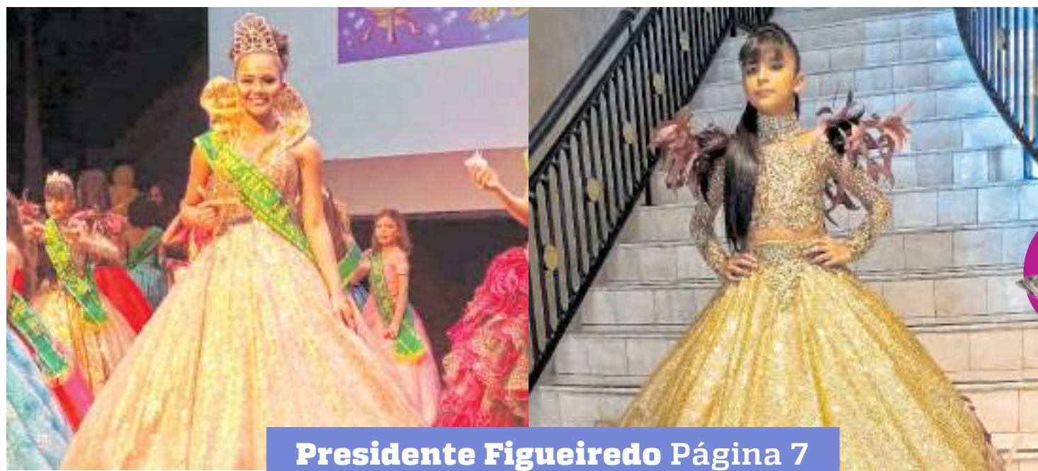
Presidente Figueiredo Página 7

Carreta da Mulher atende comunitários em Iranduba