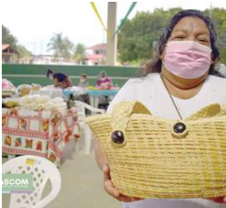
Prefeitura dá o pontapé para as ações de cultura e economia

O público que foi em busca de produtos regionais teve uma tarde de diversão com atrações culturais. Entre os espetáculos, a Entrecorpus Companhia de Danças da Universidade do Estado do Amazonas (UEA), que, além da apresentação, realizou uma oficina durante o dia. As agremiações Jaú e Anavilhanas também marcaram presenças.