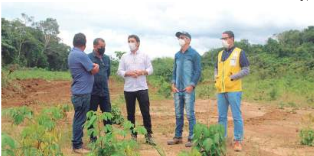
Ações de pavimentação na pista de pousos e decolagens avançam no aeroporto de Itacoatiara

As intervenções no Aeroporto de Itacoatiara foram iniciadas em dezembro de 2021, com os trabalhos de limpeza, cercamento ope-