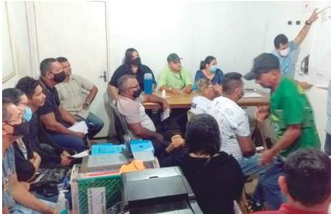
Reunião contou com 62% dos representantes de bairros de várias zonas de Itacoatiara

Sobre os entulhos resultantes de demolições, a secretaria de Infraestrutura comunicou que utiliza esse material em obras de aterramento. Portanto, pede para que não sejam