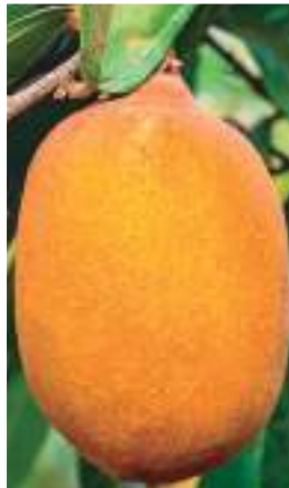
A última edição da Festa do Cupuaçu foi em 2020

Em Presidente Figueiredo, o cupuaçu tornou-se um dos principais produtos