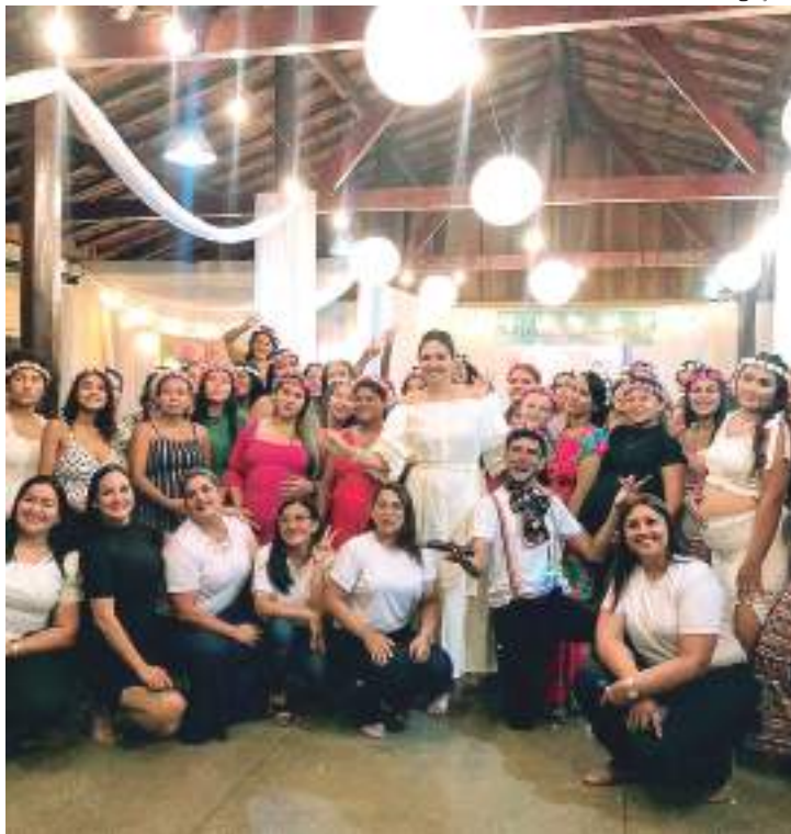
O evento foi promovido pela Secretaria Municipal de Assistência Social

O evento promovido pela Secretaria Municipal de Assistência Social de Itacoatiara (Semas) para 96 gestantes ocorreu no auditório da APAE e teve por objetivo acolher, acompanhar e orientar as futuras mães e os bebês após o nascimento, até o terceiro ano de vida.