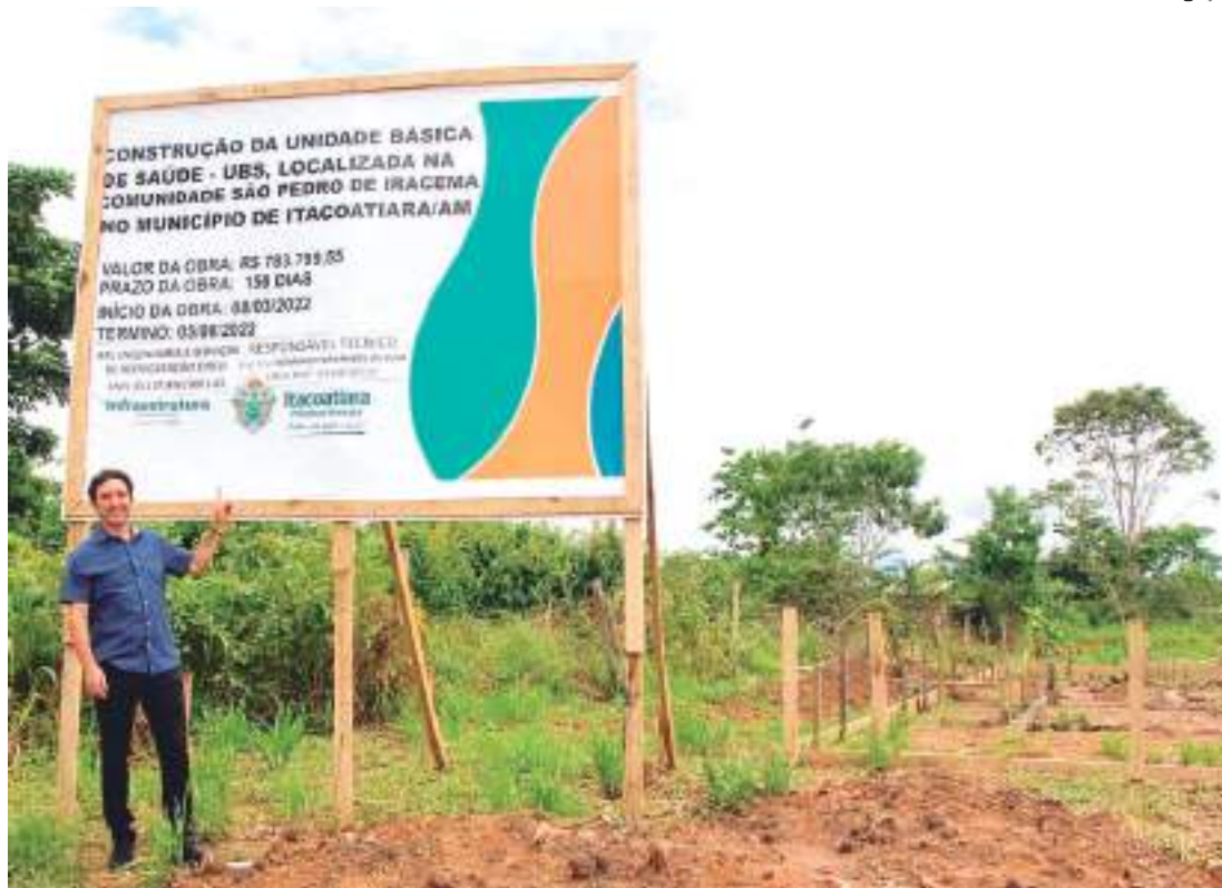
Unidade de Saúde está sendo construída na comunidade São Pedro do Iracema e deve atender 629 famílias

Um morador ribeirinho, que preferiu não se identificar, disse que no início duvidou dessa possibilidade, “quando ouvi falar de que o prefeito Mário ia construir uma UBS na comunidade São Pedro do Iracema, eu disse para os outros que isso era promessa de político, apenas para ganhar eleição. Nós já tínhamos sofrido muito com promessas. Mas, ago-