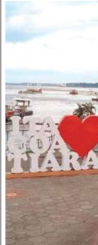
O Rio Amazonas subiu 37 centímetros, na última semana