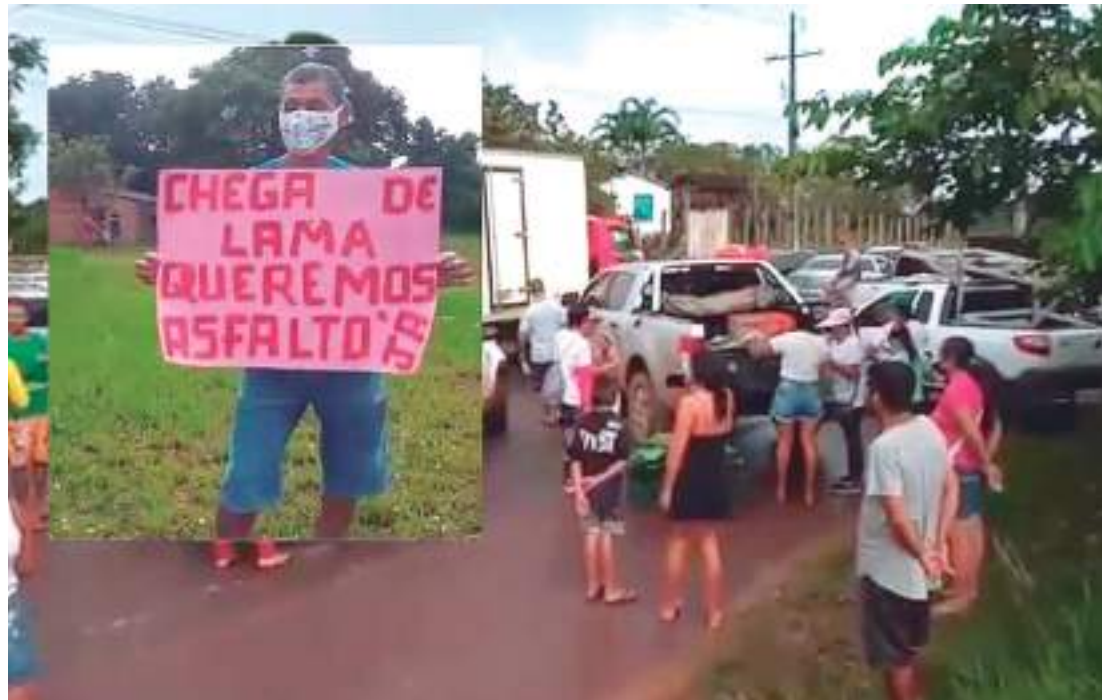
A manifestação reuniu moradores, na sua maioria, agricultores que não conseguem escoar a produção

O presidente da Associação Rural da Comunidade São Francisco, falou