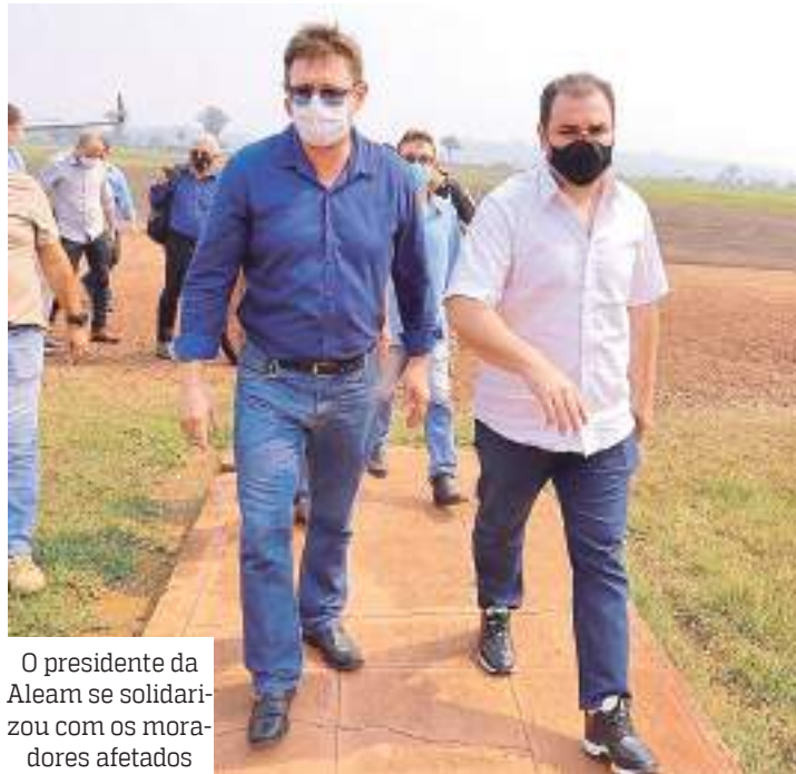
O presidente da Aleam se solidarizou com os moradores afetados