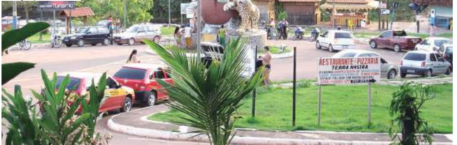
A Festa do Cupuaçu 2022 e a Feira do Empreendedorismo serão realizadas em agosto

econômicos e símbolo da cidade, ganhando monumento e uma festa em sua homenagem. O monumento fica localizado na entrada de cidade: um indígena da etnia waimiri-atroari, o povo que habita a região, dá as boas-vindas aos visitantes enquanto empunha um arco e uma flecha ao emergir de dentro de um cupuaçu ao lado de uma cobra e de uma onça pintada, representando alguns símbolos da região.