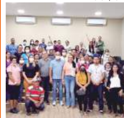
NOVO AIRÃO PÁGINA 12