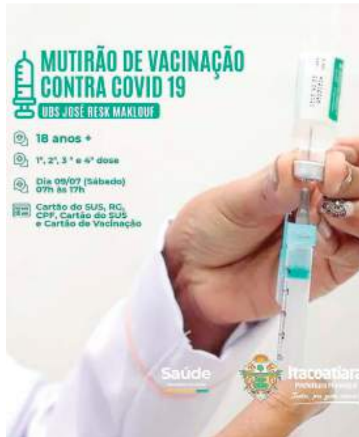
Nesse final de semana ocorrerá o mutirão de vacinação contra Covid

O prefeito Mário Abraham, através da Secretaria Municipal de Saúde (SEMSA), tem orientado a população para que continuem com as medidas de prevenção, e que os itacoatiarenses busquem a unidade de saúde mais próxima da sua casa e atualize as suas doses de vacinas e enfatiza que Itacoatiara continua vigilante contra a covid-19.