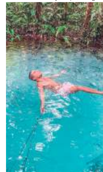
Vyni conheceu as belezas naturais da "Terra das cachoeiras"