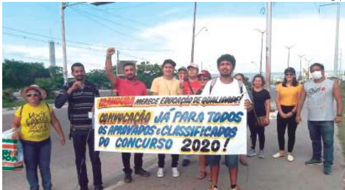
A classe de trabalhadores reivindica, desde 2021, a convocação de todos os aprovados em concurso público