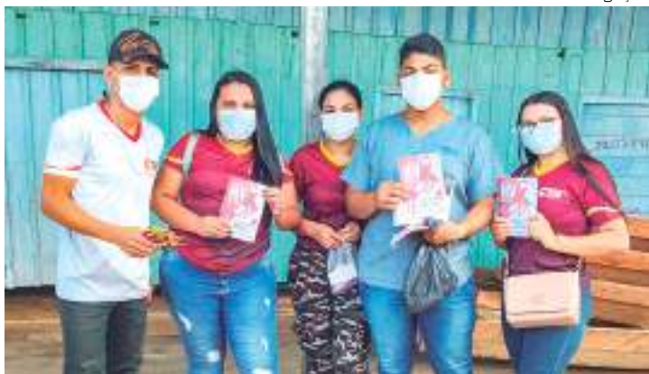
Campanha contra as Hepatites Virais já está alertando moradores

A prefeitura de Manacapuru, por meio da Secretaria Municipal de Manacapuru (Semsa), com o trabalho da equipe do Centro de Testagem e Aconselhamento (CTA), iniciou, nessa semana, ações de conscientização do "Julho Amarelo", chamando atenção para os perigos das hepatites virais, assim como das infecções sexualmente transmissíveis (ISTs).