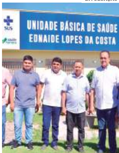
RIO PRETO DA EVA PÁGINA 10