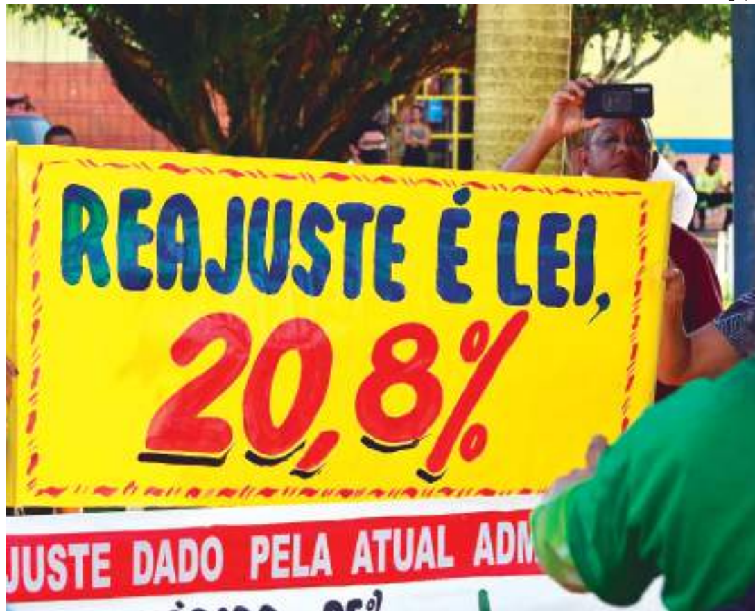
Educadores prestaram esclarecimentos à população sobre a greve deflagrada no dia 20 de junho

Não é a primeira vez que os profissionais da educação se sentem prejudicados pela gestão do município de Presidente