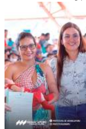
Na ação também realizou mais de 700 títulos definitivos