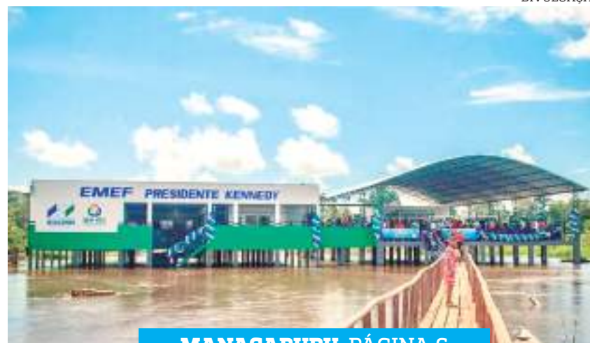
MANACAPURU PÁGINA 6