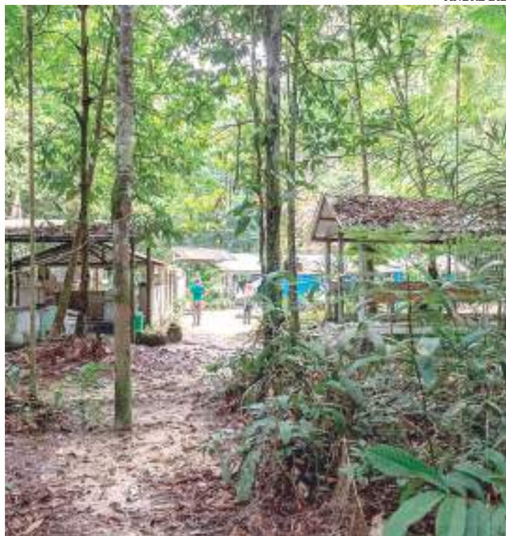
Projeto Dinâmica Biológica estuda a diversidade florestal da Amazônia

No acampamento Km 41, localizado entre os municípios de Rio Preto da Eva, Manaus e Iranduba, por cerca de 40 anos, foi o espaço preferido do ambientalista, biólogo, escritor e explorador da National Geographic Thomas Lovejoy, considerado o “padrinho” da biodiversidade, que foi morto no fim de 2021.