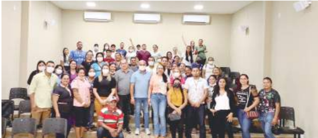
Novo Airão avançou do 52º posto para o 38º no ranking da saúde no Amazonas