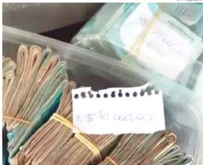
Agentes apreenderam R$ 302.565 em espécie, além de US$ 2.369 e € 500

Dois mandados de busca e apreensão também