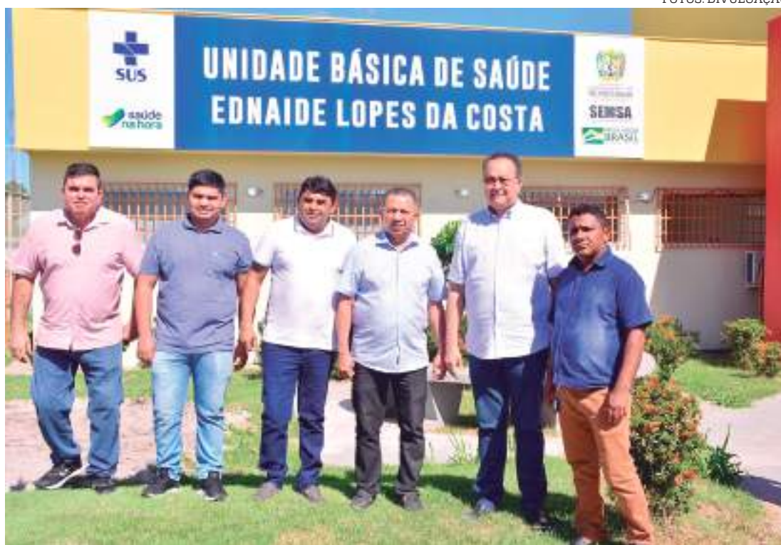
Prefeitura de Rio Preto fez uma série de entregas importantes nos setores de saúde e assistência social

“Nós ficamos esses 6 meses atendendo na UBS Canaã, e agora vamos poder voltar a realizar os atendimentos aqui na nossa