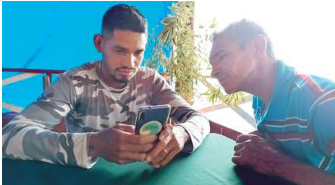
Aplicativo cria um banco de dados colaborativo que acompanha informações sobre a Bacia do Rio Negro

Para este trabalho, é utilizado o aplicativo móvel gratuito Ictio, um banco de dados sobre peixes migratórios na Amazônia cons-