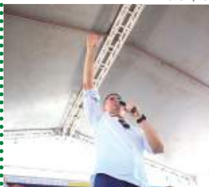
MANAUS PÁGINA 2