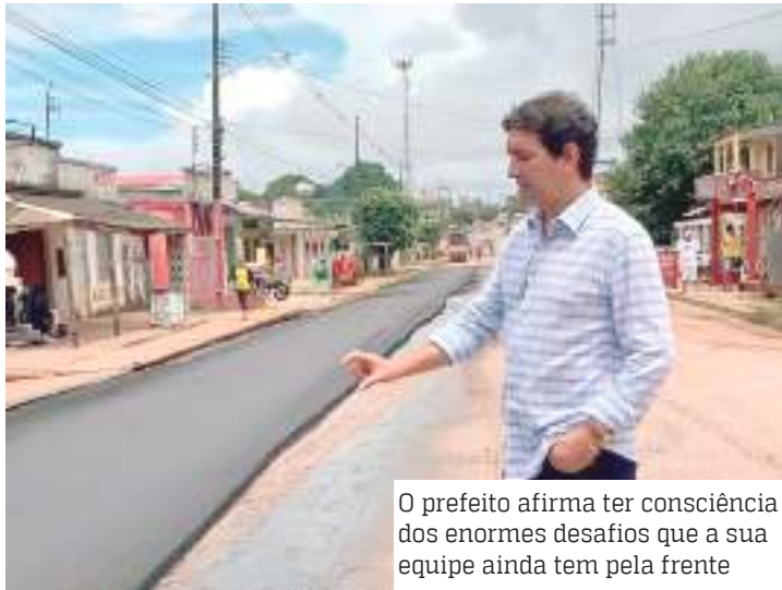
O prefeito afirma ter consciência dos enormes desafios que a sua equipe ainda tem pela frente

O prefeito Mário Abraham completa, neste mês de julho, 1 ano e 7 meses de mandato com vários avanços resultantes do planejamento estratégico, tático e operacional desenvolvido pelos assessores, técnicos e secretários das pastas da administração. Ele e completa: “até aqui chegamos com a ajuda de Deus e muito trabalho, diuturnamente, desde o primeiro dia de nossa gestão.”