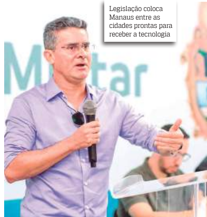
Legislação coloca Manaus entre as cidades prontas para receber a tecnologia

As solicitações de instalação de ERBs fora das zonas urbanas e das zonas de transição estão isentas de pagamento de licenciamento, sendo