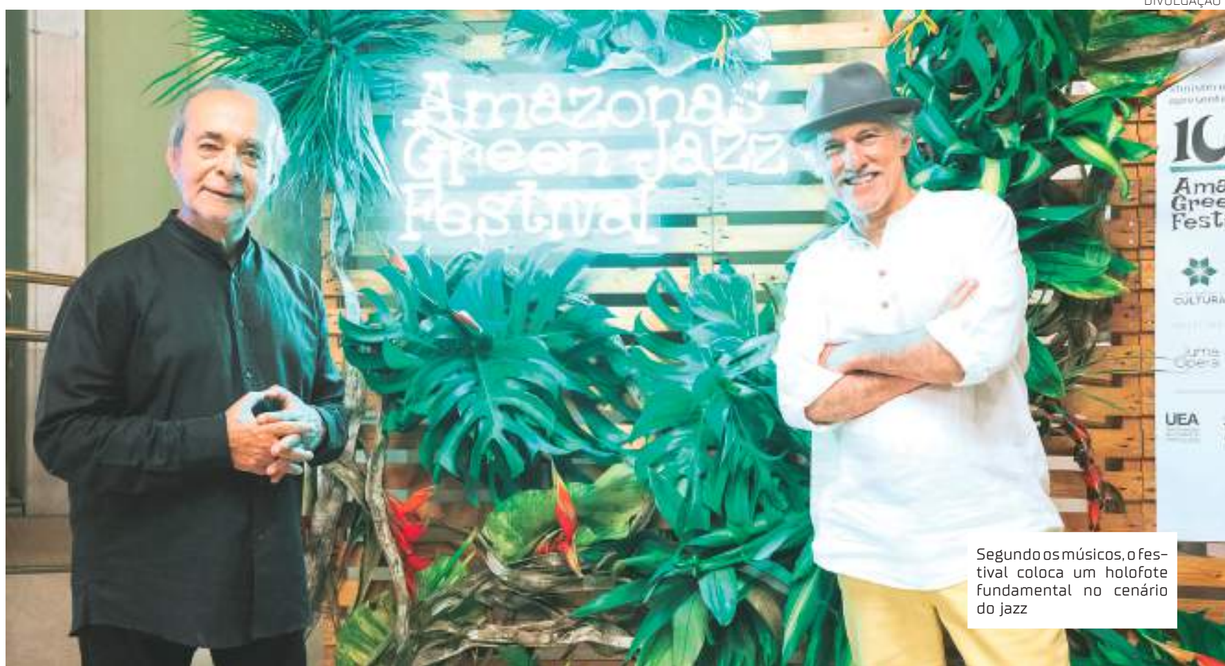
Segundo os músicos, o festival coloca um holofote fundamental no cenário do jazz

O show foi criado especialmente para a divulgação do último álbum do duo, "Cinema a Dois"