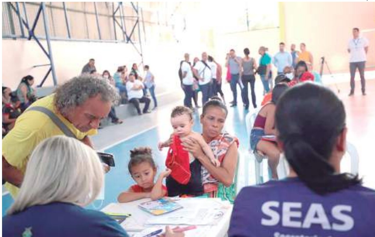
As famílias que vivem na comunidade da Sharp enfrentam dificuldades com alagação e aguardavam pela obra

"Nosso projeto já está aprovado e os trâmites (para liberação dos recursos) estão correndo por Brasília. E eu estou adiantando recursos próprios. Hoje, estamos iniciando esse processo de instrução para retirada das primeiras famílias. Isso leva cerca de 30 dias e, assim que ele estiver concluso, em setembro, iniciaremos o processo de demolição".