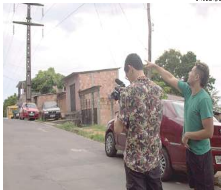
As aulas serão realizadas no Casarão de Ideias, Centro de Manaus

Atuou em 6 espetáculos de teatro, apresentando-se em Manaus, Belo Horizonte e Rio de Janeiro. Escreveu críticas de filmes no site Cine Set de 2013 a 2020.