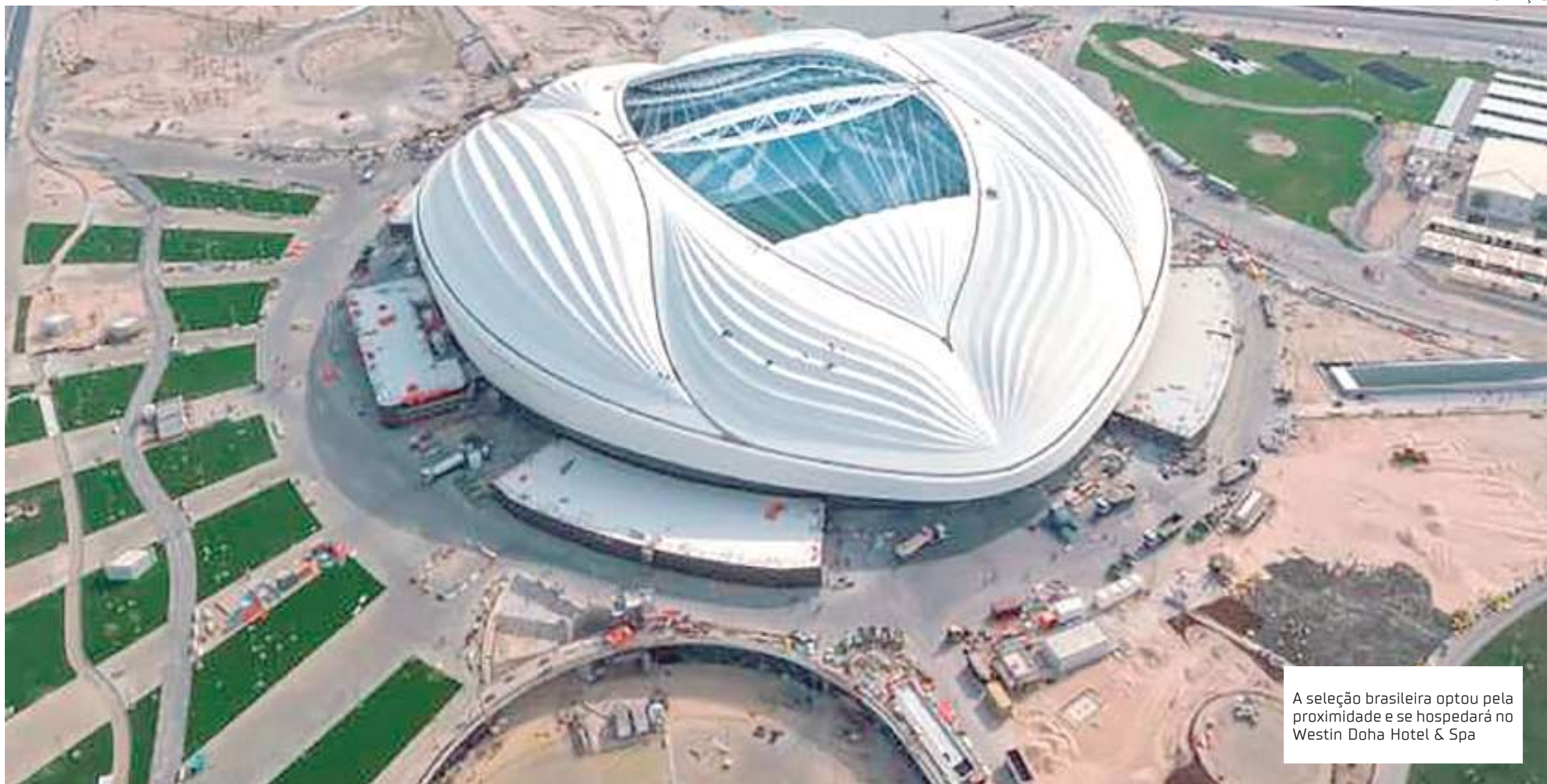
A seleção brasileira optou pela proximidade e se hospedará no Westin Doha Hotel & Spa

A Copa do Mundo do Catar será a "mais compacta" desde a edição inaugural, em 1930