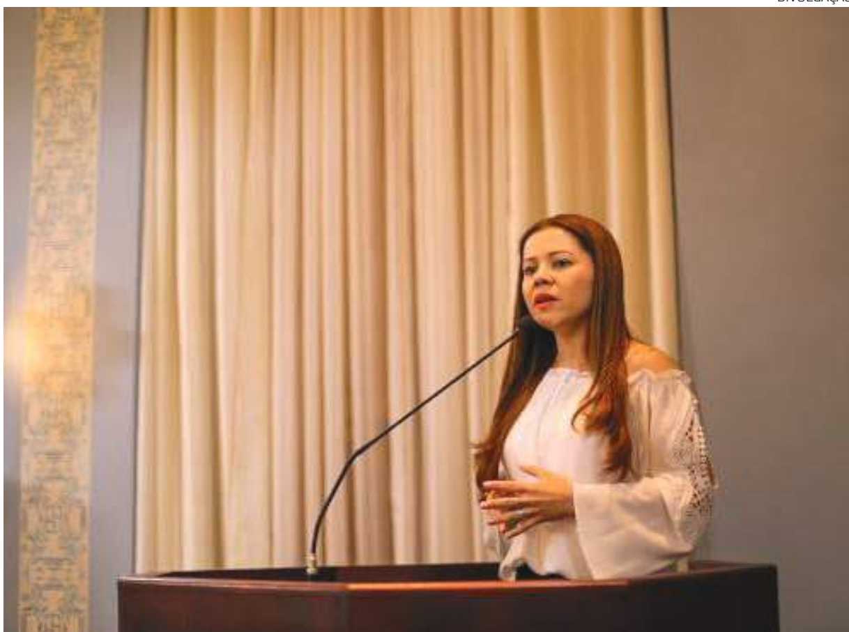
A cerimônia de posse na Alaca acontecerá no dia 3 de agosto

A cadeira de número 71, da Academia de Literatura, Arte e Cultura da Amazônia (Alaca), em breve,