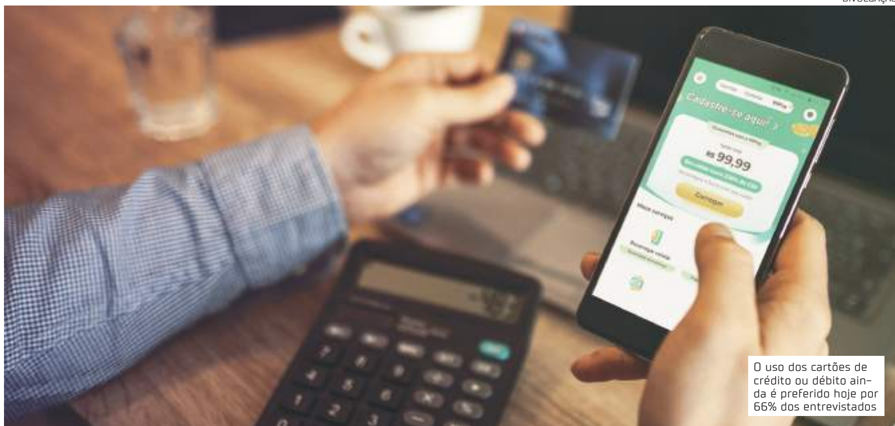
O uso dos cartões de crédito ou débito ainda é preferido hoje por 66% dos entrevistados

A pesquisa ainda mostra cenários que podem ser estudados para um melhor desenvolvimento da ferramenta. A possibilidade