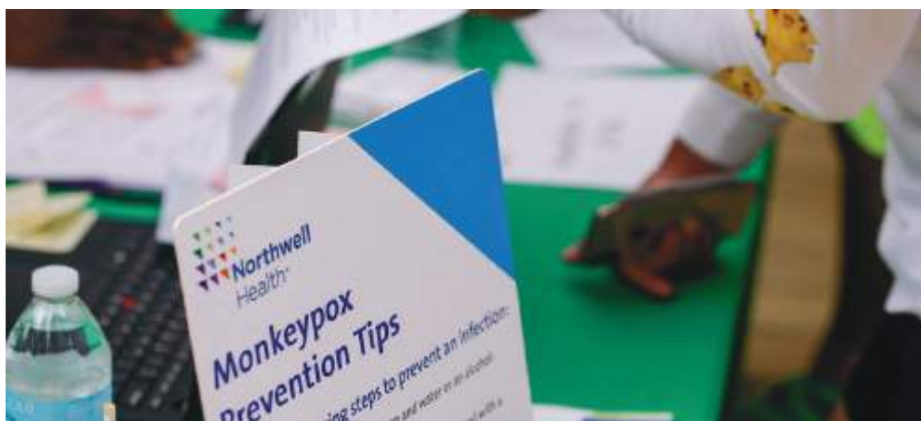
"Nós achamos que teremos vacinas este ano", disse Espinal.

No fim da semana passada, a Organização Mundial da Saúde (OMS) declarou o surto de varíola dos macacos uma emergência de saúde global, nível mais alto de