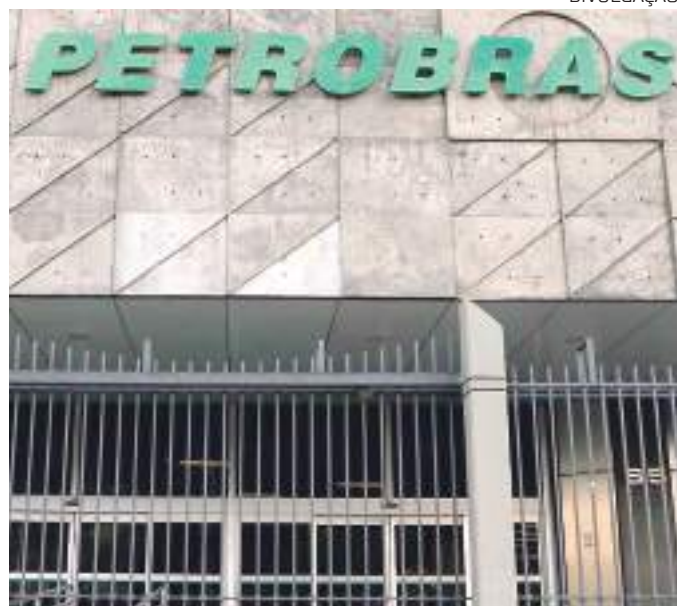
Conselho Fiscal participa da supervisão de preços

A diretriz, no entanto, não vai alterar a política de equilíbrio de preços da empresa com os mercados nacionais e internacionais.