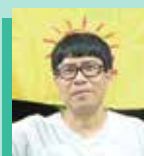
Dr. Israel Tuyuka Psol

Nesta quinta-feira (18), a candidata estará em agenda com lideranças, durante todo o dia de hoje.