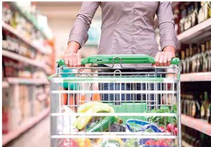
Maioria dos consumidores apontam o desemprego para inadimplência