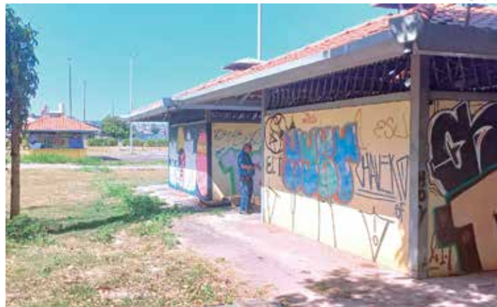
Homem foi degolado na praça do Mestre Chico, na Zona Sul