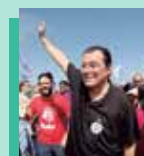
Eduardo Braga MDB

19h - Reunião com lideranças na Zona Norte