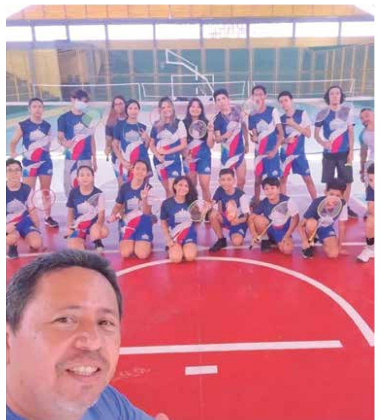
Professor é responsável pelo projeto "Manaus Esportiva"