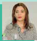
Nair Bair Agir

Até o fechamento desta edição, a assessoria não enviou a agenda do candidato.