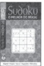
COQUETEL SUDOKU. O MELHOR DO BRASIL