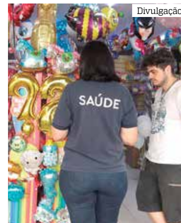
404 mil trabalhadores no comércio perderam emprego em 2020

mais baixo em dez anos (de 9,5% para 8,5%). Dentro desse segmento, o principal componente, em termos de variação positiva, foi o comércio de peças para veículos que, em 2020, representou 63,2% das pessoas ocupadas, com ampliação da participação em 6,8 pontos percentuais. Por outro lado, tanto o comércio de veículos automotores, que representou 27,5% desse segmento, como o comércio de motocicletas, (participação de 9,3%) tiveram quedas.