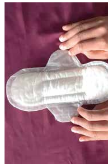
Primeiro país do mundo a declarar acesso gratuito ao produto

Na América Latina, o maior passo que já foi dado neste sentido ocorreu na Colômbia, que zerou o imposto de consumo sobre os absorventes internos e externos.