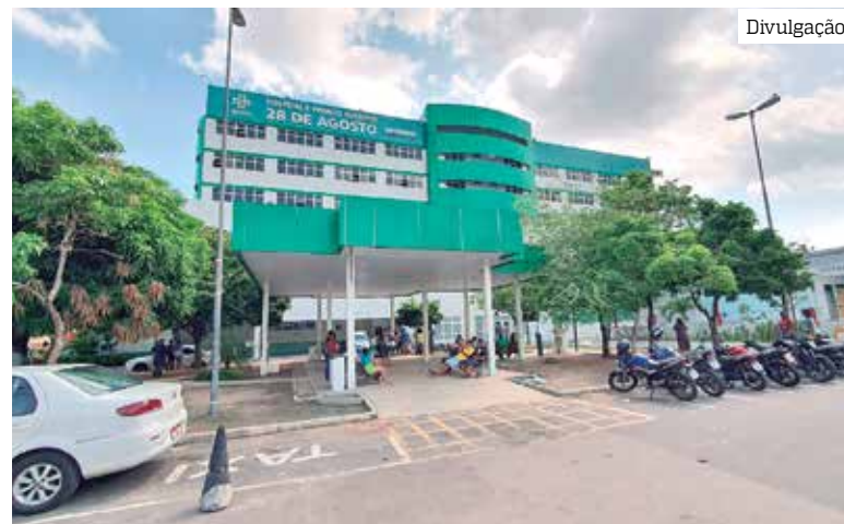
Vítimas de ataque em loteria estão no Centro de Tratamento de Queimados

Ele ainda foi espancado pela população. O Corpo de Bombeiros foi chamado para conter as chamadas no local.