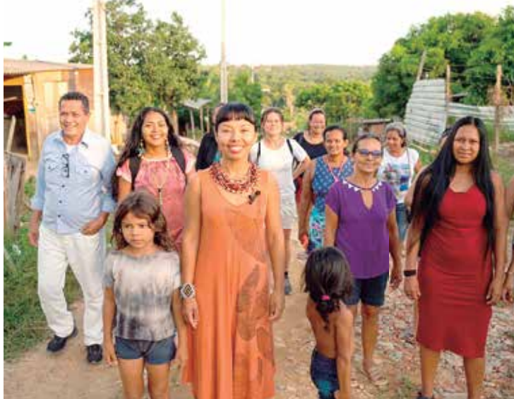
Candidata indígena fez visita ao Parque das Tribos, na Zona Oeste

“Vamos fazer história juntos. Esse momento é histórico para os povos indígenas e também para os não indígenas do Estado do Amazonas. Aqui escolho começar nossa luta rumo ao congresso em busca de políticas públicas robustas