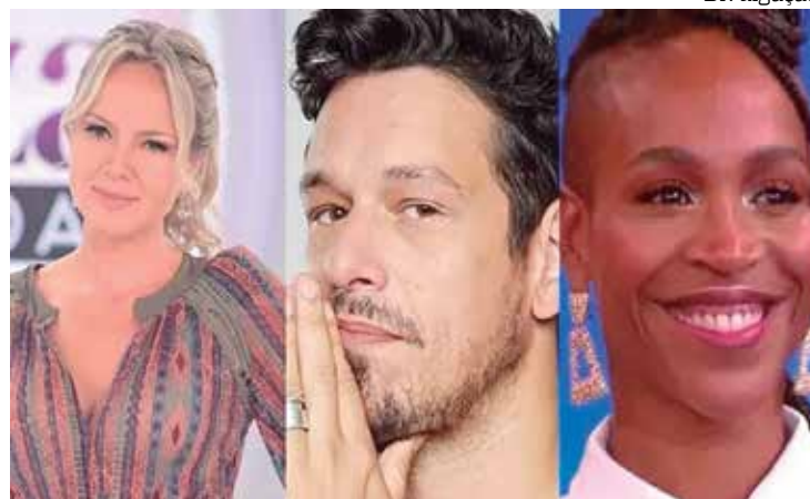
Masturbação tem sido assunto cada vez mais recorrente entre os famosos

A atriz se espantou com a pergunta, mas respondeu de forma natural, ad-